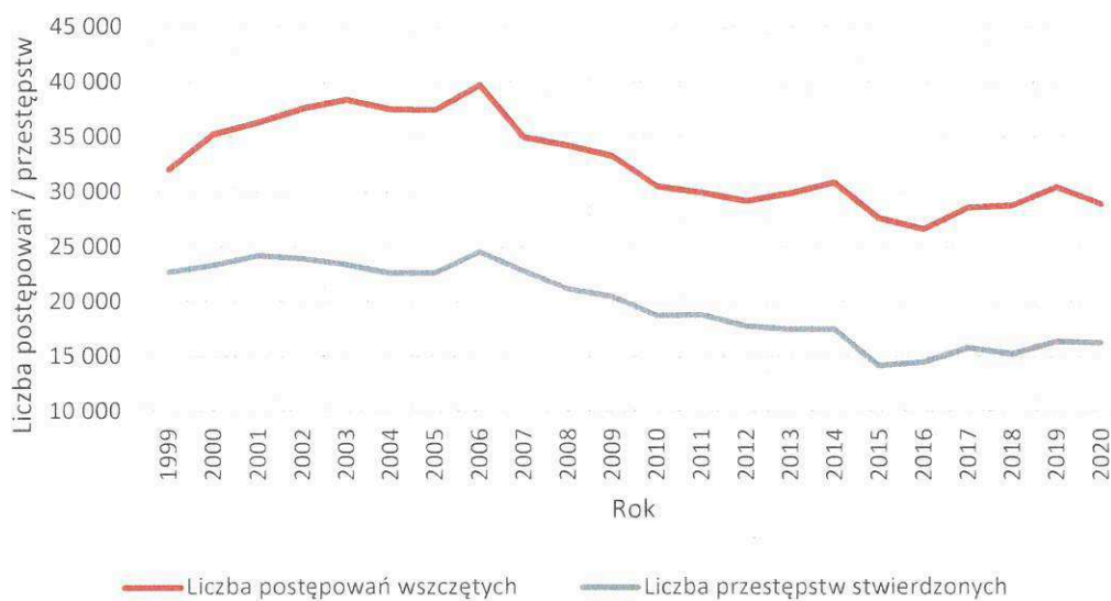
Wykres nr 2 – Liczba wszczętych postępowań i stwierdzonych przestępstw przeciwko rodzinie i opiece na terenie Polski w latach 1999-2020

Źródło: opracowanie własne na podstawie Statystyk Policji, strona internetowa: