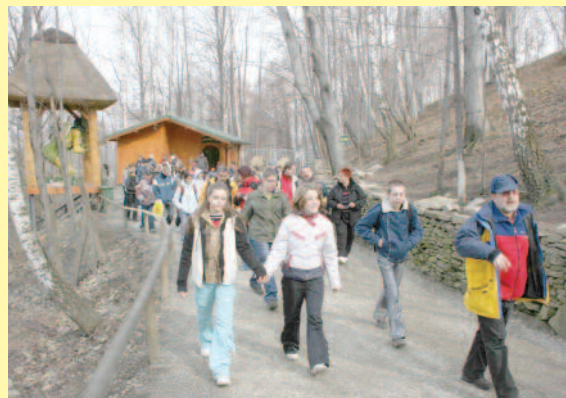
Polacy i Czesi m.in. wspólnie brali udział w wycieczkach...

wami języka polskiego, a także doskonalenie języka angielskiego. Cenne było także poszerzenie osobistych doświadczeń uczniów poprzez wyjazdy za granicę własnego kraju i nawiązanie przyjaźni z rówieśnikami o podobnych potrzebach edukacyjnych.