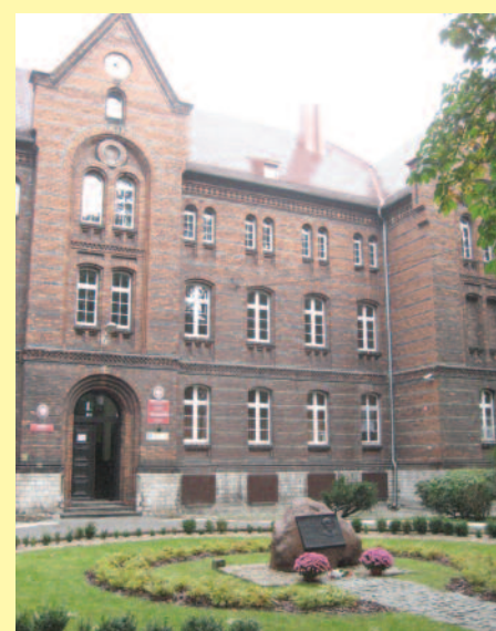
Zespół Szkół im. M. Konopnickiej w Pyskowicach – jedna z powiatowych placówek oświatowych, której nauczyciele i pracownicy mogą podnosić swe kwalifikacje w ramach tego projektu.