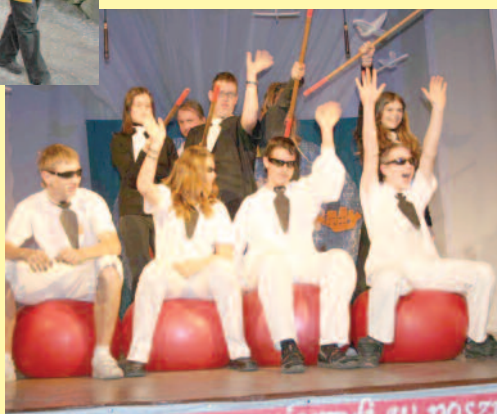
...a także zrealizowali przedstawienie, zaprezentowane na scenie MOKiS-u w Pyskowicach.

Celem projektu było zaznajomienie uczniów z Zespołu Szkół Specjalnych w Pyskowicach z podstawami języka czeskiego i uczniów czeskich z podsta-