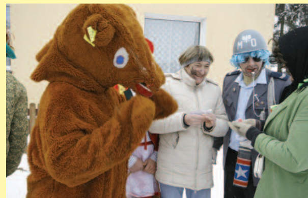
Wodzenie niedźwiedzia to jeden z ciekawych zwyczajów ludowych, kultywowanych do dziś na terenie powiatu.