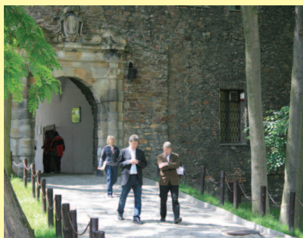
Uczestnicy KonferTuru poznali uroki m.in. zamku w Toszku.

w ramach Priorytetu III Turystyka, Działanie 3.4. Promocja turystyki Regionalnego Programu Operacyjnego Województwa Śląskiego na lata 2007 – 2013 Okres realizacji projektu: czerwiec 2009 – wrzesień 2009 Wartość projektu: 66 284,22 zł (w tym wartość dofinansowania: 55 714,71 zł)