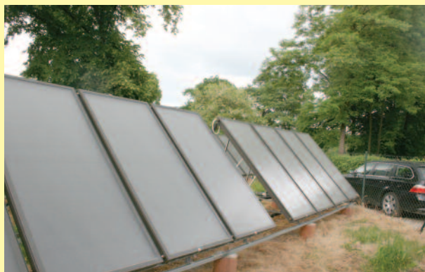
Solary w Zameczku...

w ramach Priorytetu V Środowisko, Działania 5.3 Czyste powietrze i odnawialne źródła energii Regionalnego Programu Operacyjnego Województwa Śląskiego na lata 2007 – 2013