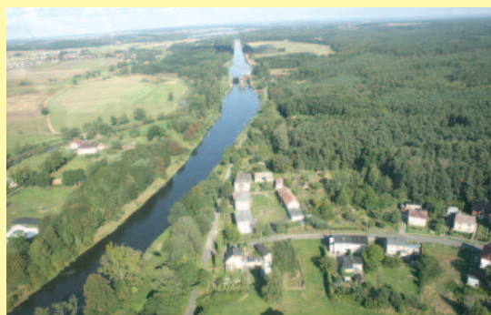
Widok z lotu ptaka jak z bajki – wśród lasów i pól płyną niespiesznie wody Kanału Gliwickiego, w oddali jedno z naszych jezior.

gliwickiego. Cel bezpośredni to podniesienie wiedzy potencjalnych turystów, w tym mieszkańców zachodniej części subregionu centralnego i wschodniej części województwa opolskiego oraz mieszkańców powiatu gliwickiego, na temat walorów turystycznych powiatu oraz wzrost rozpoznawalności powiatu jako zaplecza aktywnej turystyki weekendowej dla mieszkańców powiatów ościennych, ze szczególnym uwzględnieniem subregionu centralnego województwa śląskiego. W projekcie uczestniczy ok. 2 tys. osób.