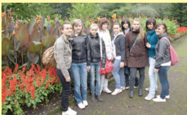
Uczennice z pyskowskiej „Konopnickiej” podczas wycieczki do Tarnowskich Gór.

W projekcie bierze udział ok. 700 uczniów z następujących szkół – Zespół Szkół im. I. J. Paderewskiego w Knurowie, Zespół Szkół Zawodowych nr 2 w Knurowie, Zespół Szkół im. M. Konopnickiej w Pyskowicach, Zespół Szkół Specjalnych w Knurowie, Zespół Szkół Specjalnych w Pyskowicach.