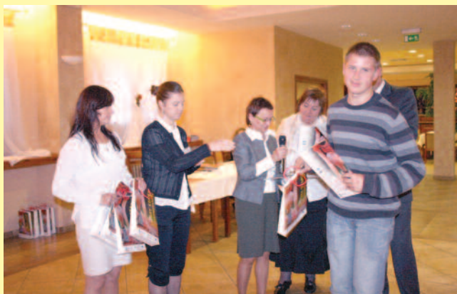
Uczestnicy pierwszej edycji projektu „Dobry start w samodzielność” podczas jego inauguracji w 2008 r.

w ramach Priorytetu VII Promocja integracji społecznej, Działania 7.1 Rozwój i upowszechnianie aktywnej integracji, Poddziałania 7.1.2 Rozwój i upowszechnianie aktywnej integracji przez powiatowe centra pomocy rodzinie Programu Operacyjnego Kapitał Ludzki