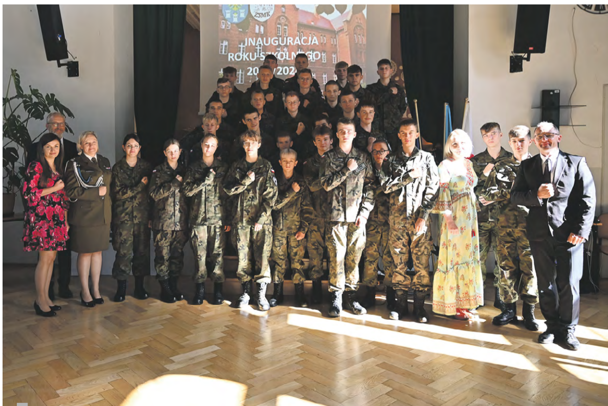
Klasa Oddziału Przygotowania Wojskowego podczas rozpoczęcia roku szkolnego 2023/2024.