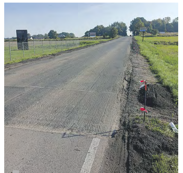
Frezowanie nawierzchni drogi wojewódzkiej 901

Również na terenie gminy Sośnicowice znacznej poprawie ma ulec stan techniczny nawierzchni drogi wojewódzkiej nr 408. W chwili obecnej trwają prace związane z naprawą nawierzchni na odcinku DW 408 pomiędzy Sierakowicami a Rachowicami (przed skrzyżowaniem od zakładu ceramiki budowlanej w miejscowości Sierakowice do początku przebudowanego odcinka (rejonu skrzyżowania z drogą powiatową). Zakończenie remontu planowane jest na koniec października 2023 roku.