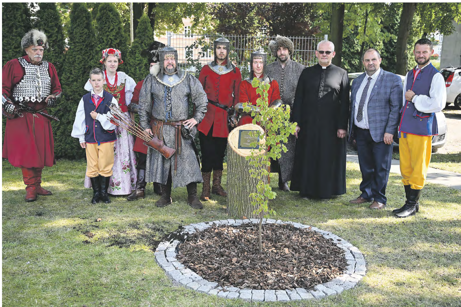
Uroczystość sadzenia lipy Sobieskiego.