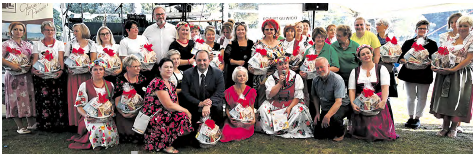
Przedstawicielki Kół Gospodyń Wiejskich podczas Przejędu w Niewiesz.

W to piękne niedzielne popołudnie w przejeździe udział wzięły także przedstawiciele z zaprzyjaźnionych powiatów partnerskich – Calw, Mittelsachsen oraz Pucka, którzy prezentowali na swoich stoiskach walory swoich obszarów i serwowali: sękacza, przepyszne