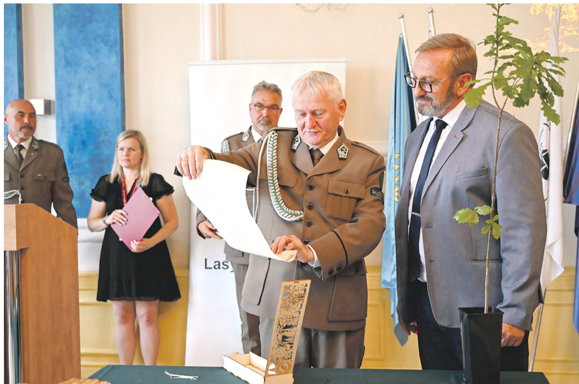
Dyrektor Generalny Lasów Państwowych Józef Kubica wręcza staroście gliwickiemu sadzonkę dębu papieskiego.

zimierz Gwiżdż, starosta gliwicki. Umocnieniem wzorowej współpracy było przekazanie przez Dyrektora Generalnego Lasów Państwowych Józefa Kubicę na ręce