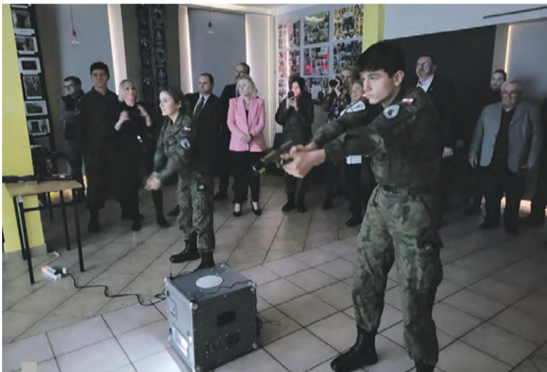
Celnie strzelać powinien umieć każdy.

Tekst i zdjęcia: Magdalena Fiszer-Rębisz