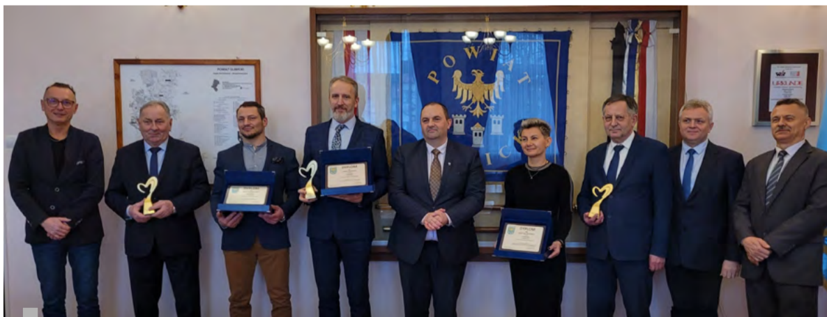
Nagrodzeni – przyjaźni środowisku.

W czwartek, 23 lutego br., w Starostwie Powiatowym w Gliwicach odbyło się podsumowanie konkursu oraz uroczyste wręczenie nagród dla laureatów konkursowych zmagania „Powiat Przyjazny Środowisku 2022” – corocznego przedsięwzięcia, w którym to Powiat Gliwicki udziela gminom wsparcia finansowego na realizację zadań z zakresu ochrony środowiska.