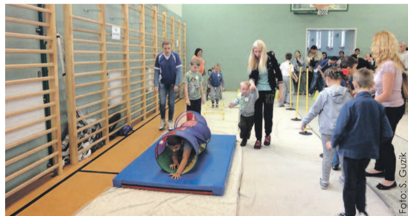
Przygotowane zabawy sprawiły uczestnikom pikniku wiele radości.

Po raz dwunasty już Zespół Szkół Specjalnych w Knurowie zorganizował Integracyjny Piknik Rekreacyjno-Sportowy.