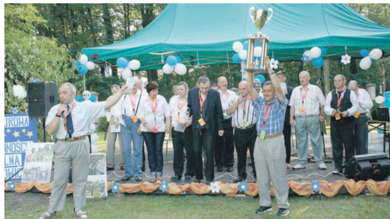
Mieszkańcy z dumą prezentują puchar za zajęcie I miejsca w rozgrywkach Międzynarodowej Ligi Piłki Nożnej Osób Niepełnosprawnych Seni Cup. Takich sukcesów mają na swym koncie więcej.