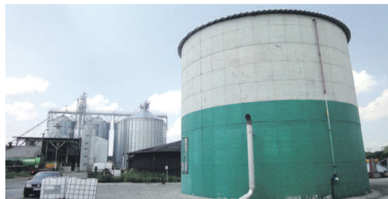
Biogazownia w Łanach Wielkich.

się krowę, jak karmić zwierzęta, jak przebiega proces produkcji w bioga-