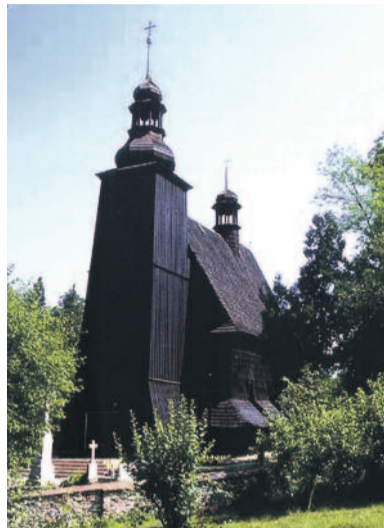
Kościół Wszystkich Świętych w Sierotach.

Warte zobaczenia są zabytkowe kościołki: Wszystkich Świętych w Sierotach, pw. św. Wawrzyńca w Zacharowicach.