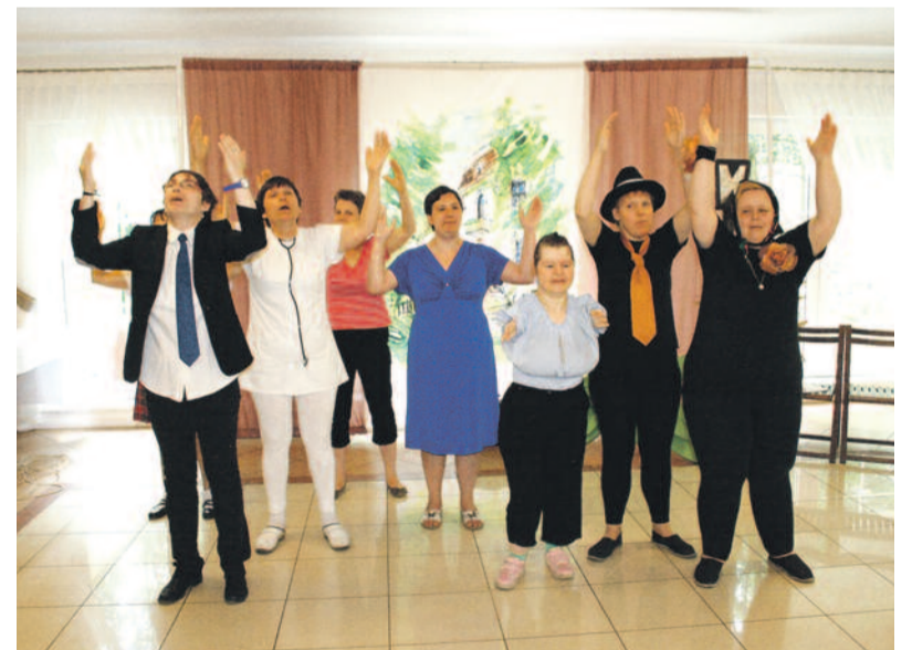
Mieszkanek „Ostoi” zaprezentowały wzruszające przedstawienie. Kończyła je piosenka z pozostającym na długo w pamięci refrenem: „Bóg się mamie nie pomylił, narodziłem się z miłości...”

Festyn był Dniem Otwartym Comeniusa – w ramach tego programu „Ostoja” realizuje obecnie projekt „Wsparcie kształcenia uczniów o specjalnych po-