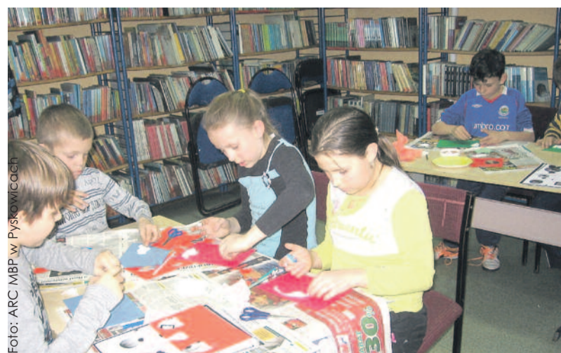
Dzieci chętnie biorą udział w zajęciach, organizowanych w pyskowińskiej bibliotece.