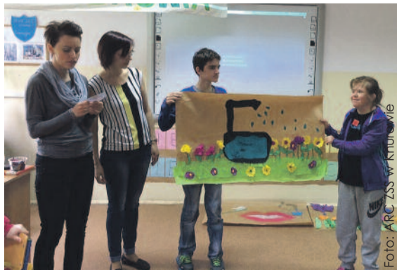
Uczniowie z zainteresowaniem brali udział w ciekawych zajęciach poświęconych ochronie środowiska naturalnego.

Dzieci i młodzież rywalizowali o tytuł złotej Eko-drużyny. Konkurencje sprawdzały wiedzę z ochrony środowiska, znajomość zasad gospodarowania odpadami, oszczędzania wody i energii elektrycznej. Uczniowie obejrżeli film „Ochrona środowiska i zanieczyszczenia”, pokazujący,