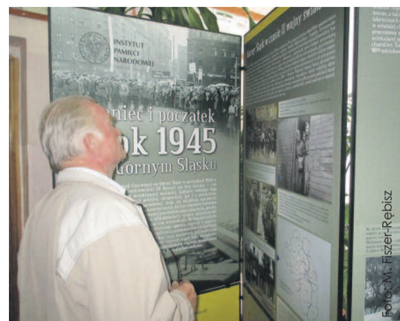
Wystawa przypominała o tragedii Górnos Ślązaków wywiezionych w głąb Związku Radzieckiego.

- Około 50 tys. osób deportowano z Górnego Śląska w głąb ZSSR w 1945 r. Był to ogromny dramat tych ludzi, ich rodzin, ale również całego regionu. Wywiezionych dotknęły choroby, wycieńczająca praca, kiepskie wyżywienie, musieli zmagać się z ostrym klimatem. To wszystko wykańczało ich organizmy, a wielu z nich przyniosło śmierć. Nieliczni wracali do Polski aż do 1957 r. Trzeba jednak pamiętać, że osobiste tragedie przeżywali także ci, którzy pozostali. Rodziny pozbawione ojców i mężów, jedynych