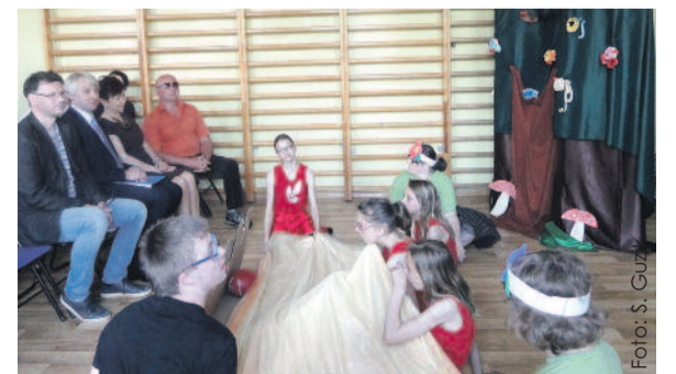
Przedstawienie przygotowane przez dzieci zebrało mnóstwo braw.