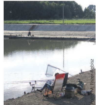
Łowisko Kormoran na styku gmin Pyskowiec i Toszek.