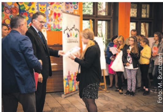
Laureaci konkursu odebrali nagrody podczas wernisazu wystawy ich prac w pyskowskim MOKiS-ie.