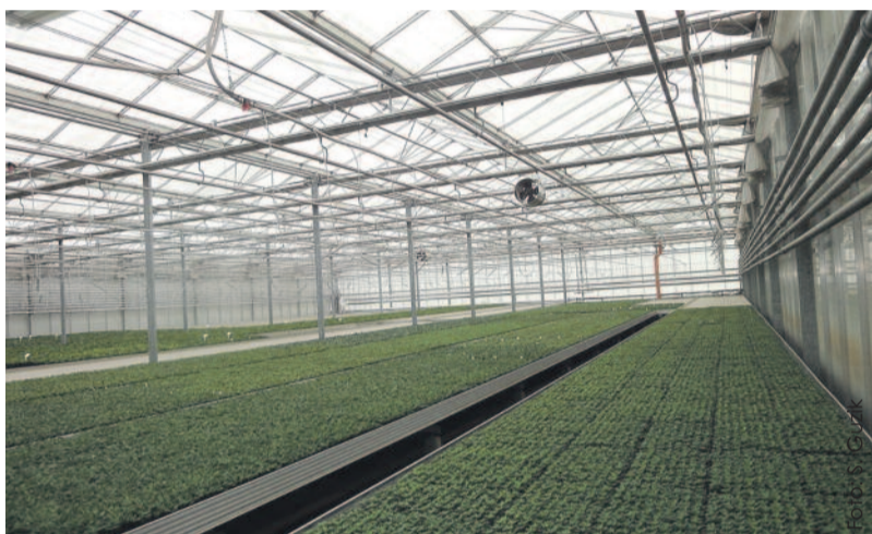
Za najbezpieczniejsze w naszym regionie zostało uznane gospodarstwo rolno-ogrodnicze ze Świbia.