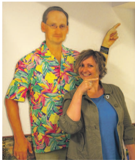
Można się nawet sfotografować z Wojciechem Cejrowskim – co prawda to tylko imitacja podróżnika, ale na zdjęciu wygląda, jak prawdziwy!