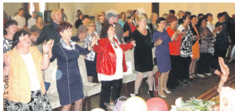
Podczas uroczystości nie zabrakło tortu, gromkiego sto lat i wspólnego śpiewu zebranych oraz występów zdolnych dzieci i młodzieży.