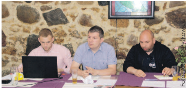
Prezes i wiceprezesa nowego klubu tuż po powołaniu władz FC Pyskowiec.

– Plany FC Pyskowiec to zbudowanie mocnego organizacyjnie klubu dla kibiców tęskniących za futsałem, który był przez tyle lat obecny w Hali Huberta Wagnera. Obecnie prowadzone są rozmowy z miastem, sponsorami oraz zawodnikami. Wszystko idzie w bardzo dobrym kierunku, już od sierpnia rozpoczną się treningi oraz przygotowania do sezonu – mówi prezes klubu.