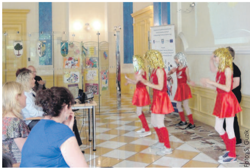
Uczniowie podczas podsumowania projektu zaprezentowali swoje umiejętności, między innymi – taneczne.