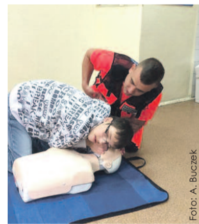
Uczniowie m.in. ćwiczyli na fantomie, jak robi się sztuczne oddychanie.

ratunkowego. Jednym z najciekawszych dla uczniów – a zarazem bardzo ważnym – punktem spotkania były praktyczne ćwiczenia na fantomie. Początkowo uczniowie przyglądali się czynnościom wykonywanym przez ratowników, a następnie pod czujnym okiem oraz według wskazówek ratowników próbowali wykonywać masaż serca oraz sztuczne oddychanie. Spotkanie dostarczyło uczniom wielu pozytywnych wrażeń. W skupieniu chłonili nowe wiadomości. Wszyscy już wiedzą, w jaki sposób postępować w przypadku, gdy ktoś potrzebuje pierwszej pomocy. (AB)