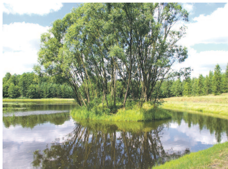
Stary staw Żabiok ostatnio odmłodził, lecz wciąż jest bardzo romantyczny.

Jest jednak coś, co każdy harcerz doskonale zna – leśny staw zwany Żabiokiem, bo zawsze mieszkało w nim niezmiernie dużo żab. W minionych latach odbywały się tutaj harcerskie „chrzty”, Neptun – król jeziora mianował maminsynków na prawdzi-