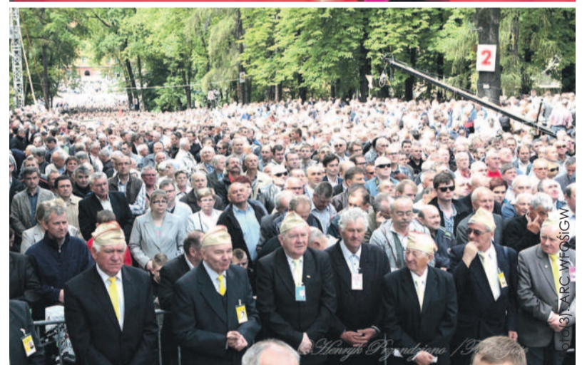
Pielgrzymka do Piekar Śląskich co roku gromadzi tłumy wiernych.

kańców, którzy między innymi poprzez spalanie paliw złej jakości i śmieci przyczyniają się do powstawania tzw. niskiej emisji – powiedział prezes WFOŚiGW w Katowicach.