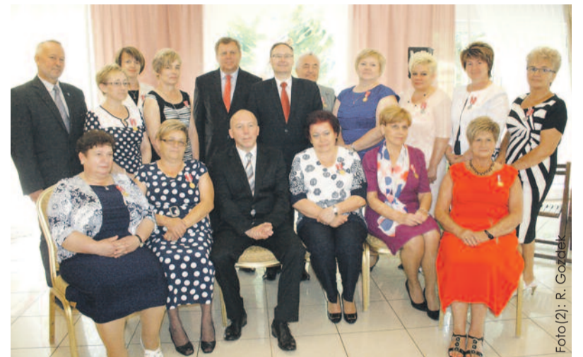
Grono zasłużonych pracowników DPS-u z dyrektorem „Ostoi” oraz przedstawicielami województwa i powiatu.

Natomiast 13 czerwca na dziedzińcu i w parku przy zabytkowej siedzibie „Ostoi” zorganizowany został festyn integracyjny „Zamkowe Złote Gody”. Wraz z podopiecznymi DPS-u bawili się na nim ich bliscy oraz mieszkańcy Sośnicowic i zaprzyjaźnionych domów pomocy społecznej, a także samorządowcy. Były dwa wielkie urodzinowe torty, liczne konkursy, loterie i licytacje prac mieszkanki „Ostoi”, a także bogaty program artystyczny i muzyczny, w wyko-