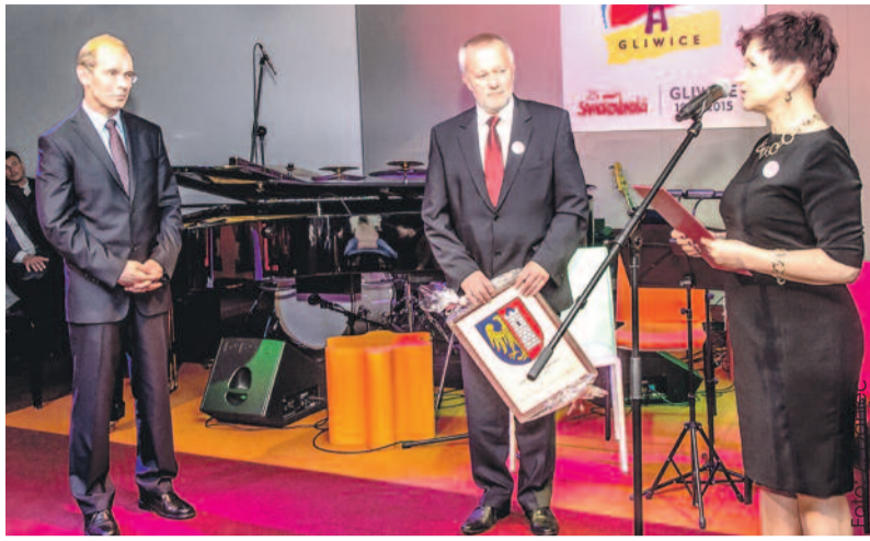
Reprezentanci powiatu złożyli gratulacje na ręce prezydenta Gliwic.