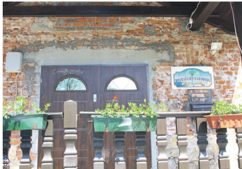
Przed Sklepem Kolonialnym w Łanach.

W 2011 roku w budynku „Starego Młyna” w Łanach (gmina Rudziniec) powstał Sklep Kolonialny Wojciecha Cejrowskiego. Sprzedawane są w nim – głównie internetowo – cuda z zamorskich krajów, polecane przez tego wybitnego i lubianego globtrottera.