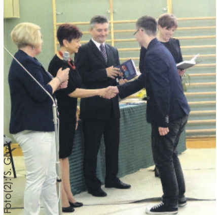
Miłym akcentem uroczystości było wręczenie nagród i dyplomów za szczególne osiągnięcia.

Podczas spotkania rozdane zostały świadectwa, nagrody i wyróżnienia dla