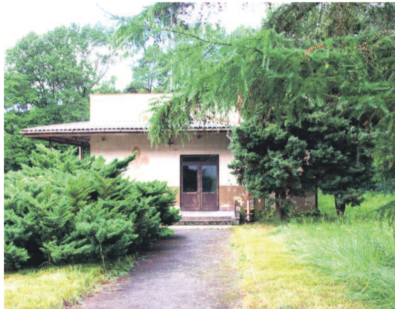
Obozowe obiekty mocno podupadły, ale harcerze chcą je przywrócić do życia.

- Całe moje dzieciństwo spędziłem na zabawach w lesie. Mieszkam nie-