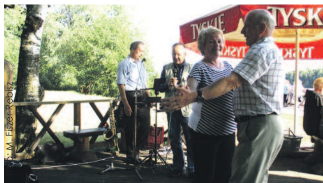
Spotkanie było okazją do rozmów i wspólnej zabawy – również... tanecznej!

Bardzo prężny Klub Seniora 50+ w Pyskowicach, o którym szerzej pisaliśmy w poprzednim numerze „Wiadomości Powiatu Gliwickiego”, zakończył sezon letnio-wiosennej działalności przy grillu nad Jeziorem Dzierżno w Pyskowicach.