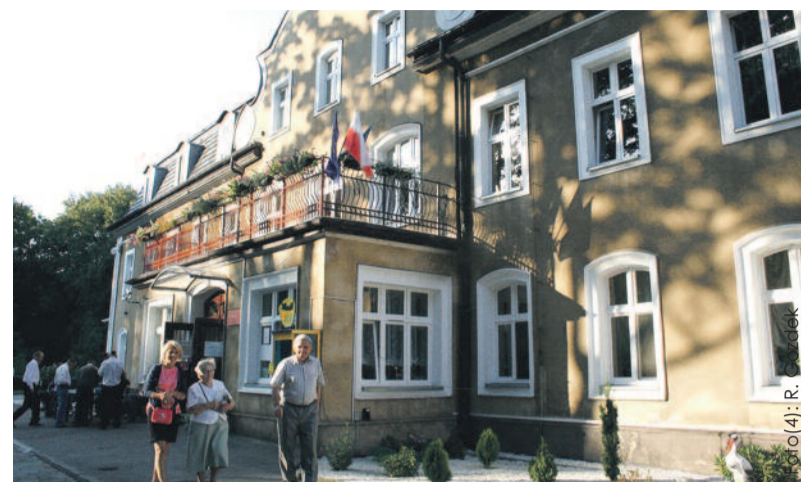
Placówka mieści się w zabytkowym budynku, który przeszedł ostatnio wiele remontów i modernizacji.

Warto dodać, że od wielu lat przy „Zameczku” działa Stowarzyszenie Na Rzecz Osób z Upośledzeniem Umysłowym i Chorych Psychicznie „Pomost”, dzięki któremu udało się zrealizować projekty unijne tj.: „Bliżej Siebie” – Integracyjne Spo-