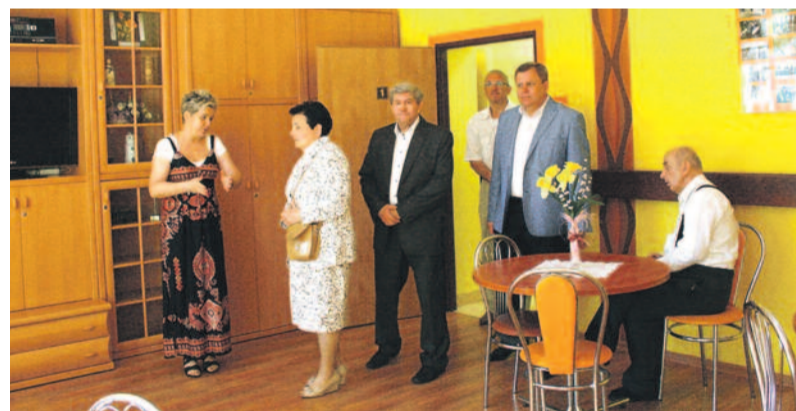
Zarówno pokoje mieszkańców, jak i wspólne pomieszczenia, gdzie odbywają się liczne zajęcia, są kolorowe i przytulne.

W ciągu tych 25 lat mieszkańcy osiągnęli wiele sukcesów. Te największe z nich to liczne wyróżnienia w konkursach i przeglądach artystycznych, zajęcie I miejsca w rozgrywkach Międzynarodowej Ligi Piłki Nożnej Osób Niepełnosprawnych Seni Cup w Czarniej oraz w Toruniu; występy mieszkańców w Międzynarodowych Przeglądach Umiejętności Artystycznych