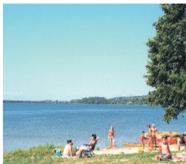
Tutaj można się ochłodzić w upalne dni.

mieści się tu Ośrodek Edukacyjno-Formacyjny Diecezji Gliwickiej. Zespół tworzą: pałac z kaplicą, zabudowania folwarczne, oficyna ze stajnią i wozownią, otaczający pałac park krajobrazowy. Nieopodal turyści mogą się wybrać nad Jezioro Pławniowickie. W gminie znajdują się zabytkowe kościołki: w Poniśzowicach, Rudzińcu i Bojszowie.