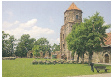
Zamek w Toszku – piękny o każdej porze roku.

Warte zobaczenia są zabytkowe kościołki: Wszystkich Świętych w Sierotach, pw. św. Wawrzyńca w Zacharowicach.