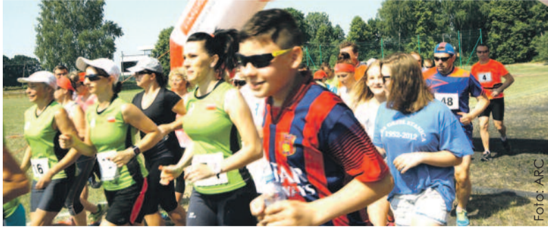
Na mecie stawiło się wielu zawodników, m.in. licznie reprezentowana była Rybnicka Grupa Biegowa „Pędzimy razem” (w zielonych koszulkach).

Mimo bardzo gorącej pogody na starcie biegu stawiło się 125 uczestników, którzy mieli do pokonania 5-kilometrową trasę wiodącą przez pilchowicki sta-