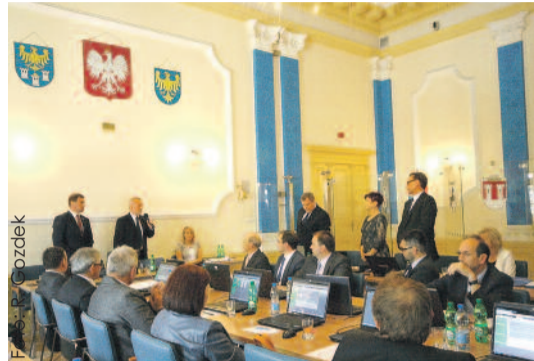
Po uzyskaniu absolutorium przez Zarząd Powiatu Gliwickiego.

Wcześniej procedowaliśmy 14 uchwał, w tym najważniejszą, udzielającą absolutorium Zarządowi Powiatu Gliwickiego za 2014 rok. Wrażenie robią inwestycje drogowe, które obejrzelśmy w Lebo-