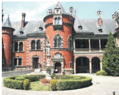
Pałac w Pławniowicach.

W Pławniowicach znajduje się architektoniczna perełka, jaką jest Zespół Pałacowo-Parkowy z XIX w. Obecnie