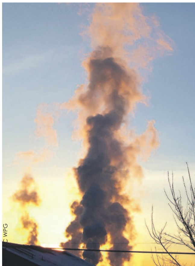
Oby takich kopcących kominów już następnej zimy było u nas jak mniej...

Sejmik Województwa Śląskiego 7 kwietnia przyjął uchwałę w sprawie wprowadzenia na obszarze woj. śląskiego ograniczeń w zakresie eksploatacji instalacji, w których następuje spalanie paliw. To tzw. uchwała antysmogowa. Strzeżcie się truciele!