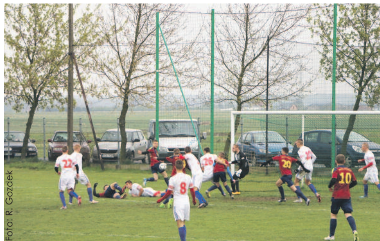
Mecz obfitował w mocne walki pod obydwiema bramkami.

To był bardzo zacięty mecz i prawdziwie piłkarskie święto w Wilczy. Po raz pierwszy na stadionie LKS „Wilki” rozegrany został Puchar Polski.