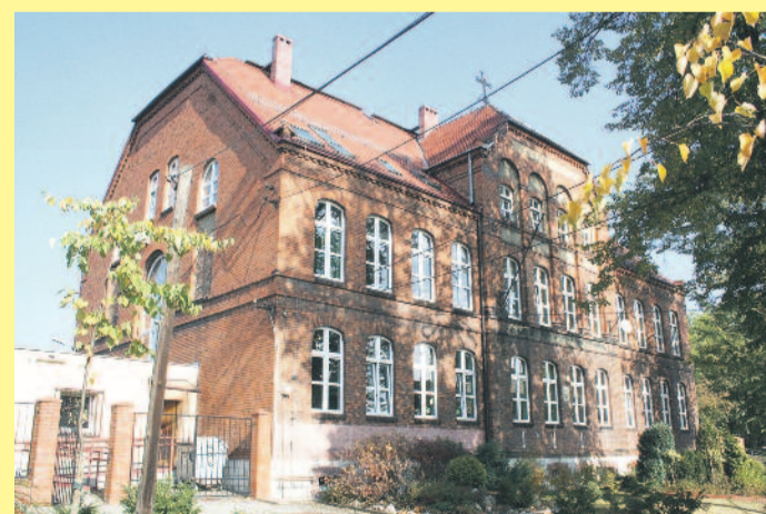
Zespół Szkół Specjalnych w Pyskowicach to szkoła o wieloletniej, sprawdzonej tradycji.

Zespołowa praca i odważnie podejmowane działania przyczyniają się do ciągłego rozwoju szkoły. Uczniowie mają możliwość osiągania sukcesów w wielu konkursach, m.in. przedmiotowych, plastycznych, wokalnych, tanecznych oraz w zawodach sportowych na terenie powiatu i województwa.