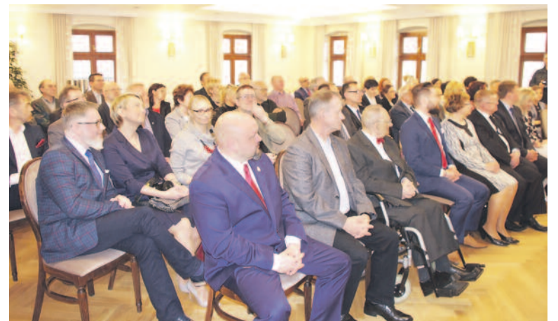
Konferencja cieszyła się dużym zainteresowaniem – na sali trudno było o wolne miejsce.

Z tej okazji zapraszamy na XII Brevierie Toszeckie, połączone z II Nocą Muzeów na Zamku w Toszku. Atrakcje zaczną się już o godz. 17.00 i potrwają do późnej nocy. Wśród nich są m.in. koncerty, przedstawienia teatralne, pokazy dawnego tańca, wystawy, walki rycerskie, gry i zabawy oraz wykłady – w tym poświęcone modzie i zaleceniom dietetycznym sprzed kilku wieków. Na zamkowym dziedzińcu rozbije się oboz średniowieczny ze