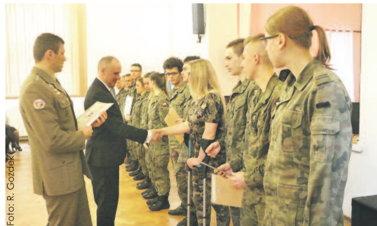
W „Konopnickiej” abiturienti z klas mundurowych poza świadectwami odebrali również certyfikaty, pomocne przy aplikowaniu o pracę w wojsku czy w policji.

Zanim jednak przystąpili do matury, odebrali świadectwa ukończenia szkoły. Uroczystości pożegnania uczniów ostatnich klas szkół ponadgimnazjalnych odbyły się 28 kwietnia we wszystkich trzech powiatowych placówkach oświatowych: Zespole Szkół im. I. J. Paderewskiego i w Zespole Szkół Zawodowych nr 2 w Knurowie oraz w Zespole Szkół im. M. Konopnickiej w Pyskowicach. Wielu abiturientów odebrało świadectwa z czerwonym paskiem oraz nagrody i dyplomy. Były kwiaty, łzy wzruszenia i podziękowania dla nauczycieli oraz wychowawców.