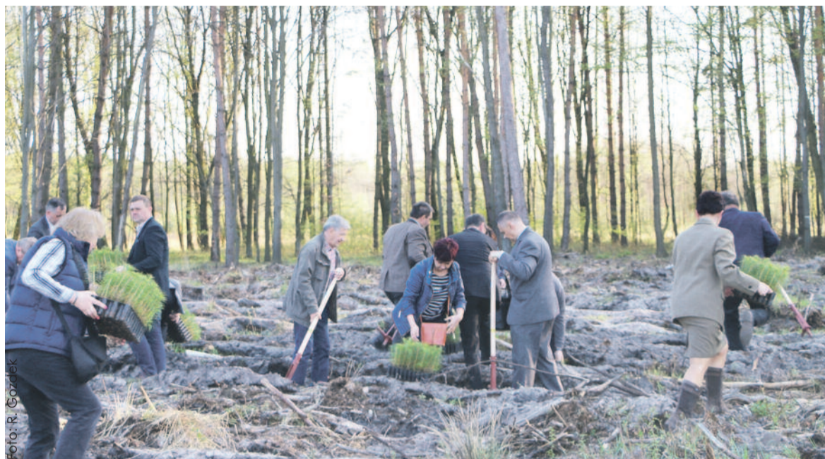
Podczas sadzenia drzew w Nadleśnictwie Rudziniec za szpadle chwycili samorządowcy, urzędnicy, naukowcy, duchowni i towarzyszący im leśnicy.