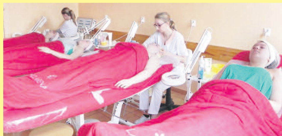
W „Konopnickiej” kształcą się m.in. cenione na rynku pracy kosmetyczki.