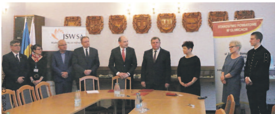
W uroczystym podpisaniu umowy wzięli udział przedstawiciele Jastrzębskiej Spółki Węglowej, Powiatu Gliwickiego i Zespołu Szkół Zawodowych nr 2 w Knurowie.

W Starostwie Powiatowym w Gliwicach podpisano porozumienie pomiędzy Jastrzębską Spółką Węglową S.A. a Powiatem Gliwickim. Określa ono zasady współpracy m.in. w zakresie zatrudnienia absolwentów Zespołu Szkół Zawodowych nr 2 w Knurowie, kształcących się w zawodach i specjalnościach górniczych.