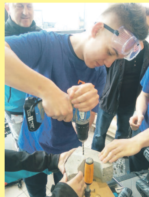
...można tu również zdobyć szereg zawodów gwarantujących zatrudnienie, m.in. w kopalniach Jastrzębskiej Spółki Węglowej.

Szkoła dysponuje bardzo dobrym zapleczem dydaktycznym oraz pracowniami przedmiotów zawodowych. Są tam tablice graficzne, projektory i tablice multimedialne. Bogate oprogramowanie pozwala na szerokie wykorzystanie pracowni w procesie dydaktycznym przedmiotów zawodowych. Uczniowie klas technikum mają możliwość zdobycia umiejętności sporządzania rysunków technicznych z użyciem tabletek i różnorodnych programów, dokumentacji technicznej oraz obróbki graficznej, co w sposób bardzo istotny ma wpływ również na rozwój ich zainteresowań, a w dalszej przyszłości na wyniki egzaminów.