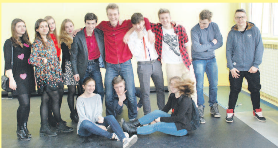
Pozytywnie myśląca, energetyczna młodzież „Paderka”.