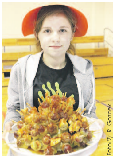
Potrawy podawane były tak, jak się to robi w Chinach.

Kurczaka kroimy na małe kawałki, dodajemy płatki chilli i sos sojowy – odstawiamy na 30 min. do zamarynowania. Warzywa kroimy na słupki.