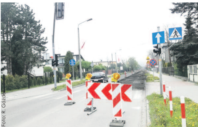
Uciążliwości objazdu zrekompensuje kierowcom rozbudowana ul. 1 Maja.

Na ul. 1 Maja w Knurowie wprowadzono objazdy związane z rozbudową tej drogi powiatowej.