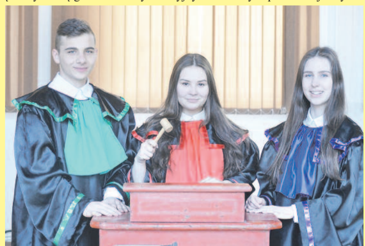
Warsztaty prawne w Zespole Szkół im. M. Konopnickiej w Pyskowicach.

Kierunek polecany młodzieży przedsiębiorczej i kreatyw-