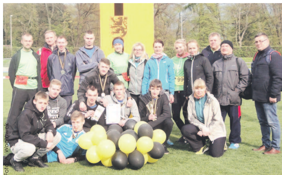
Przedstawiciele naszego powiatu po biegu w partnerskim Powiecie Mittelsachsen.