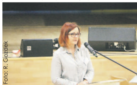
„Słuchajmy rodziców” – pod takim hasłem przebiegała V Konferencja poświęcona propagowaniu wiedzy o autyzmie zorganizowana przez Poradnię Psychologiczno-Pedagogiczną oraz Miejskie Przedszkole z Oddziałami Integrycyjnymi nr 13 w Knurowie. Cieszyła się ogromnym zainteresowaniem zarówno fachowców, jak i rodziców autystycznych dzieci.