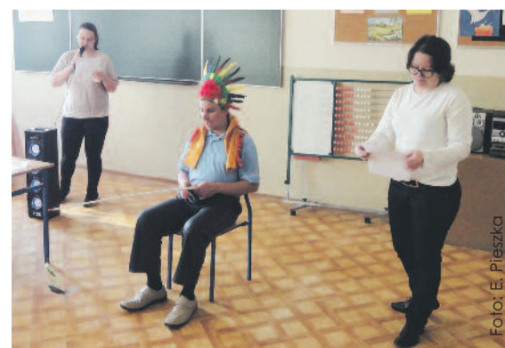
Podczas zajęć ujawniają się wcześniej nieodkryte talenty.

W projekcie wzięło już udział ponad 250 osób. - W wyniku zrealizowanych