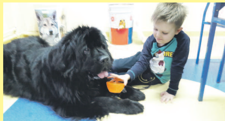
Podczas zajęć dogoterapii w Zespole Szkół Specjalnych w Knurowie.

W skład Zespołu Szkół Specjalnych wchodzi: