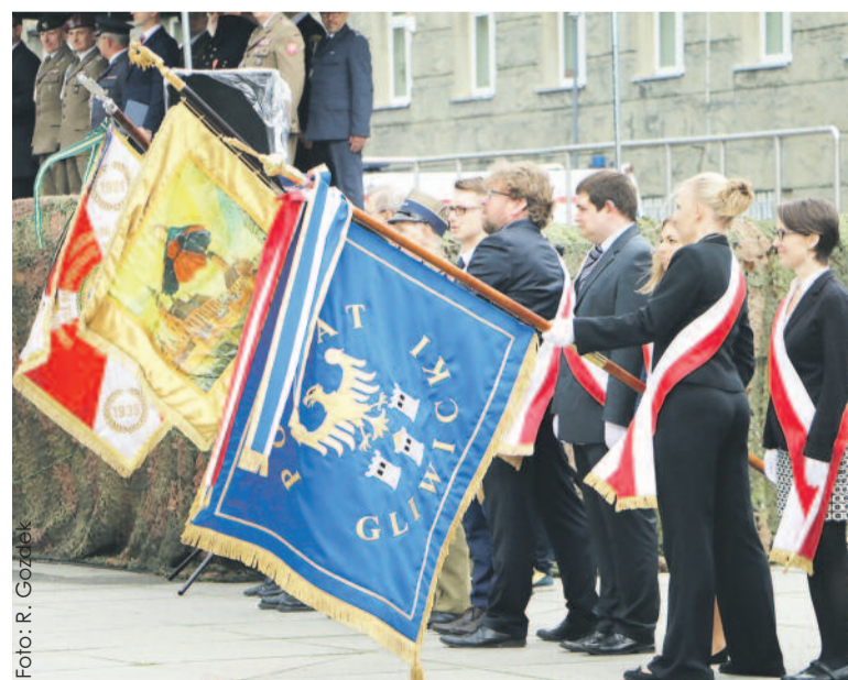
Sztandar Powiatu Gliwickiego towarzyszy naszym najważniejszym uroczystościom.

Aktualne logo Powiatu Gliwickiego funkcjonuje od 2009 r. obok bardziej oficjalnego herbu powiatu – oba te znaki graficzne można zobaczyć w tym wydaniu WPG w winiecie Dodatku specjalnego. Logo ma kształt kwadratu z trzema wieżami i trzema falami, symbolizującymi najstarsze miasta w powiecie oraz rzeki przepływające przez powiat. Towarzyszy mu hasło z zabawą grą słów: „Gliwicki i co Powiecie?”. (JP, MFR)