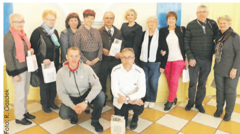
24 kwietnia z krótką wizytą w Starostwie Powiatowym w Gliwicach gościli Francuzi z La Ricamarie, partnerskiego miasta Pyskowic. W br. przypada 20-lecie nawiązania tej bardzo żywej współpracy, owocującej wieloma przyznaniami i wspólnymi inicjatywami.