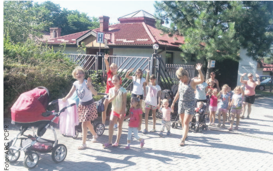
Wesoła gromadka dzieci z rodzin zastępczych podczas jednej z imprez, zorganizowanych latem ub. roku.

W ramach organizowania wsparcia dla rodzin zastępczych poprzez szkolenia, integrację i wzajemną pomoc, w 2016 r. nadal funkcjonowała nieformalna grupa wspierających się wzajemnie rodzin zastępczych skupionych wokół Stowarzyszenia „Gniazdo” w Świbiu, prowadzona przez zawodową rodzinę zastępczą pełniącą funkcję pogotowia rodzinnego. Jak co roku, również w 2016 r. grupa zorganizowała „Święto Truskawki”, w którym uczestniczyły rodziny zastępcze z powiatu gliwickiego oraz zaproszeni goście spoza powiatu.