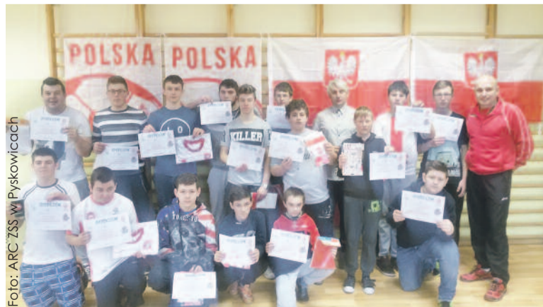
Uczniowie chętnie ćwiczą i trenują, co przekłada się na sportowe sukcesy.