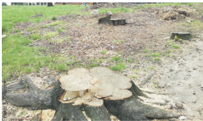
W ostatnim czasie w wielu miejscach widać, że ubyło nam drzew.