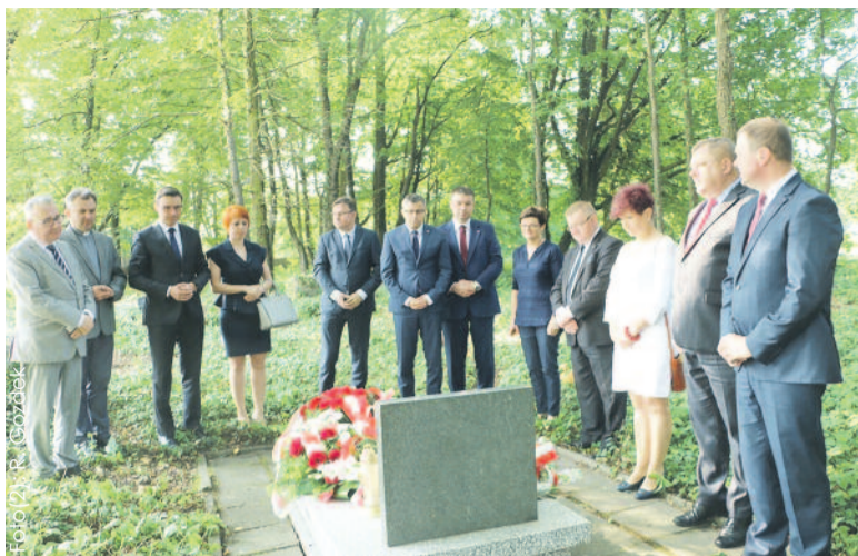
Chwila zadumy nad grobem ks. Damrota przed rozpoczęciem biegu.

Na starcie tegorocznego, VII Biegu Ulicznego im. ks. Konstantego Damrota w Pilchowicach stawili się dorośli, dzieci, osoby na wózkach inwalidzkich, a nawet rodzice z małżeństwami na rękach.