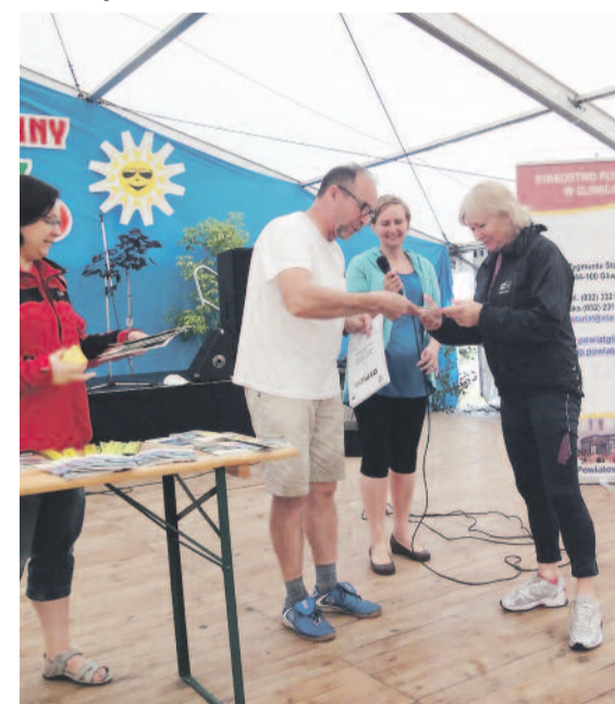
Rowerzyści otrzymali dyplomy i pamiątkowe gadżety.

Metę wyznaczono w Ośrodku Sportu i Rekreacji w Sośnicowicach, dokonano uroczystego podsumowania rajdu. Każdy uczestnik otrzymał pamiątkowy dyplom oraz pięknie wydane przewodniki po powiecie i album o Sośnicowicach oraz odbłaski. Ro-