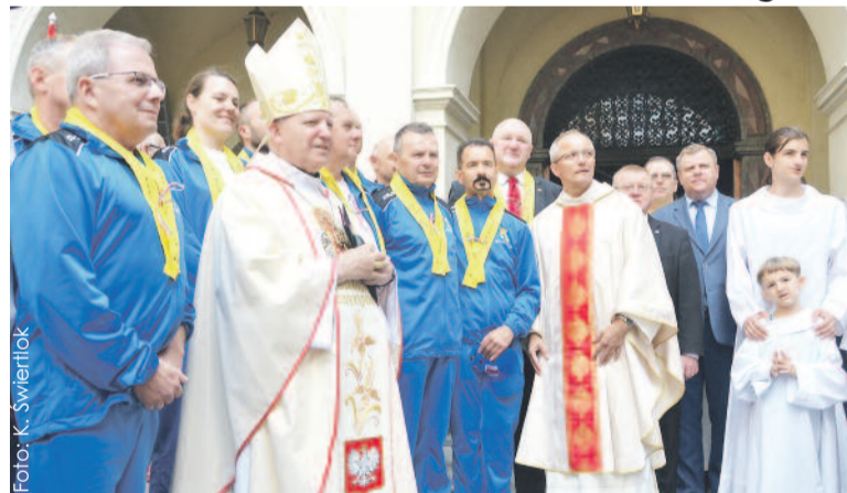
Pożegnanie biegaczy przed rozpoczęciem pielgrzymki na Jasnej Górze.