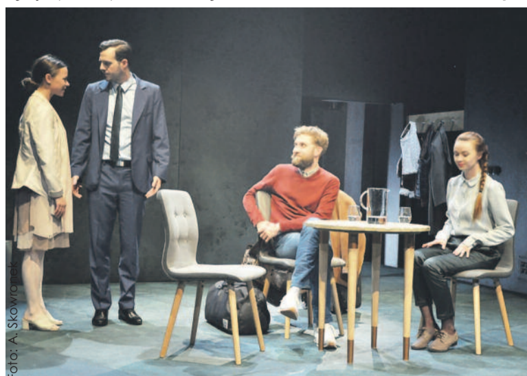
„Nora” w inscenizacji młodego zespołu Teatru w Gliwicach jest bardzo współczesna i poruszająca.

Warto się wybrać na „Norę” we wrześniu, po wakacyjnej przerwie. To dramat małżeński dla każdego. (RG)