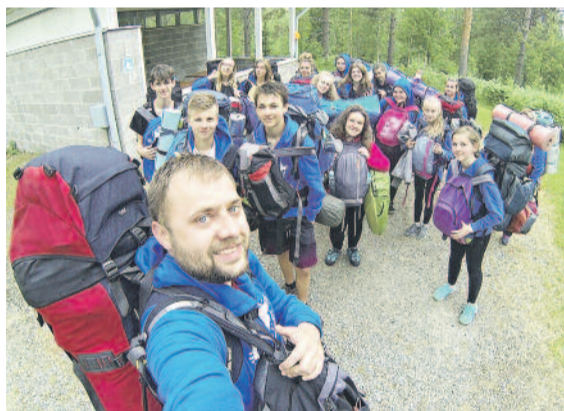
Podróżnicy propagują turystykę backpackingową – wszystko, co potrzebne w czasie ekspedycji, mają w swych plecakach!

Była to już 13. Szkolna Ekspedycja. Dzięki nim uczniowie Zespołu Szkół w Pilchowicach i Zespołu Szkół im.