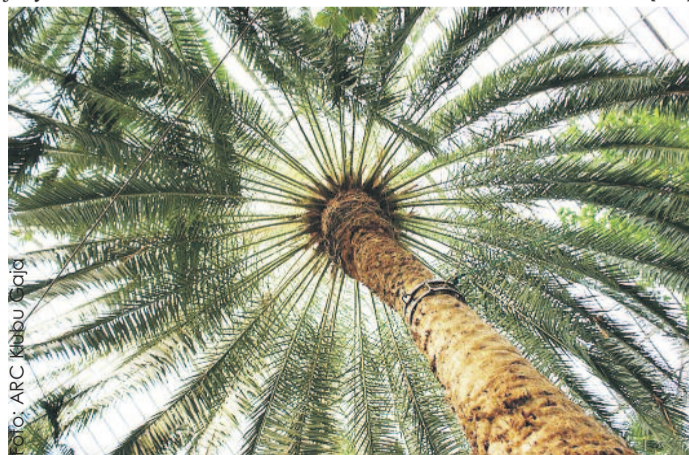
Nagrodzony feniks kanaryjski ma imponujące wymiary.

W tegorocznej edycji konkursu Drzewo Roku zwyciężyła 220-letnia Topola Helena z Helu – a więc z naszego partnerskiego Powiatu Puckiego. To właśnie ona będzie reprezentowała Pol-