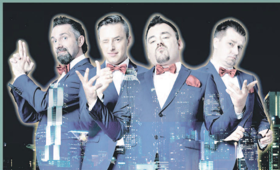
Kabaret Młodych Panów