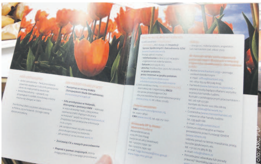
W Powiatowym Urzędzie Pracy w Gliwicach można otrzymać wszelkie informacje, dotyczące pracy w Holandii.

tkaniu 12 czerwca zostały zaproszone osoby zainteresowane wyjazdem do poszukiwania pracy, w tym młodzież ostatnich klas gliwickich szkół zawodowych. Kolejnego dnia gościliśmy przedstawicieli instytucji, m.in. Wojewódzkiego Urzędu Pracy w Katowicach, Powiatowego Urzędu Pracy w Za-