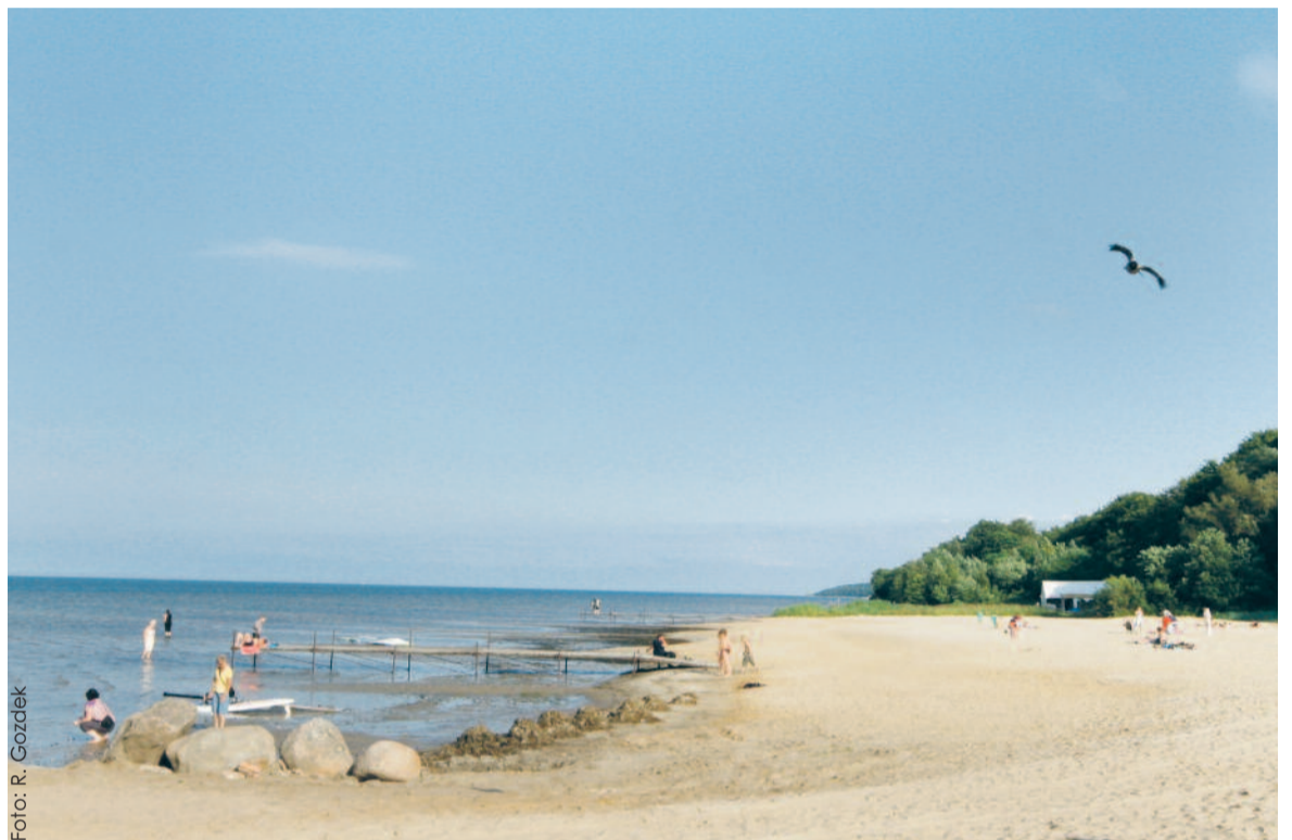
Jedna z uroczych plaż w powiecie puckim – przyciąga zarówno miłośników opalania, kąpieli, jak i sportów wodnych.