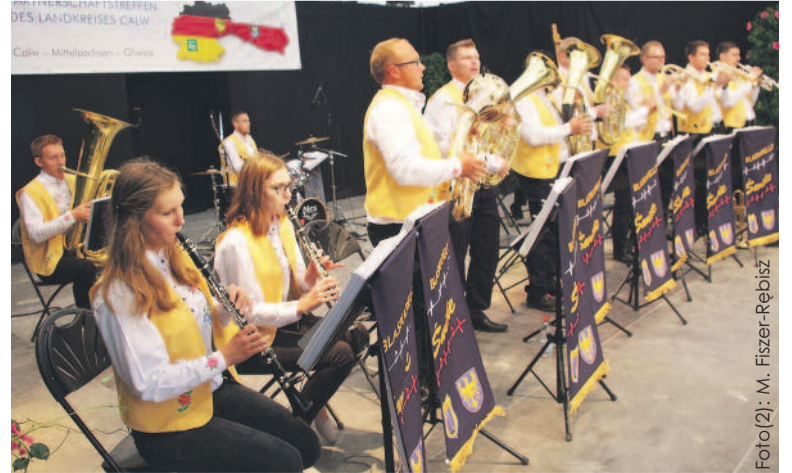
Blaskapelle ze Świbia zebrała w Niemczech mnóstwo oklasków.