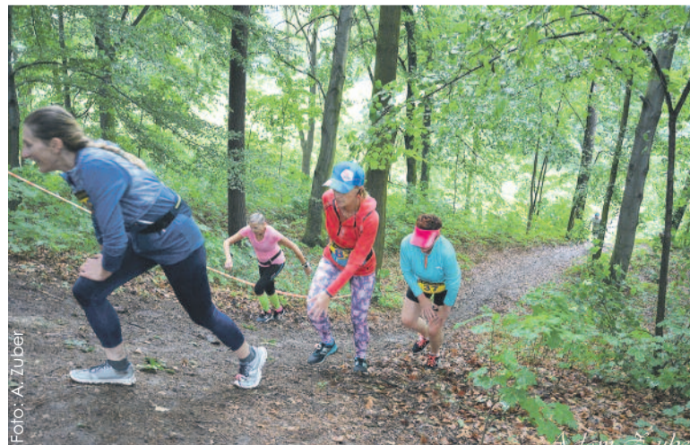
Wyznaczona trasa była malownicza, ale niełatwa do pokonania.