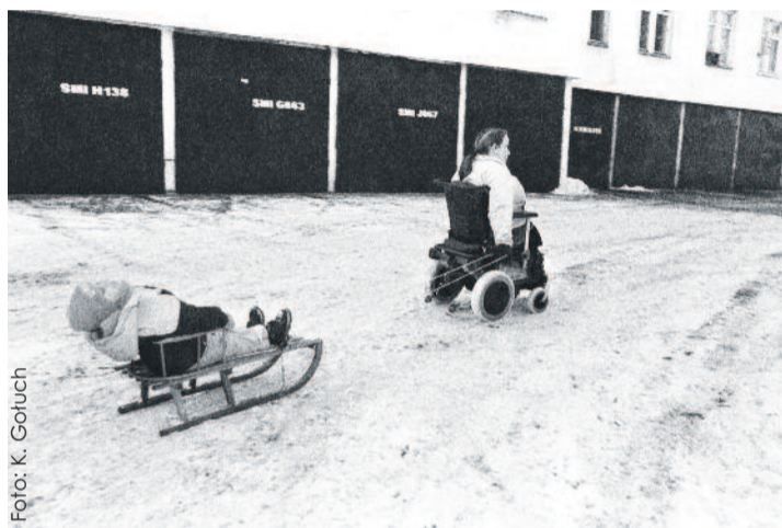
Jedno ze zdjęć umieszczonych w albumie – zobaczyć je można także na wystawie w starostwie.