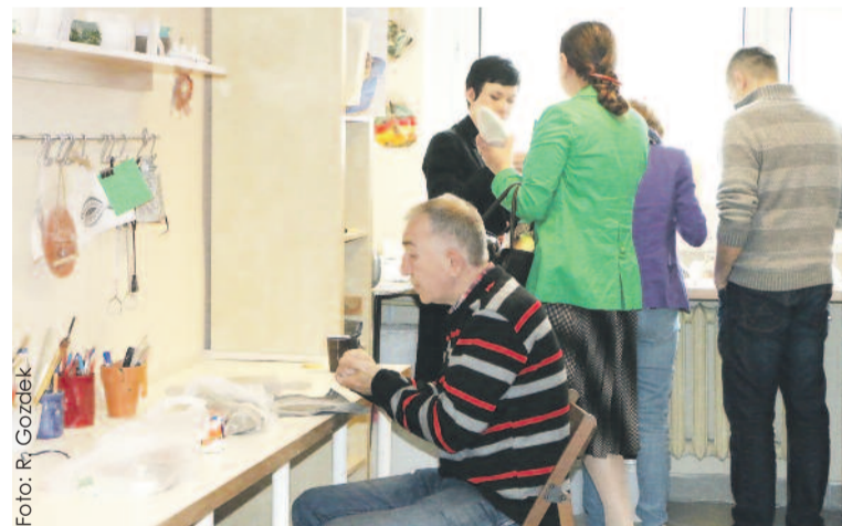
Praca dla osób niepełnosprawnych ma bardzo duże znaczenie.

Oferta dla osób niepełnosprawnych od stycznia 2016 r. została poszerzona o dodatkowe formy wsparcia w ramach projektu „Nowy start w lepszą przyszłość”, współfinansowanego ze środków Europejskiego Funduszu Społecznego w ramach Regionalnego Programu Operacyjnego Województwa Śląskiego na lata 2014-2020. Osoby niepełnosprawne mają możliwość uczestnictwa w Międzygeneracyjnych Klubach Spotkań, które integrują je ze środowiskiem lokalnym. Ponadto niepełnosprawni uczestnicy projektu mają możliwość podniesienia własnych kwalifikacji poprzez udział w bezpłatnych kursach lub szkoleniach o charakterze zawodowym lub edukacyjnym. Pracownicy Zespołu ds. projektów celowych działają także na rzecz pomocy osobom niepełnosprawnymi w nawiązywaniu kontaktów z potencjalnymi pracodawcami. Jednym z celów projektu jest bowiem aktywizacja zawodowa. Pośrednio wpływ na jego osiągnięcie miał udział uczestników w tre-