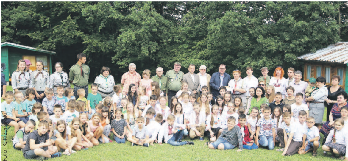
Pamiątkowe zdjęcie zrobione podczas wizyty w ośrodku harcerskim w Wapienicy.

Wojewódzki Fundusz Ochrony Środowiska i Gospodarki Wodnej (WFOŚiGW) w Katowicach co roku dofinansowuje wypoczynek wakacyjny dzieci. O tym, że są to dobrze wydane pieniądze, można przekonać się m.in. w ośrodku harcerskim w Wapienicy.