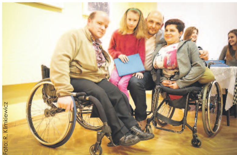
Ze środków PFRON można otrzymać dofinansowanie m.in. do zakupu wózka inwalidzkiego.

Na przełomie 2015-2016 przygotowano dokumentację techniczno-budowlaną, rozpropagowano ideę utworzenia ZAZ na terenie powiatu poprzez m.in. działania edukacyjne w Zespole Szkół Specjalnych w Knurowie i przygotowanie mieszkańców DPS Zameczek do zatrudnienia. Nawiązano też współpracę z PUP w Gliwicach w zakresie zatrudnienia osób niepełnosprawnych znajdujących się w jego bazie. Podpisano wstępne umowy z firmami zewnętrznymi w zakresie zakupu usług oferowanych przez ZAZ, przeprowadzono spotkania informacyjne dotyczące jego funkcjonowania dla osób niepełnosprawnych, ich rodziców i opiekunów, nawiązano współpracę z Miejskim Zespołem do spraw Orzekania o Niepełnosprawności, przedstawiono projekt Państwowej Inspekcji Pracy, Stacji Sanitarno-Epidemiologicznej, Państwowej Straży Pożarnej w zakresie