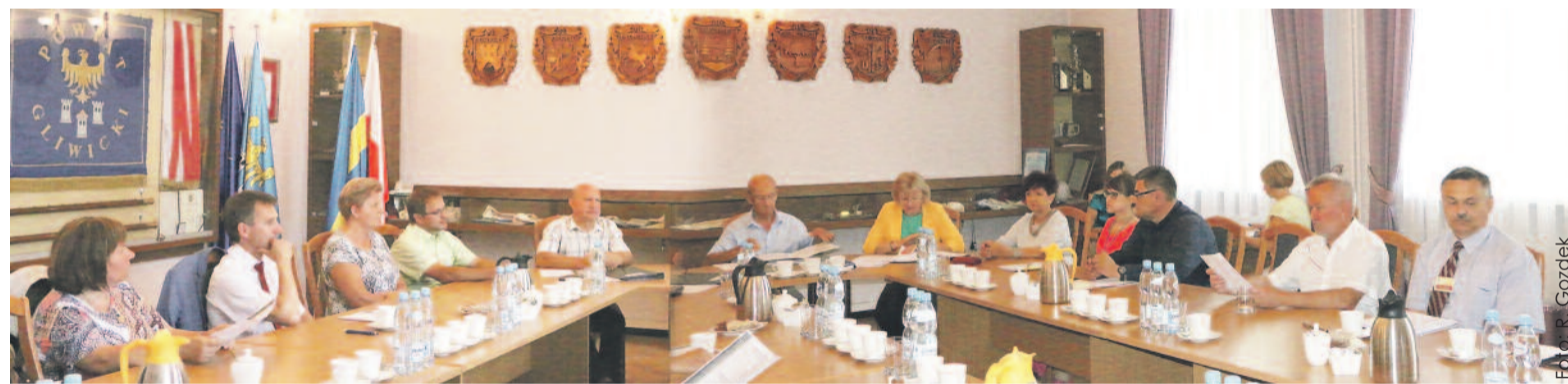
Podczas wspólnego posiedzenia Komisji Ochrony Środowiska, Rozwoju i Promocji oraz Komisji Edukacji.

Głównym tematem wszystkich posiedzeń było sprawozdanie z wykonania budżetu powiatu za 2016 r. wraz z informacją o stanie mienia powiatowego oraz sprawozdanie finansowe Powiatu Gliwickiego za ub. rok. Związane to było z przygotowaniem do sesji absolutorijnej Rady Powiatu Gliwickiego, o której piszemy wyżej. Część tych posiedzeń była łączona – komisje odbywały je wspólnie, by nie trzeba było wielokrotnie powtarzać tych samych budżetowych tematów.