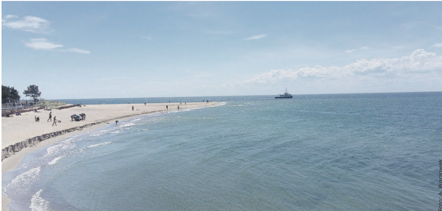
Półwysep Helski to bez wątpienia jedno z najpiękniejszych miejsc nad polskim morzem.

- Myślę, że nie musimy przekonywać turystów, że jest u nas sporo miejsc wartych odwiedzenia