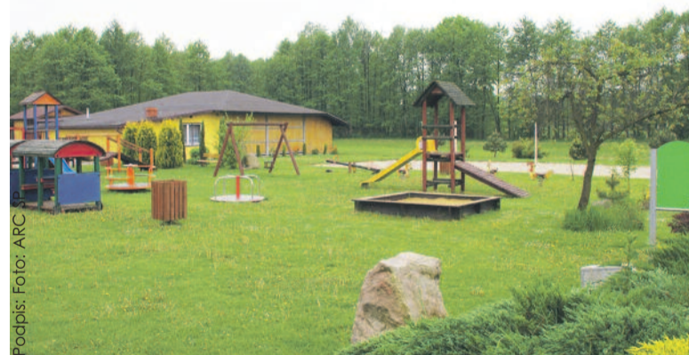
W poprzednich latach powiat dofinansował m.in. zazielenienie Młynówki w Leboszowicach (gm. Pilchowice).

mej gminy na zagospodarowanie skweru na małym rynku, na rozdrożu ulic Młyńskiej i Kłodnickiej; Poniszowicom (gm. Rudziniec) na urządzenie i zwiększenie bioróżnorodności parku w tej miejscowości; Widowowi (gm. Rudziniec) na odtworzenie terenu rekreacyjno-przeciwpożarowego przy stawie w tym sołectwie; Smolnicy w gm. Sośnicowice za projekt „Zagospodarowanie terenu przy ul. Wiejskiej poprzez obsadzenie krzewami ozdobnymi skarpy – II etap”; Paczynie (gm. Toszek) na zagospodarowanie terenu wokół świetlicy; Pniowowi (gm. Toszek) za projekt „W Pniowie – zielono nam i spokojnie!”; Sarnowowi (gm. Toszek) na realizację przedsięwzięcia „Ekologiczne Serce Sarnowa”; Błażejowicom (gm. Wielowieś) na zadanie „Zieleń nad stawem”; Kieleczce (gm. Wielowieś) za projekt „Zielony zakątek – miejsce integracji i rekreacji – etap II”; Wielowisi na realizację projektu „Zielona oaza dla najmłodszych”; Wiśniczom (gm. Wielowieś) na przedsięwzięcie pn. „Nasza wieś – oaza spokoju” i Zacharzewicom (gm. Wielowieś) za projekt „Beztraska oaza nad stawem”. Nagrody takie otrzymały również gminy: Knurów – na dwa kolejne podetapy zagospodarowania terenów w rejonie ul. Gen. Ziętka i 26 Stycznia z przeznaczeniem pod budownictwo mieszka-