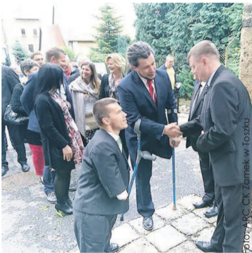
Uczestnicy kongresu mieli możliwość poznania miejsc związanych z dr. L. Guttmannem.