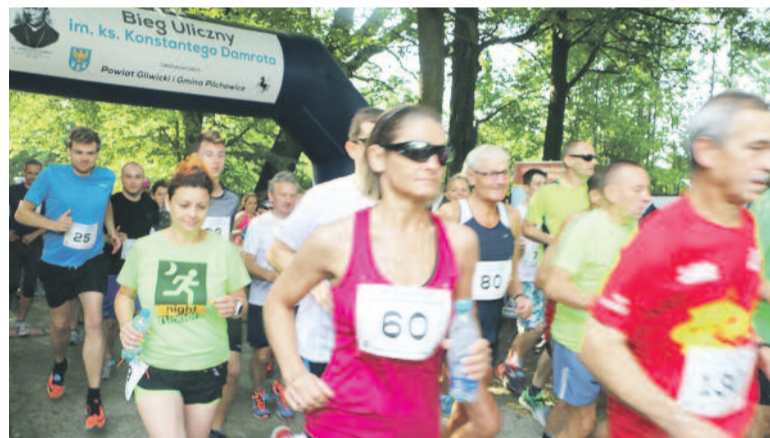
W imprezie udział wzięło ponad 200 biegaczy.