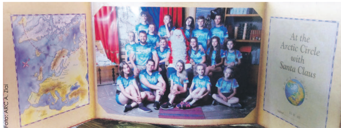
Pamiątkowe zdjęcie za północnym kołem podbiegunowym, gdzie wędrowcy odwiedzili Świętego Mikołaja.