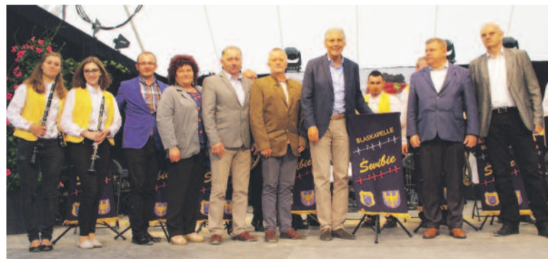
Przedstawiciele trzech partnerskich powiatów na scenie w Bad Herrenalb.