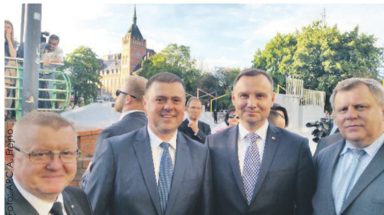
Nasi samorządowcy w czasie spotkania z prezydentem RP.