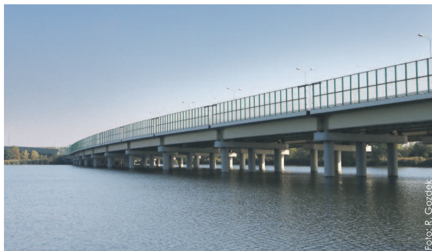
Wiadukt nad Moczurami musi przestać hałasować.