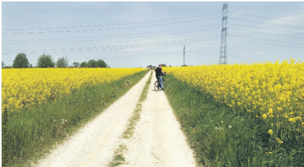
W naszym powiecie do aktywnego wypoczynku zachęcają trasy rowerowe – jak np. ta na Sroczej Górze w Pyskowicach.