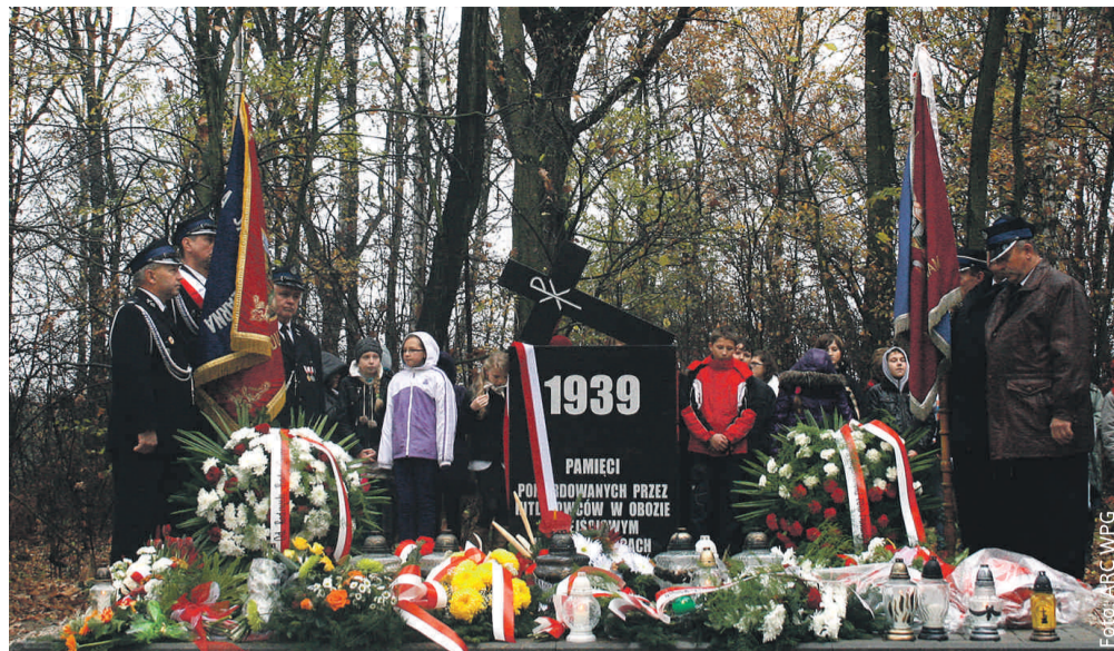
W 2012 r. w Nieborowicach odsłonięty został pomnik, na którym widnieje napis: „1939 – pamięci pomordowanych przez hitlerowców w obozie przejściowym w Nieborowicach”.

Książd Robota ostoja polskości, zginął z rąk faszystów, Za wolność Śląska, za miłość do polskości.