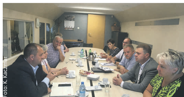
Podczas spotkania w Sośnicowicach.