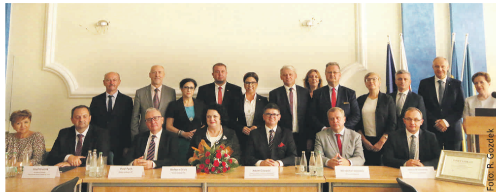
Przy podpisaniu Listu intencyjnego samorządowcom towarzyszyli przedstawiciele rządu, parlamentu, Politechniki Śląskiej oraz Wojewódzkiego Funduszu Ochrony Środowiska i Gospodarki Wodnej w Katowicach.

konkurencyjności i efektywności energetycznej lokalnej gospodarki oraz zapewnienia bezpieczeństwa energetycznego w wyniku realizacji działań na rzecz odnawialnych źródeł energii.