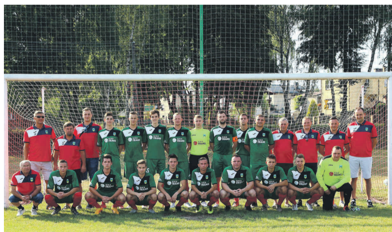
Piłkarze „Victorii” Pilchowice.

„Naprzód” Żernica organizuje turniej oraz zajęcia z piłką w okresie letnim.