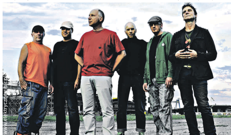
XXVI Dożynki w Pyskowicach oraz XXI Dożynki Powiatu Gliwickiego zakończenie koncert zespołu Elektryczne Gitary.

W weekend 7-8 września zapraszamy do Pyskowic na XXVI Dożynki w Pyskowicach oraz XXI Dożynki Powiatu Gliwickiego. W programie wiele atrakcji, m.in. koncert zespołu Elektryczne Gitary. Ciekawie jest też w naszych pozostałych gminach, które świętują zakończenie żniw, dziękując za plony.