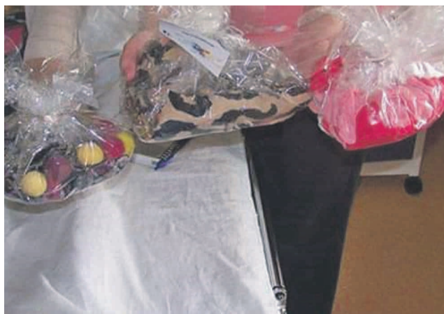
Takie barwne upominki otrzymują chorzy.