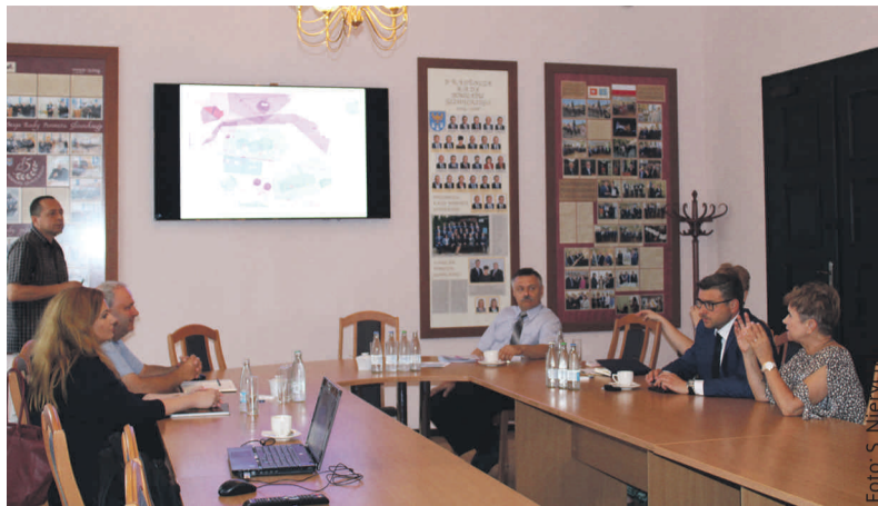
Podczas spotkania w starostwie szukano dróg rozwiązania problemu mieszkańców Żernicy.

stały m.in. mapy z trajektorią lotów w tej okolicy oraz ogólne zasady kierowania ruchem lotniczym. Na ich podstawie omówiono zasady dotyczące m.in. ograniczenia prowadzenia lotów w obrębie terenów otaczających lotnisko w Gliwicach.