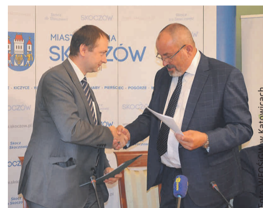
Porozumienie z WFOŚiGW w Katowicach na wdrażanie Programu na swoim terenie zawarła m.in. Gmina Skoczów.

15.12.2002 r. – pozostawiono tylko wymóg co najmniej 5 klasy normy europejskiej EN 303-5:2012 dla źródeł ciepła na paliwo stałe. Zmieniono sposób określania maksymalnego terminu zakończenia realizacji przedsięwzięcia – dotychczas było to nie później niż 24 miesiące po podpisaniu umowy o dofinansowanie, obecnie – nie później niż 30 miesięcy od daty złożenia wniosku. Doprecyzowano, że kwalifikowane są koszty związa-