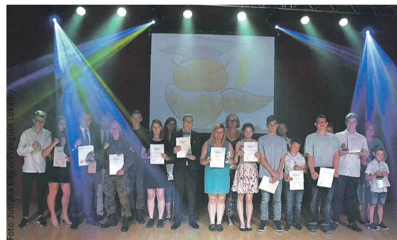
Akademia „Sowy” w Knurowie. Wśród laureatów znalazła się mocna reprezentacja uczniów i ich opiekunów z powiatowych zespołów szkół.

matyczne, ekologiczne, polonistyczne) oraz sportowe.