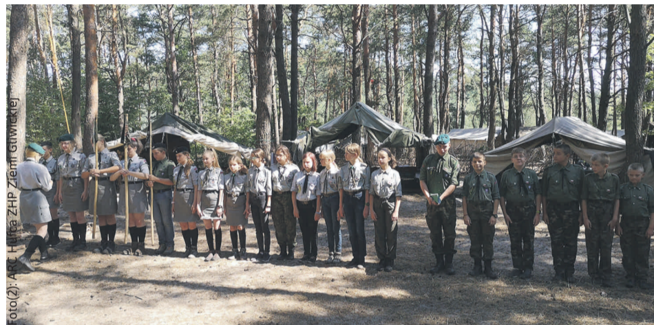
Jeden z obozów Hufca ZHP Ziemi Gliwickiej odbywał się w Podlesicach, gdzie harcerze mieli okazję poznać uroki Jury Krakowsko-Częstochowskiej.

Zuchy i harcerze z Hufca ZHP Ziemi Gliwickiej po raz kolejny udowodnili