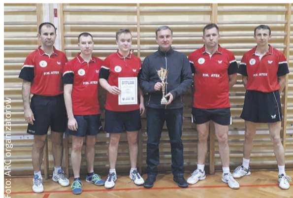
Pierwsza drużyna tenisa stołowego „Wilków” Wilcza.

LKS „Wilki” Wilcza (poprzednia nazwa Ludowy Zespół Sportowy „Postęp”) istnieje od 1948 r. jako stowarzyszenie kultury fizycznej. Obecnie działają w nim drużyny piłki nożnej (drużyna seniorów – IV Liga Śląska grupa 2, druga drużyna – klasa B, drużyna młodzieżowa r. 2008 – E1 Orlik gr. 1, drużyna młodzieżowa r. 2009 E2