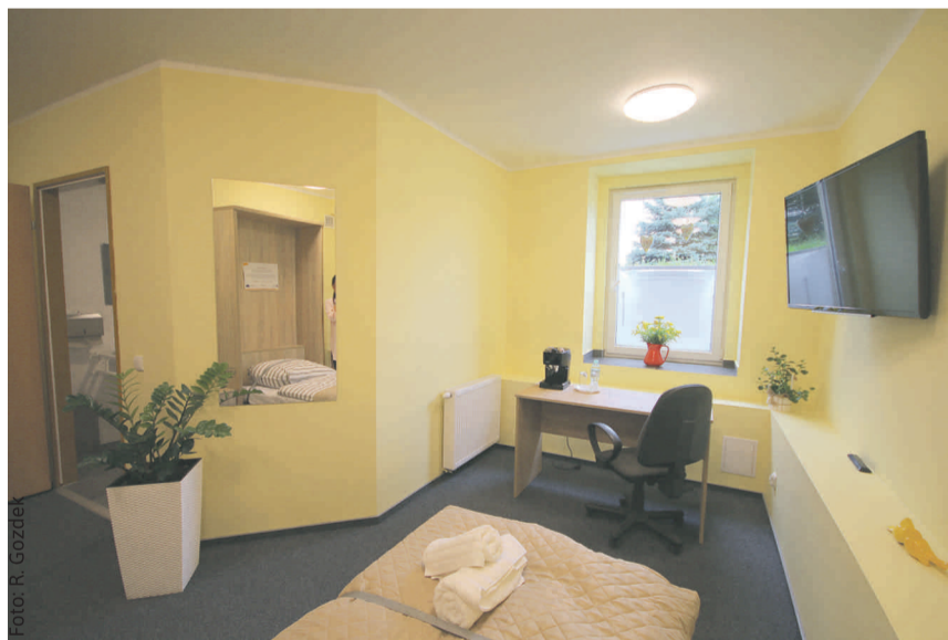
Nowoczesna pracownia, w której uczniowie Zespołu Szkół Specjalnych w Knurowie zdobywają praktyczne umiejętności niezbędne w zawodzie pracownik pomocniczy obsługi hotelowej.

klasa wielozawodowa integracyjna, mechanik-monter i ślusarz, ślusarz, elektryk, klasa wielozawodowa. Otwartych zostało 11 klas pierwszych: 4 w liceum, 2 w technikum i 5 klas branżowych.