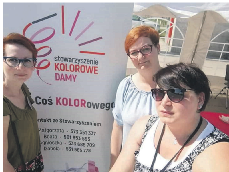
Członkinie stowarzyszenia „Kolorowe damy”.

– Podejmujemy również indywidualne działania na rzecz pacjentów, nie