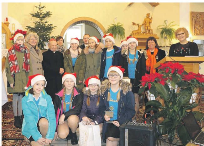
Pyskowskie „Śpiewajki” wygrywają wiele wokalnych konkursów – na zdjęciu w Dąbrówce podczas XVI Wojewódzkiego Festiwalu Koled i Pastoralek.

OPP w Pyskowicach również posiada bogatą ofertę sekcji. W I półroczu 2019 r. było to aż 29 sekcji, a w zajęciach uczestniczyło prawie 500 dzieci z terenu gmin Pyskowice, Toszek, Wielowieś i Rudziniec. Są to koła artystyczne (wokalne Śpiewajki, Wokalności, teatralne PIK POK, NIEPOKORNI, plastyczne, taneczne, Wesolinki, artystyczne, muzyczne), techniczne (informatyczne, multimedialne), naukowe (historyczne, mate-