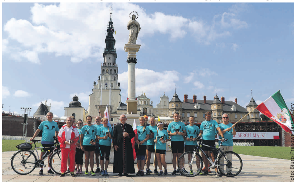
Na Jasnej Górze uczestników pielgrzymki powitał metropolita częstochowski abp Wacław Depo.

U stóp figury Matki Bożej na placu jasnogórskim pielgrzymów przywitał abp Wacław Depo, metropolita częstochowski. – Bardzo serdecznie was pozdrawiam na tych drogach pielgrzymich, dziękując za odwagę wyruszenia w drogę, i za to