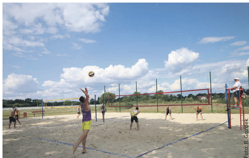
Siatkówka plażowa znalazła w Rudzińcu przyjazne miejsce do rozgrywek.

Prezentujemy LKS-y z terenu powiatu gliwickiego (5)