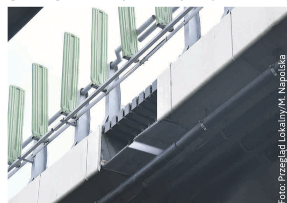
Na jednej z dylatacji eksperymentalnie zainstalowano w sierpniu osłonę akustyczną, aby sprawdzić jej skuteczność.

Jest to pionierskie w skali kraju przedsięwzięcie, nigdzie bowiem nie doszło do takiej kumulacji dźwięku przy wiadukcie drogowym jak w Knurowie, gdzie hałas jest zwielokrotniany przez zbiornik wodny. Jeśli wyciszenie dylatacji nie okaże się