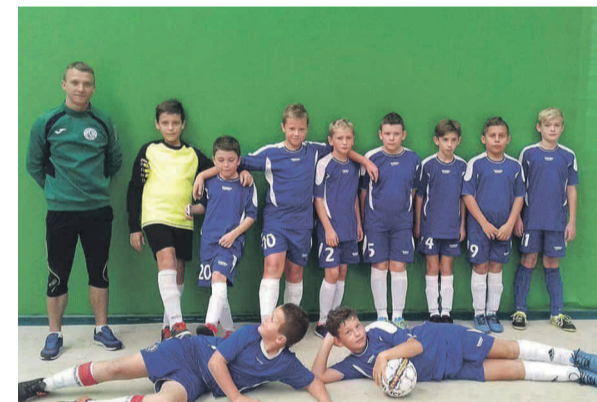
Rocznik 2006 piłkarzy „Wilków”.

Wśród sukcesów można wymienić m.in. awans drużyny piłki nożnej do IV ligi (2016 r.), tytuł laureata konkursu wojewódzkiego 2017 „Wiejski obiekt sportowy zawsze wzorowy”, organizację i udział w Gminnym Turnieju Oldbo-