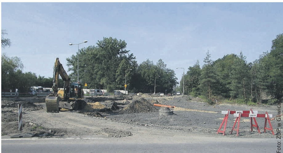
To był długo wyczekiwany przez kierowców remont.

Jest to wspólne przedsięwzięcie Powiatu Gliwickiego i Województwa Śląskiego, wsparte również przez Miasto Knurów. Jego ogólna wartość wynosi blisko 5,3 mln zł. Z budżetu wojewódz-