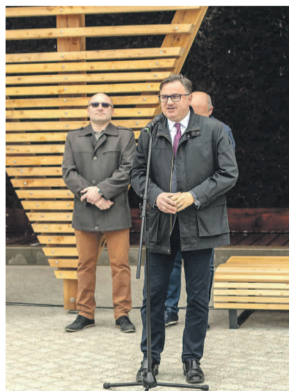
Podczas uroczystego otwarcia tężni w Knurowie.

W bieżącej kadencji cieszę się szczególnie z podejmowanych przeze mnie działań, które były możliwe dzięki współpracy z jednostkami Ochotni-