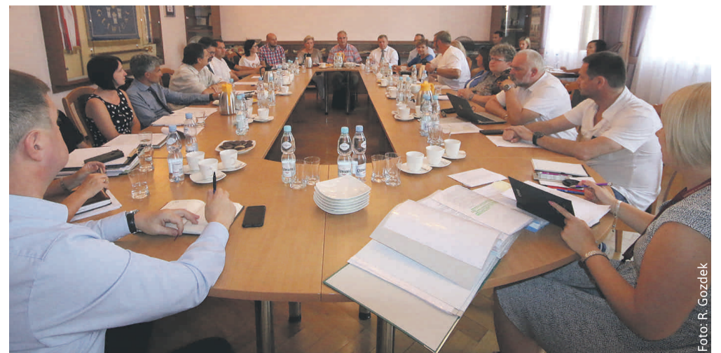
Wspólne posiedzenie Komisji Budżetu i Finansów oraz Komisji Zdrowia i Wsparcia Rodziny.