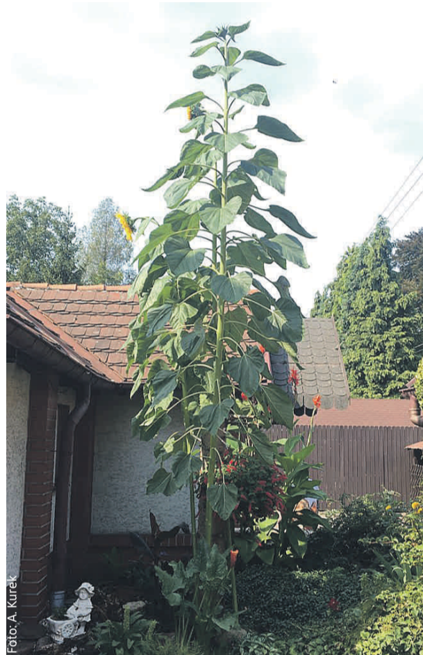
Słonecznik rośnie jak na drożdżach!

Ponad tysiąc kilometrów liczyła trasa Pielgrzymki Biegowej wiodącej od Şumuleu Ciuc w Rumunii na Jasną Górę w Częstochowie. Biegacze wyruszyli w nią 17 sierpnia, a zakończyli bieg 23 sierpnia.