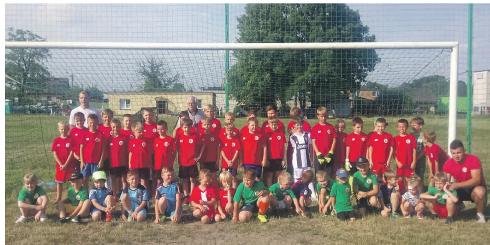
W „Naprzodzie” Żernica liczna jest reprezentacja najmłodszych zawodników.