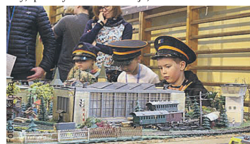
Pociągi kochają nie tylko najmłodszy...

– Zapraszamy na wielką imprezę rodzinną, święto fanów techniki kolejowej w miniaturze – zachęcają organizatorzy.