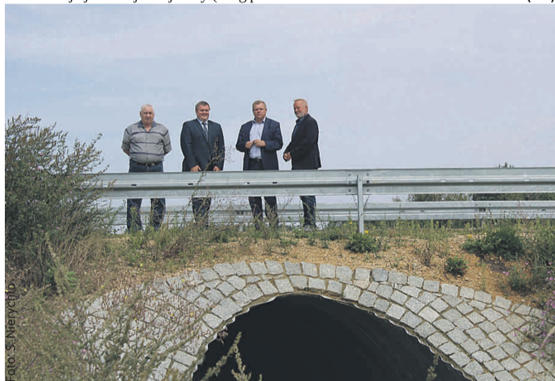
Samorządowcy wizytowali m.in. wyremontowany most w Ciochowicach.