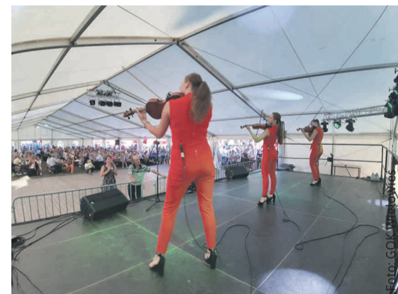
Publiczność zachwycił występ „Tria Appassionato”.