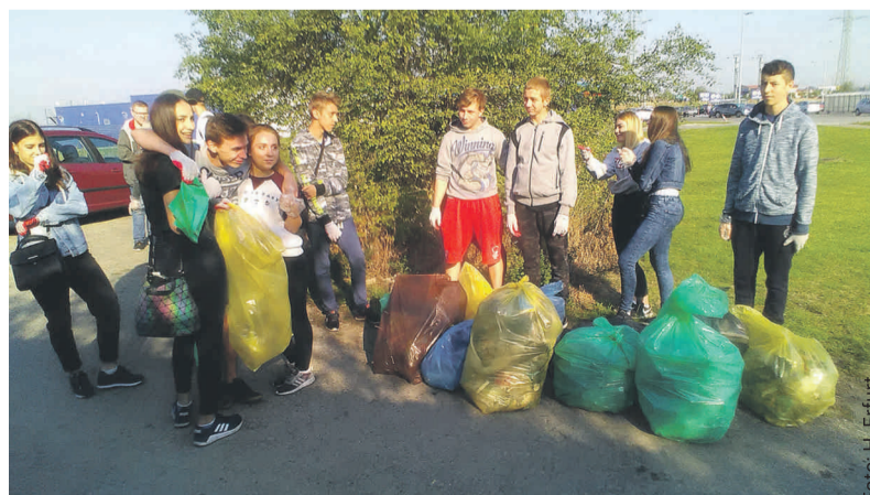
W akcję zawsze włączają się uczniowie powiatowych szkół – tak sprzątnęli w ub. roku w Knurowie.

w Pyskowicach, Dom Pomocy Społecznej „Ostoja” w Sośnicowicach, Dom Po-