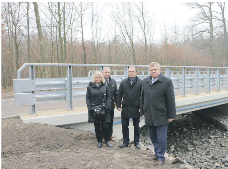
Most w Dąbrówce wzięli tuż po odbiorze prac przedstawiciele Powiatu Gliwickiego i Gminy Wielowieś.

Inwestycję prowadził Zarząd Dróg Powiatowych w Gliwicach, który w lipcu br. podpisał umowę z firmą Agal z Rybnika. Prace trwały do jesieni, a 22 listopada nastąpił odbiór robót. Wartość zadania wyniosła ponad 881 tys. zł. Powiat otrzymał na tę inwestycję dofinansowanie z rezerwy subwencji drogowej budżetu państwa w wysokości blisko 325 tys. zł, zaś Gmina Wielowieś wsparła ją kwotą 50 tys. zł. Resztę środków sfinansował Powiat Gliwicki.