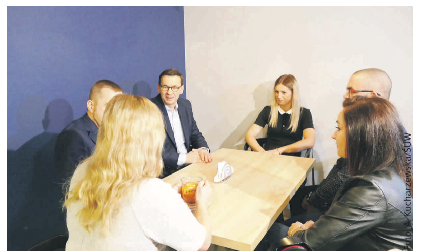
Przedsiębiorcy rozmawiali z premierem o projekcie nowych przepisów dotyczących opłat ZUS-owskich.

rych sztywna wysokość składek na ubezpieczenia społeczne to zbyt duże obciążenie.