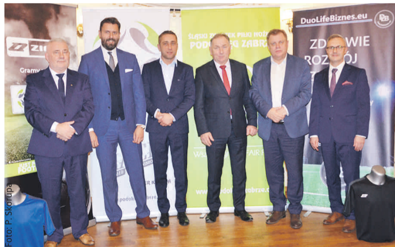
Reprezentanci gminy Wielowieś z obecnymi na gali przedstawicielami SZPN i Powiatu Gliwickiego.