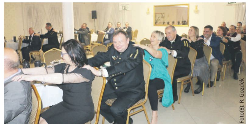
Spotkanie zakończyła wesoła zabawa.

Spotkanie barbórkowe Powiatu Gliwickiego sfinansowano m.in. z darowizny Fundacji JSW.