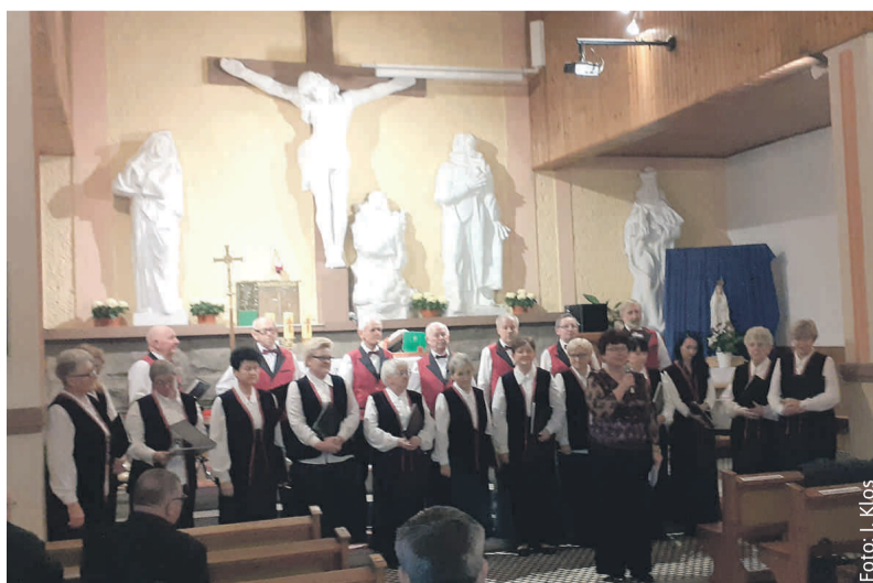
Podczas jubileuszowego koncertu w kościele Podwyższenia Krzyża Świętego w Żernicy.