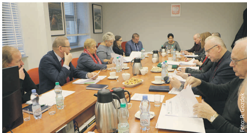
Rada skupia znawców spraw zatrudnienia z wielu różnorodnych dziedzin.

Rada obejmuje swym działaniem Miasto Gliwice oraz Powiat Gliwicki.