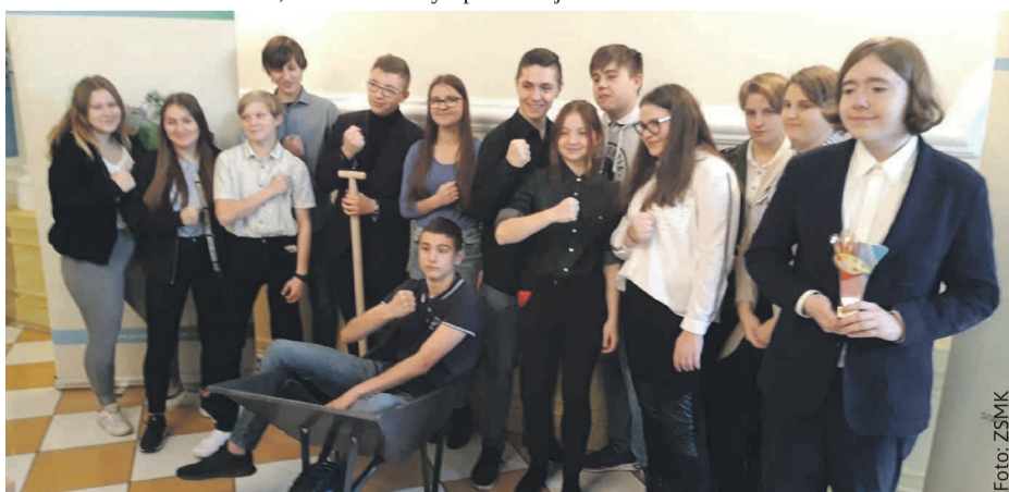
Placówki uczestniczące w akcji otrzymały m.in. sprzęt ogrodniczy – co, jak widać, ucieszyło bardzo młodzież.

„Zameczek” w Kuźni Nieborowskiej oraz Domu Pomocy Społecznej dla Dzieci i Młodzieży w Pilchowicach. Obejmowała sprzątnięcie w terenie oraz konkurs plastyczny, również skierowany do uczniów powiatowych szkół i mieszkańców DPS-ów.