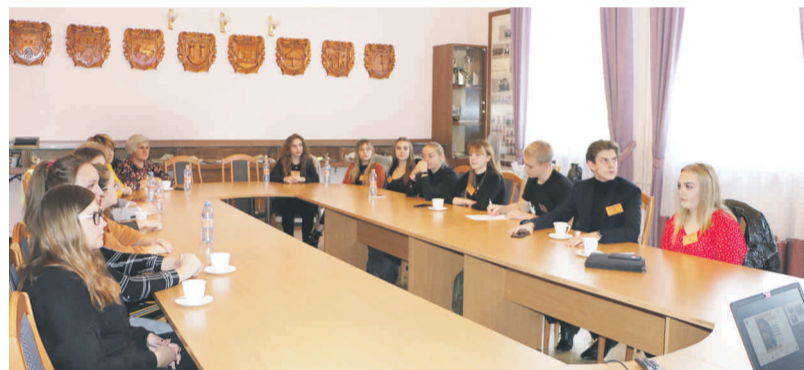
Uczestnicy konferencji z zainteresowaniem wysłuchali prelekcji na temat przemocy i krzywdzenia dzieci...