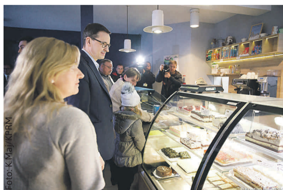
Mateusz Morawiecki w cukierni Surdel w Pilchowicach.

zł. Ma to pomóc zarówno przedsiębiorcom, którzy zaczynają swoją działalność, jak i tym, którzy już ją prowadzą. Zgodnie z nowymi przepisami, będą oni mogli płacić obniżone i liczone proporcjonalnie do dochodu składki na ubezpieczenia społeczne. Rozwiązanie to obejmie firmy, dla któ-