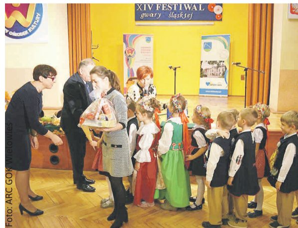
Obydwa festiwale cieszą się wielkim powodzeniem wśród dzieci i młodzieży.