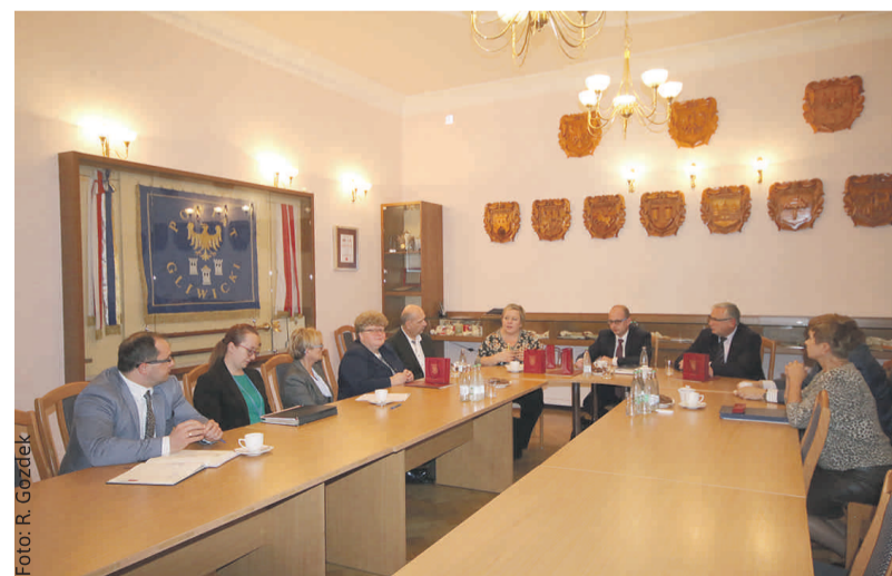
Członkowie rady przybliżyli problemy, jakimi zamierzają zająć się w tej kadencji.

w celu wymiany informacji o planowanych i realizowanych projektach na rzecz osób z niepełnosprawnością – in-