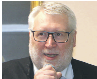
Starostowie naszych partnerskich powiatów zgodnie przyznali, że poznawanie wzajemnej tradycji, historii i kultury to warunek nawiązania prawdziwie przyjacielskiej współpracy.