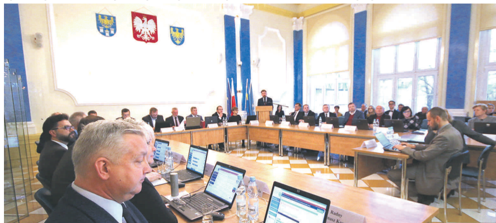
Radni wysłuchali m.in. informacji na temat inwestycji katowickiego oddziału Generalnej Dyrekcji Dróg Krajowych i Autostrad.

także nasza uchwała przyjmująca Program Współpracy Powiatu Gliwickiego z Organizacjami Pozarządowymi na 2020 r. Zależy nam, by organizacje te na terenie powiatu działały jak najlepiej.