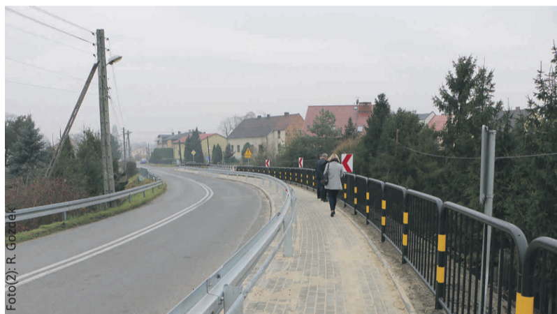
Chodnik w Paczynie leży na skarpie i wymagał dużych prac ziemnych.