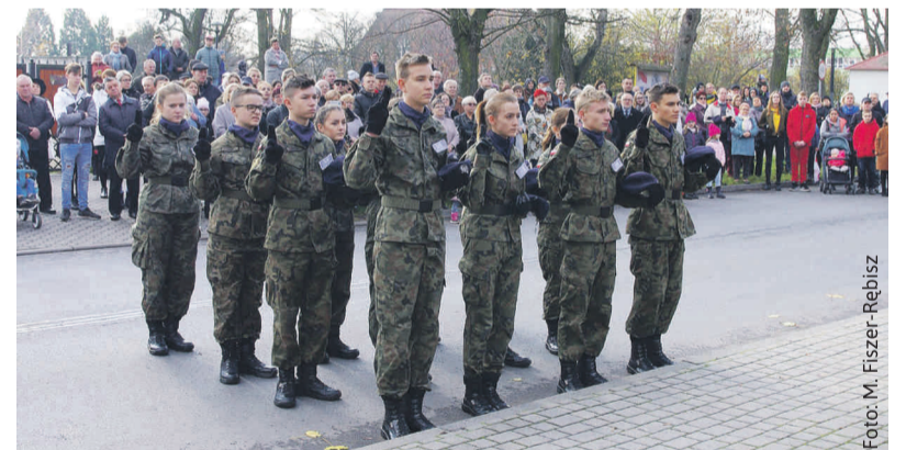
Tego samego dnia ślubowali ich koledzy i koleżanki z „mundurówki” w Pyskowicach.