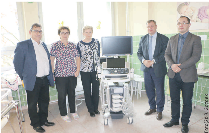
Nowoczesne urządzenie USG wraz z oprzyrządowaniem zaprezentowali samorządowcom prezes szpitala i ordynator Oddziału Noworodkowego.

monitory. Jest to drugi dar Wielkiej Orkiestry Świątecznej Pomocy dla tego szpitala w ciągu ostatnich lat – poprzednia dostawa sprzętu ratującego życie noworodków miała miejsce w ub. roku. – Nasz od-