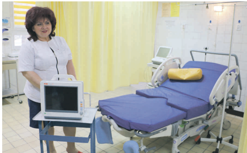
Dzięki takim łóżkom rodzi się lepiej – zapewnia oddziałowa położna.

Na Oddział Ginekologiczno-Położniczy i Oddział Noworodkowy trafił już także sprzęt ufundowany przez fundację Jerzego Owsiaka: pulsoksymetry, nowoczesne urządzenie USG wraz z oprzyrządowaniem, pompy infuzyjne i wagi dla noworodków, dwa inkubatory i kardio-