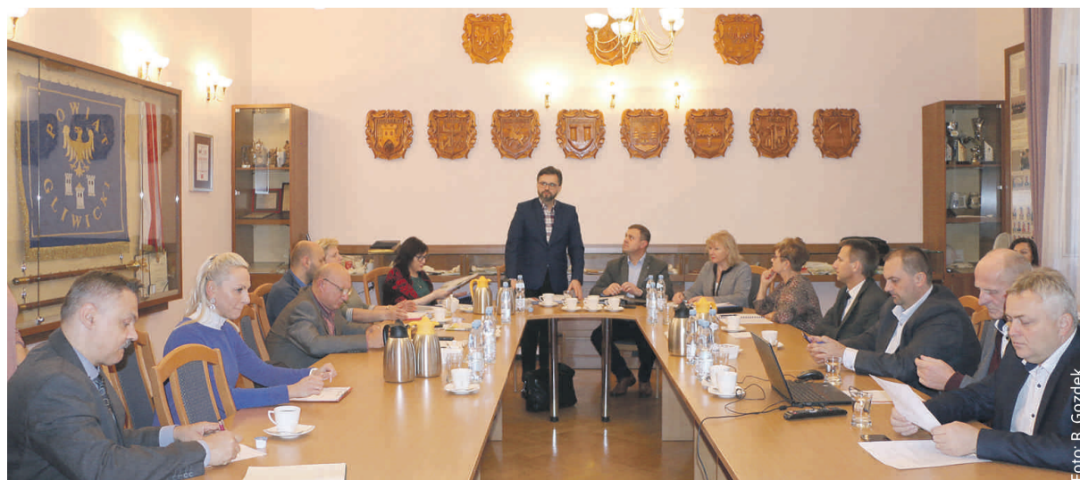
Wspólne posiedzenie Komisji Oświaty, Kultury i Sportu oraz Komisji Infrastruktury, Rolnictwa i Rozwoju.