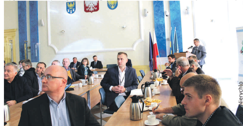
Przedstawiciele samorządów oraz kopalń działających na terenie powiatu omówili ważne dla mieszkańców kwestie skutków wydobycia węgla.

– Po raz kolejny zorganizowaliśmy spotkanie z przedstawicielami przedsiębiorstw górniczych na temat oddziaływania eksploatacji węgla kamiennego na tereny powiatu gliwickiego. Poruszone zostały bardzo istotne zagadnienia związane ze wstrząsą-