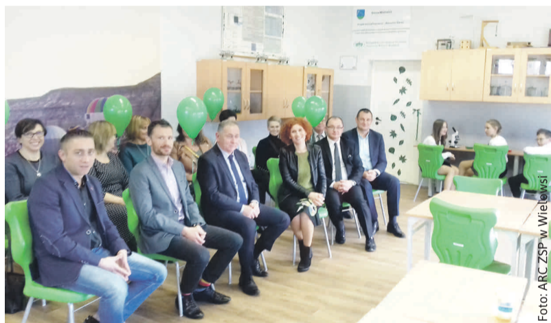
Podczas otwarcia nowej pracowni w ZSP w Wielowsi.