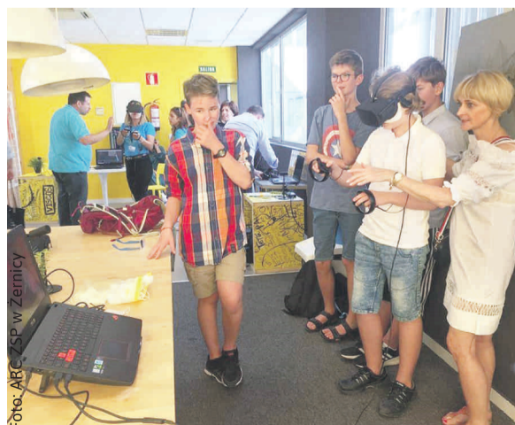
Podczas zajęć projektowych na Uniwersytecie w Maladze.