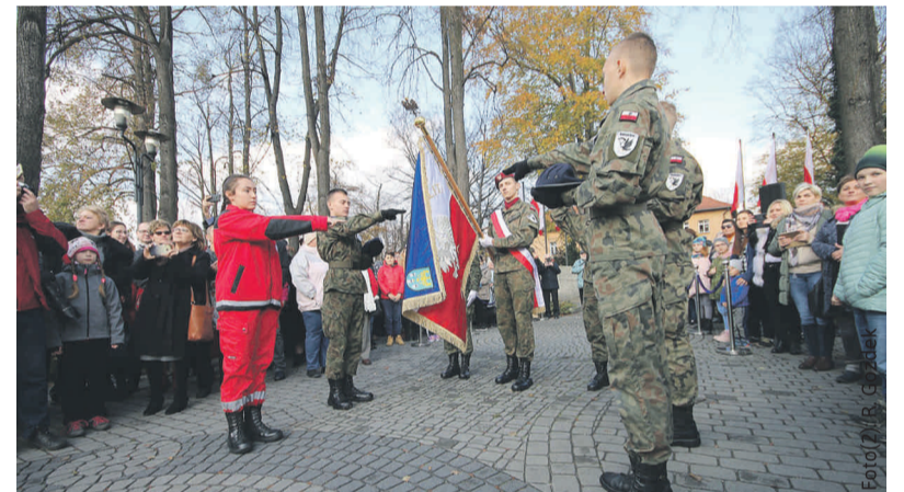
Uczniowie pierwszych klas mundurowych i ratownictwa medycznego złożyli przysięgę 11 listopada w Knurowie – na zdjęciu ich reprezentanci.