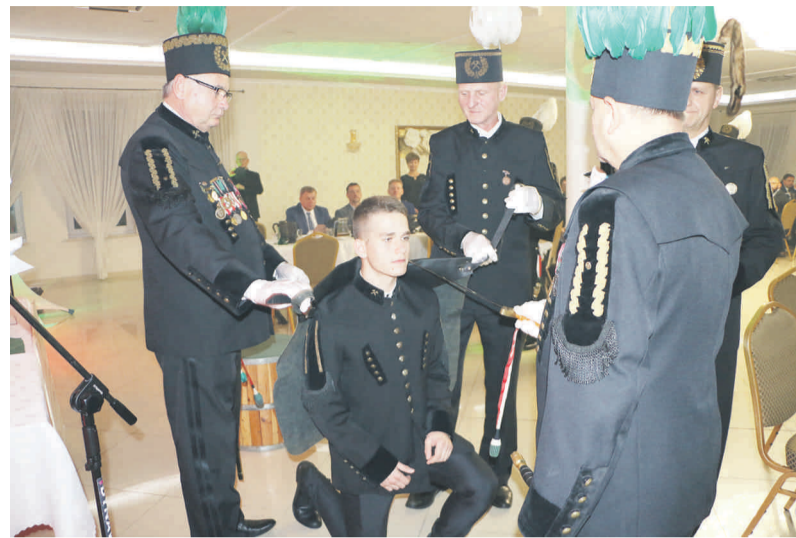
Po skoku przez skórę każdy uczeń był promowany na gwarka.