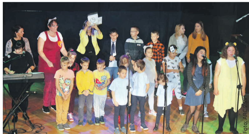
Występy młodych artystów bardzo podobały się publiczności.