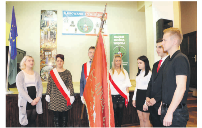
Ślubowanie przedstawicieli młodzieży na sztandar Cechu Rzemiosł Różnych i Przedsiębiorczości w Gliwicach.