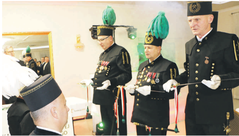
Wręczenie Honorowych Szpad Górniczych.

Zgodnie z tradycją na początku odśpiewano Hymn górniczy, wręczono Honorowe Szpady Górnicze, z godnością swe urzędy pełnili Prezes Biesiady Górniczej, jego zastępcy, Lis Major