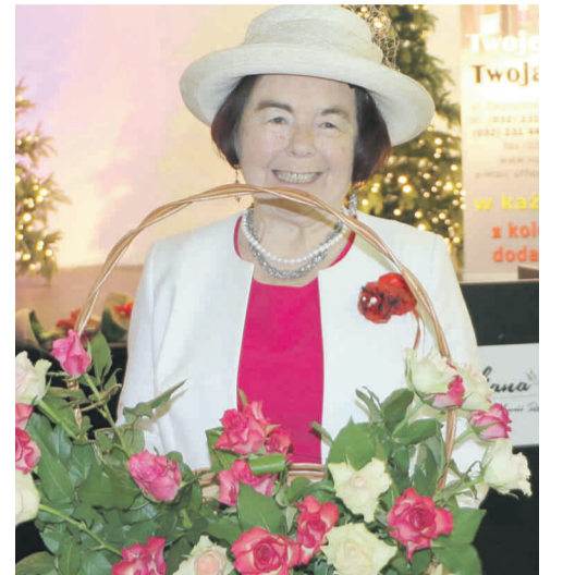
Pani doktor jest dobrze znana w Knurowie, gdzie leczy już trzecie pokolenie dzieci.

Laureatki plebiscytu odebrały szereg życzeń, m.in. od posłanki na Sejm RP