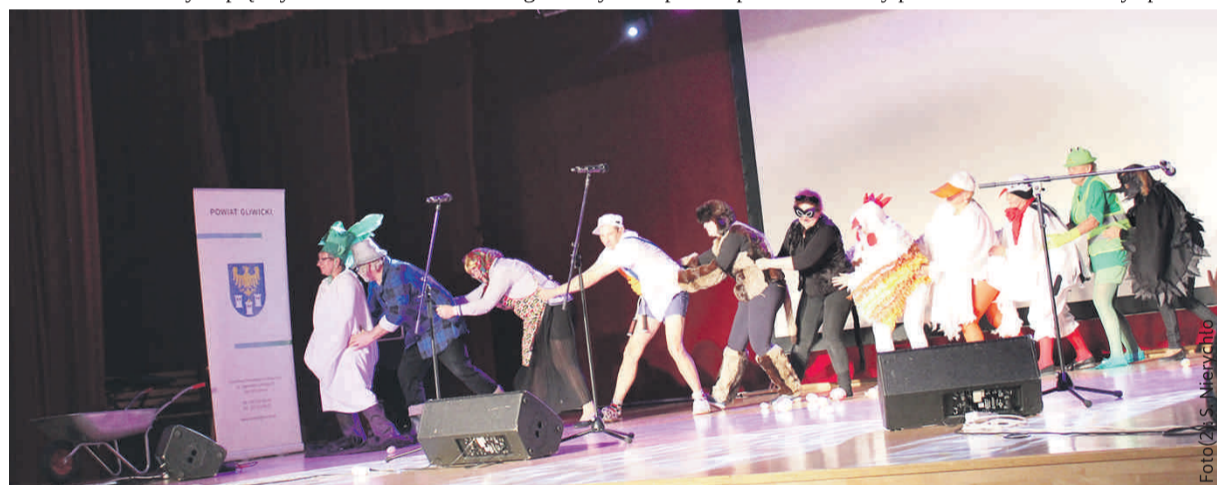
Bardzo podobała się „Rzepka po ślonsku” wystawiona przez KGW z Paniówek.