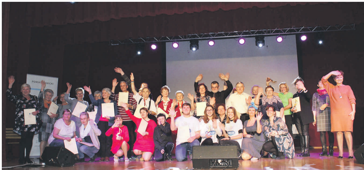
Radosne grono uczestników i organizatorów przeglądu.

Wspólny występ przygotowały połączone grupy „Tamburyn” i „UTEWUŚ” z UTW Knurów. Zaprezentowały program słowno-muzyczny pt. „Od mistrza Moniuszki do mistrza Młynarskiego”. Zespół „Wilczanki” z Wilczy w swym repertuarze zawarł pieśni m.in. patriotyczne i ludowe, nie zabrakło akcentów regionalnych. Oprócz śpiewa-