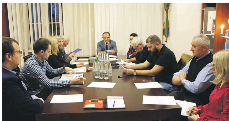
Podczas posiedzenia Rady Sportu Powiatu Gliwickiego.

W br. starostwo zorganizowało 4 cieszące się dużym powodzeniem imprezy sportowe, a w wyniku konkursu ogłoszonego przez powiat odbyły się 4 kolejne imprezy i jedna w trybie małych zleceń. Rada zaproponowała, by w 2020 r. starostwo zorganizowało jeszcze turniej