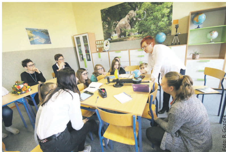
Zajęcia w „Konopnickiej” z użyciem tellurium – przyrządu będącego modelem ruchów Ziemi i Księżyca względem Słońca.