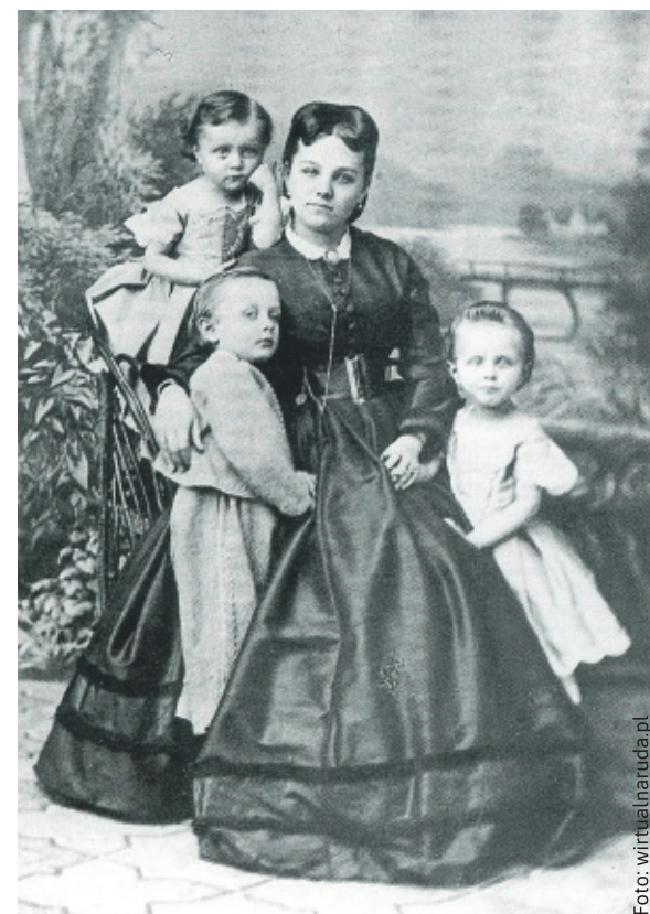
Bohaterka naszego tekstu z trójką ze swych czworga dzieci.