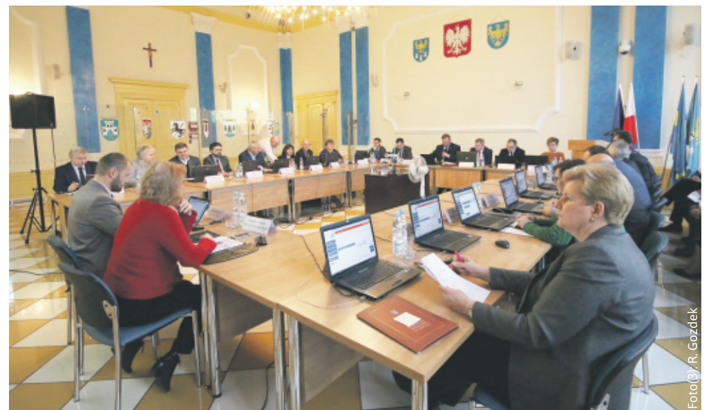
Radni w czasie styczniowej sesji Rady Powiatu Gliwickiego.