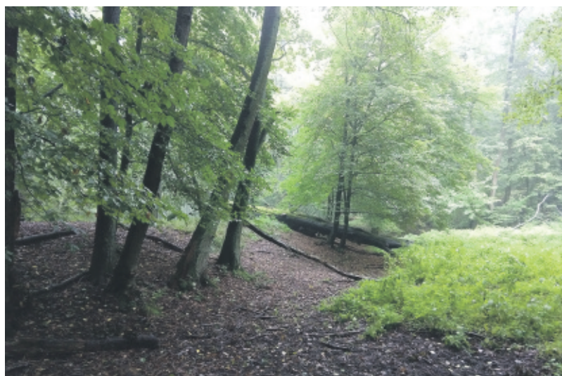
W tym miejscu na terenach leśnych w Kozłowie powstaną zbiorniki małej retencji, otoczone służącą wypoczynkowi infrastrukturą turystyczną.

WIESŁAW KUCHARSKI – nadleśniczy Nadleśnictwa Rudziniec