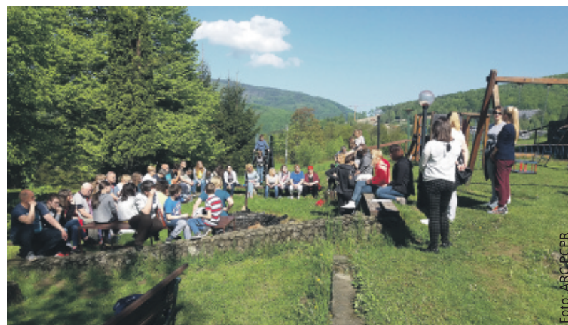
Wyjazd do Ustronia miał na celu wzmocnienie więzi rodzinnych, co szczególnie ważne jest w rodzinach zastępczych.