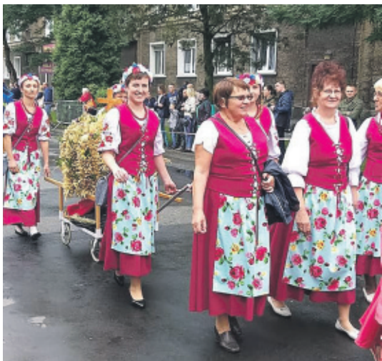
Tak prezentowało się KGW z Paczyny na dożynkach w Pyskowicach.

Ponad 80 członków liczy Koło Gospodyń Wiejskich w Paczynie, które powstało w 2018 r. Skupia w swoich szeregach nie tylko panie, ale również panów.