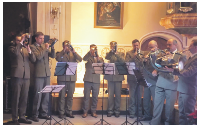
Spektakl miał wiele akcentów nawiązujących do życia lasu.

Punktem kulminacyjnym spektaklu było wniesienia przez Trzech Króli (leśnik, myśliwy, członek Bractwa Kurkowego) urodzinowego tortu oraz uformowanie w czasie granej i śpiewanej kolędy „Dziecino słodka”, krzyża z lampio-