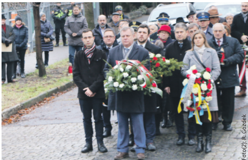
Hołd ofiarom Tragedii Górnośląskiej złożyli m.in. samorządowcy Ziemi Gliwickiej.

cy, wywiezieni na Sybir do morderczej pracy. Wielu z nich nie wróciło – mówili.