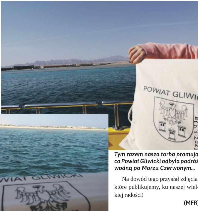
Tym razem nasza torba promująca Powiat Gliwicki odbyła podróż wodną po Morzu Czerwonym...