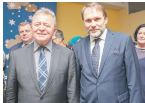
Gospodarze spotkania: (od lewej) komisarz Janusz Wojciechowski i poseł Grzegorz Lorek.

Było to spotkanie noworoczne, zorganizowane w Piotrkowie Trybunalskim przez posła na Sejm RP Grzegorza Lorka oraz Janusza Wojciechowskiego – europejskiego komisarza ds. rolnictwa i rozwoju wsi. Wzięli w nim udział samorządowcy z tego regionu, gdzie dominującą gałęzią gospodarki jest rolnictwo. Było to 23 wójtów, 2 wicewójtów, 5 burmistrzów, 1 wiceburmistrz, 4 prezydentów, minister, 5 posłów i 2 senatorów, a także kilku starostów,