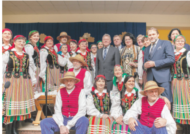
Spotkanie artystycznie wzbogacili twórcy ludowi z okolic Piotrkowa Trybunalskiego.

W połowie stycznia miałem okazję uczestniczyć w bardzo ciekawym spotkaniu, na którym wiele uwagi poświęcono m.in. perspektywom polskiego rolnictwa w kontekście rozwoju tej branży w krajach Unii Europejskiej.