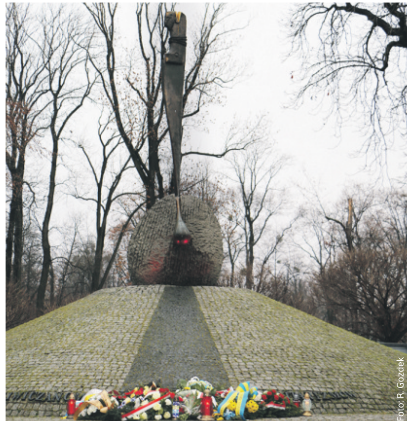
Wieńce, kwiaty i znicze pod pomnikiem Gliwiczanom Ofiar Wojen i Totalitaryzmów przy Parku Chopina w Gliwicach.

Tragedia Górnośląska obejmuje okres kilku lat od stycznia 1945 roku. W owym czasie górnośląski lud doznał szczególnego okrucieństwa ze strony armii sowieckiej oraz władz radzieckich, a następnie polskiej władzy ludowej.