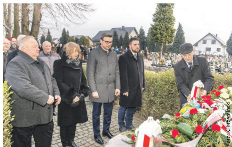
Pod pomnikiem Pamięci Poległych i Internowanych w Czasie II Wojny Światowej z Żernicy i Nieborowic w Żernicy.

od wyjazdu za Odrę. Ci, którzy pozostali w Ojczyźnie, swoim Heimacie, byli szykanowani w miejscach pracy, szkołach i urzędach. Ze szczególnym brakiem tolerancji spotkało się posługiwanie się w szkołach godką śląską, a w miejscach publicznych – językiem niemieckim. Powszechnym procedrem była przymusowa zmiana nazwisk i imion na polskobrzmiące. Te i wiele innych krzywd, których doznali Ślązacy i śląscy Niemcy, pozostawiło w nich głębokie rany, które trudno do dziś zagoić.