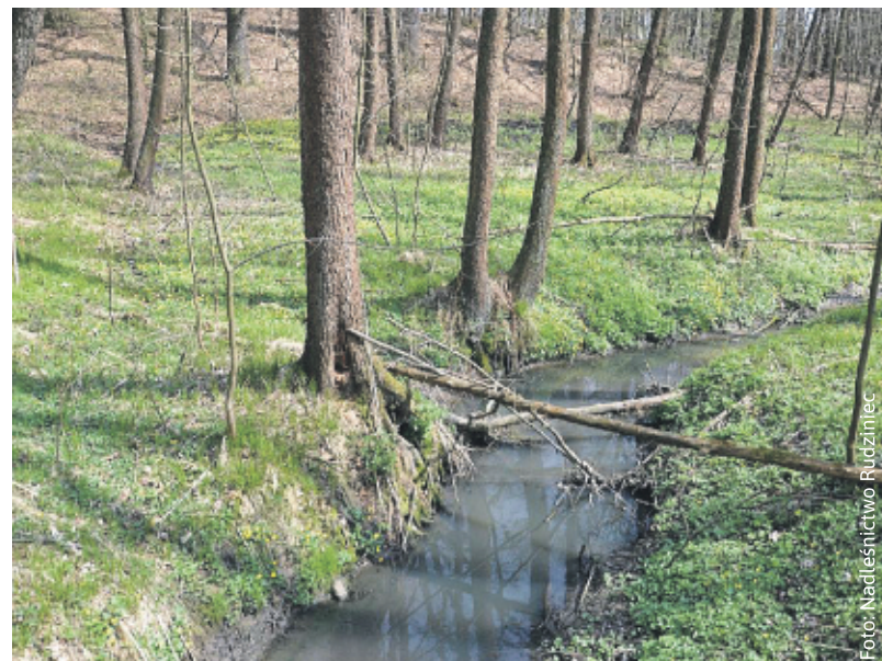
Malowniczy Potok Sierakowicki jest „zasilany” ściekami niewiadomego pochodzenia.

przepisów o ochronie środowiska oraz sprawuje nadzór nad realizacją obowiązków utrzymania czystości i porządku na terenie gminy. Wskazane zatem jest, aby informacje o zanieczyszczeniu potoku kierowane były przez zaniepokojonych obywateli bezpośrednio do właściwego organu – w tym przypadku Burmistrza Sośnicowic.