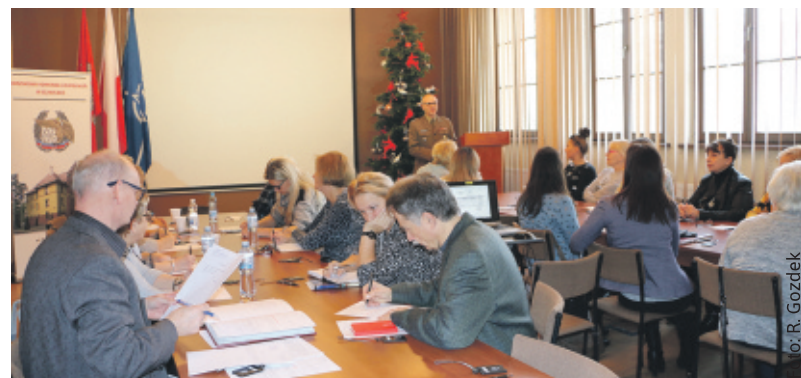
Rozpoczęcie kwalifikacji wojskowej poprzedziło szkolenie przygotowujące przedstawicieli organów samorządowych do jej przeprowadzenia.

Jako pierwsi do kwalifikacji wojskowej stawili się w tym roku mieszkańcy Toszka, którzy wezwani zostali do WKU 3-4 lutego. W następnych dniach wyznaczono stawiennictwo mieszkańców Knurowa: 4-7 i 10-12 lutego, gminy Gierałtowie: 12-14 lutego, Pyskowice: 14 i 17-18 lutego, gminy Pilchowice: 18-19 lutego, gminy Sośnicowice: 20-21 lutego, gminy Rudziniec: 21 i 24-25 lutego,