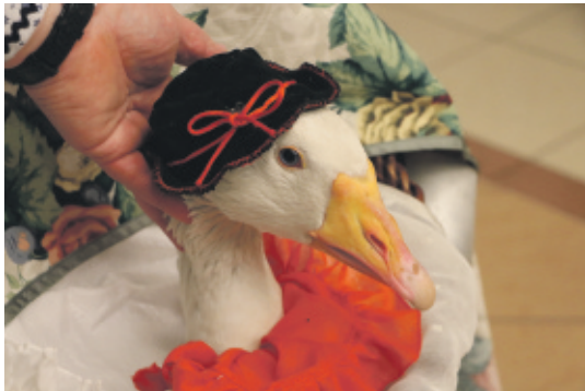
Zosia cały czas towarzyszyła swojej pani, grzecznie siedząc w koszyczku!

Przjechałaś sam dzisiaj z mojom kamratkom [2] . To je normalno gyńś. No bo wyście, to boło tak: moja Oma [3] i moja Mama tyz wdycko [4] chowali gyńsi. A gyńś se tak poradzi prziwionzać do czowieka jak pies. Styknie [5] zawołać: wal, wal, wal, a zarozki przileci. Ta moja gyńś, jak była mała, tak se do mie prziwionzała, a jo ji pszoła [6] , żech niy dała jom szkubać, no a co dopiyo na gnotek [7] ! Toż se tak poleku [8] żyje do dzisiaj. Mo już kupa lot i widać, że sie zestarzała: musi jom boleć biodro – bo ukuluje na jedna szłapka [9] , widza, że już i niy słyzy i na jedne łoko je ślepo. Bo to tyż tak i miyndzy ludziami bywo. Jo by śniom szła do jakigo dochtora łod tych boleści, ale kaj se ze gyńsiom ciś, jak ludzie latami czekajom do specjalistów! A eutanazji na ni niy zrobia!! Ale jo jom fleguja [10] i mo umie wyłomek [11] ; gnozdzo i futer [12] do końca życia. Łona mo sie tak, jakby była w "Domu Spokojny Starości".