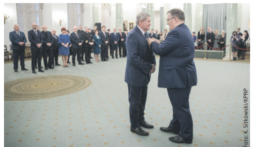
Uroczysta chwila wręczenia odznaczeń w Pałacu Prezydenckim w Warszawie.