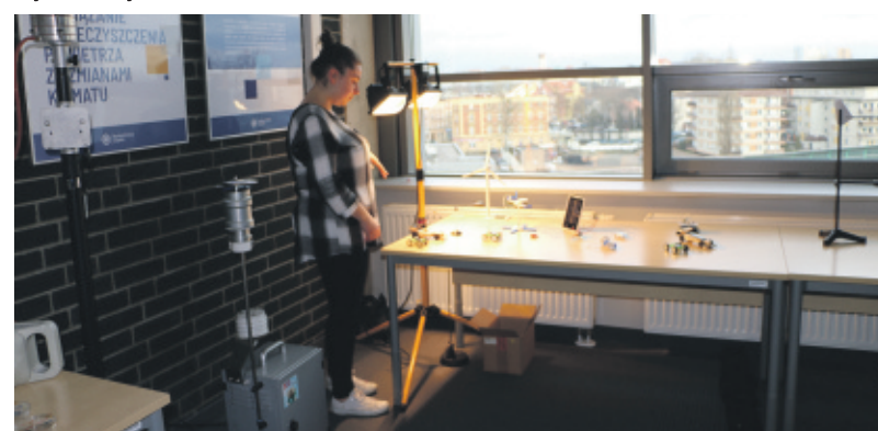
Centrum jest już przygotowane do prowadzenia badań.

Działania COKiŚ mają swoją genezę w 2014 r. w badaniach pracowników Instytutu Materiałów Inżynierskich i Biomedycznych, jednakże idea jego utworzenia narodziła się w 2018 r. podczas