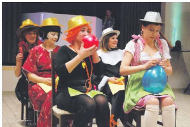
Wesołym konkursom, zabawom, tańcom i biesiadowaniu nie było końca...