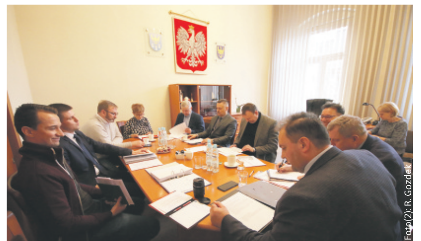
Podczas posiedzenia Komisji Ochrony Środowiska i Energii.

tualnego magazynowania poprzez oddawanie wytworzonych nadwyżek do sieci elektroenergetycznej w celu odebrania jej w okresie, gdy jest potrzebna. Lecz magazynem energii mogą być również instalacje produkujące wodór, który może być paliwem dla samochodów, ciepłownictwa, jak i mobilnym magazynem energii. Członkowie komisji mieli możliwość zapoznania się z zasadą działania stacji produkującej wodór oraz samochodu napędzanego tym paliwem. Największy problem komisja zauważyła w braku planowania energetycznego