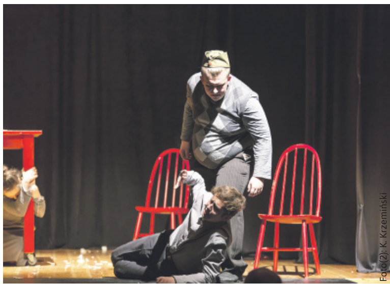
Spektakl „Jo był ukradziony” przypomniał tragedię mieszkańców Górnośląska.

W tym roku Pilchowice podzieliły się ziemią z Doniecka, na której życie straciło tysiące deportowanych Górnoślązaków. Pamięt-