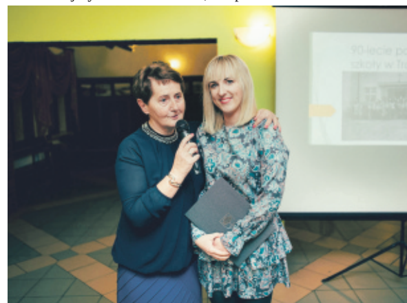
Podczas jubileuszu 90-lecia poświęcenia szkoły w Trachach.

bierańców dla dzieci, festyn rodzinny, ogniska integracyjne, jubileusz 90-lecia poświęcenia szkoły, mikołajki. Prowadzone są darmowe zajęcia taneczne dla dzieci przez profesjonalną instruktorkę oraz aerobik dla dorosłych.