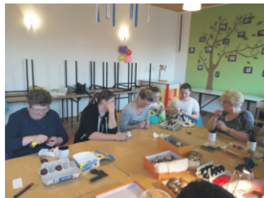
Podczas warsztatów, zorganizowanych przez Koło.