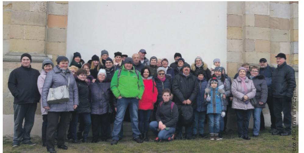
Wspólna wycieczka członków i sympatyków KGW oraz ich rodzin.

Dzięki środkom z dofinansowania Agencji Restruktury-