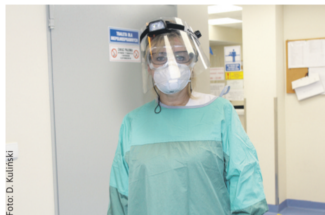
Ze szczególnym poświęceniem pracuje obecnie personel medyczny.

Obostrzenia wpłynęły też na wydawanie naszego miesięcznika. W kwietniu nie ukazały się „Wiadomości Powiatu Gliwickiego”, bowiem niemożliwy był ich kolportaż, oparty o rozprowadzanie