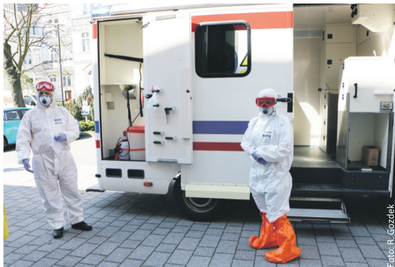
Załoga ambulansu pobierającego wymazy.

Umowa została zawarta w celu zapobiegania, przeciwdziałania i zwalczania COVID-19, mając na uwadze kompetencje powiatu do wykonywania zadań związanych z ochroną zdrowia mieszkańców. Powiat podjął się tego zadania w związku z licznymi głosami mieszkańców informujących o długim okresie oczekiwania na przeprowadzenie testu. Interweniowali w tej sprawie także u starosty radni Rady Powiatu Gliwickiego. W kwietniu, jak informuje firma MS