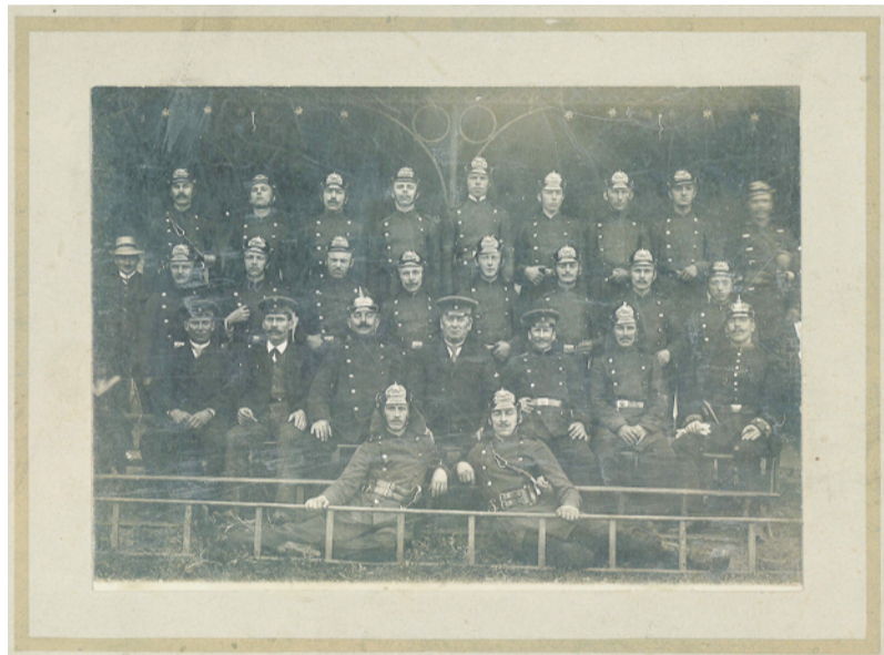
Wiejska Straż Pożarna w Żernicy w 1910 r.