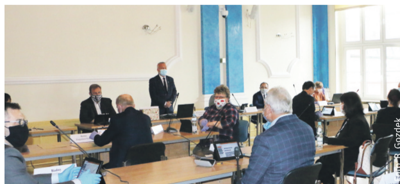
Radni podczas kwietniowej sesji Rady Powiatu Gliwickiego.

bezpieczeństwa, pomimo rozluźniania przez rząd RP niektórych obostrzeń. Proszę o ograniczenie do minimum kontaktów z innymi osobami, pozostawanie w kręgu tylko najbliższych, zachowywanie bezpiecznych odległości w kontaktach międzyludzkich oraz poprawne noszenie maseczek. Nie narażajmy siebie i innych na potencjalne ryzyko.