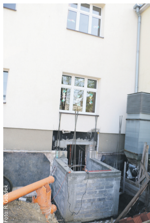
Powiat prowadzi zaplanowane inwestycje – na zdjęciu budowa windy przy ZSS w Knurowie.

Powoli do normalnej działalności wracają nasze placówki zdrowia – ZOZ w Knurowie oraz szpitale w Knurowie i Pyskowicach. Od połowy marca praca w przychodniach była w dużej mierze oparta na poradach telefonicznych, a szpitale działały w trybie ostrych dyżurów. Teraz to się zmienia.