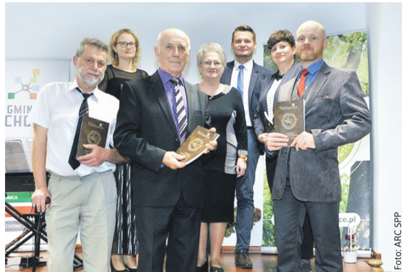
Stowarzyszenie Pilchowiczanie Pilchowiczanom znane jest m.in. z działalności publicystycznej i wydawniczej.

Stowarzyszenie Pilchowiczanie Pilchowiczanom (SPP) działa od 2008 r. Może się pochwalić licznymi działaniami, z których zdecydowana większość to imprezy cykliczne organizowane już od wielu lat. Są to m.in. Gminny Konkurs Poezji Rodzimej im.