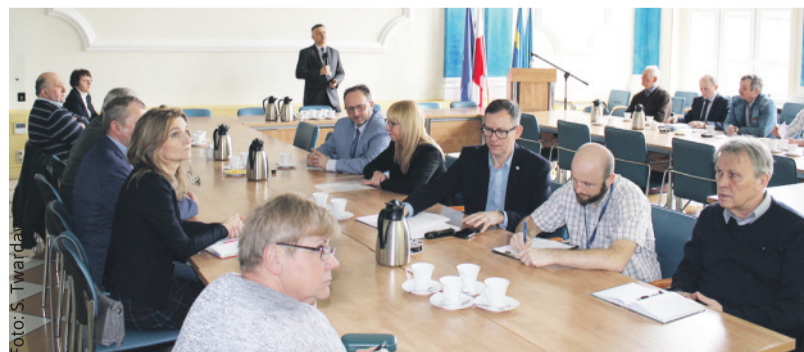
Podczas spotkania w starostwie.