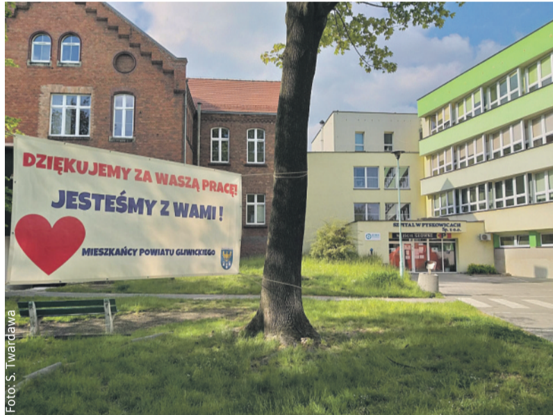
Przed naszymi szpitalami zawisły banery dodające ich pracownikom tak potrzebnej teraz otuchy.