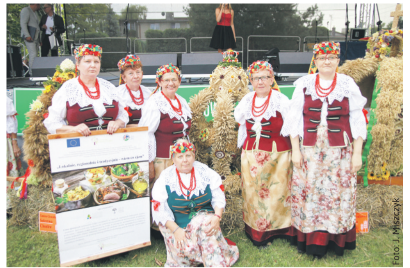
Gierałtowski Koło Gospożynie Wiejskich podczas dożynek gminnych, które corocznie współorganizuje.

ks. K. Damrota, Koncert Młodych Talentów, Jarmark Bożonarodzeniowy, Jarmark Wielkanocny, Targi Wolnego Cza-