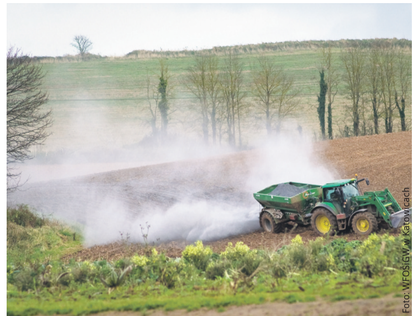
Wapnowanie jest skutecznym sposobem na przeciwdziałanie nadmiernemu zakwaszeniu pól.