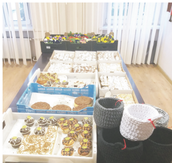
Ciasta, kwiaty i koszyczki ofiarowane na szlachetny cel przez firmy z gminy Pilchowice.