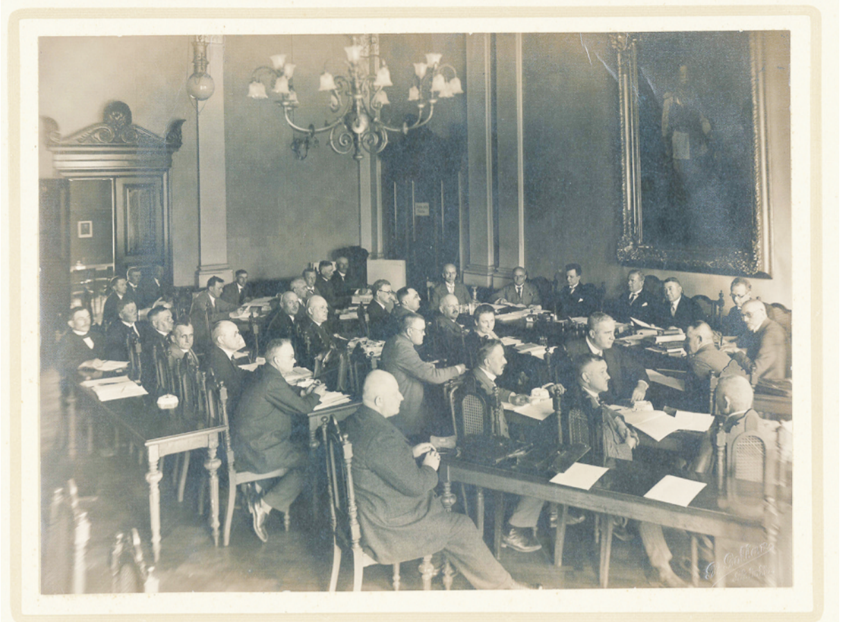
Kreistagssitzung des Kreises Tost-Gleiwitz am 13. Mai 1929.

w Urzędzie Gminy, gdzie społecznie prowadził sprawy finansowe. Zajmował różne stanowiska w Związku Polaków w Niemczech oraz w jego organizacjach gospodarczych, szczególnie na terenie powiatu toszecko-gliwickiego. Przez wiele lat był radnym Rady Powiatu Toszecko-Gliwickiego z ramienia Polsko Katolickiej Partii Ludowej, stawiając sobie za cel obronę ludności mniejszościowej. Po dojściu do władzy partii faszystowskiej został pozbawiony wszystkich zajmowanych stanowisk, w tym również pracy w Urzędzie Gminy. Pod groźbą utraty życia jego i całej rodziny starano