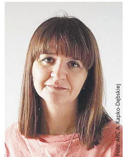
Ania nie ma szans na leczenie bez naszego wsparcia.

Powyższe akcje to piękne gesty dobrej woli i wielkiego serca wielu osób i firm. Jednak to wciąż kropla w morzu potrzeb.