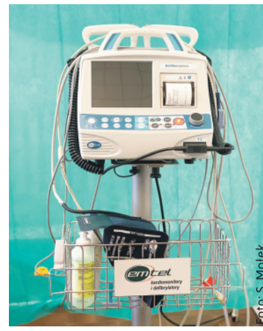
Defibrylator zakupiony ze środków powiatu dla Szpitala w Knurowie.

Dodatkowo powiat wyasygnował pieniądze na zakup środków niezbędnych do walki z koronawirusem – maseczek, rękawic, środków dezynfekujących itp. Szpital w Knurowie otrzymał na ten cel 34 tys. zł, Szpital w Pyskowi-