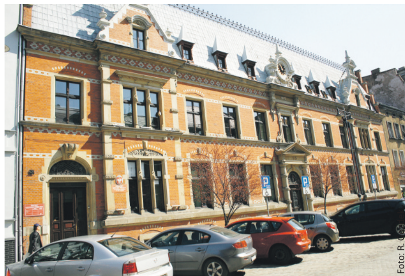
Powiatowy Urząd Pracy w Gliwicach – oprócz swej normalnej działalności – prowadzi obecnie również zadania w ramach Tarczy Antykryzysowej.

Dyrekcja PUP ma świadomość, że jesteśmy ciągle na początku drogi, bowiem informacje napływające na temat czasu dalszego trwania pandemii nie napawają optymizmem. – Będziemy stale dokładać wszelkich starań, żeby sprostać wyzwaniom, które niesie ze sobą ten nad-