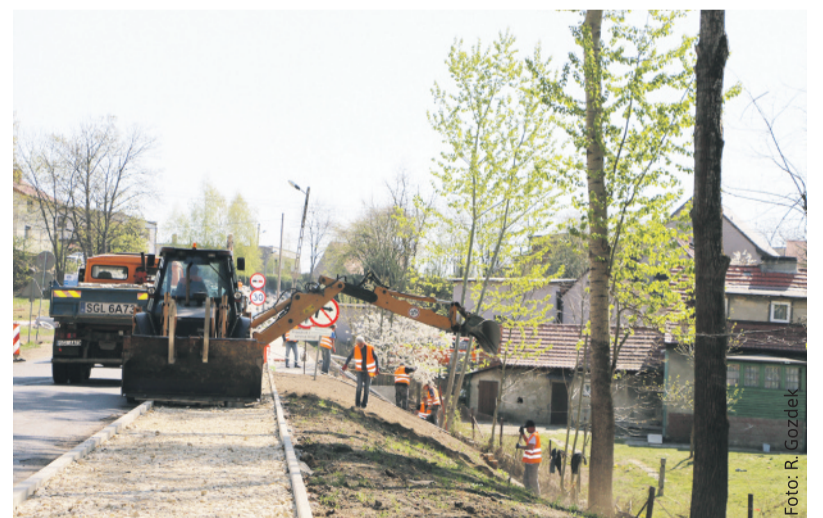
Trwa przebudowa ul. Wiejskiej w Smolnicy, gdzie powstaje też wygodny ciąg pieszo-rowerowy.

Tegoroczne powiatowe inwestycje drogowe mimo stanu epidemii prowadzone są zgodnie z planem. Niedawno zakończył się remont nawierzchni drogi w Pławniowicach, wiodącej z Niewieszy w stronę pałacu. Trwa kolejny etap przebudowy ul. Wiejskiej w Smolnicy wraz z budową chodnika i ścieżki rowerowej. W tym roku przebudowany zostanie również następny