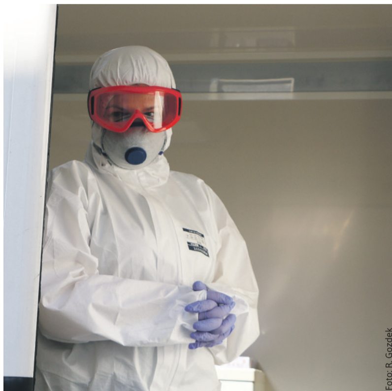
Aby pracownicy medyczni byli bezpieczni, muszą być odpowiednio zabezpieczeni przed koronawirusami.

Środki przekazane przez fundusze przeznaczone zostaną na zbiórkę, trans-