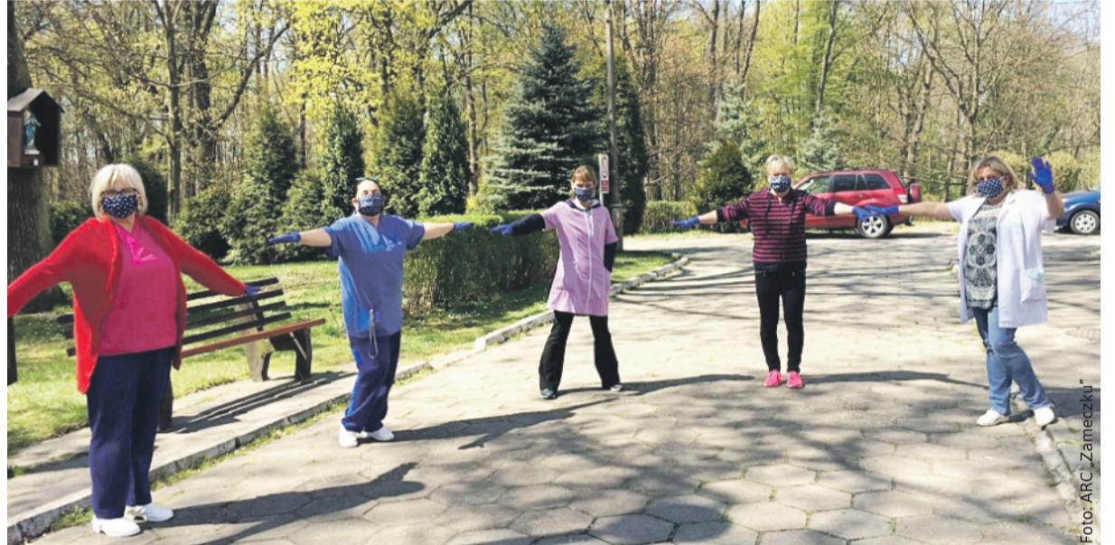
Tak cieszyły się pracownicy DPS-u „Zameczek” w Kuźni Nieborowskiej z ofiarowanych im maseczek.

Już w pierwszych dniach zagrożenia ruszyli z pomocą dla szpitali, domów pomocy społecznej, placówek oświatowych oraz mieszkańców wymagających wsparcia. Wciąż ich przybywało i jest ich już bardzo, bardzo dużo. Nie sposób wymienić tu wszystkich pomagających ani opisać wsparcia, jakie ofiarowali i nadal ofiarują potrzebującym. Na bieżąco piszemy o tym na stronie internetowej Powiatu Gliwickiego. Tu tylko