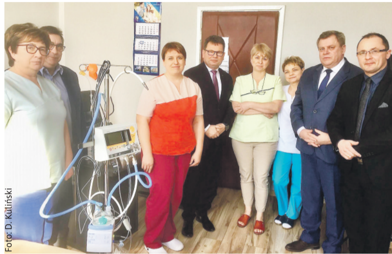
Przekazanie aparatu do nieinwazyjnego wspomagania oddechu noworodka w Szpitalu w Pyskowicach.