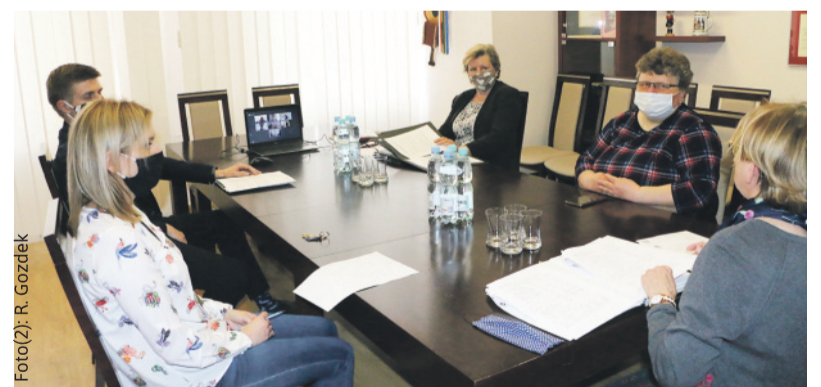
Posiedzenie Komisji Zdrowia i Wsparcia Rodziny – w starostwie obecna była tylko przewodnicząca komisji, jedna radna i towarzyszący im urzędnicy, a reszta radnych porozumiewała się z nimi łączami internetowymi.

nich ustosunkowywać. Najważniejszą sprawą obecnie jest sytuacja związana z epidemią koronawirusa, więc zainteresowanie naszej komisji koncentruje się wokół jednostek ochrony zdrowia, szpitali, tak aby personel był w taki sposób zabezpieczony, aby nie przenosić tego wirusa. Dotyczy to również domów pomocy społecznej, które zadziały w porę i w należyty sposób, aby chronić swoich mieszkańców. Dzięki temu nie mamy w nich żadnego zachorowania na dzień dzisiejszy i oby tak zostało! Obecnie rola powiatu jest taka, aby niczego w placówkach ochrony zdrowia, jak również w DPS-ach nie zabrakło – dotyczy to odzieży ochronnej, środ-