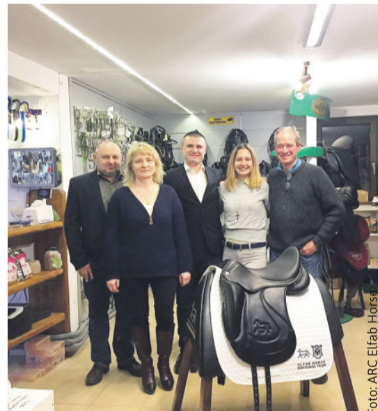
Elfab Horse znany jest z doskonałych siodła do jazdy konnej.