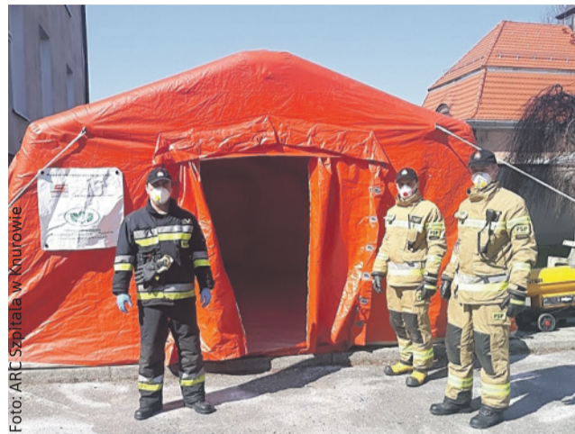
Strażacy tuż po zamontowaniu namiotu izolacyjnego na terenie Szpitala w Knurowie.

magane jest szybkie działanie, dyspozycyjność, kompetencje, zdecydowanie i odwaga. Niebagatelne znaczenie ma także specjalistyczny sprzęt, jakim dysponuje straż pożarna. Podczas zagrożenia koronawirusem, z jakim mamy do czynienia już od ponad dwóch miesięcy, strażacy zawodowi czy formacje ochotnicze nigdy nie odmówiły nam jakiegokolwiek wsparcia czy po-