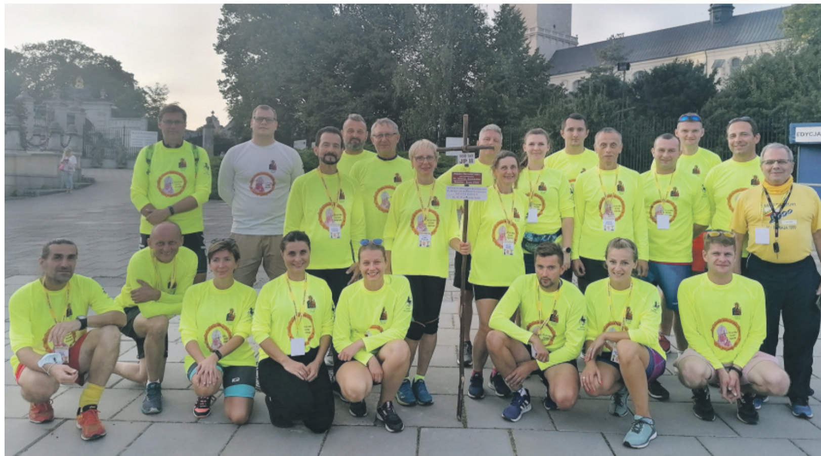
Zmęczeni, ale szczęśliwi. Uczestnicy zaraz po dotarciu do celu.

'Jeszcze będzie pięknie, mimo wszystko. Tylko załóż wygodne buty, bo masz do przejścia całe życie' - te słowa św. Jana Pawła II, wciąż tak aktualne, stały się inspiracją Sztafety Biegowo-Rowerowej dla uczczenia 100. rocznicy urodzin Ojca Świętego Jana Pawła II, która odbyła się w dniach 11-13 września.