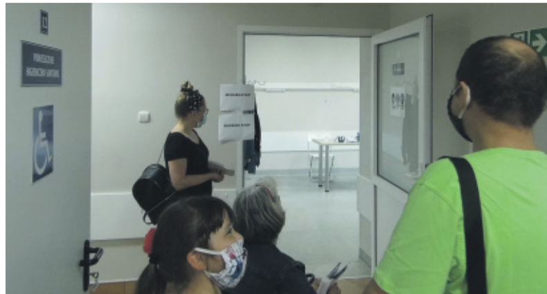
Spora liczba atrakcji wpłynęła na ilość udzielonych porad.

Zdrowie powinno być najważniejsze. Ciągły pośpiech i notoryczny brak czasu to powody, dla których wielu ludzi je zaniedbuje. Brak regularnych badań oraz czasu na wizytę u specjalisty powoduje, że może być za późno na profilaktykę. Szpital w Knurowie zorganizował wydarzenie pod nazwą „Biała Niedziela” dla mieszkańców, która odbyła się 13 września. Tego dnia każdy, bez względu na wiek mógł przyjść na bezpłatne badania oraz konsultacje specjalistyczne. W ciągu tygodnia wielu z nas nie ma nawet chwili, natomiast niedziela jest doskonałą okazją, by poświęcić kilka godzin na dokładne sprawdzenie stanu swojego zdrowia.