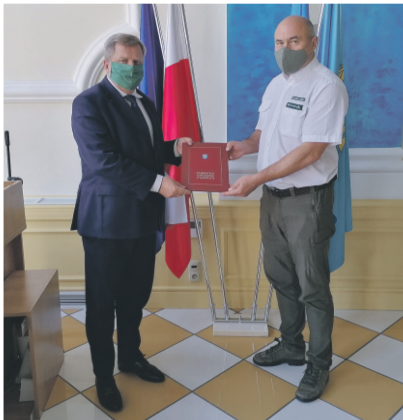
Podpisanie Porozumienia dokonano w Starostwie Powiatowym w Gliwicach.