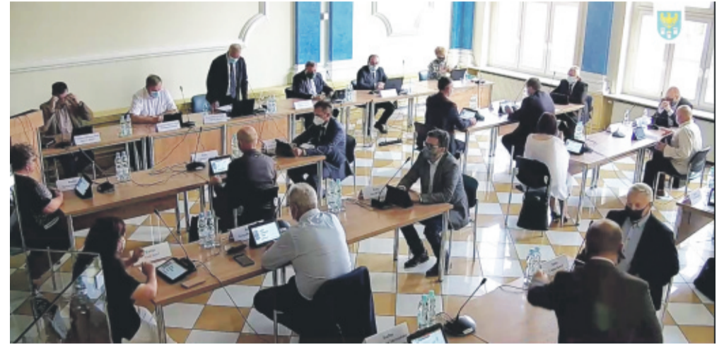
Wrześniowa sesja Rady Powiatu Gliwickiego.

Jak co roku Rada Powiatu Gliwickiego podjęła uchwałę w sprawie ustalenia wysokości opłat za usunięcie i przechowywanie pojazdów usuniętych z dróg na obszarze Powiatu Gliwickiego oraz wysokości kosztów powstałych w razie odstąpienia od usunięcia pojazdu w 2021 rok. Jest to jedna z bardziej kontrowersyjnych uchwał.