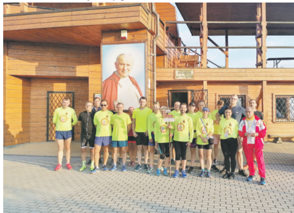
Przy Muzeum Św. Jana Pawła II w Starym Sączu.