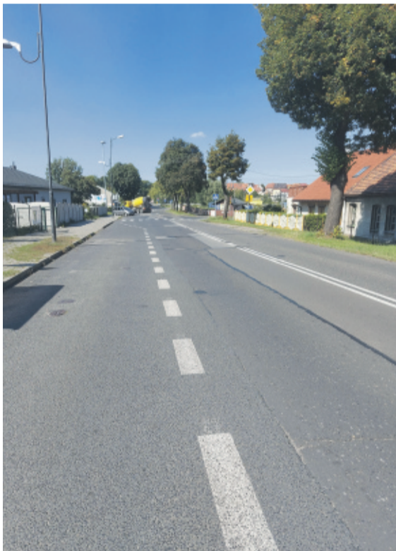
Przebudowa drogi powiatowej Nr 2985S przy ul. Powstańców Śląskich w Pyskowicach to bardzo wyczekiwana inwestycja ze strony mieszkańców.

które stałyby się bestsellerami. Wspomnieć przy tym muszę, że w Nieborowicach znajduje się Pomnik ku czci ofiar pomordowanych przez Niemców w obozie przejściowym w 1939 r. Wspominając daty, czuję się w obowiązku zachęcić Państwa do lektury artykułu o biegu upamiętniającym Bitwę Warszawską, którego uczestnikami są kontynuatorzy tradycji wojskowych, czyli przede wszystkim uczniowie klas mundurowych.