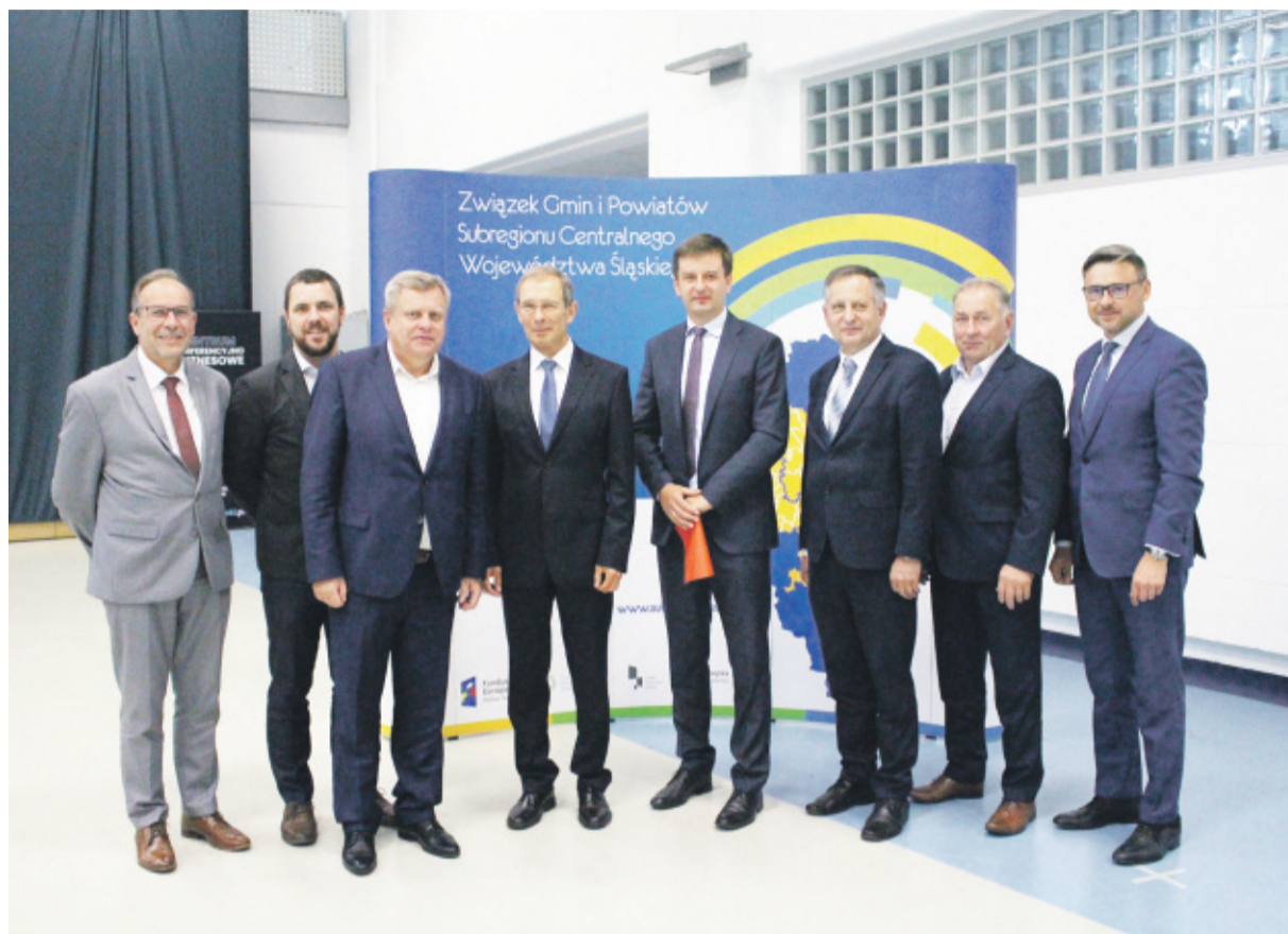
Na zdjęciu starosta gliwicki i wóldarze gmin powiatu gliwickiego z byłym i obecnym przewodniczącym Zarządu Związku.

Przypomnijmy, że Związek Subregionu Centralnego jest samorządnym stowarzyszeniem gmin i powiatów, powołanym przede wszystkim do pełnienia funkcji Związku ZIT w odniesieniu do Zintegrowanych Inwestycji Terytorialnych, realizowanych w ramach Regionalnego