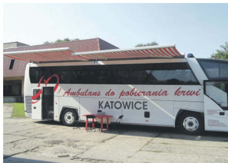
Specjalistyczne autobusy do pobierania krwi to coraz częstszy widok na naszych ulicach.

W najbliższym okresie mieszkańcy powiatu gliwickiego będą mogli oddać krew w następujących miejscach: