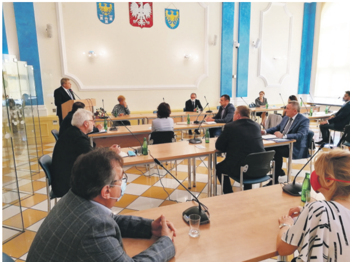
Konferencja zgromadziła także przedstawicieli wszystkich gmin powiatu gliwickiego.

na koronawirusa "drive-thru" to forma badania na obecność SARS-CoV-2. Wystarczy, że pacjent pojedzie do wyznaczonego przez sanepid mobilnego punktu, aby bez konieczności wysiadania z samochodu pobrać od niego wymaz do badania.