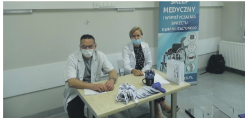
Pacjenci bardzo chwalili sobie dostępność specjalistów.