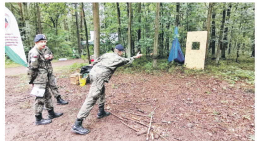
Uczniowie klas mundurowych mogli wziąć udział w rzucaniu granatów do celu.