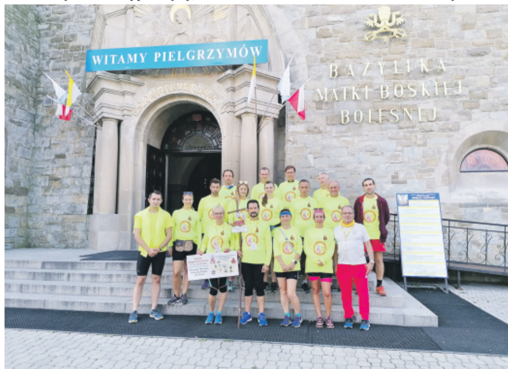
Przy Sanktuarium Matki Bożej Bolesnej w Limanowej