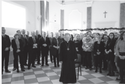
...na spotkaniu opłatkowym w starostwie...