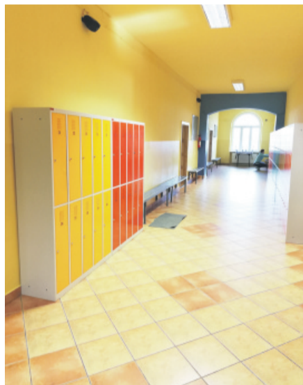
Odnowiony korytarz na drugim piętrze szkoły – tu postawiono na ciepłą kolorystykę i wygodę uczniów.

bezpieczającą i pomalowano w ciepłych, przyjaznych kolorach. Tutaj, podobnie jak w holu i radiowęzle, wyeksponowano kolorystycznie łuki i pilastry zdobiące długi korytarz. Całości dopełniły kolorowe szafki ubraniowe dla uczniów i nowe lampy oświetleniowe.