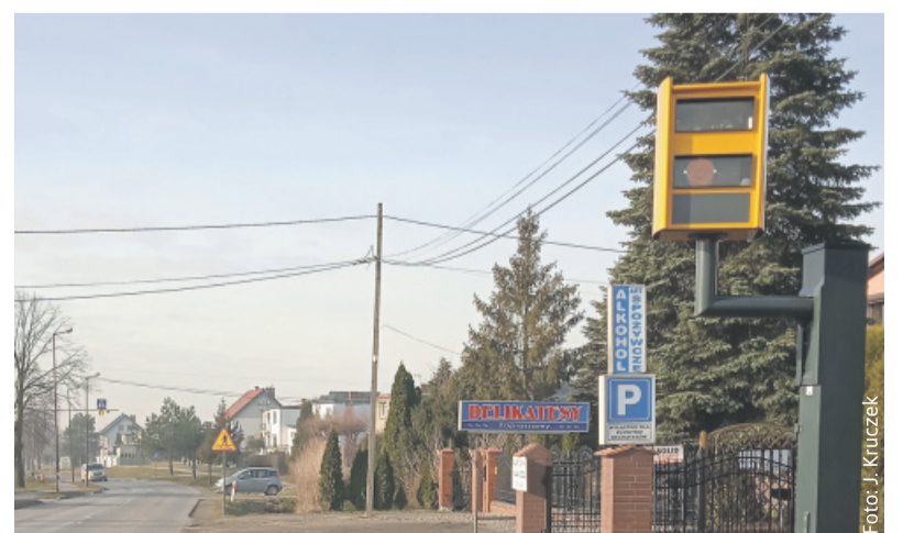
Radar skutecznie dyscyplinuje kierowców.