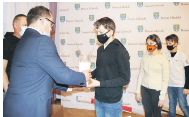
Była okazja do gratulacji i życzeń dalszych sukcesów.