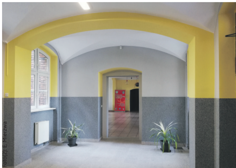
Wykonując remont zadbano o połączenie tradycyjnej architektury z nowoczesnością.

Opisując zmiany w Konopnickiej, nie sposób pominąć odnowionego korytarza na drugim piętrze głównego budynku. Otrzymał on zupełnie nowy wygląd, po tym jak wzmocniono jego ściany siatką za-