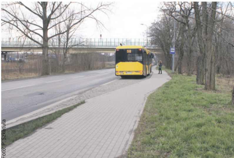
Takie zatoczki autobusowe są z obu stron ul. Dworcowej.

Trudności w dotarciu do przystanku nie dotyczą już mieszkańców Farskich Pól w Knurowie. Na ul. Dworcowej w pobliżu skrzyżowania z ul. Rybną oddany został niedawno do użytku dwukierunkowy przystanek autobusowy.