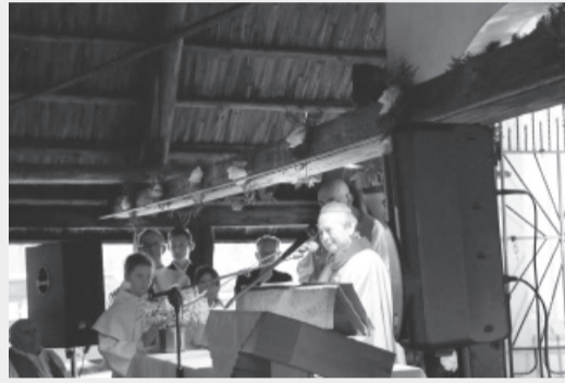
...w Magdalence, przy odprawianiu mszy św. za strażaków i leśników...