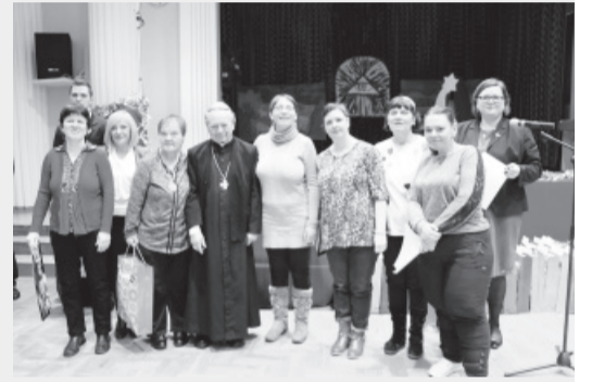
...z mieszkankami DPS-u „Ostoja”, którym gratulował udanego przedstawienia jasełkowego.