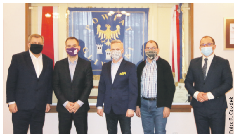
Przedstawiciele Powiatu Gliwickiego i Śl. ZPN spotkali się w starostwie.