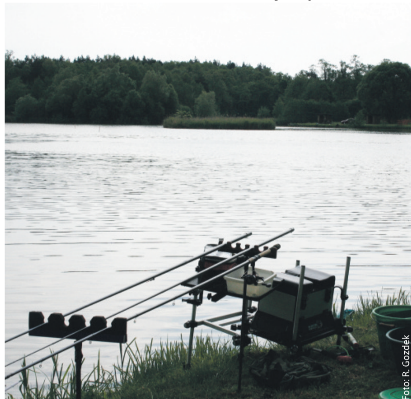
W naszym powiecie wędkarzom nie brakuje miejsc do łowienia.