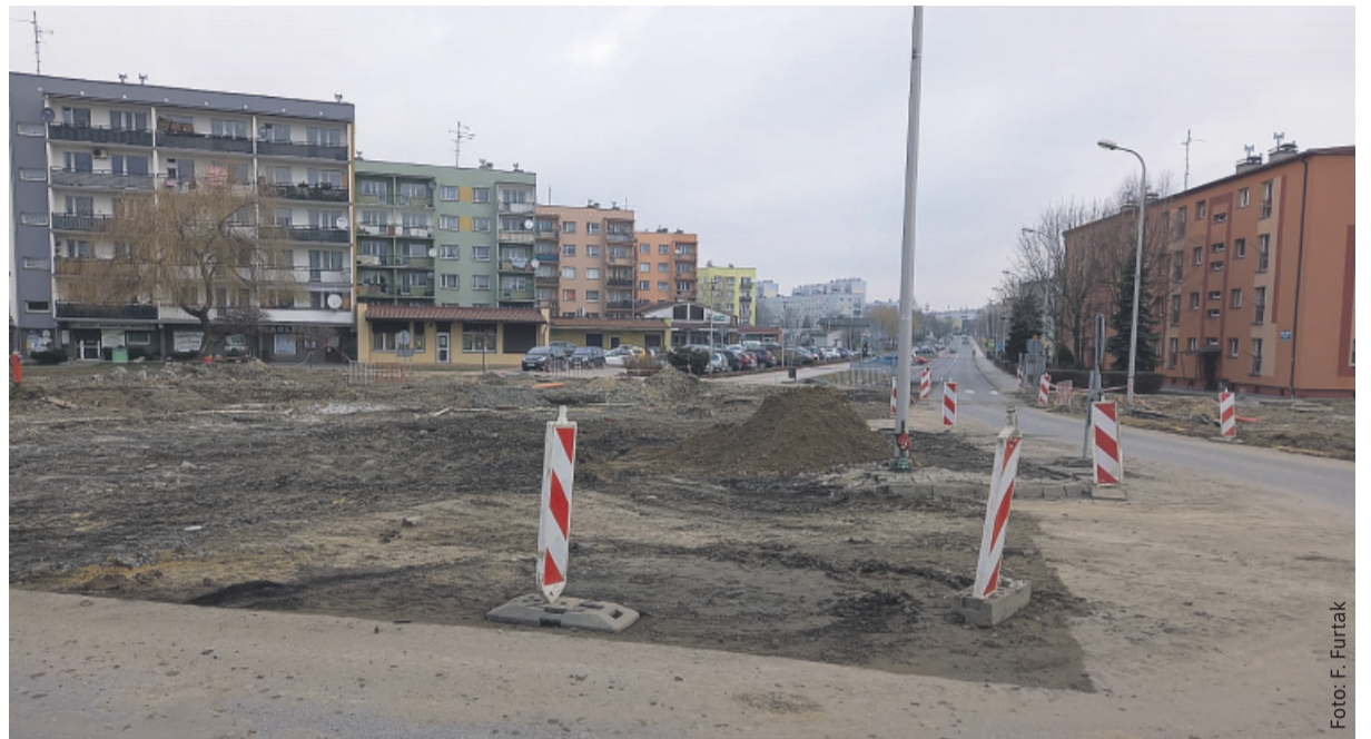
Przebudowa skrzyżowania u zbiegu ulic Szpitalnej i Kosmonautów w Knurowie to jedna z większych inwestycji drogowych w powiecie.

Modernizowany jest też parking dla samochodów osobowych, zlokalizowany w rejonie skrzyżowania ulic Szpitalnej i Kosmonautów (w części północno-wschodniej). Przebudowie ulega tu zjazd od strony ul. Szpitalnej, zaś likwidacja