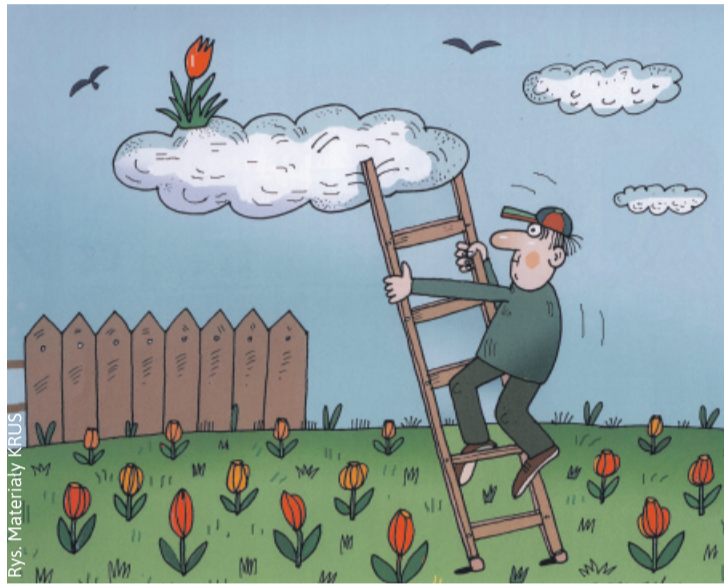
Rys. Materiały KRUS

i zbiorników na gnojowicę. Przyczyną wielu wypadków jest również nieprawidłowy sposób wchodzenia i schodzenia z maszyn rolniczych oraz nieprawidłowo skonstruowane i ustawione drabiny. Zarówno szczeble drabin i stopnie przy maszynach i ciągnikach bardzo często są zabrudzone ziemią i resztkami roślin, co powoduje poślizgnięcia, a w konsekwencji upadki z wysokości, które kończą się urazami kończyn górnych i dolnych.