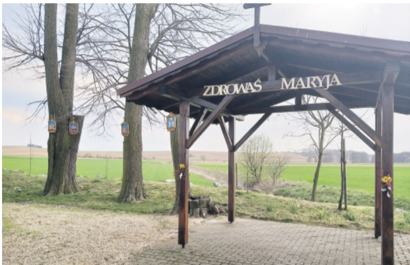
Przejście Stacjami Drogi Krzyżowej w Goju to niezapomniane przeżycie.

kańcy mówią o ślubowanych, corocznych pielgrzymkach ze Świbia i Wiśnicza w dniu Męczenników Jana i Pawła. Modlono się wówczas o urodzaje i zachowanie od kataklizmów, święcono świece mające chronić od piorunów.