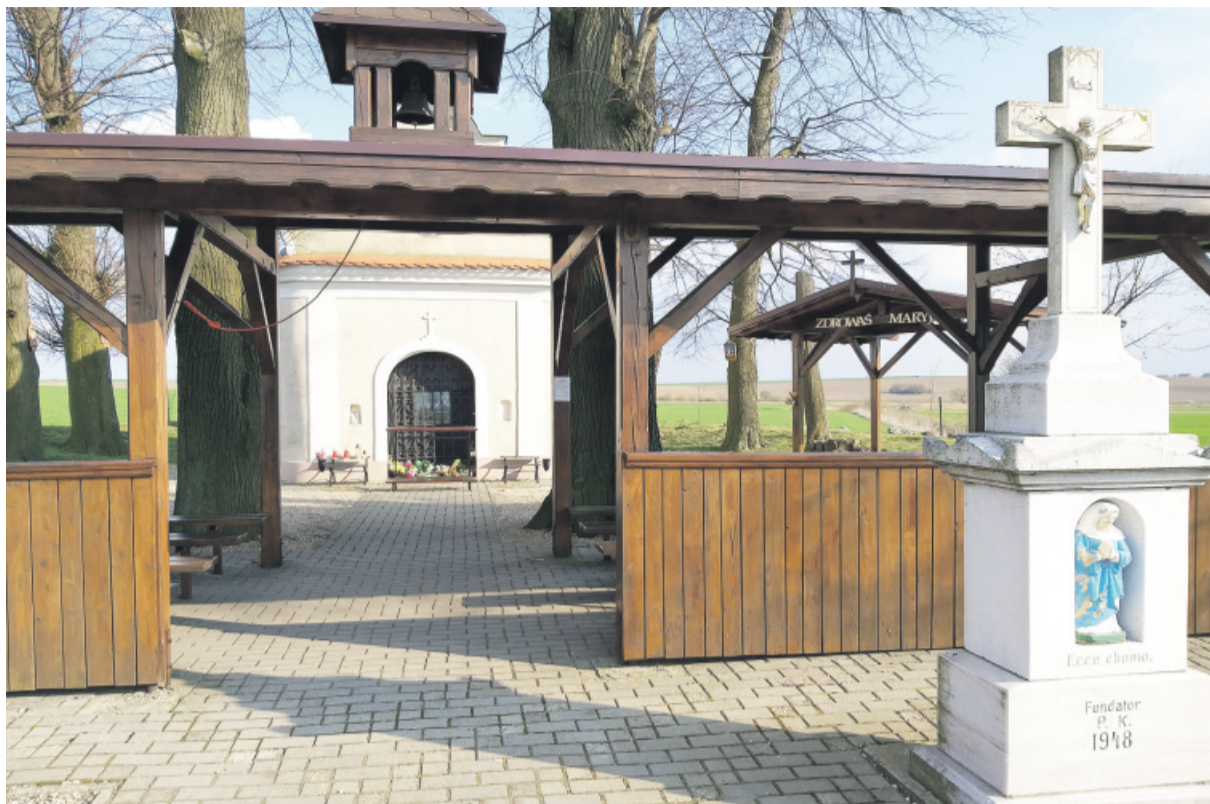
Kapliczka jest urocza i bardzo klimatyczna.

Do kaplicy tej od wieków przybywają liczne pielgrzymki z okolicy. Trudno jednak ustalić początkową datę tradycji masowego pielgrzymowania do Goja. Okoliczni miesz-