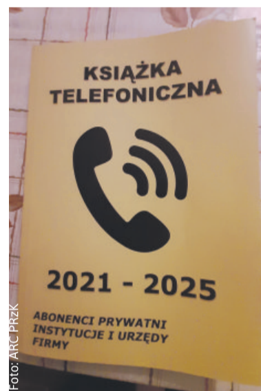
Taką bezwartościową książkę telefoniczną rozprowadzają po powiecie oszuści, wyludzając pieniądze – szczególnie od osób starszych.

– Pragnę przestrzec konsumentów z naszego terenu przed aktualnymi zagrożeniami ze strony nieuczci-