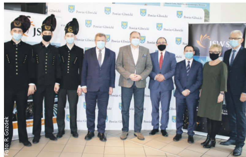
W podpisaniu porozumienia uczestniczyli przedstawiciele JSW, Powiatu Gliwickiego i ZSZ nr 2 w Knurowie.

– Chciałbym na ręce pana prezesa złożyć serdeczne podziękowania za to, że Powiat Gliwicki i Zespół Szkół Zawodowych nr 2 w Knurowie mają możliwość współpracy