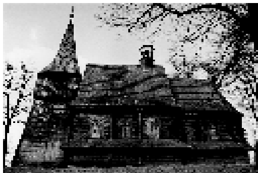
Kościół w Żernicy.