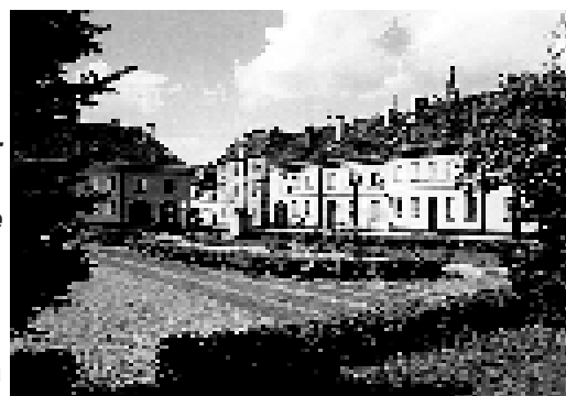
Rynek w Pyskowicach.

Położenie to jeden z atutów powiatu gliwickiego. Zróżnicowany krajobraz, rozległe lasy, zbiorniki wodne i stawy, szlaki turystyczne i zabytki architektury - wszystko to składa się na bogatą ofertę naszych terenów. Amatorzy pieszych i rowerowych wycieczek przemierzać mogą m.in. olbrzymie kompleksy leśne, wśród których przeważają bory sosnowe i lasy liściaste. Zwolenników sportów wodnych i wędkarstwa przyciąga możliwość wypoczynku nad sztucznymi zbiornikami, Dzierżno Małe w Pyskowicach, Dzierżno Duże i Zbiornikiem Pławniowickim, nad których brzegami powstały ośrodki wczasowe, pola kempingowe i przystanie żeglarskie. Można tu nie tylko wypożyczyć żaglówkę, ale i po odpowiednim szkoleniu uzyskać patent żeglarsza. Nie zapomina się też o miłośnikach konnej jazdy - na wypoczynek w siodle zapraszają stadniny i niektóre gospodarstwa oferujące taką atrakcję swym gościom. Prawdziwą ozdobą tej ziemi są materialne