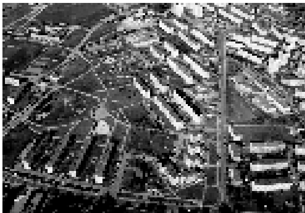
Co jest na zdjęciu?