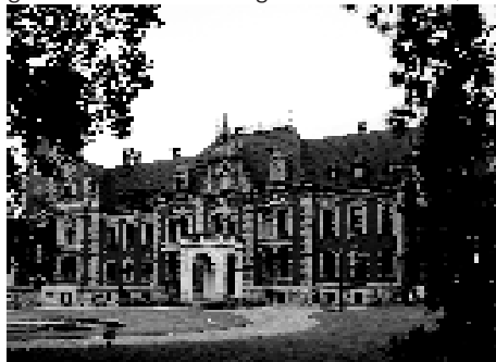
Pałac w Pławniowicach.

• park, w którym można odnaleźć 23 gatunki krzewów i 40 gatunków drzew (klo-