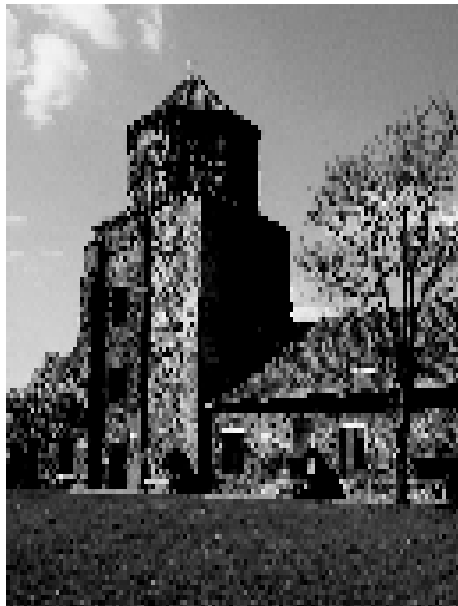
Zamek w Toszku.

a rozbudowali Colonnowie w XVII wieku, przekształcając go w rezydencję rodową. Wśród kolejnych właścicieli należy wspomnieć Adolfa von Eichendorffa - ojca