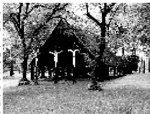
Kaplica w Tworogu Małym.