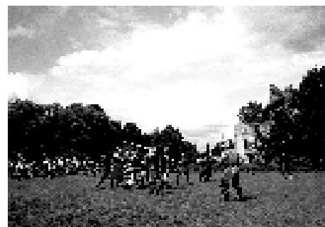
Zamek w Chudowie.

Zamek w Chudowie - wybudowany w latach trzydziestych XVI wieku przez Jana Gierałtowskiego zamek w Chudowie w Gminie Gierałtówice, jest jedną z większych atrakcji powiatu gliwickiego i dowodem na to, jak ważne szlaki handlowe przebiegały przez ziemię gliwicką w epoce średniowiecza i renesansu. Na zamku od dwóch lat działa muzeum, w którym prezentowane są