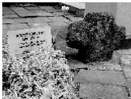
Krzyż pokutny w Sośnicowicach.

Krzyże Pokutne - jedne nawet nie przypominają krzyży - ot, dziwne kamienne słupy, często przycupnięte na rozstajnych drogach. Inne to małe, niepozorne krzyże wkomponowane w większe budowle, wtapiające się w codzienny krajobraz. Warto jednak poświęcić im chwilę uwagi, bo stanowią ciekawy ślad średnio-wiecznego prawodawstwa. Zgodnie z pra-