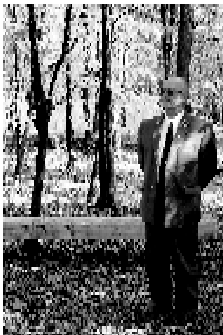
Ścieżka dydaktyczna w Rachowicach.

- Jak wiem w okolicznych lasach powstało kilka ścieżek przyrodniczych. Czy może Pan coś o nich opowiedzieć?