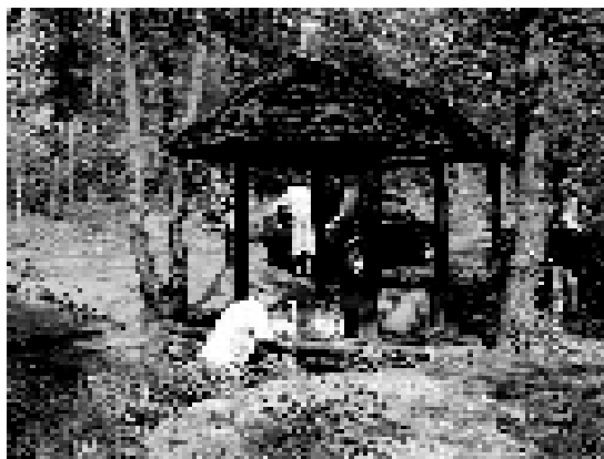
Źródełko w Stanicy.

wem zwyczajowym zabójstwo lub inną krzywdę należało pomścić krwawo. Często jednak, jeśli rodzina zabitego zgadzała się na ugodę, krwawy odwet zastępowano przyjęciem odszkodowania. Morderca opłacał koszty pogrzebu i sprawy sądowej, przekazywał rodzinie ofiary "kwotę pokutną" i inne dobra materialne,łożył na utrzymanie i wychowanie dzieci zabitego, a na rzecz Kościoła zobowiązany był przekazać określoną ilość wosku oraz zamówić msze w intencji swojej ofiary. W ramach pokuty zabójca odbywał również pieszą pielgrzymkę do jednego z ówczesnych świętych miejsc, a na miejscu zbrodni wystawiał własnoręcznie wykuty krzyż pokutny. Krzyże pokutne zaczęły pojawiać się w krajobrazie naszych terenów pod koniec XIII w., a obowiązek ich stawiania zanika pod koniec wieku XVI. Krzyże stawiane były jednak nadal przez rodzinę zamordowanego (a niekiedy i mordercy) dla upamiętnienia tragicznego zdarzenia. Najwięcej krzyży pokutnych zachowało się na Dolnym Śląsku, tym cenniejsze więc są te, które występują na naszym terenie. Jeden znaleźć możemy pod ścianą kościoła w Sośnicowicach (obok Grupy Ukrzyżowania), drugi - to XVI-wieczny kamienny trzon oparty o słup w Łanach Małych, w pobliżu skrzyżowania z drogą do Rudzińca.