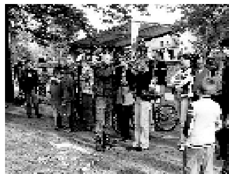
Festyn Charytatywny zorganizowany przez Zespół Szkół Specjalnych w Pyskowicach.