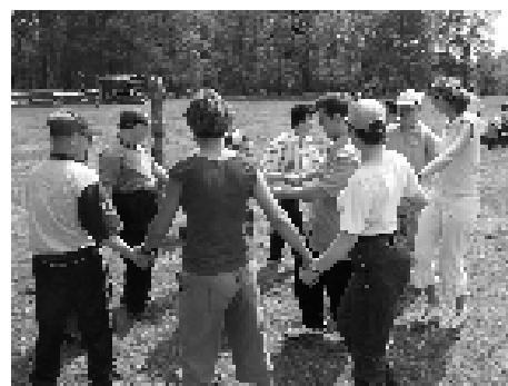
Piknik „Bliżej Natury” zorganizowany przez Stowarzyszenie na Rzecz Osób z Upośledzeniem Umysłowym „Nadzieja”.