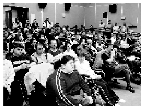
III Integracyjne Spotkania Teatralne, zorganizowane przez Zespół Szkół Specjalnych w Knurowie