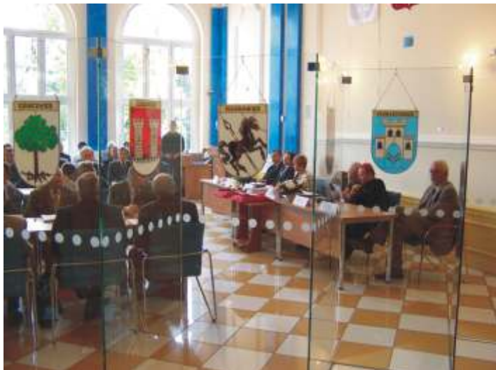
Herby miast i gmin powiatu.