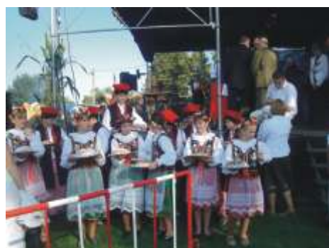
Dzieci z bochnami chlebow.