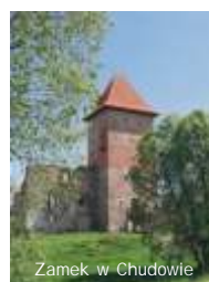
Zamek w Chudowie