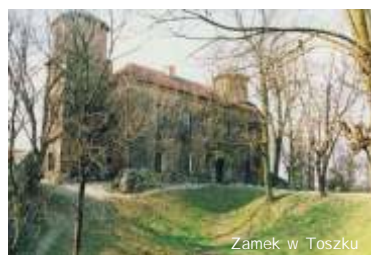
Zamek w Toszku

4 października br. o godzinie 14:00 w sali sesyjnej Starostwa Powiatowego w Gliwicach odbędzie się uroczyste spotkanie z okazji uzyskania przez nauczycieli kolejnych stopni awansu zawodowego. 54 nauczycieli uzyska stopień nauczyciela dyplomowanego. (SG)