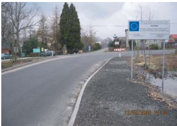
Droga wyremontowana z funduszy SAPARD.

Powiat Gliwicki zło ył projekt w ramach Regionalnego Programu Operacyjnego Województwa ł skiego na lata 2007-2013 pod nazw „Wzmocnienie sieci współpracy sektora M P na terenie zachodniej cz ci subregionu centralnego”, poprzez modernizacj infrastruktury drogowej i co z tym zwi zane – uzbrojenie terenów inwestycyjnych w Knurowie, Rudzicu i Gliwicach. Projekt przeszedł wst pn weryfikacj . Koszt projektu to ponad 50 mln zł. Zakładane rezultaty projektu to 35,8 km zmodernizowanych dróg.