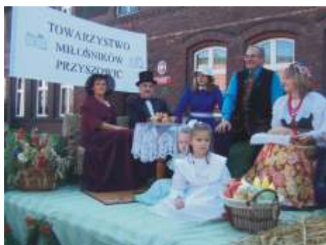
Scenki rodzajowe na zdjęciu Towarzystwo Miłośników Przyszowic.

czelę kroczyła Orkiestra Dęta KWK Knurów. Za nimi bryczkami jechali ksiądz biskup, starostowie dożynki, starosta gliwicki, wójt gminy Gierałtówice, przewodniczący Rady Powiatu oraz przewodniczący rady gminy Gierałtówice a dalej mieszkańcy Gierałtowa, Chudowa, Paniówek, Przyszowic, Kotulina, Wielosia, Stanicy, Wilczy, Rachowic i Nadleśnictwa Rudziniec, prezentujący