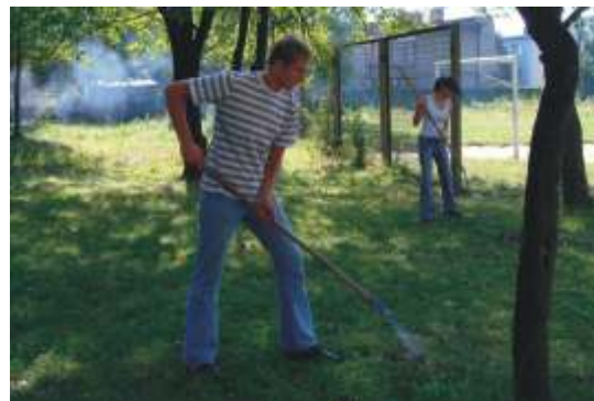
Na zdjęciu uczniowie Zespołu Szkół im. I. J. Paderewskiego