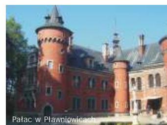
Pałac w Pławniowicach