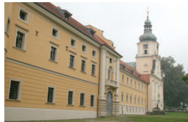
Kto pamięta zniszczone mury sprzed kilku lat, może teraz nie poznać tego obiektu.