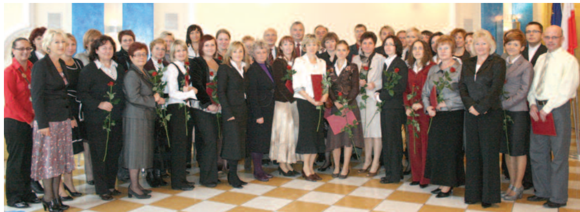
Uczestnicy spotkania w Starostwie Powiatowym w Gliwicach.

Uroczysty przebieg miało spotkanie z okazji Dnia Edukacji Narodowej, zorganizowane w Starostwie Powiatowym w Gliwicach 14 października. Zaproszeni na nie zostali nauczyciele awansowani na wyższe stopnie zawodowe, dyrektorzy szkół i placówek oświatowych prowadzonych przez powiat oraz osoby wyróżnione nagrodami starosty.