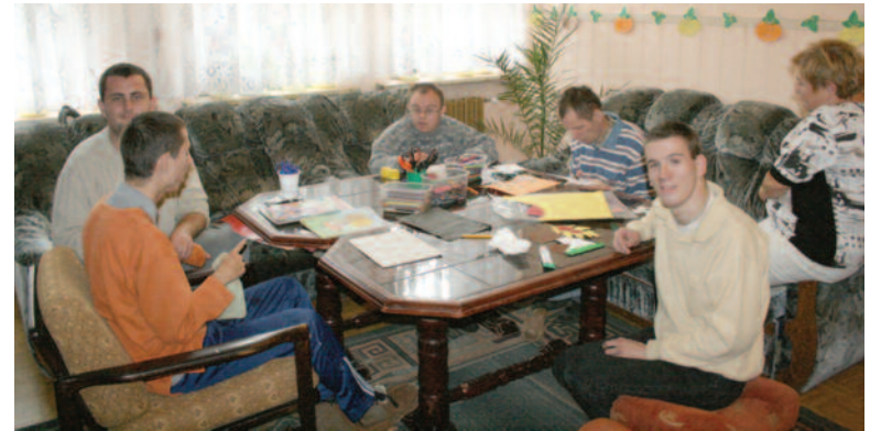
Podczas wspólnych zajęć – jedni malują, inni robią wycinanki bądź układają puzzle.