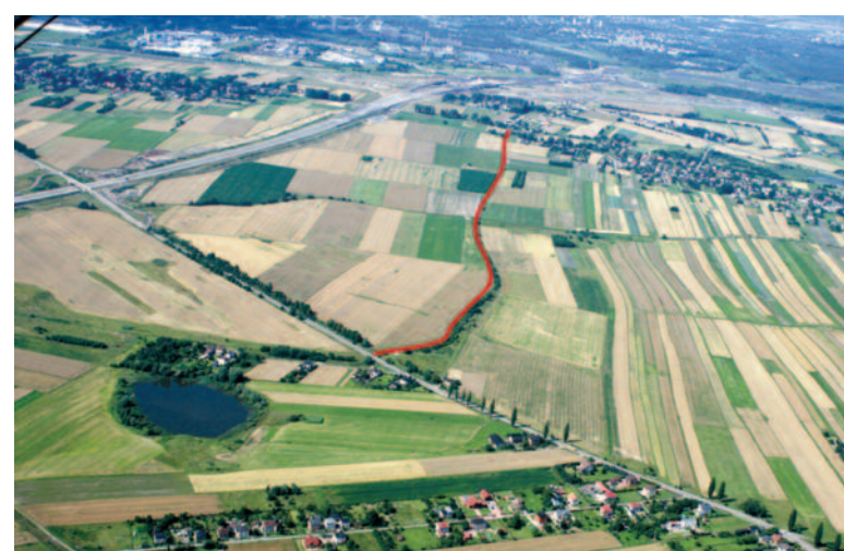
Tak będzie wyglądał by-pass w Przyszowicach.

Ostatnio było ich kilka. 6 października oddany został w Przyszowicach plac budowy ważnego łącznika między drogą powiatową (ul. Bojkowska) poprzez ul. Graniczną z drogą krajową nr 44 (ul. Gliwicka) w pobliżu węzła autostradowego „Gliwice-Sośnica”. Obwodnica ta odciąży drogę wojewódzką nr 921 oraz przyczyni się do aktywizacji pobliskich terenów inwestycyjnych, łącząc je z autostradami. Będzie to także ważny by-pass dla A1. Droga będzie mieć 2 km, jej koszt to 7,5 mln zł. Inwestorem jest gmina Gierałtów, którą kwotą blisko 500 tys. zł wsparło miasto Gliwice. Droga ma być gotowa w styczniu 2011 r.,