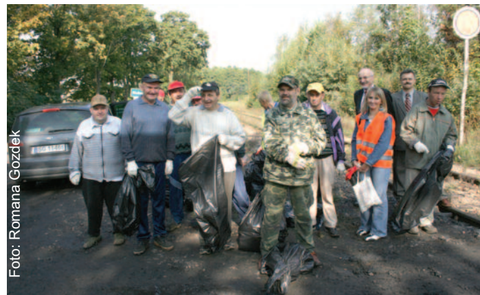
Mieszkańcy DPS „Zameczek” wysprzątałi w Knurowie ul. Krywaldzką prowadzącą przez las aż do Nieborowic.

To wielkie sprzątanie odbywało się 18 września na terenie Knuruwa, Pyskowic, Kuźni Nieborowskiej i Sośnicowic. Wzięło w nim udział 200 uczniów z Zespołu Szkół im. Paderewskiego w Knurowie, 120 z Zespołu Szkół Zawodowych w Knurowie, 80 z Zespołu Szkół Specjalnych w Knurowie, 300 z Zespołu Szkół im. Konopnickiej w Pyskowicach, 120 z Zespołu Szkół Specjalnych w Pyskowicach, 40 osób z Domu Pomocy Społecznej „Ostoja” w Sośnicowicach i 21 z Do-