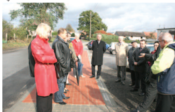
Podczas oddania do użytku chodnika przy drodze powiatowej łączącej Żernicę z Nieborowicami.