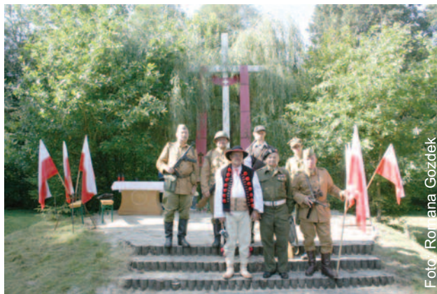
Pod Krzyż Pamięci i Pojednania przyjechali też górale z okolic, skąd pochodzili zamordowani partyzanci, a także członkowie grup rekonstrukcji historycznej z Opola i Wrocławia w mundurach z okresu II wojny światowej.

W ostatnią sobotę września na polanie w Barucie koło Dąbrówki (gmina Wielowieś) odbyła się uroczystość upamiętniająca zbrodnię, dokonaną w tym miejscu przed 63. laty. We wrześniu 1946 roku zginęło tu ok. 200 partyzantów Polskiego Państwa Podziemnego z Podhala, zwabionych obietnicą wyjazdu na Zachód przez agentów UB i NKWD, a także żołnierzy wracających z Zachodu. Umieszczono ich w baraku, który został wysadzony w powietrze i spalony. Miejsce to upamiętnione mogło zostać dopiero po polskich przemianach ustrojowych w 1989 roku – stoi tu postawiony przez miejscową lud-