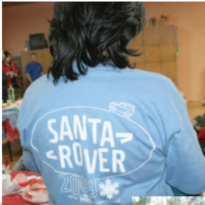
▲ Specjalnie na tę akcję właściciele land roverów przygotowali koszulki, którymi też obdarowali uczestników rajdu.