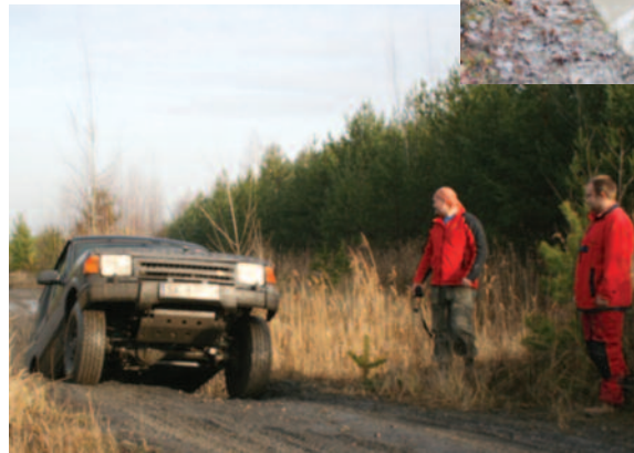
▲ Na trasie emocji nie brakowało – raz było bardzo w dół, raz bardzo pod górę...