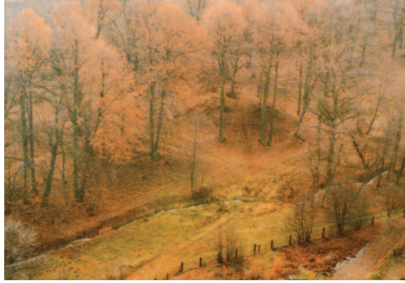
Pozostałości po gródku stożkowatym w Pniowie (zdjęcie Wojciecha Gorgolewskiego pochodzi z albumu „Grodziska Górnego Śląska i Zagłębia Dąbrowskiego z lotu ptaka”, Katowice 1996).

Jedna z nich głosi, że kopiec w Pniowie jest mogiłą szwedzkiego generała, który zginął na tych terenach prawdopodobnie podczas wojny 30-letniej. Żalność wielka ścisnęła serca jego żołnierzy i postanowili pochować tutaj swego generała. Tak też uczynili. Każdy z żołnierzy przyniósł w swoim hełmie garstkę ziemi i rzucił na mogiłę. Żoł-