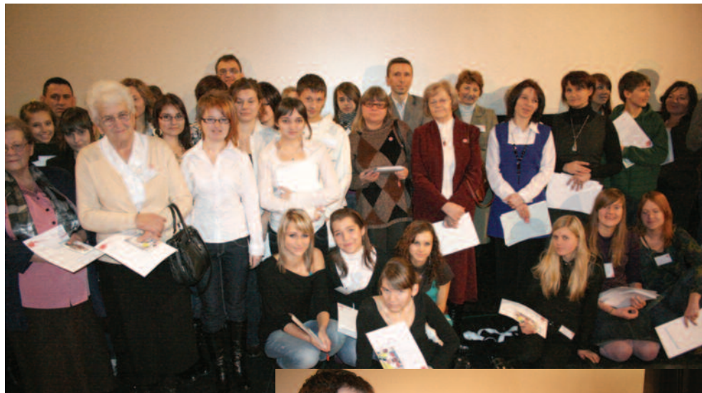
▲ Grono wolontariuszy akcji było wyjątkowo liczne.