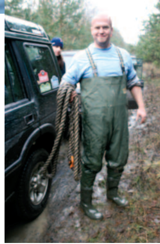
◀ Choć droga była wcześniej rozpoznana, taki ekwipunek jest przydatny na każdym rajdzie.