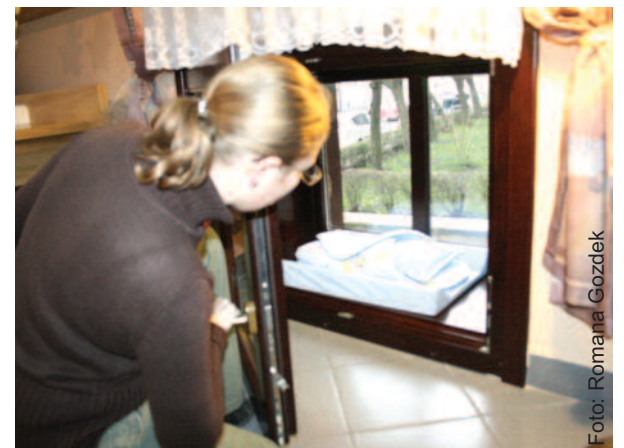
Niechciane dziecko, które w oknie pozostawi zdesperowana matka, znajdzie się natychmiast pod dobrą opieką.

Równocześnie z opieką nad Oknem Życia siostry podjęły się stałej modlitwy w intencji odpowiedzialnego ro-