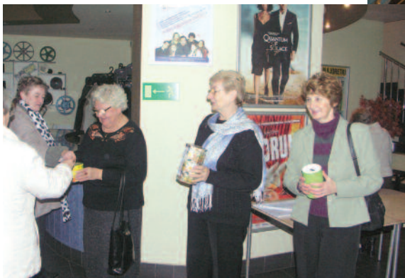
Wolontariuszki podczas jednej z kwest poprzedzającej świąteczny wykład UTW.

Wolontariusze przez rok uczestniczyli w zajęciach eksperymentalnych dla dzieci szczególnej troski w Dziennym Domu