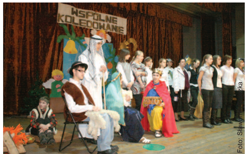
Na scenie uczniowie Zespołu Szkół Specjalnych oraz Miejskiego Gimnazjum nr 2 z Knurowa.