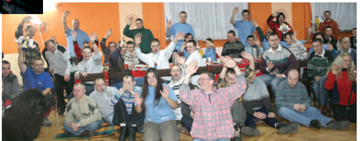
► Dzień zakończyło wzruszające spotkanie w DPS-ie, na którym było moc prezentów, podziękowań, wspólnego śpiewu i radości.