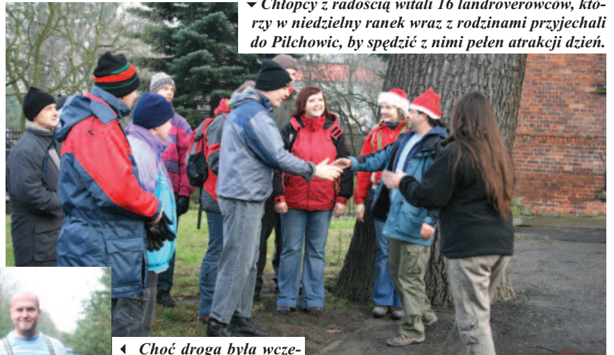
▼ Chłopcy z radością witali 16 landroverowców, którzy w niedzielny rano wraz z rodzinami przyjechali do Pilchowic, by spędzić z nimi pełen atrakcji dzień.