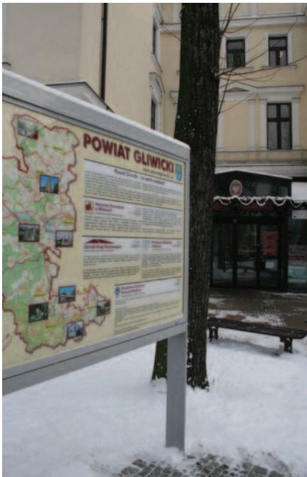
Jedna z tablic ustawiona została przed Starostwem Powiatowym w Gliwicach...

Gliwicki – i co Powiecie? – tak właśnie brzmi hasło promocyjne powiatu gliwickiego. Jego pisownia (słowa „Gliwicki” i „Powiecie” pisane dużą literą w kolorze bordo oraz „i co” pisane czarną czcionką), to gra słów: