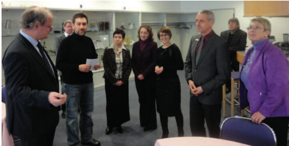
Podczas zwiedzania Centrum Kształcenia Zawodowego w Calw.

naszego partnerskiego powiatu, licząc na dalszą udaną współpracę. Po drugie zaś nawiązaliśmy kontakty z tamtejszymi placówkami oświatowymi, głównie zaś z Centrum Kształcenia Zawodowego. To ogromna szkoła, licząca 4 tys. uczniów, która jest rozbudowywana i wkrótce kształcić będzie ich 5 tys. Niemcy dużą wagę przywiązują do kształcenia zawodowego i wierzą, że ta współpraca da już niedługo konkretne rezultaty. (JP, RG)