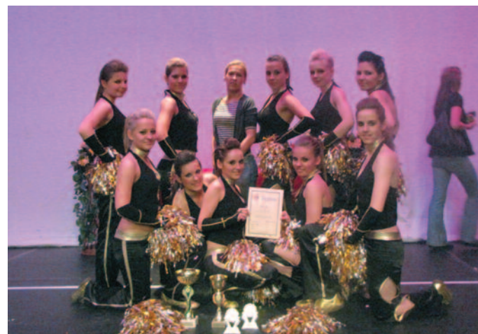
Podczas zajęć kółka tanecznego uczennice knurowskiego liceum ćwiczą elementy tańca cheerleaders.