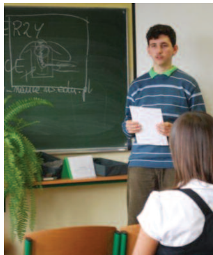
Uczniowie przygotowali ciekawe prelekcje, dotyczące m.in. ekologicznych aspektów wykorzystania energii w gospodarstwie domowym.

Program Festiwalu dotyczył realizacji projektu szkolnego pt. „Energicznie o energii”, a tematem wiodącym były „Konwencjonalne źródła energii”. Gościem festiwalu był