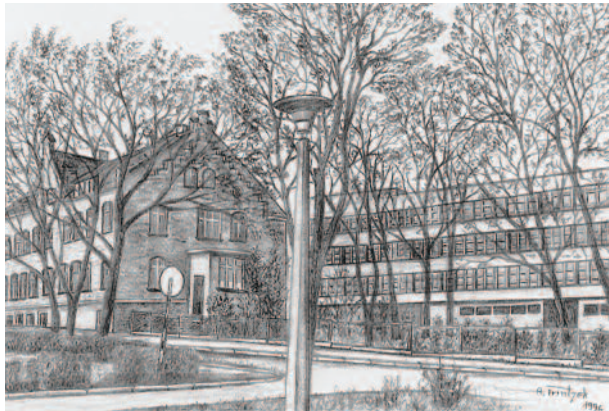
...i na rycinie Alfreda Trintzka, już z nowym budynkiem.

Rok 1963 przyniósł kolejną koncepcję rozwiązania problemu nowego budynku dla szpitala. Dyrekcja szpitala wystąpiła z wnioskiem adaptacji dla potrzeb lecznictwa zamkniętego baraków po zlikwidowanym hotelu robotniczym Gliwic-