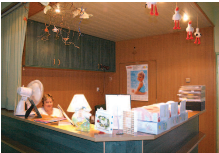
Tu chętnie rodzą mamy nie tylko z Pyskowic, ceniąc wysoko zarówno kompetencje personelu, jak i miłą atmosferę, panującą na oddziałach.

Pod koniec 1998 roku nastąpiła restrukturyzacja ZOZ-u w Pyskowicach, w wyniku której