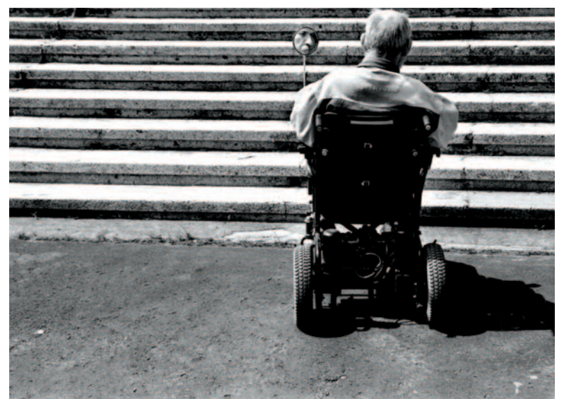
Z serii „Breaking Stereotypes”. Zdjęcie nagrodzone przez Komisję Europejską.