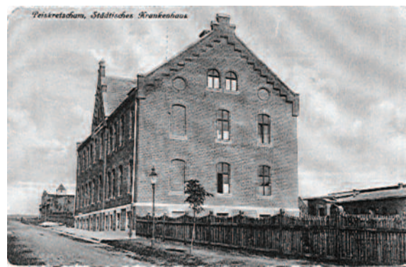
Stary szpital na dawnej widokówce...

Szpital nazywany był wtedy lazaretem i funkcjonował do 1821 r., gdy grożący zawaleniem budynek rzeczywiście rozebrano. Wybudowany wkrótce nowy obiekt w jednej izbie mieścił schronisko dla ubogich i starców, a w drugiej szpital. Obiektem tym zarządzały władze miasta, a funkcje usługowe pełniły Siostry Miłosierdzia. Budynek ponownie usytuowany został w sąsied-