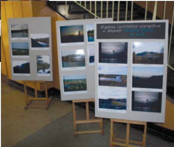
Fragment wystawy prac fotograficznych i plastycznych, której przyswiecała idea ochrony środowiska.

Projekt daje uczniom możliwość nawiązania kontaktu z Uniwersytetem Śląskim, z jego studentami oraz wykładowcami. Wybitnie zdolni uczniowie mogą zostać członkami Uniwersyteckiego Towarzystwa Naukowego, a także brać udział w specjalnych sesjach naukowych organizowanych na uczelni. Szkoła bierze udział w projekcie od września 2009. Jest on współfinansowany przez Unię Europejską ze środków Europejskiego Funduszu Społecznego. Projekt ten będzie trwał trzy lata