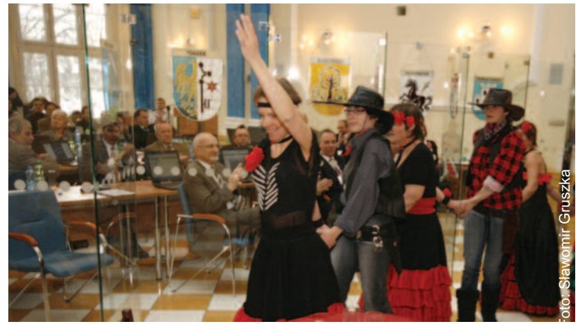
Dziewczyna z „Ostoi” przed sesją zaprezentowała program rodem z Dzikiego Zachodu.

Pod obrady radnych trafiło także kilka projektów uchwał. Wszystkie zostały przyjęte przez Radę. Pierwsza z nich to sprawozdanie z działalności wspólnej dla Miasta Gliwice i Powiatu Gliwickiego Komisji Bezpieczeństwa i Porządku w 2009 roku.