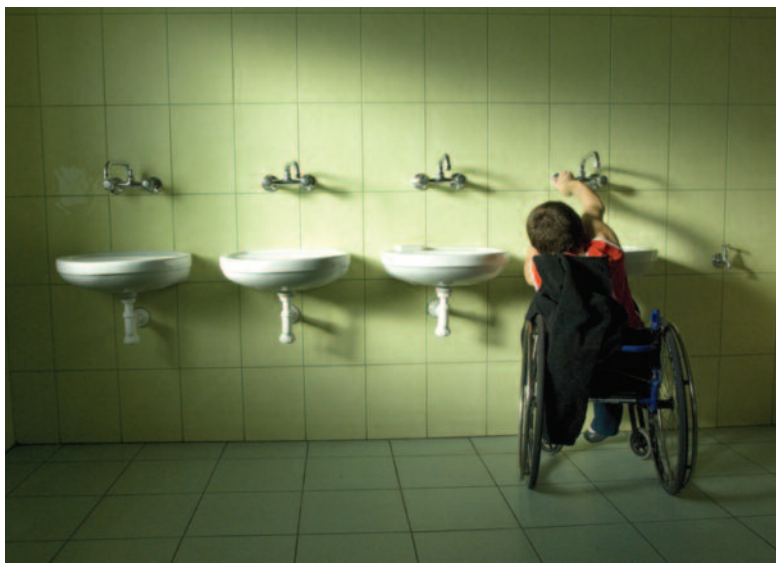
„Rugbyści II” – zdjęcie wyróżnione przez tygodnik „Polityka”.