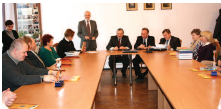
Podczas spotkania w starostwie.

Po 1,1 tys. zł na ten sam cel przyznano następującym sołectwom: Wielowieś (gm. Wielowieś), Paczyna (gm. Toszek), Proboszczowice (gm. Toszek), Kleszczów (gm. Rudziniec), Poniszowice (gm. Rudziniec) oraz Stаницa (gm. Pilchowice). Natomiast nagrody po 400 zł otrzymały: Smolnica (gm. Sośnicowice), Tworóg Mały (gm. Sośnicowice), Sierakowice (gm. Sośnicowice), Widów (gm. Rudziniec), Taciśzów (gm. Rudziniec), Rudziniec (gm. Rudziniec), Rudno (gm. Rudziniec), Bojszów (gm. Rudziniec), Łącza (gm.