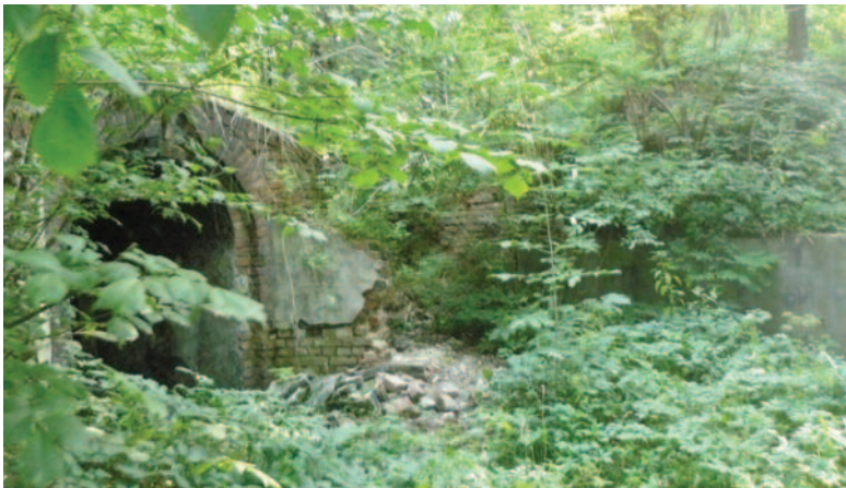
Dzisiejsza dzielnica Knuruwa – Krywałd. Druga część jej nazwy (przed laty „Wald”) wzięta została od niemieckiego słowa „las”.

Zmieniające się przez stulecia nazwy miejscowości są kapitalnym dokumentem historycznym! Nazwy miejscowości przekazują nam historię