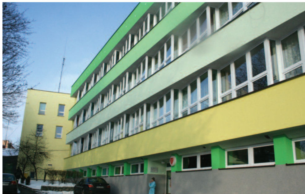
Budynek nowego szpitala po termomodernizacji przeprowadzonej przez powiat w ostatnich latach.

Ten dobry nastrój zburzony został przez mieszkańców hotelu, którzy skierowali pisemny protest do Ministerstwa Przemysłu Ciężkiego w Warszawie. Gazeta zakładowa „Metalowiec” z 16 maja 1960 roku w bardzo ostrzych słowach