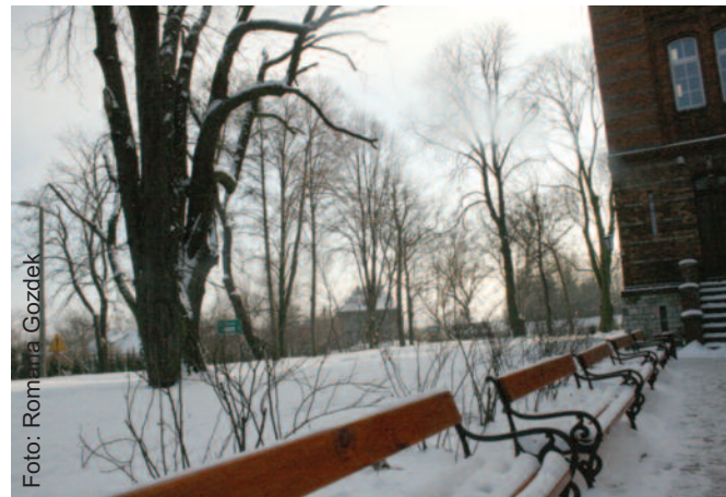
W tym miejscu na terenie Zespołu Szkół im. M. Konopnickiej w Pyskowicach utworzony zostanie GEOPUNKT.