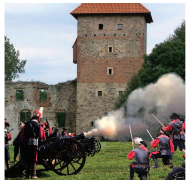
Nazwa Chudowa przez pewien czas ściśle związana była z tamtejszym zamkiem.

wielkość daniny, jaką zobowiązane były płacić stolicy biskupiej we Wrocławiu należące do niej miejscowości) wymienia się między innymi Knurów. Na początku XIV wieku nazwa ta zapisana była jako Cnurowicz; w 1482 roku był Kumrowem; w 1534 roku – Knaursdorff. Najbardziej zbliżona nazwa do współczesnej pochodzi z 1679 roku i brzmi – Knurów. Z kolei w 1745 roku pojawia się Knurów. Na począt-