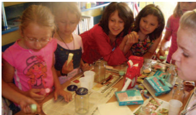
Wesołej jest wśród rówieśników – twierdzą ci, którzy spędzą ferie w miejscu zamieszkania.

kim gimnazjum, w godz. 9.00 – 13.00. W programie zaplanowano wyjazdy na basen, do kina, zajęcia sportowe na hali oraz inne w tym kulig.