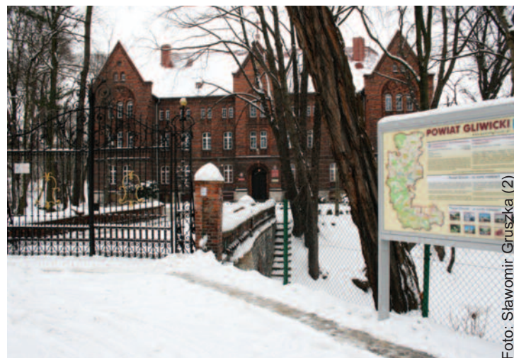
...a kolejna przed Zespołem Szkół im. M. Konopnickiej w Pyskowicach.

Zarówno hasło jak i logo – obok herbu – pojawiają się