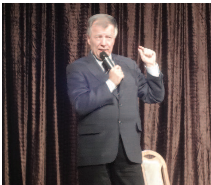
Profesor żywo gestykuluje opowiadając o zawiłościach językowych.

Nie brakło pytań o poprawność językową, ale i ciepłych wspomnień z młodości lat pana profesora, któremu Pyskowice są bliskie m.in. ze względu na to, że wychował się w pobliskich Tarnowskich Górach. Przywołano miłe sercu profesora