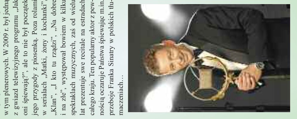
Rys. K. Sabath (archiwum PiG)