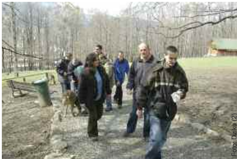
Podczas spaceru w Leśnym Parku Niespodzianek.

Tak się też stało. Od tej pory landroverowcy wraz ze swymi rodzinami odwiedzają chłopców w soboty,