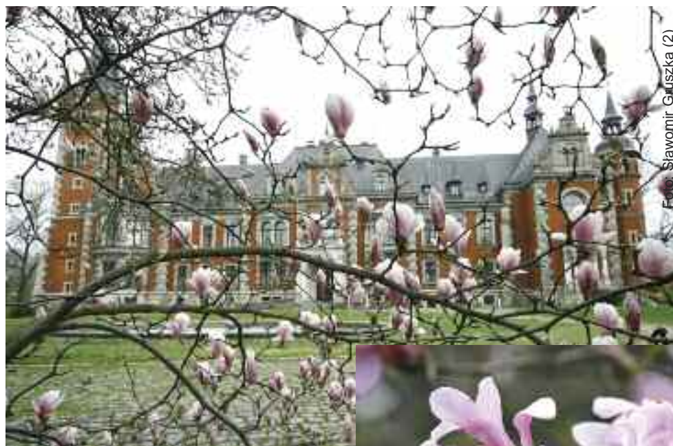
Magnolie są ozdobą m.in. Zespołu Pałacowo-Parkowego w Pławniowicach.

Najbardziej popularne są magnolie pośrednie – Soulange’a (magnolia soulangeana). Są one mieszańcem magnolii nagiej i purpurowej. Występują jako duże krzewy lub niskie drzewa o wysokości 3-6m. Posiadają szeroką, luźną koronę, skórzaste, duże