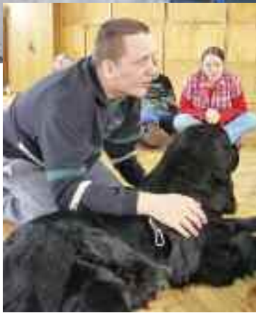
... i z kynoterapii to dla uczniów duża frajda.

Udział w zajęciach prowadzonych na terenie szkoły uzupełniany jest zdobywaniem wiedzy podczas licznych wyjazdów i wizyt studyjnych. W świat prawdziwego teatru wprowadziły uczniów spektakle w krakowskim Teatrze Groteska. Podczas wizyty studyjnej w Planetarium i Obserwatorium w Chorzowie członkowie kółka przyrodniczo-turystycznego doskonalili