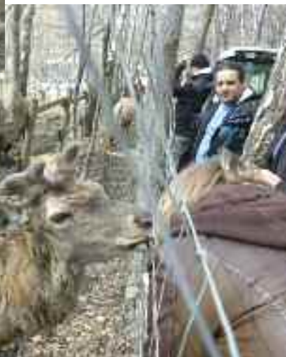
Chłopcy bardzo lubią kontakt ze zwierzętami.