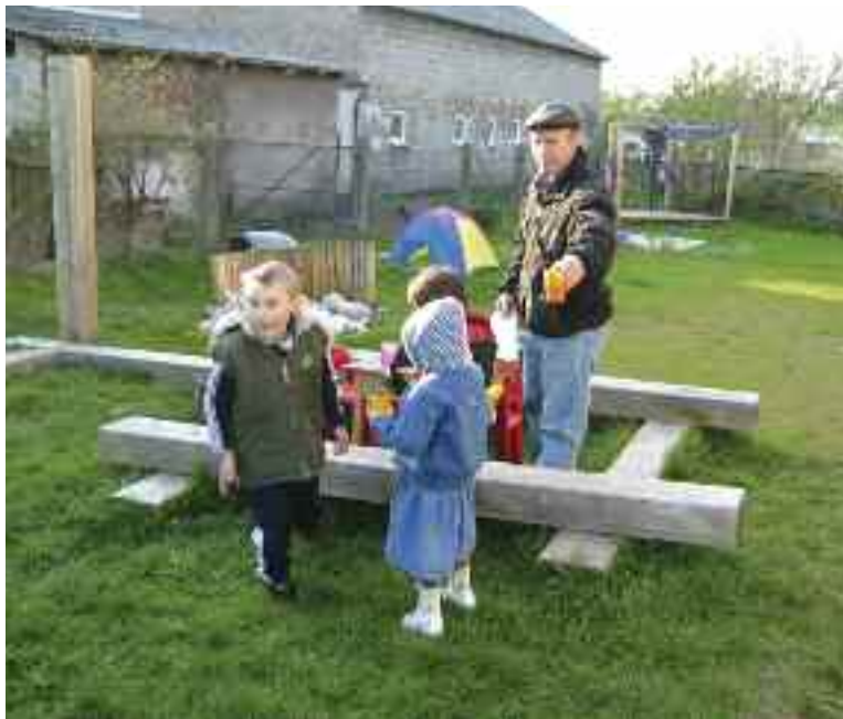
Tata serwuje herbatkę na świeżym powietrzu.