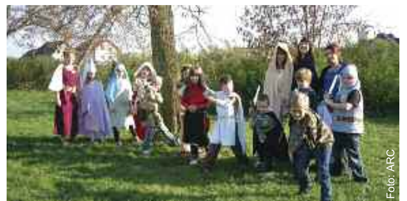
Zuchy podczas rycerskiej imprezy bawiły się świetnie.