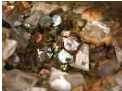
Pyryt zachwyca swymi kolorami i strukturą.

Przeważnie w ogóle nie zwracamy na nie uwagi. Stanowią nieodczyny element krajobrazu poprzemysłowego ziemi śląskiej. Cytując definicję, hałda (po Śląsku houda) to antropogeniczna forma ukształtowania powierzchni zie-