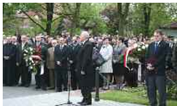
Uroczystość pod Pomnikiem Patriotycznym.

Pyskowice należą do najstarszych miast Górnego Śląska. Władze samorządowe od kilku lat zabiegały o wykonanie symboli godnych miasta z tak wielką tradycją. Obecnie mają