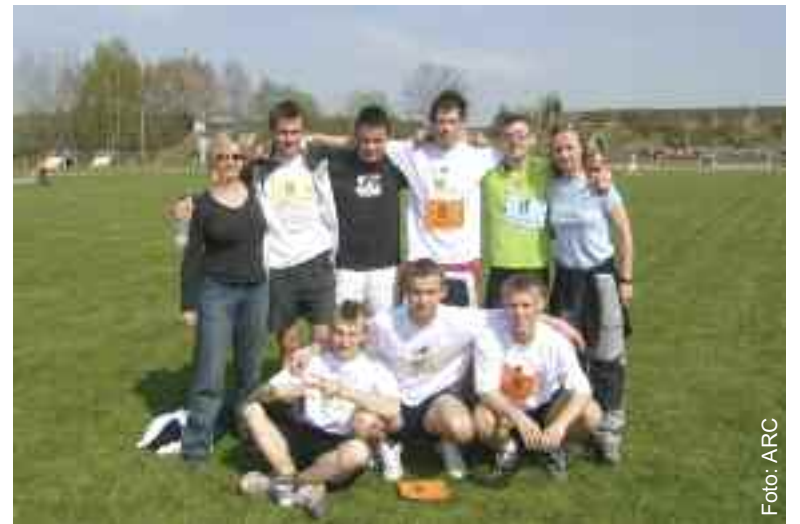
Nasza reprezentacja po zakończeniu sztafety.

Przedstawiciele Powiatu Gliwickiego brali udział w tradycyjnym biegu sztafetowym organizowanym w partnerskim Powiecie Mittelsachsen (Niemcy) w dniach 23-25 kwietnia. Na 86 drużyn nasza młodzież zajęła 8 miejsce. Z kolei najlepszą okazała się reprezentacja Miasta Gliwice, złożona z zawodników klubu Piast Gliwice.