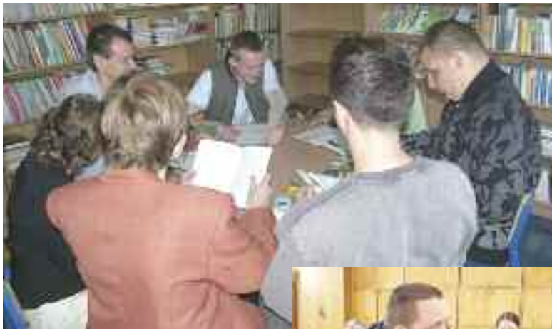
Zajęcia z biblioterapii...

Podobne szanse stwarzają zajęcia kółka teatralnego, podczas których