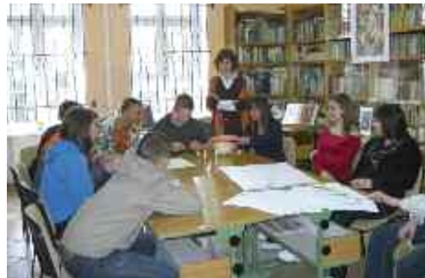
Dni otwarte w Zespole Szkół im. M. Konopnickiej w Pyskowicach.

Zespół Szkół Zawodowych nr 2 w Knurowie proponuje naukę w zawodzie technik górnictwa podziemnego, elektryk, mechanik oraz handlowiec. Natomiast II Liceum Ogólnkształcące zaprasza do nowo otwartej klasy mundurowej. Zasadnicza Szkoła Zawodowa oferuje klasy wielozawodowe, m.in. w zawodzie fotograf, elektryk, sprzedawca czy górnik eksploatacji podziemnej.