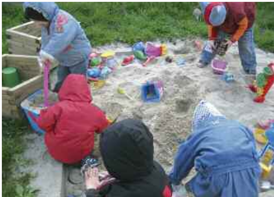
Zabawę w piaskownicy lubią wszystkie dzieci. Z niecierpliwością czekają na igraszki w basenie.

W powiecie gliwickim działa obecnie jeden Rodziny Dom Dziecka, 121 rodzin zastępczych, w tym 7 zawodowych. Wśród rodzin zastępczych zawodowych dwie mieszkają poza powiatem gliwickim, wychowując dzieci z jego terenu.