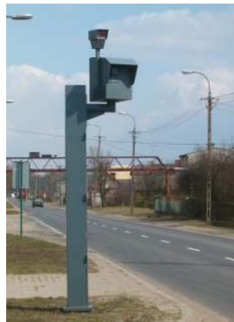
Fotoradary już wkrótce pojawią się na drogach.

automatyczny nadzór pr dko ci na sieci dróg powiatowych na terenie Powiatu Gliwickiego pn. „Pr dko kontrolowana”. Celem programu, będzie dążenie do spowodowania zmian w zachowaniu kierowców, głównie poprzez redukcję pr dko ci przy zastosowaniu urządzeń pomiarowych typu fotoradar, które skutecznie mają zniechęcać kierowców do łamania przepisów – mówi Waldemar Dombek , członek Zarządu Powiatu Gliwickiego, któremu podlega Zarząd Dróg Powiatowych - Punkty pomiarowe z automatyczną rejestracją wykroczeń zostaną ustawione na tych odcinkach dróg, na których kierowcy notorycznie łamią przepisy prawa o ruchu drogowym nie zważając na niekorzystne ukształtowanie terenu np. liczne łuki poziome o ostrych krzywiznach, koncentracja obiektów w miejscach publicznych, w tym droga dzieci do szkoły czy duża liczba skrzyżowań. Działające automatycznie rejestratory wykroczeń będą w stanie na błonie fotograficznej utrzymać fakt wykroczenia (warto rozwijać pr dko ci), znaki rejestracyjne samochodu a nawet twarz osoby siedzącej za kierownicą. Wśród zalet fotoradarów należy wymienić głównie rejestrowanie przewinień wszystkich kierowców a nie tylko przypadkowo wpadających w czasie prowadzonej kontroli. Do współpracy