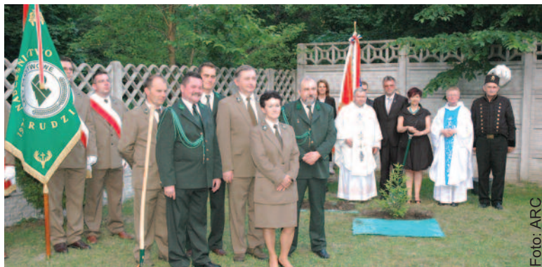
W chwilę po posadzeniu drzew przez leśników, górników, samorządowców i duchownych.

Z łopatomy w dłoniach sadzenia drzew podjęli się m.in. przedstawiciele nadleśnictw, które ufundowały drzewa. Leśnicy wkopali w ziemię sosnę piską.