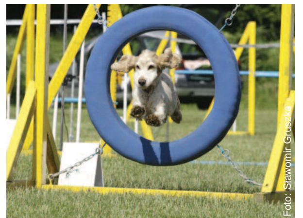
Psy wykazały się podczas zawodów ogromnymi umiejętnościami.