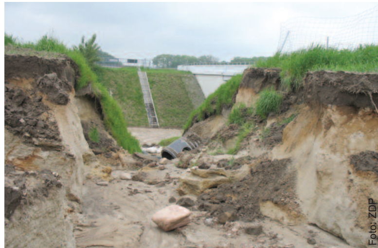
Podczas ostatniej powodzi osuwiska powstały przy autostradzie A4.

Opracowanie to jest na bieżąco wykorzystywane. Informacja o dokonanej ocenie zagrożeń ruchami masowymi przekazana została gminom powiatu gliwickiego, jest im też udostępniona dla sporządzania opracowań o charakterze planistycznym. Urzędnicy starostwa wykorzystują zdobyte infor-