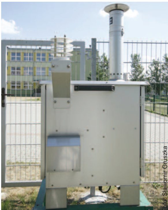
Stanowisko pomiarowe w Knurowie na bieżąco monitoruje jakość powietrza na naszym terenie.

Poza odpadami komunalnymi powstają także odpady przemysłowe. Ich