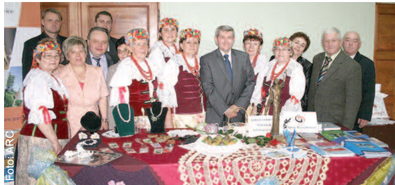
Reprezentacja Gminy Gierałtowie na uroczystości wręczenia Śląskich Oskarów przy swoim stoisku promocyjnym.

W uzasadnieniu przyznania Śląskiego Oscara podkreślono wiele osiągnięć Gminy Gierałtowie, m.in. niski wskaźnik bezrobocia, dbałość o służbę zdrowia, inwestowanie w oświatę, nowoczesną bazę sportową, rozwój kultury. Przypomniano, iż Gierałtowie są liderem w pozyskiwaniu środków zewnętrznych na inwestycje i mają liczne nagrody za najlepiej oświetloną gminę, a także znalazły się w złotej setce samorządu. Ponadto gmina może się poszczycić budową nowoczesnego parku biznesowo – przemysłowego, o powierzchni 73 ha, oferując doskonałe tereny inwestycyjne przy skrzyżowaniu autostrad A1 i A4. (RG)