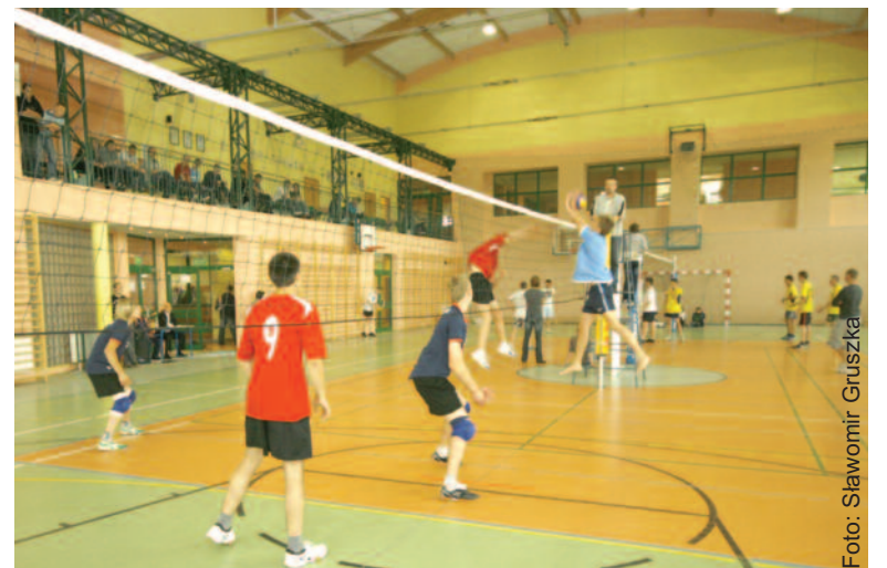
Zacięta walka pod siatką.