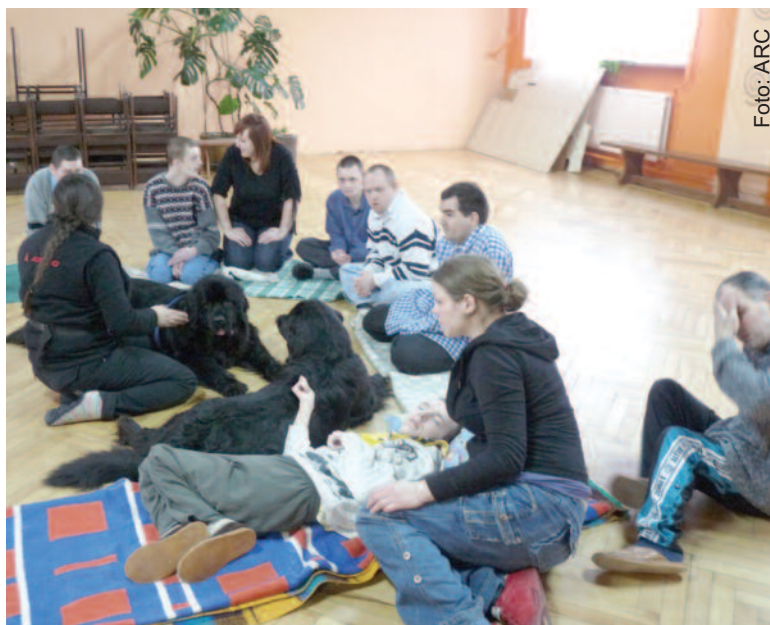
Zajęcia z kynoterapii w Zespole Szkół Specjalnych w Knurowie, przeprowadzane w ramach projektu „Współczesny Michał Anioł”.

Nie jest możliwe podnoszenie poziomu szkolnictwa bez troski o kwalifikacje jego pracowników, stąd do nich adresowany jest kolejny projekt, na który Powiat Gliwicki pozyskał dofinansowanie w ramach Priorytetu IX PO KL. Niedawno rozpoczęła się realizacja dwuletniego projektu o wartości 350 tys. zł pn. „Nowe kwalifikacje – nowe perspektywy. Podniesienie kwalifikacji zawodowych