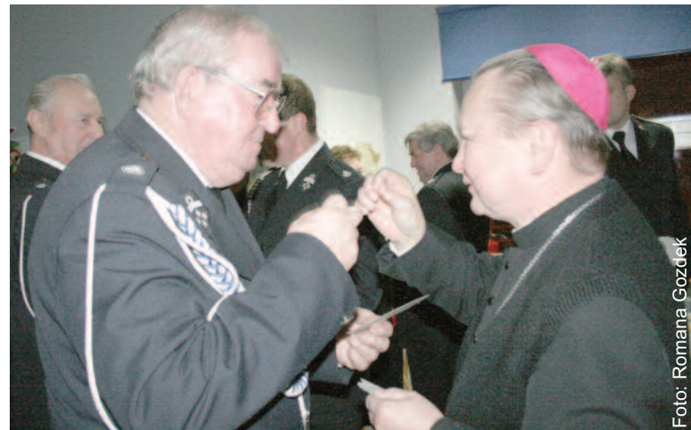
Składanie życzeń podczas powiatowego spotkania oplatkowego strażaków w ub. roku w Gieraltowicach.

– Od dzieciństwa lubiłem strażackie wozy, mundury i wszystko, co się wiąże z tą formacją – opowiada ks. biskup. – Pamiętam pewien zabawny epizod z moich młodych lat. Jako chłopak brałem udział w uroczystości oddania do użytku nowej sikawki strażackiej. To były lata 50. ubiegłego wieku, więc wóz strażacki, na której ją umieszczono, był konny. Jednak jak na owe czasy sprzęt był nowoczesny i wszyscy w gminie Bierawa (gdzie leżały moje rodzinne Dziergowice) bardzo się z niego cieszy-