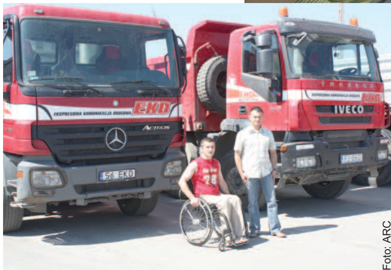
Wspólnicy z dumą prezentują samochody swojej firmy.

Plan wszedł w życie. Ekspresowa Komunikacja Drogowa Sp. z o.o. (w skrócie EKD Sp. z o.o.), bo tak nazwali firmę, zaczęła się dynamicznie rozwijać.