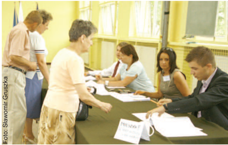
Podczas głosowania w jednej z obwodowych komisji wyborczych, zlokalizowanej w Liceum Ogólnokształcącym Zespołu Szkół im. I. J. Paderewskiego w Knurowie.