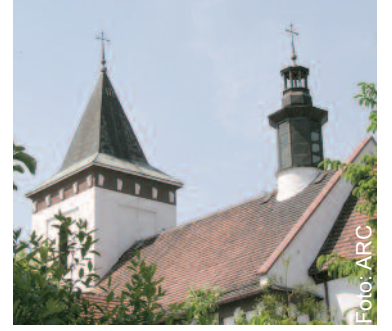
Wieża kościoła p. w. św. Walentego, który ostatecznie stanął w Chechle...

Legenda jest pokłosiem konkursu pt. „Najpiękniejsze legendy powiatu gliwickiego” organizowanego przez Starostwo Powiatowe w Gliwicach w 2008 r.