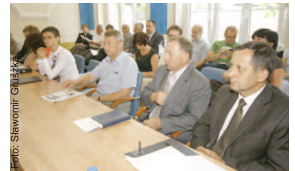
Na czerwcowej sesji wiele uwagi poświęcono sprawom bezpieczeństwa przeciwpowodziowego, a gościli na niej m.in. gospodarze gmin, przedstawiciele górnictwa i instytucji odpowiedzialnych za gospodarkę wodną.

rzyszenie Calvi Cantores-Męski Zespół Wokalny Calvi Cantores z Knuruwa . Następną uchwałą zadecydowała o utworzeniu nowej publicznej szkoły ponadgimnazjalnej – Zasadniczej Szkoły Zawodowej Specjalnej dla Uczniów Upośledzonych w Stopniu Lekkim w Pyskowicach, która działać będzie w tamtejszym Zespole Szkół Specjalnych. Radni zaakceptowali także – przyjmując stosowne uchwały – zmiany w uchwale budżetowej powiatu na br. oraz określili tryb prac nad projektem uchwały budżetowej powiatu. Przegłosowali również uchwałę, dotyczącą udzielenia pomocy finansowej Gminie Wielowieś. Powiat Gliwicki przyznał jej 5 tys. zł z przeznaczeniem na renowację pomnika ofiar UB i NKWD położonego w lesie Hubertus.