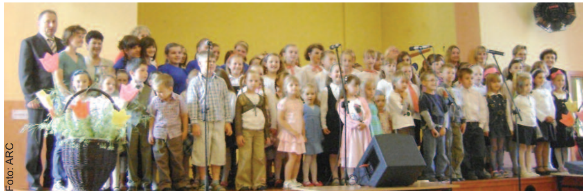
Dzieci i młodzież z terenu gminy Wielowieś wyjątkowo licznie i chętnie uczestniczą w zajęciach chórów.

Narodowe Centrum Kultury zarządza programem przy pomocy partnera, jakim jest Międzynarodowy Festiwal „Wratlavia Cantans” oraz dzięki zespołowi koordynatorów regionalnych. Stałymi formami działalności w ramach programu są m. in.: dodatkowe lekcje śpiewu, comiesięczne spotkania dyrygentów, warsztaty dla osób prowadzących chóry oraz doroczne przeglądy chórów szkolnych. Opiekę merytoryczną i metodyczną zapewnia Minister Kultury i Dziedzictwa Narodowego przy finansowym wsparciu samorządów lokalnych. (IEM)