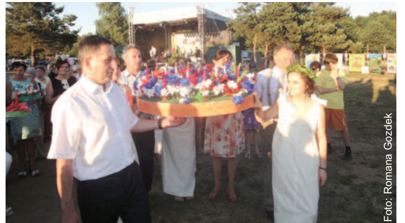
Największy symboliczny wianek przygotowali gospodarze imprezy.

ogromne ogniska, a wieczorem na wodzie jeziora wszyscy puszczały wianki. Imprezę zakończył pokaz sztucznych ogni oraz dyskoteka. Noc Świętojańska została zorganizowana przez Gminny Ośrodek Kultury Rudziniec, a wsparł ją swym dofinansowaniem Powiat Gliwicki. (RG)