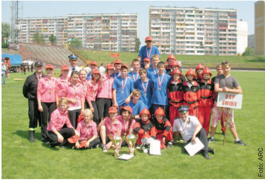
Drużyny ze Świbia ze swoimi kolegami z Dąbrówki po zwycięstwie w wojewódzkich zawodach.