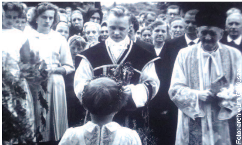
Po mszy prymicyjnej w rodzinnych Dziergowicach, 1 lipca 1962 r.

Ma typową biografię mieszkańca pogranicza. Gdy przyszedł na świat, jego rodzinne strony od dawna były we władaniu Niemiec, a dodatkowo wstrząsała nimi II wojna światowa. Widział jako dziecko ciała poległych żołnierzy, ale uważa, że dobrze, iż rodzice nie izolowali go od tego, co działo się wokół. – Śmierć jest częścią