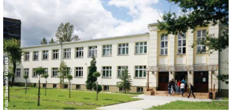
Wypiękniły powiatowe budynki szkolne m.in. przy ul. Szpitalnej 25 w Knurowie.

Podczas wakacji przeprowadzono w placówkach oświatowych szereg remontów i modernizacji. W „Paderewskim” w LO wyremontowano schody, z kolei w budynku przy ulicy Szpitalnej trwa drugi etap termomodernizacji, który ma