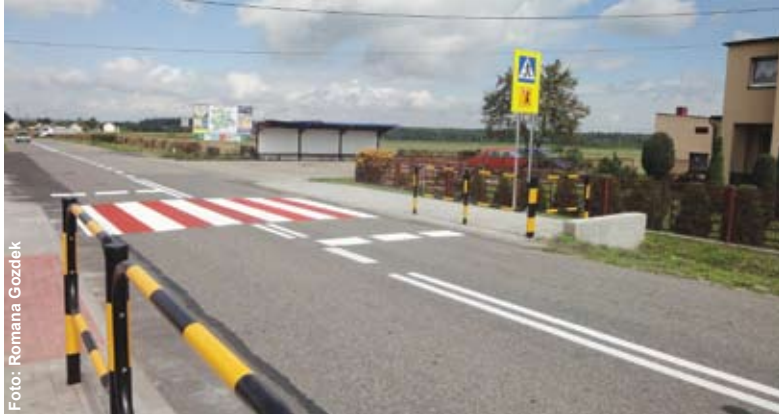
Poprawiło się bezpieczeństwo m.in. przy szkole w Rudzińcu.

Program „Bezpieczna droga do szkoły” realizowany jest od czterech lat. W 2007 r. objął rejon czterech szkół (w Poniszowicach, Wielowsi, Wilczy i Nieborowicach), w 2008 r. – kolejnych czterech (w Paczynie, Toszku, Świbiu i Chudowie), a w 2009 r. następnych trzech (w Knurowie przy ul. Michalskiego, w Pyskowicach przy ul. Wyzwolenia oraz w Bycinie). Wszędzie tam tak zorganizowano i oznaczono mieszczące się przy szkołach przejścia dla pieszych, by maksymalnie zwiększyć bezpieczeństwo dzieci. Ustawione zostały przy nich trzy znaki drogowe: przejście dla pieszych, ta-