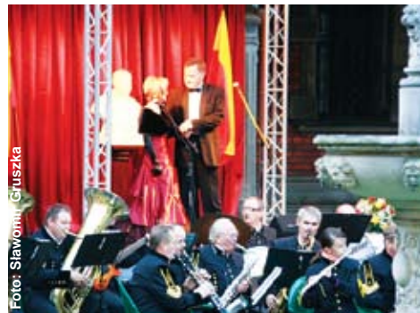
Koncerty w Pławniowicach mają zawsze niepowtarzalny klimat.

5 września na Dziedzińcu Maryjnym Zespołu Pałacowo-Parkowego w Pławniowicach zorganizowano ostatni koncert w ramach VII Pałacowego Lata Muzycznego. Poprzedziło go odsłonięcie kopii popiersia hrabiego Franciszka von Ballestrema.