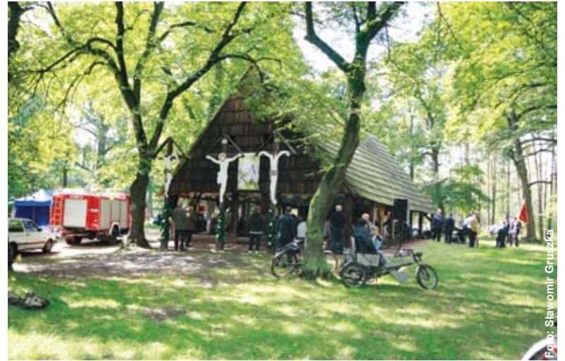
Tak obecnie wygląda to miejsce...

Legenda jest pokłosiem konkursu pt. „Najpiękniejsze legendy powiatu gliwickiego” organizowanego przez Starostwo Powiatowe w Gliwicach w 2008 r.