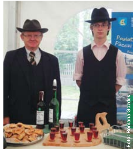
Przedstawiciele rodziny Kielbasów ze swym zwycięskim trunkiem.

Nagrody zdobyte w tym konkursie to uwieńczenie moich wieloletnich działań. Potrawy z wieprzowiny przygotowuję od 30 lat, a specjalizuję się w nich od roku 1994, kiedy stworzyłem w Proboszczowicach moje „Ranczo”. Mój tata był rzeźnikiem, więc tradycję przyrządzania mięsiva wyniosłem z rodzinnego domu, do dziś z powodzeniem je kultuwuję. Poprzez to zwycięskie danie – wieprzka filowanego z nadzieniem z kaszy gryczanej i kilku innych gatunków mięs, podawanego w warzywach, chciałem zmienić mit o kuchni śląskiej, w której najbardziej znana jest rolada! Nasz region ma także wiele innych, bardzo pysznych potraw, które są dziś odrobinę zapomniane, a szkoda... Podobnie jest z ranczówką. Wielu z nas robi tradycyjną wiśniówkę, ale ta moja ma, jak to określiło jury, specyficzny smak i aromat, słodycz, ale jednocześnie goryczkę tradycyjnej cherry. Uzyskuję to poprzez odpowiedni dobór najlepszych owoców,