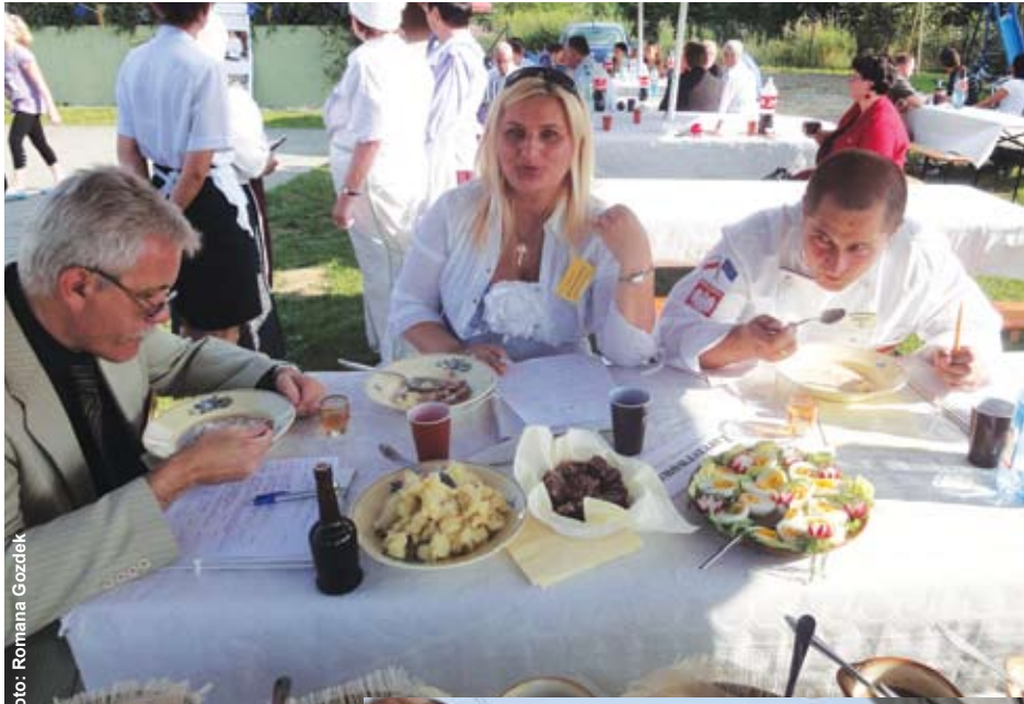
Nielatwe zadanie miało jury, bo wszystkie żury były wspaniałe.

Na imprezie było też szereg innych atrakcji – zabawy dla dzieci, konkursy taneczne i bufety. Uczestnicy grali w „chłopskiego golfa”, rzucając białymi kaloszami do „dolków”, które