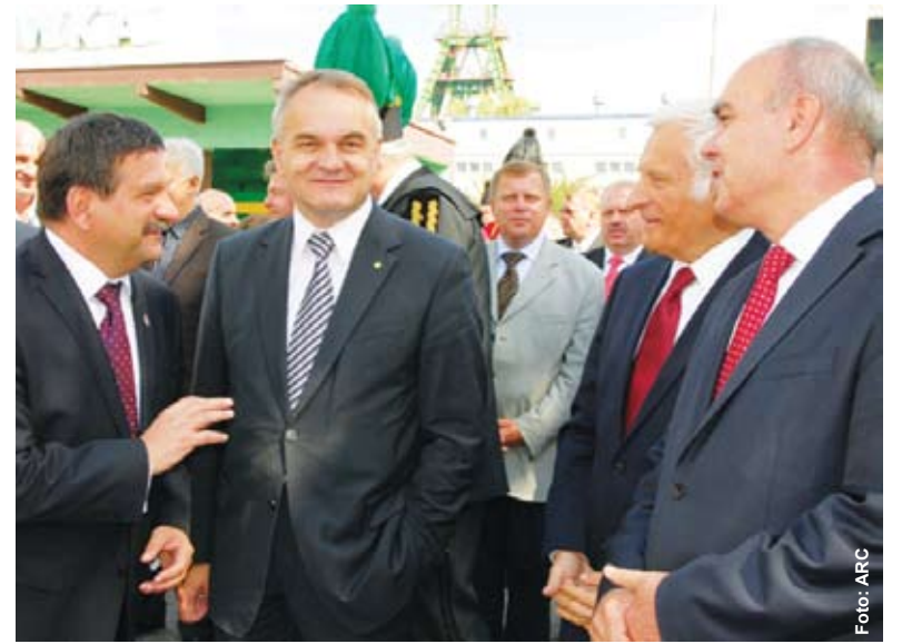
Podczas spotkania w Jastrzębiu Zdroju.