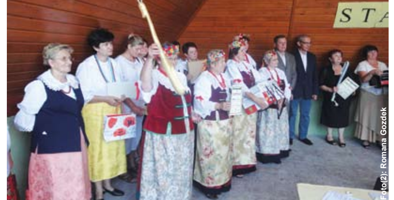
Za to danie panie otrzymały Złotą Warzechę (więcej na str. 6).

wać, ostudzić aby była letnia. Do mąki dodać czosnek, dolać tyle wody, aby uzyskać gęstą konsystencję. Dodać skórkę z chleba lub kwas chlebowy. Pozostawić do fermentacji. Po wytworzeniu się na powierzchni piany – przemieszać. Przez cały czas kiszienia zakwas należy od czasu do czasu przemieszać. Jest gotowy, gdy na powierzchni nie będzie piany tylko zmętniały płyn.