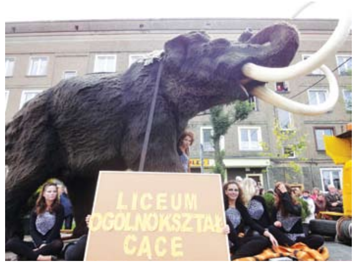
Entuzjazm budził powiatowy mamut wielki w otoczeniu licealistek z „Konopnickiej”.