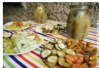
Jak ukisic wielobarwne ogórki? W Wilczy nikt nie zdradza tej tajemnicy.

– Nasza impreza co roku gromadzi całe rodziny i o to nam chodzi. Jest to okazja do integracji i wypoczynku na świeżym