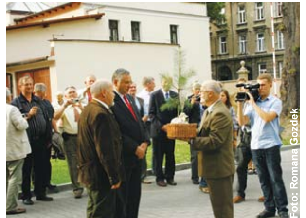
W chwilę przed posadzeniem sosny taborskiej, będącej symbolem przyjaźni polsko-niemieckiej.

sosny taborskiej, s t a n o w i ą c e j symbol przyjaźni polsko-niemieckiej. Powiat Gliwicki od 2004 r. lat blisko współpracuje z Powiatem Mittelsachsen, a Niemcy okazali naszym mieszkańcom wielką pomoc w czasie