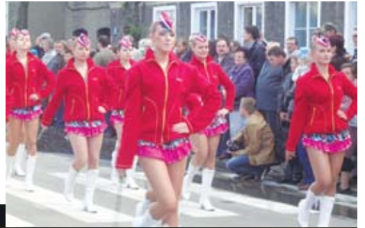
Dużo braw zebrały mażonетки.