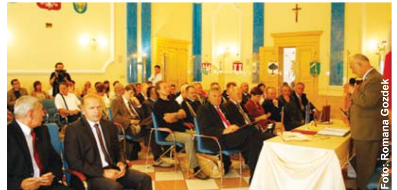
Na sali sesyjnej tym razem było wyjątkowo dużo gości.

wodzi – więcej na ten temat przeczytać można obok. Sadzonka posadzonej sosny wyrosła z nasienia, poświęconego przez papieża Benedykta XVI. Podczas sesji starosta gliwicki w dowód wdzięczności za okazaną pomoc wręczył staroście Powiatu Mittelsachsen wykonaną w drewnie płaskorzeźbę