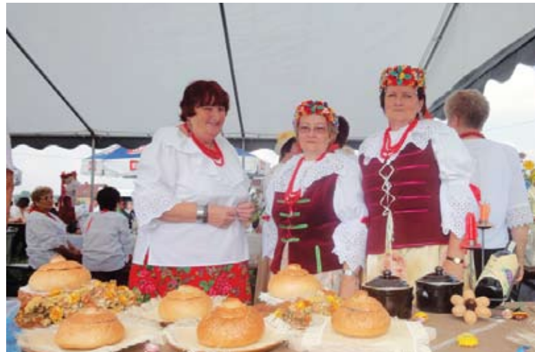
Gospożynie z Gieraltowic serwują żur w specjalnych chlebkach.

wać, ostudzić aby była letnia. Do mąki dodać czosnek, dolać tyle wody, aby uzyskać gęstą konsystencję. Dodać skórkę z chleba lub kwas chlebowy. Pozostawić do fermentacji. Po wytworzeniu się na powierzchni piany – przemieszać. Przez cały czas kiszienia zakwas należy od czasu do czasu przemieszać. Jest gotowy, gdy na powierzchni nie będzie piany tylko zmętniały płyn.