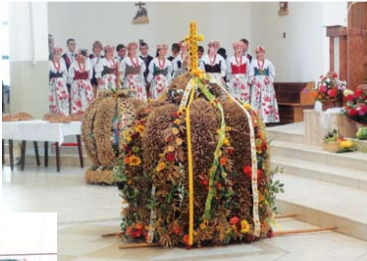
Korony dożynkowe, a obok bochny chleba, upieczonego z tegorocznego zboża i kosze z darami ziemi – symbole święta plonów.

Korowód w Pyskowicach nie bez kozery nazywany jest największym korowodem dożynkowym w kraju. Witają go tłumy mieszkańców miasta i powiatu, zgromadzone wzdłuż ulic wiodących z kościoła na plac, gdzie obchodzono święto plonów. Największy entuzjazm wzbudziły wspomniane już prehistoryczne zwierzęta, które powitano oklaskami. A w korowodzie zobaczyć też można było m.in. dzieci w strojach ludowych, sekcje działające przy