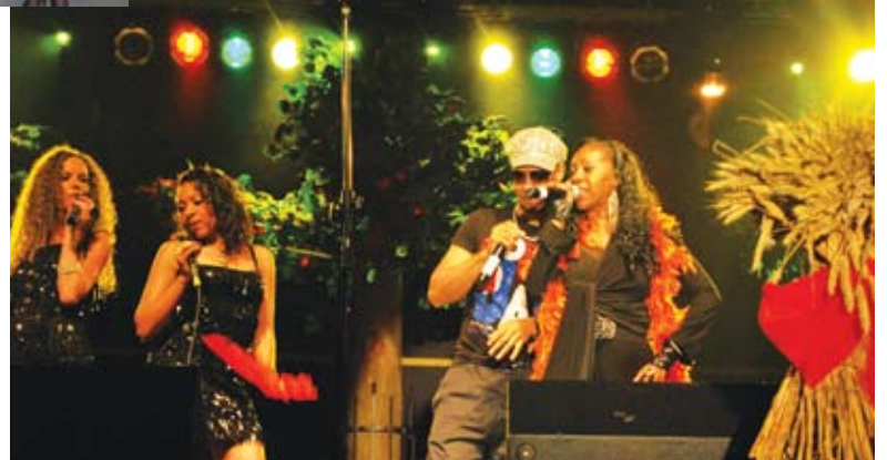
Zabawa była na całego, choć szyki psuła pogoda. Do czerwoności rozgrzał publiczność występ Boney M.

Jedynie, co psuło zabawę, była przekropna pogoda. Wszyscy mówili, że dokładnie taka sama, jak podczas tegorocznego lata, gdy niejednokrotnie mocno psuła efekty rolniczego trudu.