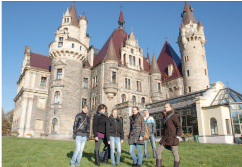
Uczniowie z pyskowskiej „Konopnickiej” mieli ciekawe zajęcia z historii na zamku w Mosznej.

W ramach „Edukacji dla rozwoju” zostaną sfinansowane wszelkie koszty prowadzenia zajęć, łącznie z zakupem niezbędnego sprzętu. Zakłada się, że projektem zostanie objęta grupa ok. 700 uczniów, a obecnie właśnie kończy się pierwszy nabór uczestników. (MFR, EP)