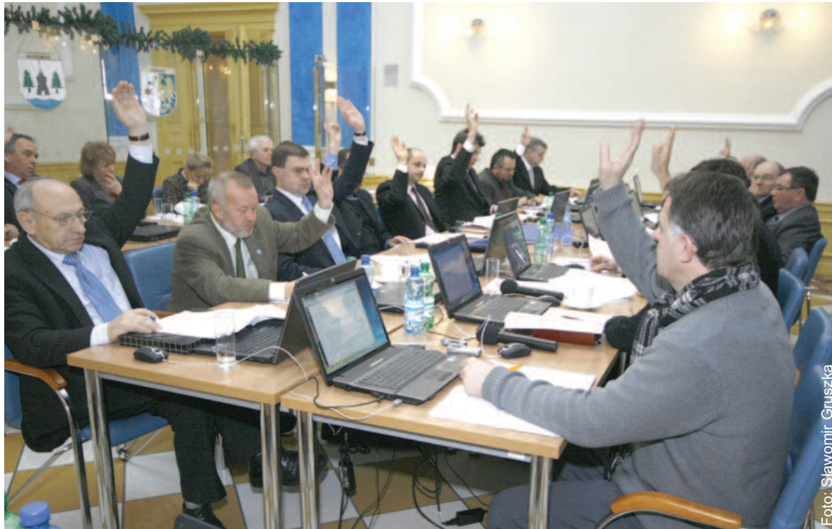
Podczas jednego z głosowań.

Podczas sesji radni jak zawsze zgłaszali też swe wnioski, interpelacje, zapytania i postulaty – większość z nich dotyczyła stanu dróg powiatowych. Następna sesja Rady Powiatu Gliwickiego odbędzie się 24 lutego.