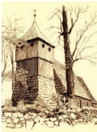
Starego drewnianego kościółka już w parafii nie ma...

Obydwie parafie przez te prawie 240 lat prowadziły oddzielne księgi parafialne (chrztów, ślubów i pogrzebów). W protokole ko-