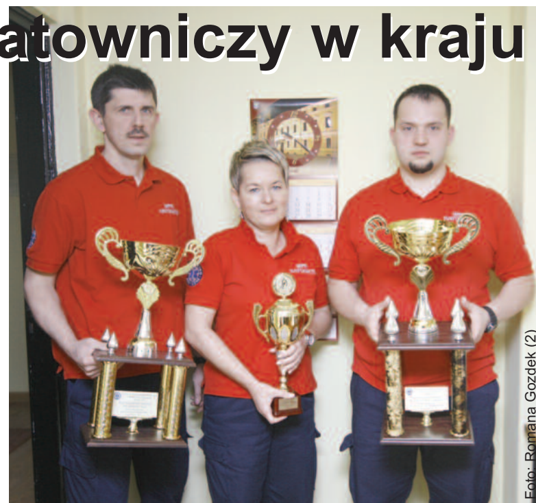
Zwycięzcy z pucharami, które zdobyli na międzynarodowych mistrzostwach w Szczyrku.