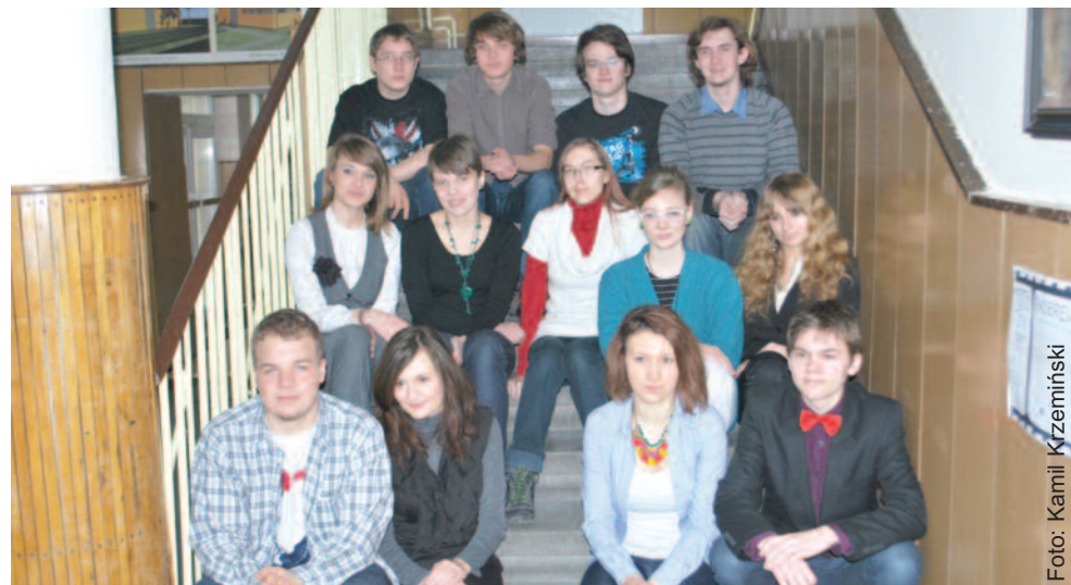
Grono szkolnych olimpijczyków jest w „Paderewskim” w tym roku wyjątkowo liczne i mocne.