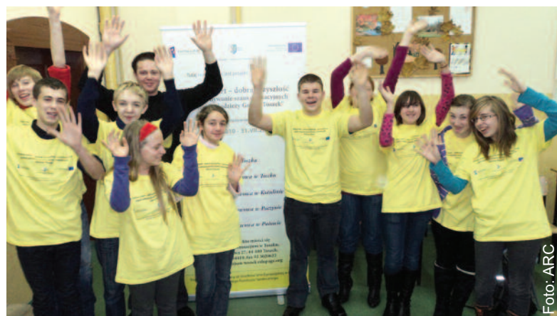
Humory dopisują uczniom nie tylko podczas zajęć warsztatowych z języka niemieckiego.

przewiduje kształcenie młodzieży w dziedzinach, które sprawiają uczniom najwięcej problemów. I tak np. zajęcia matematyczne mają na celu pokazanie uczestnikom, że matematyka jest niezwykle przydatna w życiu codziennym. W trakcie tych spotkań poruszane są m.in. tematy związane z ekonomią i jej praktycznym zastosowaniem w życiu. Wielkim zaintereso-