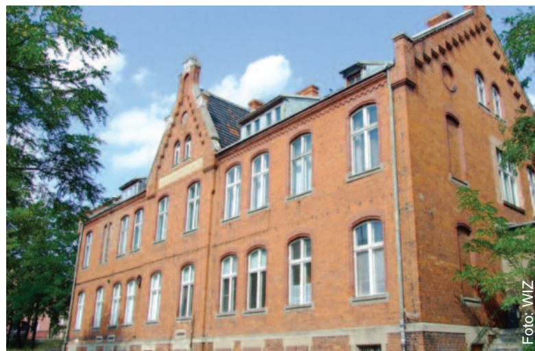
Niebawem zmieni się oblicze starej części Szpitala Powiatowego w Pyskowicach.

Również w budynkach Starostwa Powiatowego w Gliwicach nie zaniechano inwestycji poprawiających bezpieczeństwo ich użytkowania oraz zapewniających dostosowanie do obowiązujących standardów technicznych. W okresie od 1 lutego do 30