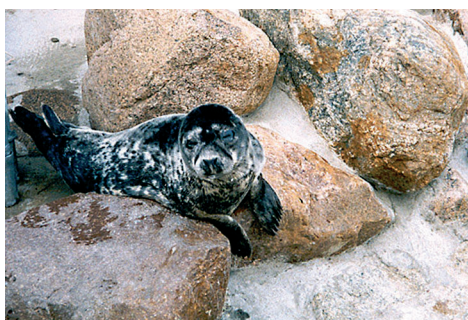
Hel - fokarium.

Wielkim bogactwem tego regionu są piaszczyste plaże z wydhami, które ciągną się od Białogóry po Hel, oraz wysokie i strome fragmenty wybrzeża klifowego w strefie Kępy Puckiej i Swarzewskiej. Powstają one w wyniku destrukcyjnej siły morza, które rokrocznie atakując ląd podmywa wysokie na kilkadziesiąt metrów brzegi, powodując ich stopniowe rozkruszanie. Tego typu wybrzeża stanowią prawdziwą atrakcję, z największym w tym rejonie klifem chładowskim o wysokości 40 metrów, usytuowanym pomiędzy Władysławowem i Rozewiem. Ziemia Pucka to raj dla ornitologów. Mogą oni obserwować ptactwo, które w czasie dwóch rocznych migracji (wiosna i jesień) zatrzymuje