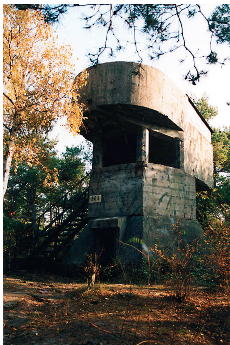
Hel - bunkry.