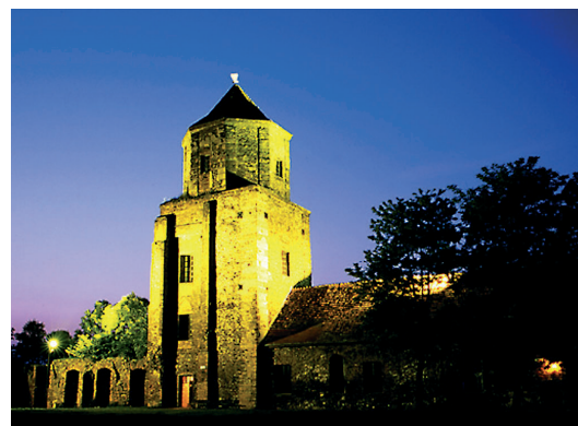
Zamek w Toszku nocą.

„Szczypta świeżego powietrza, odrobina węgla czarnego, połacie lasów i pól zielonych, srebrzysta tafla trzech jezior, cztery miasta o bogatej historii, cztery gminy nie mniej ciekawe, nowe osiedla mieszkaniowe, dwa zamczyska wcale nie ponure, jeden pałac jak perła błyszcząca, przepiękne kościołki drewniane, zakątki urocze i miejsca tajemne, a wszystko to owiane legendami... Do tego dodać trochę rowerowych ścieżek, tras turystycznych, owoców z powiatowych sadów i lasów, wymieszać, zapamiętać, zobaczyć. Tak powstaje obraz powiatu gliwickiego – jedynego takiego miejsca na ziemi. Należy go wdychać, smakować, odwiedzać, korzystać z jego uroków, a nawet żyć tutaj!”