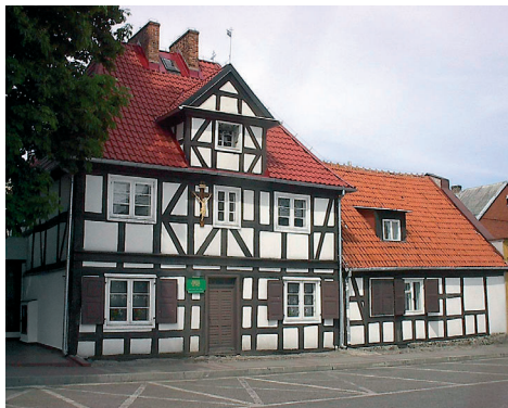
Muzeum, szpitalik - Puck.