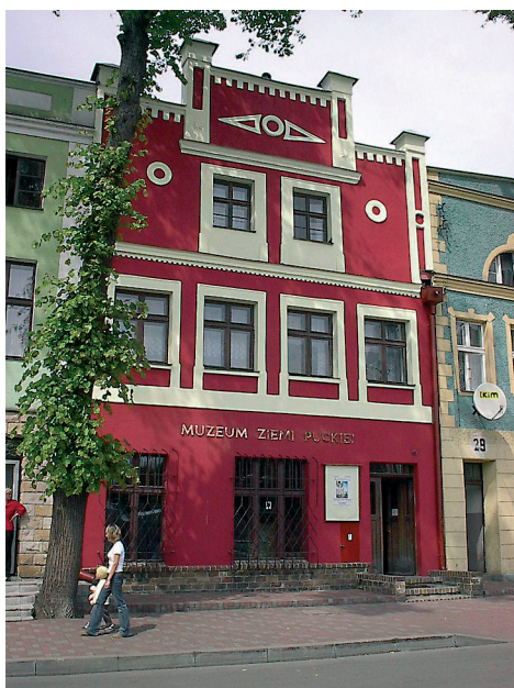
Puck - muzeum, kamienica mieszczkańska.