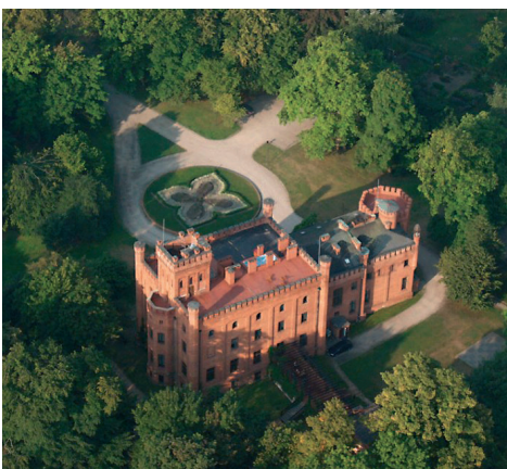
Rzućewo - zamek.