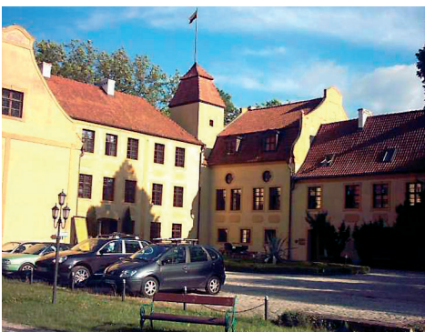
Zamek - Krokowa.