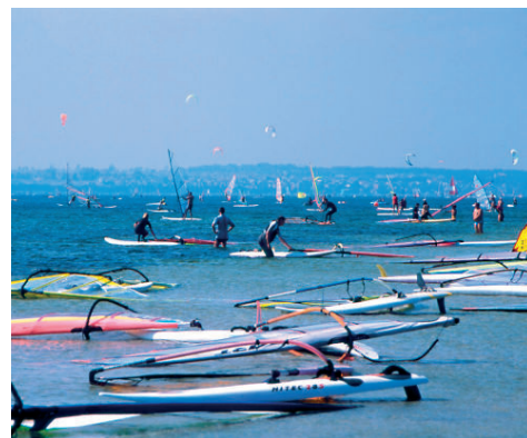
Surfing na wodach zatoki.