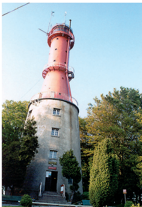
Latarnia w Rozewiu.

Historycznym centrum regionu jest Puck. Porty w Helu, Jastarni i Władysławowie są dogodnie położone dla jachtów żeglujących do Danii, Niemiec, krajów skandynawskich i nadbałtyckich. Zatoka Pucka, będąca naturalnym bogactwem regionu, nadal pozostaje ważnym źródłem utrzymania żyjących tutaj rybaków. Razem z Półwyspem Helskim stanowi podstawę rozwijającej się prężnie turystyki.