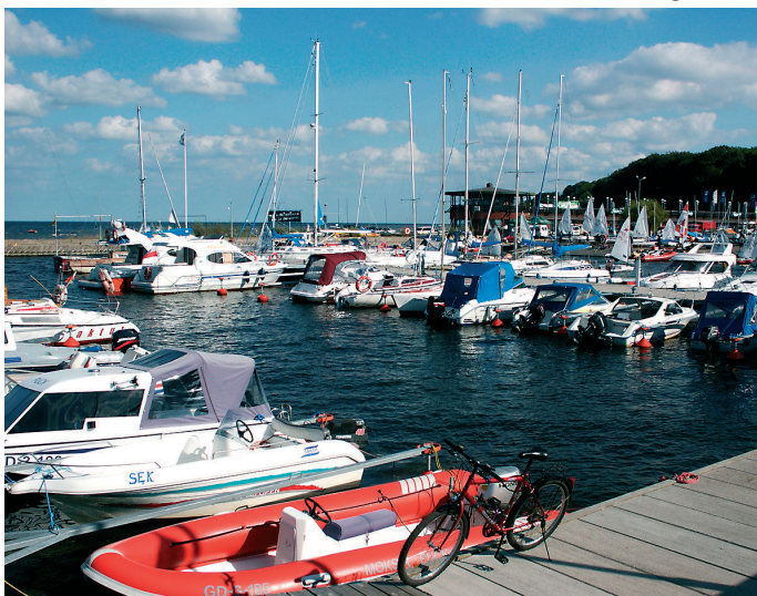
Port jachtowy w Pucku.