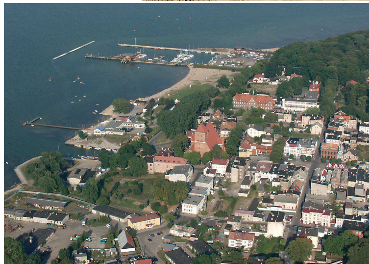
Puck z lotu ptaka.