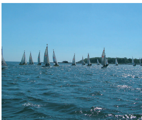
Regaty na Zatoce Puckiej.