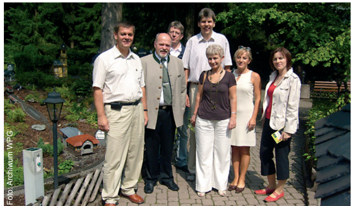
Delegacja powiatu gliwickiego z gospodarzami powiatu Freiberg w Miniature Park, jednej z atrakcji turystycznych Saksonii.