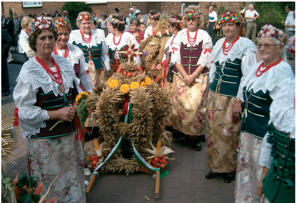
W ubiegłym roku rolnicze święto obchodzone było w Przyszowicach w gminie Gierałtowie.