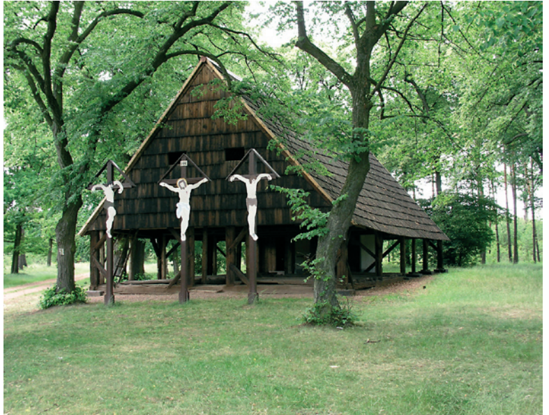
Leśna kapliczka zwana Magdalenką.