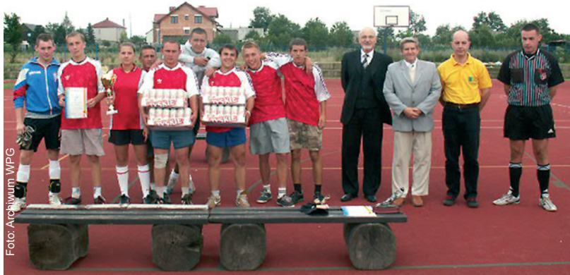
Na zdjęciu zwycięska drużyna z organizatorami imprezy.

D ziewięć drużyn wzięło udział w XIII Turnieju Piłki Nożnej Pięciosobowej o Puchar Lata, zorganizowanym przez wójta gminy Gierałtowice i Zarząd Forum Młodzieży Samorządowej w Gierałtowicach. Impreza odbyła się 4 sierpnia na boisku Szkoły Podstawowej w Chudowie.