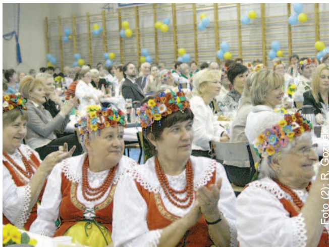
To była świetna zabawa – mówiły panie ze wszystkich stron powiatu.

Impreza to już swoista tradycja – w ub. roku I Europejski Dzień Kobiet Powiatu Gliwickiego odbył się w Chudowie, teraz przyszedł czas na gościnne Pilchowice. Panie z kół gospodyń przygotowały na tę okazję pomysłowe, pełne humoru programy artystyczno-rozrywkowe, w których wątki lokalne przeplatały się z europejskimi. Śmiechu było co niemiara również podczas występu pilchowickich uczniów. Blisko czterogodzinną zabawę zakończył konkurs, w którym główne wygrane - dwa zaproszenia