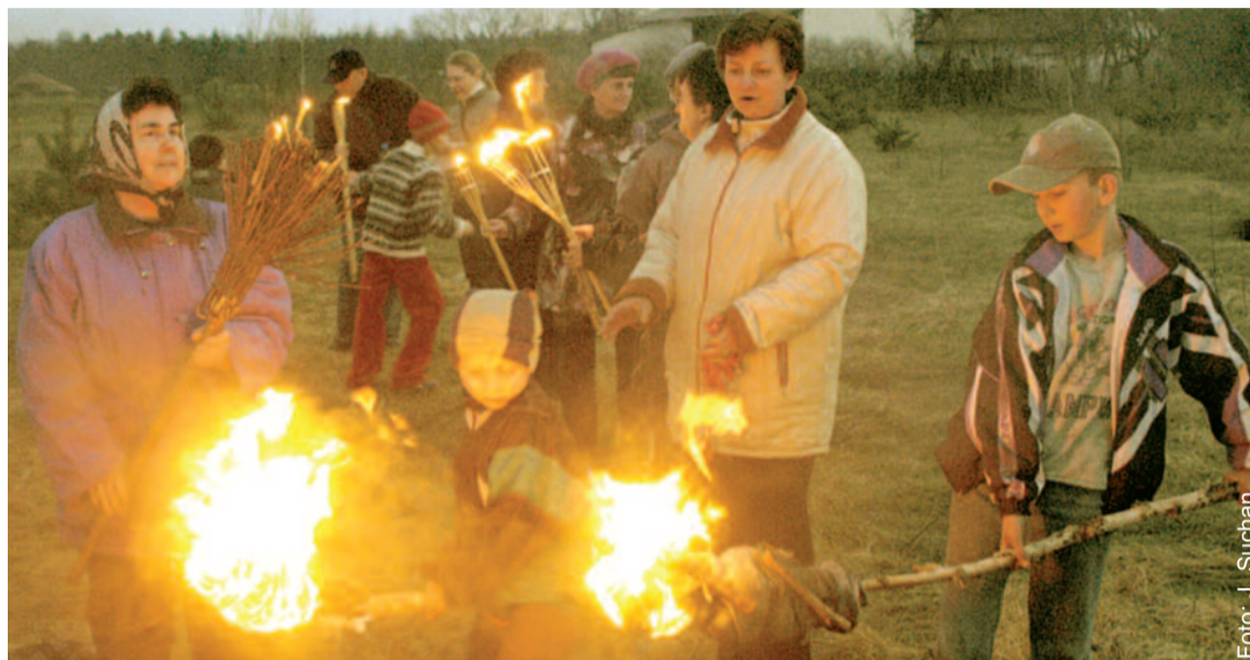
Fakle to bardzo stary obrzęd, przekazywany w Stanicy z pokolenia na pokolenie.

W Wielki Czwartek wieczorem, po nabożeństwach związanych z Triduum Paschalnym mieszkańcy Stanicy w gminie Pilchowice udają się na okoliczne pola, aby uczestniczyć w obrzędzie zwanym fakle. Pojawiają się tam całymi rodzinami. Na polach rozpalane są wielkie stosy chrustu. Dookoła nich, jeszcze za dnia, rodzice wkładają w zoraną ziemię niewielkie, zrobione z gałązek lub drewna krzyżyki i rozrzucają cukierki. Zadaniem dzieci i młodzieży jest odnalezienie ich w świetle pochodni (fakli). Właściwe fakle zrobione są ze starych zużytych brzozowych mioteł na trzonku z gałęzi. Obrzęd trwa dopóty, dopóki wszys-