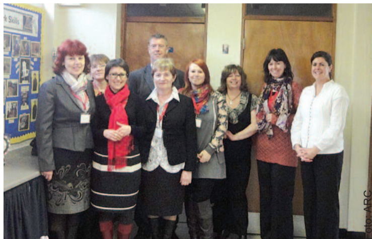
Uczestniczki wyjazdu odwiedziły m.in. szkołę specjalną w Rhyl.

szkół z zainteresowaniem oglądali rozwiązania techniczne ułatwiające rehabilitację dzieci poruszających się na wózkach. Gospodarze dzielili się również doświadczeniami związanymi z przeciwdziałaniem cyberprzemocy wśród dzieci i młodzieży. Doświadczenia zdobyte w tym zakresie przez walijskich partnerów mają szansę zostać również wykorzystane w szkołach i poradniach psychologiczno-pedagogicznych Powiatu Gliwickiego.