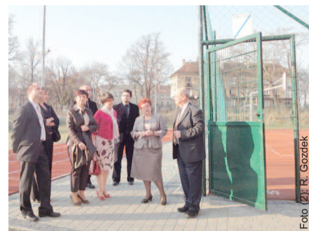
Komisja Edukacji na posiedzeniu wyjazdowym, podczas którego wizytowała powiatowe placówki oświatowe w Pyskowicach, m.in. Zespół Szkół im. M. Konopnickiej.

tywnej integracji, Poddziałanie 7.1.2. Rozwój i upowszechnianie aktywnej integracji przez powiatowe centra pomocy rodzinie Programu Operacyjnego Kapitał Ludzki; sprawozdanie roczne z wykonania planu finansowego za 2010 r. Powiatowej Biblioteki Publicznej w Gliwicach; zapoznanie się z funkcjonowa-