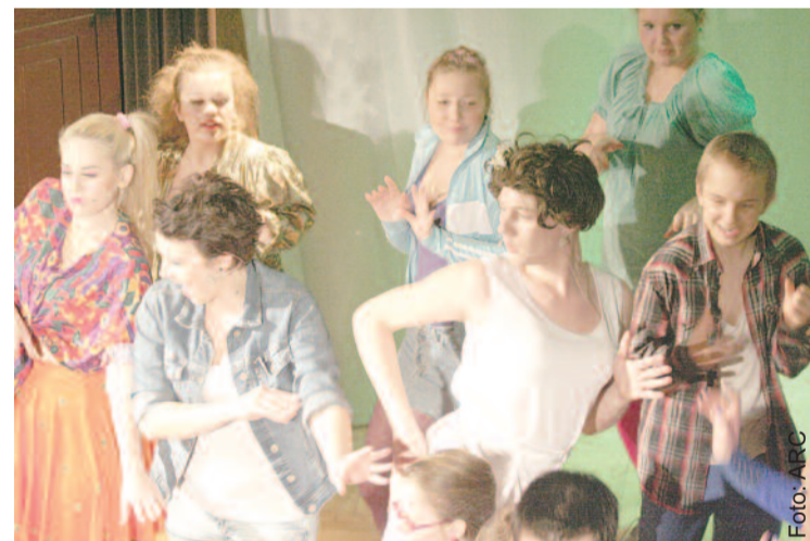
Młodzi aktorzy jak zawsze uwiedli publiczność swym talentem i energią.