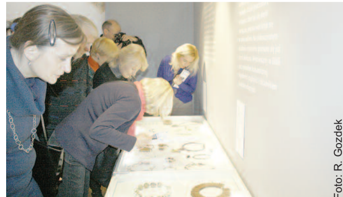
Na wernisażu gliwickiej wystawy eko-biżuteria zebrała mnóstwo komplementów.