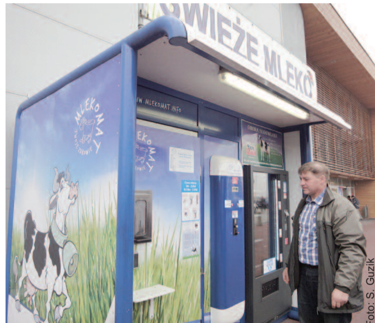
Mlekomy to białe i niebieskie budki z charakterystycznym rysunkiem krowy. Jeden z nich ustawiony jest w Gliwicach przy Tesco Extra.