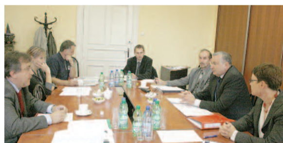
Jedno z posiedzeń Komisji Zdrowia, na którym rozpatrywano sytuację naszych szpitali.

Przypomnijmy – obecna kadencja rozpoczęła się po wyborach samorządowych w listopadzie 2010 r. Tak więc w 2010 r. Komisja Zdrowia zebrała się na jednym posiedzeniu, które odbyło się w grudniu, a frekwencja wynosiła na nim sto proc. Zaopiniowany został na nim projekt wieloletniej prognozy finansowej Powiatu Gliwickiego na lata 2011-2014 oraz projekt uchwały budżetowej na 2011 r. Komisja przekazała też do Zarządu Powiatu Gliwickiego dwie opinie.