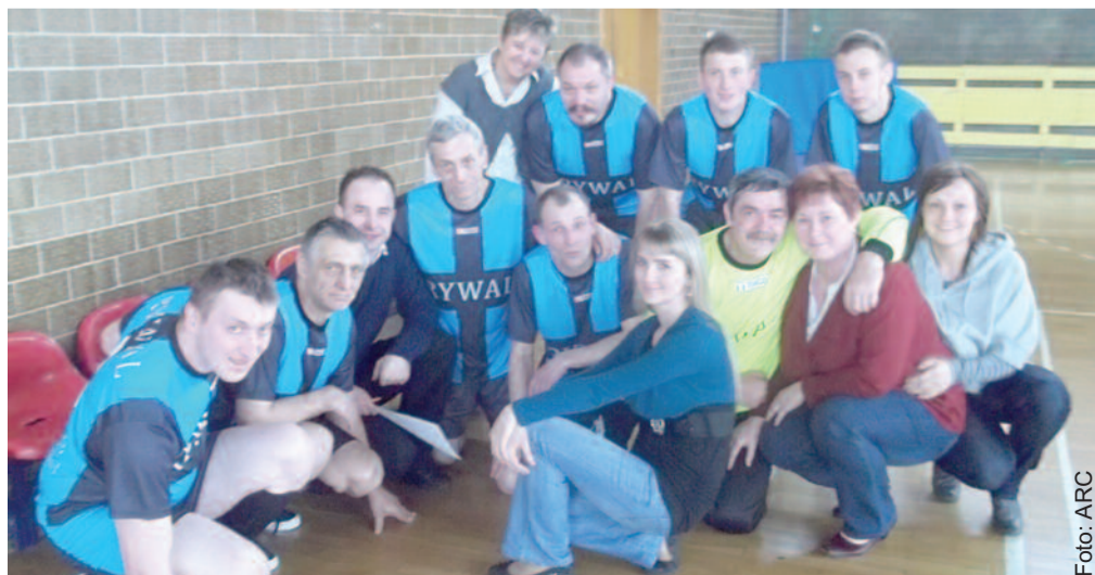
Piłkarska reprezentacja „Zameczku” ze swoimi opiekunkami.