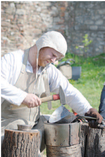
W Toszku można popatrzeć, jak pod młotem płatnerza powstają broje rycerskie.

wać widzowie podczas Browarii Toszeckich. W czasie imprezy inscenizowana jest jakaś legenda czy historia związana z zamkiem w Toszku. Czy to podanie o okrutnym baronie Jerzym von Redern, czy dzieje księżnej Judyty Mazowieckiej, która mieszkała przez pewien czas w toszeckim zamku i jako wdowa zaczęła szukać dobrego kandydata na męża.