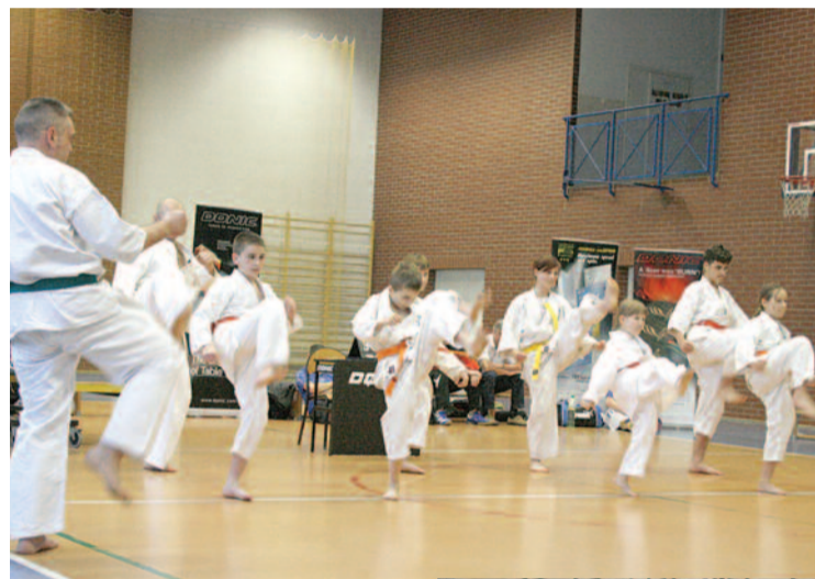
Pokaz mocy w wykonaniu młodych karateków z Rudzińca.