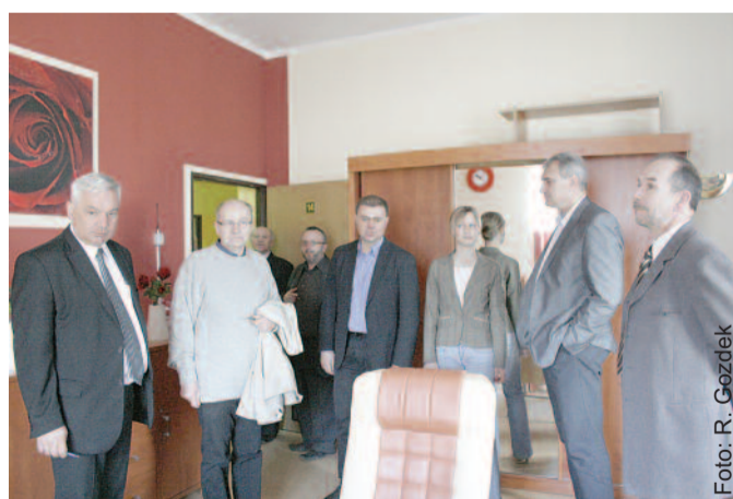
Radni w jednym z pokoi mieszkańców „Zameczka”. Tak jak wszystkie, jest kolorowy i funkcjonalnie wyposażony.

We wspólnym posiedzeniu komisji, które prowadzili ich przewodniczący Le-