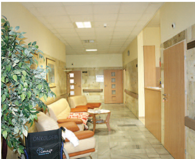
Oddział jest przytulny i przyjazny dla pacjentów.

– Zakres naszej działalności skupia się na trzech zagadnieniach – wyjaśnia. – Pierwszy to przyjmowanie do zdiagnozowania osób z podejrzeniem choroby nowotworowej. Drugi obejmuje leczenie chemiczne, często w skojarzeniu z leczeniem chirurgicznym lub radioterapią, przy czym współpracujemy z oddziałem chirurgii ogólnej w naszym szpitalu oraz z gliwickim oddziałem Centrum Onkologii. Trzeci stanowi leczenie powikłań po chemio- i radioterapii, takich jak np. anemie czy stany zapalne. Ze względu na kontrakt, jaki otrzymaliśmy z NFZ, leczenie chemiczne prowadzone jest u nas w cyklu jednodniowym, ale zabiegać będziemy również o możliwość poszerzenia