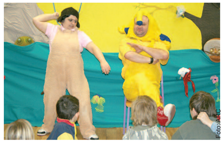
Uczniom Zespołu Szkół Specjalnych w Pyskowicach bardzo podobał się spektakl teatralny zorganizowany w ramach projektu.

w ramach projektu właśnie dla uczniów szkół specjalnych. Mogą oni wyrównywać zaległości z zakresu matematyki, języka polskiego oraz angielskiego, korzystać z pomocy logopedycznej, a także uczestniczyć w zajęciach kółek – plastycznego, teatralnego, tanecznego, wokalnego, recytatorskiego, ekologiczno-przyrodniczego, regionalnego, bibliotecznego i sportowego. Projekt oferuje również szeroką gamę zajęć uzupełniających ofertę szkół o elementy terapii kształtującej ogólny rozwój psychofizyczny uczniów, poprawiającej koncentrację uwagi i samokontrolę, rozwijającej umiejętności interpersonalne, uczącej radzenia sobie ze stresem i agresją, podnoszącej pewność siebie oraz łagodzącej zahamowania i lęki. Temu wszystkiemu służą m.in. zajęcia z zakresu ruchu rozwijającego Weroniki Sherborn, biblioterapii, bajki terapeutycznej, pedagogiki zabawy i przeciwdziałania agresji. Prowadzący zajęcia nauczyciele korzystają z nowoczesnego sprzętu – np. do terapii metodą Biofeedback wpływającej na polepszenie czynności bioelektrycznej mózgu – oraz sięgają po nowatorskie metody dy-