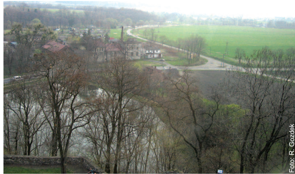
Okolice Toszka słyną ze starych podań i przypowieści, przekazywanych od wieków z pokolenia na pokolenie.