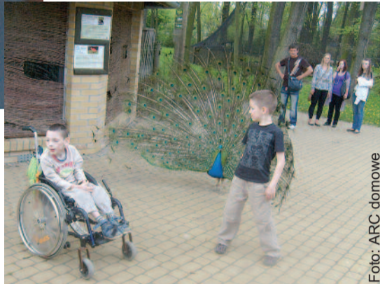
...i na wycieczce w ZOO.

Dalszą opowieść „słyszę” jakby z ust Kubusia. Jest to tekst przygotowany na stronę internetową: „Moi rodzice nie wiedzą prawie nic o moich pierwszych chwilach, gdyż zostałem przez nich adoptowany wraz z moją starszą o rok siostrzyczką. Jak podają dokumenty, urodziłem się po 30-tygodniowej ciąży jako wcześniaczek o wadze kocięcej 1450 gramów. Otrzymałem Apgar 6/7/8/8, a więc wcale nieźle! Zostałem przewieziony na OIOM, gdzie przebywałem z powodu niewydolności oddechowej i infekcji wewnątrzmacicznej. Dwukrotnie przetoczono mi koncentrat krwinek czerwonych. Po 7 tygodniach trafiłem do Domu Małego Dziecka w Gliwicach, gdzie przeszedłem zapalenie płuc i odwodnienie