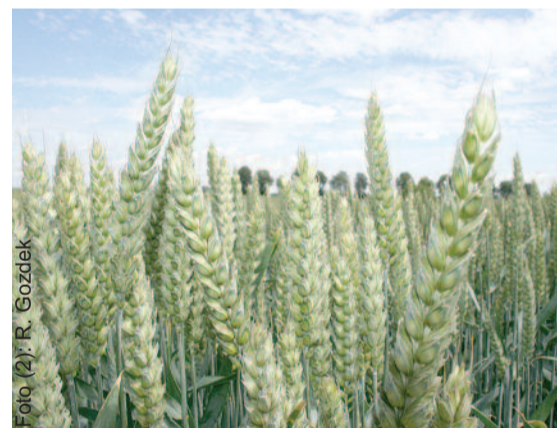
Zabieg wapnowania przywraca glebę do takiego stanu, by zapewniały dobre plony.

Od 2003 do 2007 r. WFOŚiGW udzielała dofinansowania do wapnowania gleb według starych zasad,