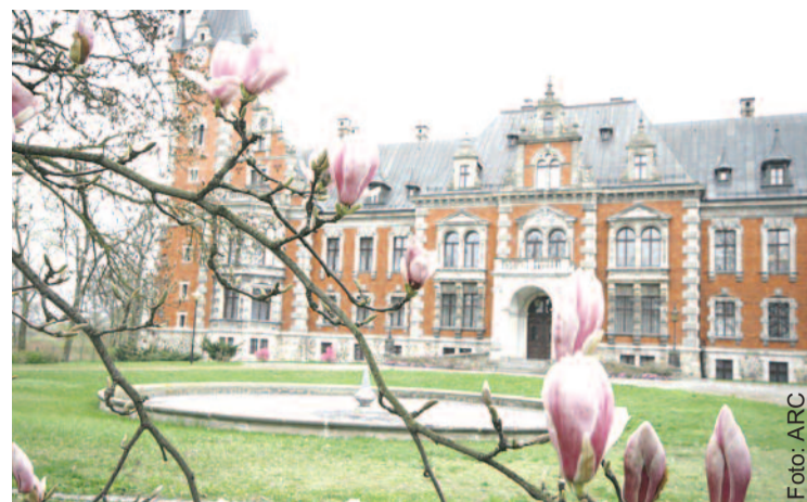
To miejsce zachwyca o każdej porze roku, nie tylko w okresie kwitnienia magnolii.