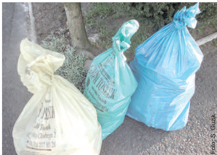
Podczas odbioru segregowanych odpadów właściciel nieruchomości otrzymuje taką samą ilość worków i takiego samego koloru, jakie wystawił do odbioru.