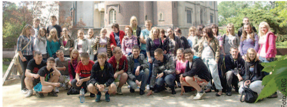
Uczniowie „Konopnickiej” podczas wycieczki do Poznania.

W ramach projektu organizowane są warsztaty wyjazdowe, m.in. do ogrodów botanicznych. W bieżącym semestrze uczniowie Zespołu Szkół im. M. Konopnickiej brali udział w Międzynarodowych Targach Ogrodnictwa i Architektury Krajobrazu „Gardenia” w Poznaniu oraz w XII Festiwalu Nauki, Techniki i Sztuki w Łodzi. Były to dwu-, trzydniowe wyjazdy, w czasie których uczniowie zwiedzili miasta, zapoznali się z najnowszymi trenda-