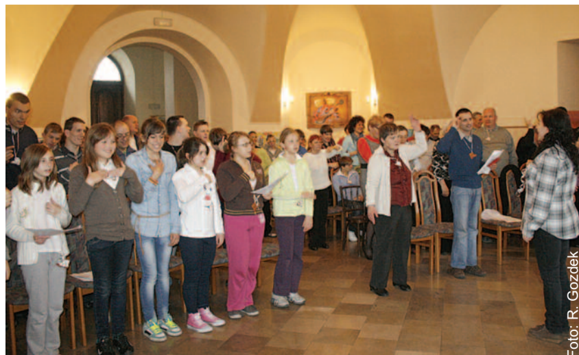
Spotkanie przebiegało w radosnej atmosferze, a mieszkańcy DPS-ów świetnie bawili się w towarzystwie uczniów.