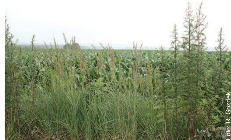
Nie wszystkie pola będą w tym roku dobrze plonowały.

Rolnicy i producenci rolni, w których gospodarstwach rolnych powstały szkody spowodowane wy-