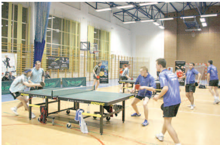
Zawodnicy z Ligoty Łąbedzkiej i Rudy Śląskiej zagraли mecz na wysokim poziomie.