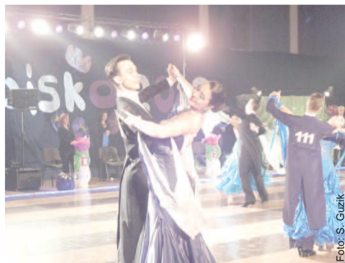
Tak prezentowali się tancerze podczas tegorocznego „Szokowiska”.