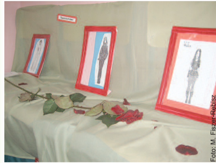
Część ekspozycji prac Agaty.