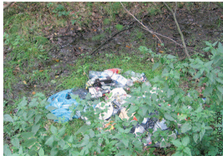
To tylko jedno z miejsc, gdzie ekologiczni wandalcy utworzyli dzięki wysypisko śmieci.

Oprócz zorganizowania akcji 14 września w terenie, w ramach „Sprzątania Powiatu Gliwickiego 2012” zostanie przeprowadzony konkurs na pracę plastyczną. Jest on skierowany do młodzieży szkół ponadgimnazjalnych, uczniów szkół specjalnych oraz mieszkańców domów pomocy społecznej. Uczestnik może zgłosić na konkurs jedną pracę plastyczną, dopuszcza się prace sporządzone przez pojedyncze osoby jak i grupy osób. Prace te powinny nawiązywać do hasła tegorocznej ogólnopolskiej akcji „Sprzątanie Świata – Polska”, które brzmi: „Ko-