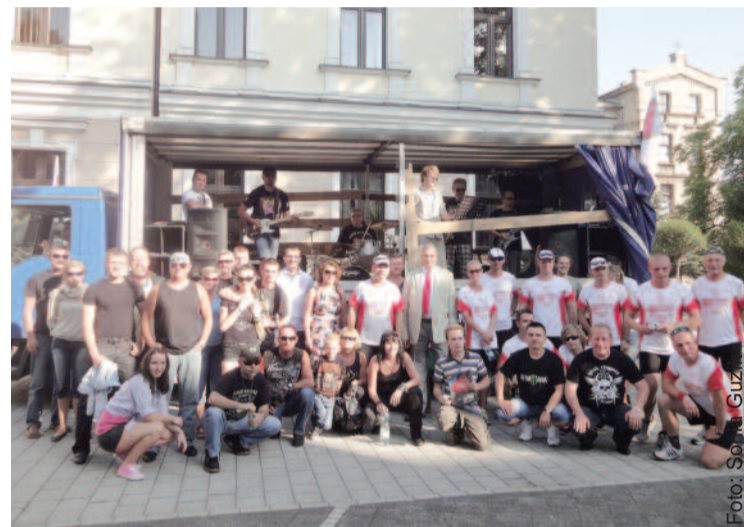
Pamiątkowe zdjęcie biegaczy i towarzyszącej im ekipy przed starostwem.