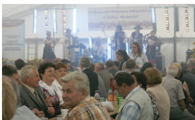
▲ ...grającą i śpiewającą na góralską nutę Kapelę Biesiada...