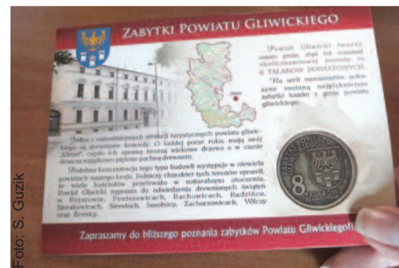
Monety oprawione są w pocztówkę z opisem powiatowych zabytków.

blyszczącej oraz oksydowanej (jest także wersja z czystego srebra) ciętą oko. Oprawione w błyszcząca pocztówkę w kolorach powiatowych kremowo-bordowych wraz z opisem zabytku mogą się stać przebojem kolekcjonerskim oraz oryginalnym materiałem promocyjnym.