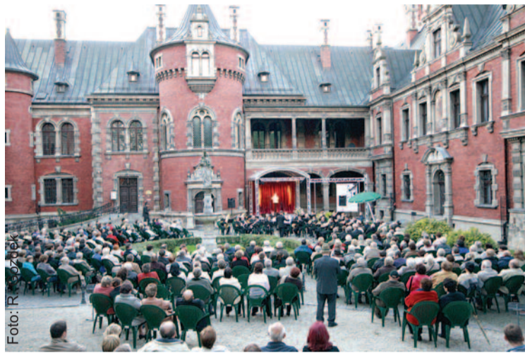
Koncerty na Dziedzińcu Maryjnym pałacu w Pławniowicach cieszą się niesłabnącym uznaniem publiczności.