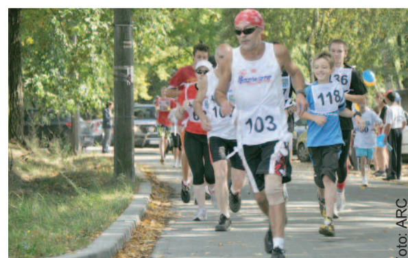
W ub. roku bieg zgromadził wielu miłośników tego sportu.