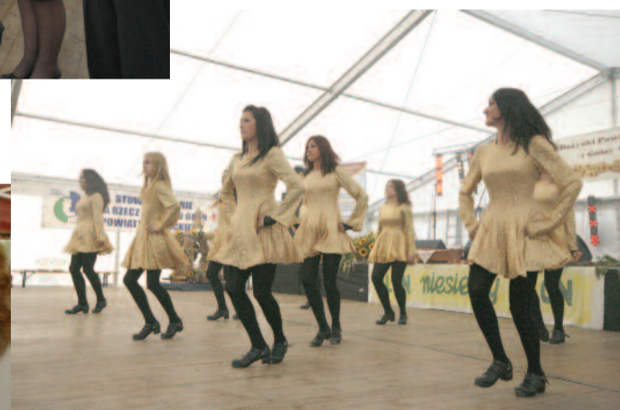
▲ Bawiliśmy się świetnie, podziwiając mistrzowski w tańcu irlandzkim zespół SALAKE...