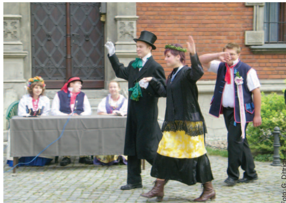
Podczas konferencji w Pławniowicach piękny pokaz zaprezentowała młodzież z Rudzińca występująca w tradycyjnych śląskich strojach.

łoświeć (zamiast zaświeć) to pozostałości gwarowych przedrostków: „ło” zamiast „za” i „po” zamiast „z”.