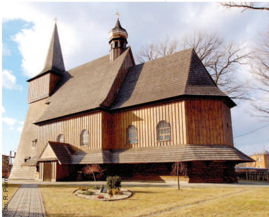
Drewniany kościółek w Wilczy do dziś służy wiernym.

Drewniane świątynie należą do głównych atrakcji historycznych i sakralnych powiatu gliwickiego. Podobna koncentracja tego typu budowli występuje w niewielu powiatach naszego kraju. Rolniczy charakter terenów po-