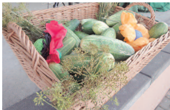
W tym roku to warzywo wyjątkowo obrodziło.

Sos: 4 łyżki octu jabłkowego, 1/2 łyżeczki miodu, 1/4 szklanki oliwy, 1 łyżeczka musztardy, pieprz i sól.