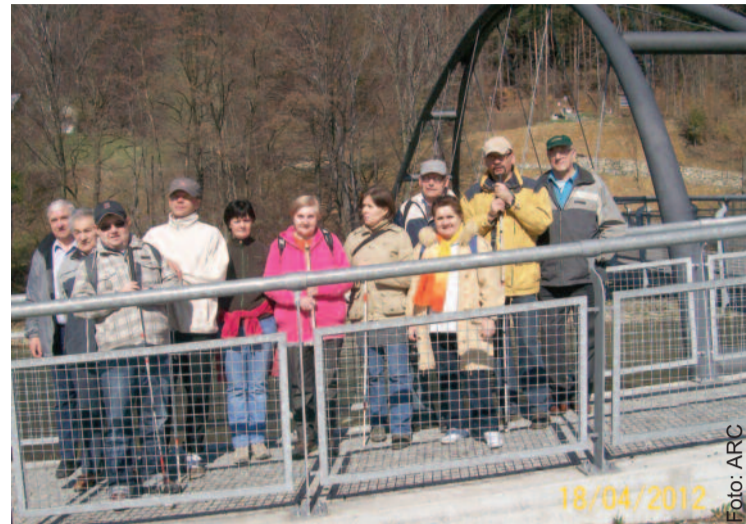
Na jedną z wycieczek TRION pojechał do Węgierskiej Góry.

Chociaż na co dzień przychodzi im pokonywać wiele trudności i zmagać się z niepełnosprawnością, są pełni energii, optymizmu i chęci do aktywnego życia. Członkowie TRION-u, bo o nich mowa, od blisko dwóch lat nie ustają w wysiłkach, by poprzez turystykę i rehabilitację integrować osoby niepełnosprawne.