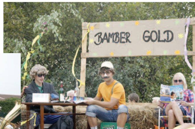
▲ W korowodzie nie zabrakło wesołych scenek, wystawianych m.in. na wozach, przyczepach i traktorach.