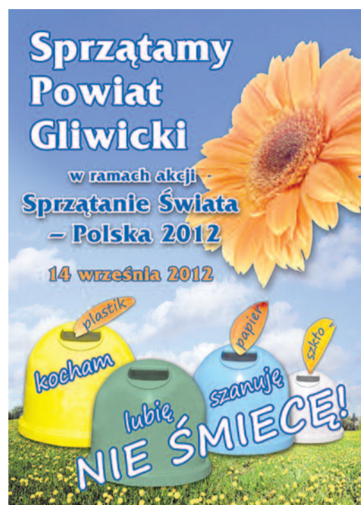
Plakat promujący tegoroczną akcję sprzątania powiatu.

Głównymi celami akcji są: edukacja ekologiczna społeczeństwa, poprawa stanu środowiska, poznanie i promocja gmin oraz podmiotów gospodarczych. Powiat, organizator akcji, zapewni środki konieczne do jej przeprowadzenia, tj. worki