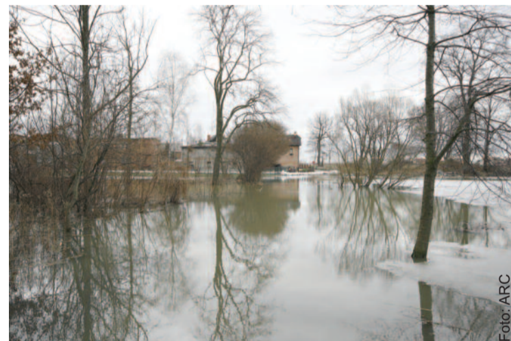
Na podtopionym polu rosnąć mogą tylko... straty.

Warunki i tryb przyznawania pomocy, w tym szczegółowe informacje o prawach i obowiązkach beneficjentów, określa rozporządzenie Ministra Rolnictwa i Rozwoju Wsi z 13 września 2010 r. w sprawie szczegółowych warunków i trybu przyznawania pomocy finansowej