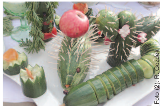
Ozdobne dekoracje stołu z ogórkiem w roli głównej.

Sposób przyrządzenia: Mięso ugotować, do wywaru włożyć obrane jarzyny pokrojone w kostkę lub starte na tarce o dużych oczkach i ziemniaki pokrojone w kostkę, trochę podgotować. Później dodać ogórki kiszone starte na tarce o grubych oczkach, wszystko razem gotować do miękkości warzyw. Na końcu zagęścić śmietaną z 3 łyżkami mąki, poprawić do smaku.