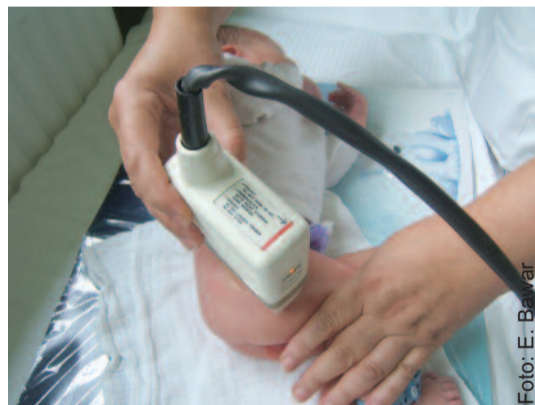
Noworodki urodzone w Szpitalu Powiatowym w Pyskowicach mają od razu badane stawy biodrowe.