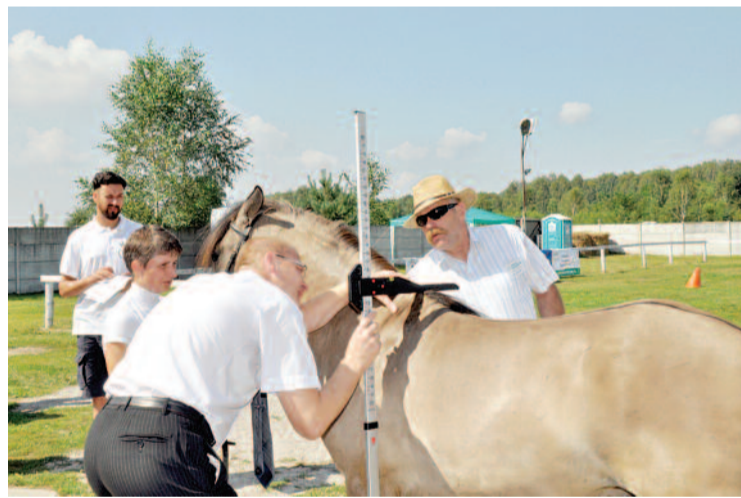
Koniki tej rasy spełniać muszą ściśle określone kryteria.