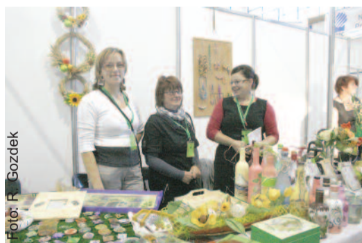
Na kermaszu można też kupić ciekawe wyroby rękodzieła ludowego.

29 września w godz. od 9.00 do 18.00 w Hali Ośrodka Sportu Politechniki Śląskiej w Gliwicach (ul. Kaszubska 28) odbędzie