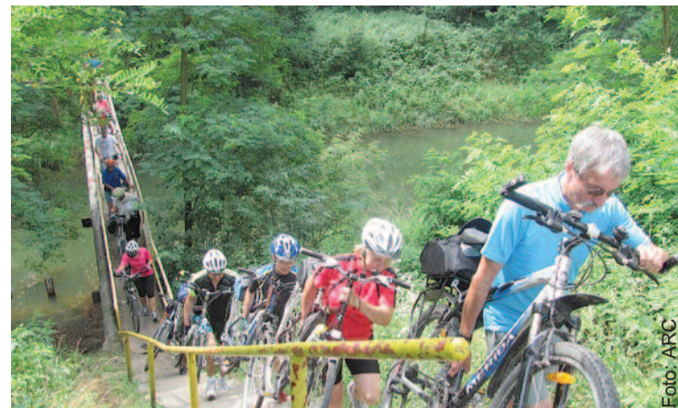
Wyprawy rowerowe były niezapomniane.

Uczestnicy tegorocznego „Lata” poznali miasto, zaliczając siedem tras o nazwach opisujących ich tematykę. Były to: Gliwicka secesja, Różne oblicza radiostacji, Ślady wojen, Szlakiem hoteli, Miasto-ogród, W starym kinie oraz Ewangelicy i ich gliwickie dzieło. Z kolei rowerowe trasy powiatowe miały następujące tematy przewodnie: Brzegiem Kanału Gliwickiego, For-