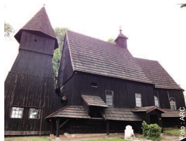
Gdzie mieści się ta drewniana stara świątynia i jaka jest jej nazwa?

Wnętrze świątyni prezentuje główne styl barokowy, choć znajdują się w nim także elementy późnogytyckie, tj. trójlistne łuki portali czy dębowa kropielnica z XVI w. Szczególnie cenny jest trójskrzydłowy ołtarz główny z ok. 1700 r. Zdobia go m.in. obrazy Zesłania Ducha Świętego, św. Piotra, św. Andrzeja i św. Marcina. W ołtarzach bocznych widnieją obrazy Chrystusa Bolejącego i św. Jó-