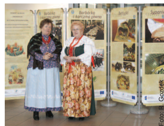
Wystawa miała wernisaż w Gliwicach, a obecnie wędruje po województwie śląskim.

Podczas realizacji projektu zostały również przygotowane: film prezentujący nasze obrzędy oraz dwa albumy – „O dioble złośliwym i utopku życzliwym, czyli legendy i wierzenia powiatu gliwickiego” i „Od wieńca adwentowego do dożynkowego, czyli tradycje, zwyczaje i obrzędy powiatu gliwickiego”. Pierwsze wydawnictwo prezentuje legendy, podania i wierzenia ludowe związane z terenem powiatu gliwickiego, a drugie zawiera