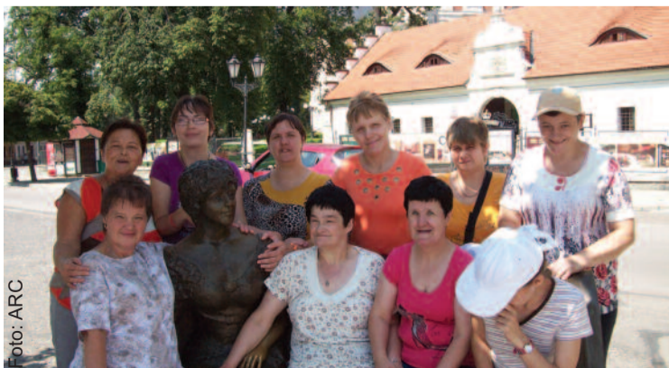
W Pszczynie mieszkanki „Ostoi” zwiedziły m.in. pałac i otaczający go park.