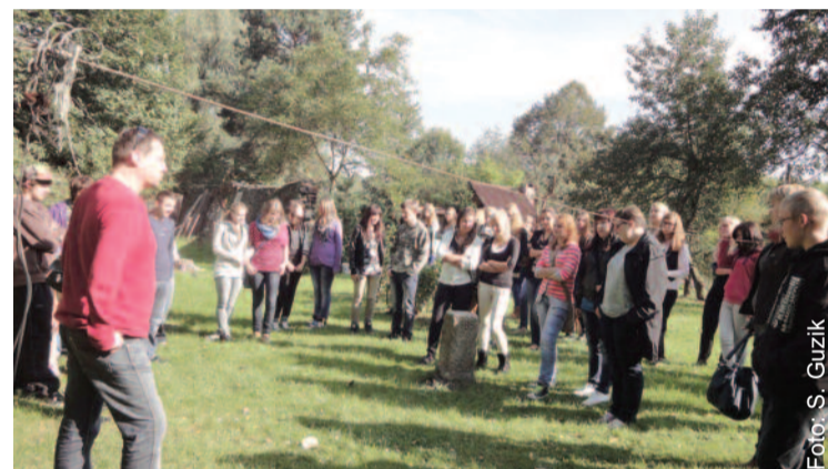
W Rudzie Śląskiej uczestnicy wycieczki mieli okazję zobaczyć stary kamień graniczny.

W ramach tego projektu w „Konopnickiej” prezentowana była również wystawa pt. „Na granicy.