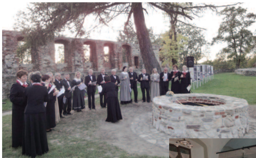
Występ chóru Tryl podczas uroczystego otwarcia studni.

Projekt „Remont i uroczyste otwarcie studni toszeckiego zamku” realizowany jest w ramach działania 413 „Wdrażanie lokalnych strategii rozwoju” PROW na lata 2007-2013 i współfinansowany ze środków Unii Europej-