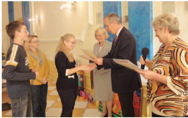
Podczas wręczania dyplomów laureatom konkursów.

wieści o przygodach Pana Samochodzika. Pisarz ciekawie opowiadał o swej twórczości, pasjach i zainteresowaniach. Odpowiadał także na pytania publiczności, której przybliżył postaci znanych detektywów w literaturze i filmie oraz ich twórców.