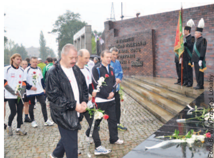
Zanim uczestnicy pielgrzymki wyruszyli na trasę biegu, złożyli kwiaty pod Pomnikiem Poległych Górników.