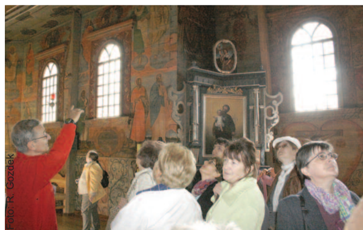
Kościół św. Michała Archaniola w Żernicy – przewodnik pokazuje cenne polichromie o barokowej stylistyce.