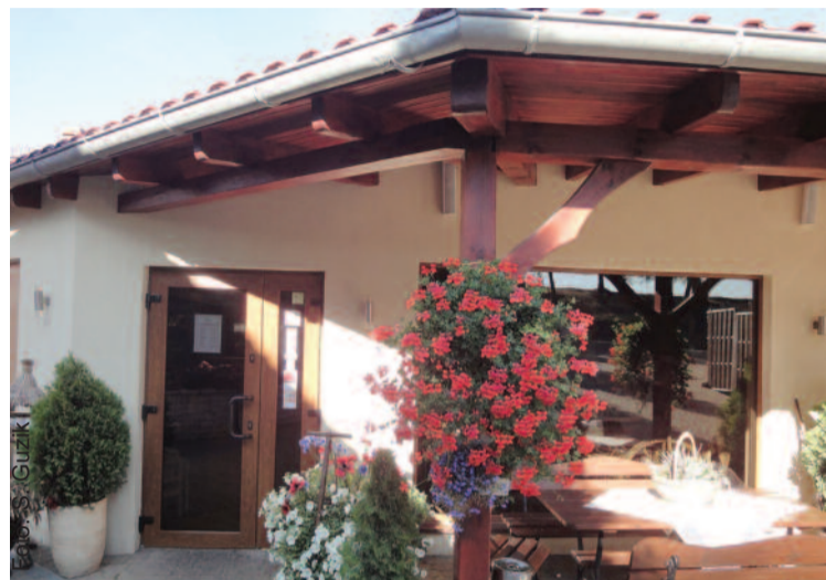
Zachęcająca do wejścia elewacja sklepu...

Podkreśla, iż siłą napędową firmy stanowi załoga, na którą składają się wszyscy pracownicy – począwszy od fachowców produkcyjnych posiadających wieloletnie doświadczenie, a skończywszy na miłej i doświadczonej obsłudze w sklepach. To oni, jako całość stanowią zespół, którym on z sercem kieruje. (RG)