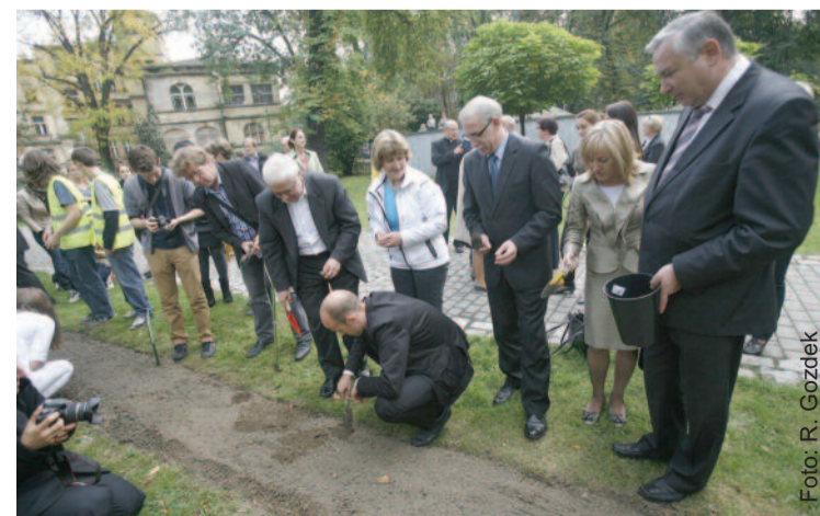
Żonkile sadzili samorządowcy, dziennikarze, społecznicy, przedstawiciele wielu instytucji, młodzież. Na zdjęciu dobry przykład daje poseł Borys Budka.