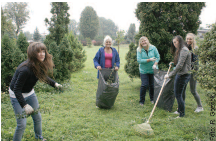
Młodzież z Zespołu Szkół im. I. J. Paderewskiego sprzątała... z uśmiechem na twarzy!

W akcji tradycyjnie udział wzięli Zespół Szkół im. I. J. Paderewskiego w Knurowie, Zespół Szkół Zawodowych nr 2 w Knurowie, Zespół Szkół Specjalnych w Knurowie, Zespół Szkół im. M. Konopnickiej w Pyskowicach, Zespół Szkół Specjalnych w Pyskowicach, Dom Pomocy Społecznej „Ostoja” w Sośnicowicach i Dom Pomocy Społecznej „Zameczek” w Kuźni Nieborowskiej. Uczestnicy akcji sprzątały wyznaczone miejsca na terenie miejscowości, gdzie mieszczą się te placówki. Powiat Gliwicki zapewnił zakupienie dla uczestników akcji rękawic i worków, a także za-