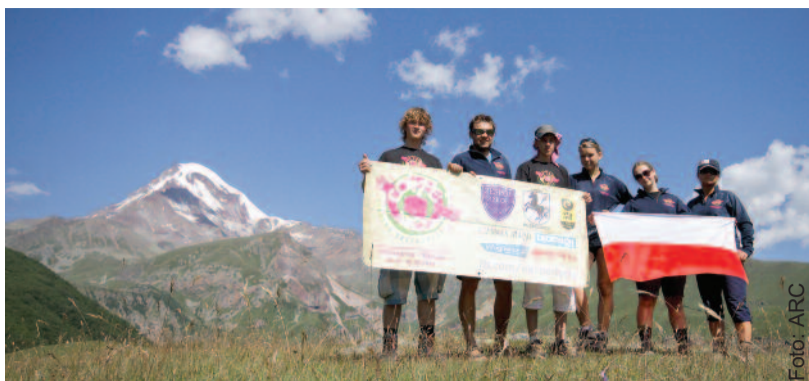
Uczestnicy Szkolnej Ekspedycji pod szczytem Kazbek w Górach Kaukaz.

Zaprezentowali na nim zdjęcia i filmy, powstałe w czasie podróży. W Norwegii wylądowali na lotnisku 100 km od Oslo. Ich celem było dotarcie nad morze, gdzie spędzili – jedną, ale za to białą – noc w namiotach. Dużą część trasy pokonali pieszo, dźwigając 10-kilowe plecaki. Mimo to nikt nie narzekał na trudy podróży. Wakacyjna wyprawa