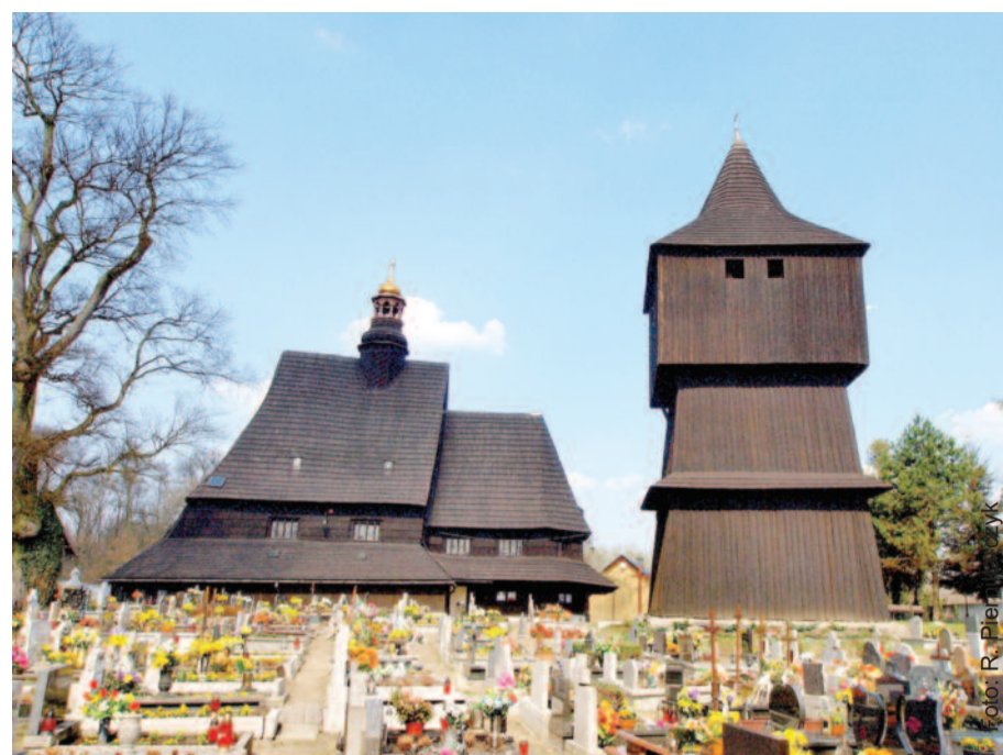
Gdzie mieści się ta drewniana świątynia i jaka jest jej nazwa?

Ten jednonawowy, orientowany obiekt ma konstrukcję zrębową. Jest posadowiony na podmurówce z kamienia. Nawa, na rzucie kwadratu, jest wyższa od trójkątnie zamkniętego prezbiterium. Te pierwszą otaczają zamknięte soboty, które tworzą wewnętrzne obejście kościoła, a prezbiterium obiegają przydaszki. Od płu. przylegają do niego trójboczne zamknięta kaplica św. Józefa (obecnie MB Fatimskiej) oraz prostokątna zakrystia. Dachy świątyni kryje gont. Obok kościoła, od strony pld.-wsch. stoi drewniana dzwonnica o konstrukcji słupowej