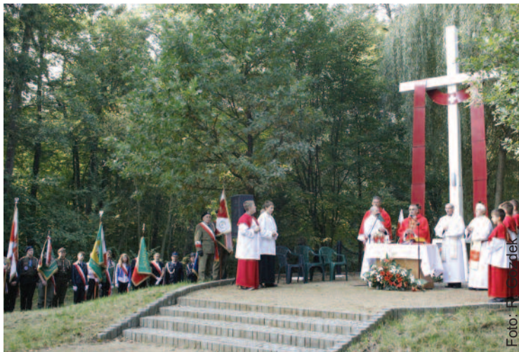
O zbrodni przypomina krzyż stojący na leśnej polanie.