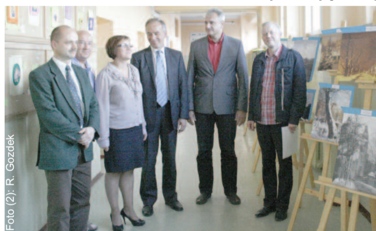
... i po obejrzeniu prac uczestników konkursu plastycznego i fotograficznego, wystawionych w siedzibie MOPP.

podlega Miastu Knurów, natomiast Powiat Gliwicki co roku przekazuje na jego działalność kwotę określoną uchwałą. Przedmiotem działania MOPP jest kształtowanie i rozwijanie zainteresowań oraz uzdolnień młodzieży, zdobywanie umiejętności w zakresie turystyki, sztuki, teatru a także sportu. Wychowankowie uczęszczają na zajęcia pozaszkolne w ramach kół zainteresowań, które prowadzą wysoko wykwalifikowani nauczyciele. Ponadto organizuje się dla uczniów szereg wycieczek krajoznawczo-turystycznych, konkursów,