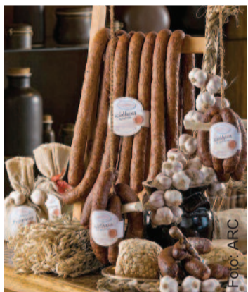
...a w środku apetyczne wyroby o tradycyjnych recepturach i smakowite zapachy.

Wyjaśnia, iż produkty z Pniowa zawierają tylko niezbędne ilości dodatków, służących do konserwacji