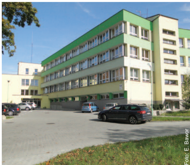
Szpital Powiatowy w Pyskowicach nie będzie już SP ZOZ-em, ale pacjenci nie muszą obawiać się przekształcenia go w spółkę.

Przewodniczący Zarządu Powiatu Gliwickiego MICHAŁ NIESZPOREK