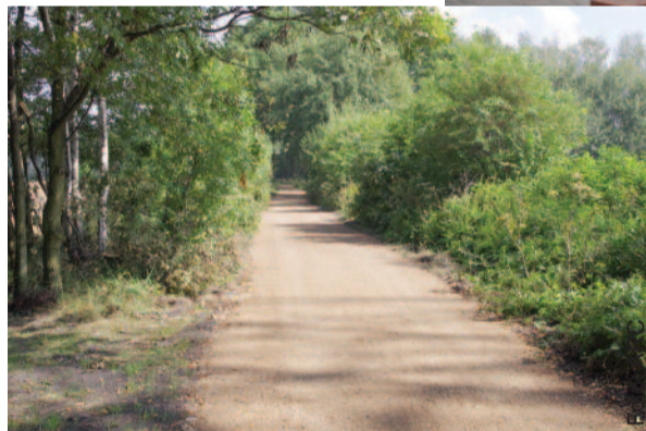
Trasy w dużej części wiodą przez tereny zielone naszego powiatu.

- Ostrope (trasa nr 15) ze Smolnicą w Gminie Sośnicowice i Pilchowicami (trasy nr 6 i 379).