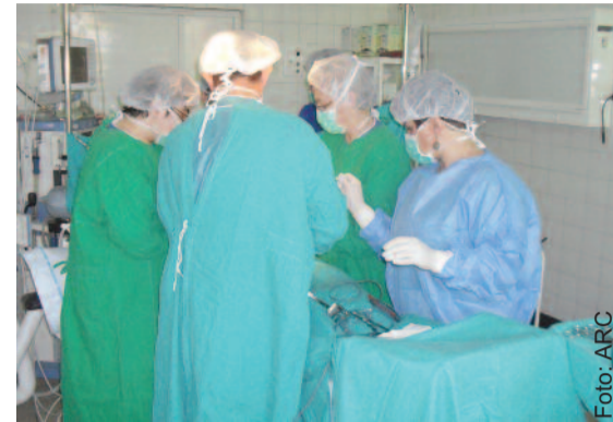
Na przepuklinę nie ma innej skutecznej metody niż operacja.

kiego rodzaju przepuklin brzusznych. Chirurdzy pracujący w szpitalu potrafią wykonać kilka różnych rodzajów operacji, stosowanych w leczeniu przepuklin brzusznych. Niektóre z tych metod polegają na wszyciu pacjentowi specjalnej siatki, wzmacniającej powłoki