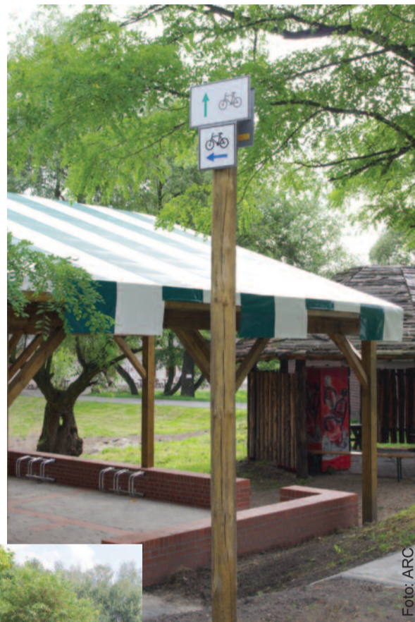
Na rowerzystów czeka m.in. wiaty na Zamku w Chudowie.