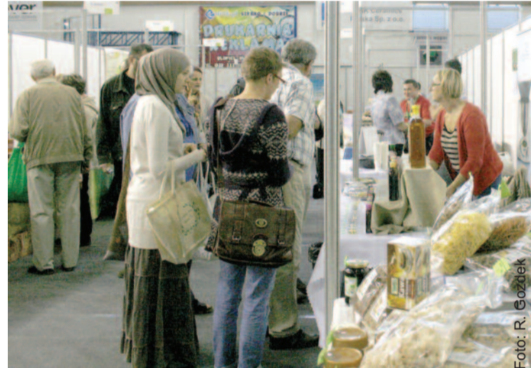
Od samego rana hala była pełna zwiedzających.