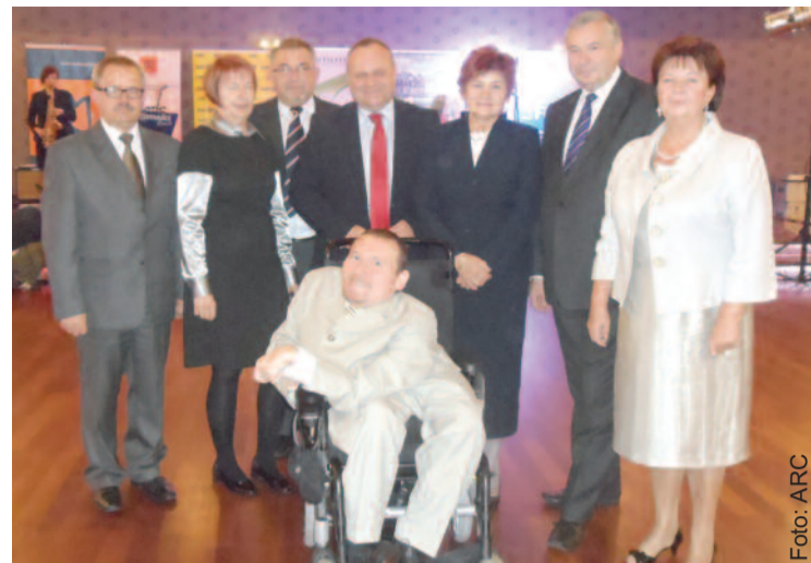
Przedstawiciele nagrodzonych samorządów w towarzystwie posła Marka Plury.

Samorząd Powiatu Gliwickiego został laureatem ogólnopolskiego konkursu Samorząd Równych Szans 2012 na najlepsze działania na rzecz osób niepełnosprawnych.