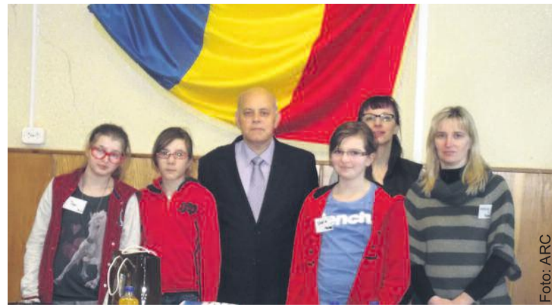
Pamiątkowe zdjęcie polskiej delegacji w rumuńskiej szkole.

proceedziliśmy dla klasy czwartej lekcję techniki, na której wspólnie z rumuńskimi uczniami robiliśmy papierowe śnieżki. W trakcie wizyty zwiedziliśmy sąsiadujący z Saczele Brasov i parlament w Bukareszcie, który zachwyił nas swą wielkością i przepychem. Nasze uczennice poznały nowych przyjaciół, z którymi wspaniale spędzały czas podczas licznych wycieczek po okolicy i zabaw na śniegu. Na wieczorku pożegnalnym mieliśmy okazję degustować tradycyjne potrawy narodowe, jak też zobaczyć i spróbować zatańczyć tańce rumuńskie. Czas pobytu szybko minął i ze smutkiem