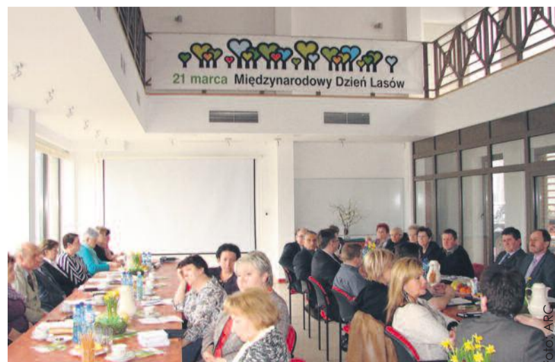
Marcowa sesja Rady Gminy Rudziniec odbyła się w siedzibie tamtejszego nadleśnictwa.