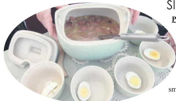
Żur najlepiej smakuje z jajkiem gotowanym na twardo.

Wszystko razem wymieszać, doprawić solą i pieprzem, skropić lekko octem i ponownie wymieszać.