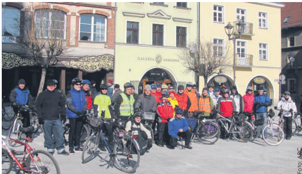
Rowerzyści spotkali się na Rynku w Gliwicach, by wyruszyć do Tworogu Małego.

Na otwarcie sezonu kolarze zorganizowali rajd rowerowy „Topienie Marzanny”. Impreza odbyła się 17 marca. Rowerzyści wyruszyli zorganizowaną grupą z gliwickiego Rynku i dotarli do Tworogu Małego,