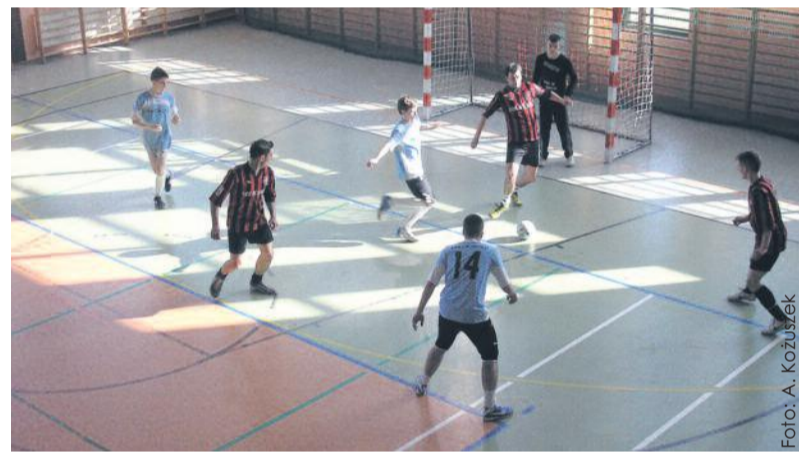
Jedna z dynamicznych akcji pod bramką.

24 marca w Sośnicowicach rozegrane zostały Pierwsze Mistrzostwa Powiatu Gliwickiego w Piłce Nożnej Halowej. Ich organizatorami byli Powiat Gliwicki i Gmina Sośnicowice.