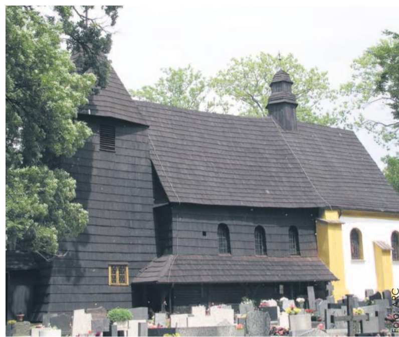
Gdzie znajduje się ta świątynia i jaką nosi nazwę?

Barokowy ołtarz główny świątyni pochodzi sprzed 1679 r. Jego bogatą dekorację stanowią m.in. obraz Trójcy Świętej, św. Katarzyny (XVII w.) oraz rzeźby św. Barbary, św. Katarzyny Aleksandryjskiej, aniołów i św. Jerzego. Z tyłu ołtarza umieszczona jest deska z napisem: „Wygorzał tyn Kościół r. 1705”. Z kolei ołtarze boczne, o dekoracji akantowej, datowane są na ok. 1705 r. W ołtarzu lewym wystawiony jest obraz św. Antoniego z Dzieciątkiem, a w ołtarzu prawym – obraz Piety (pocz. XVIII w.). Znajdują się tu tak-