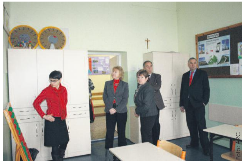
W Zespole Szkół Specjalnych w Pyskowicach.

13 marca Zarząd Powiatu Gliwickiego odwiedził placówki oświatowe w Pyskowicach. Miesiąc wcześniej także odwiedziły one w Knurowie.