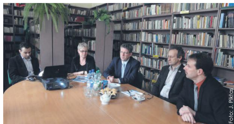
Od prawej – niemieccy goście podczas rozmów w Zespole Szkół Zawodowych nr 2 w Knurowie.

Na zakończenie pobytu w Polsce nasi partnerzy z zachodniej granicy zwiedzili Zamek w Toszku. (SoG)