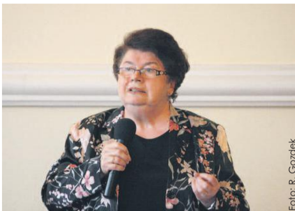
Specjalnym gościem sesji była Maria Pańczyk-Pozdziej, twórczyni konkursu „Po naszymu, czyli po śląsku”.

Wicemarszałek Senatu RP Maria Pańczyk-Pozdziej, znana dziennikarka i propagatorka gwary śląskiej była gościem sesji z racji uchwały, którą Rada Powiatu Gliwickiego podjęła kilka miesięcy temu. Uchwała ta wyraża poparcie dla projektu ustawy o mniejszościach narodowych i etnicznych, zgłoszonego przez posła Marka Plurę. Dotyczy on m.in. uznania gwary śląskiej za język regionalny. Projekt ten został odrzucony przez Rząd RP. Maria Pańczyk-Pozdziej szeroko wyjaśniła kwestie związane z tym zagadnieniem, kładąc nacisk na to, iż jej zdaniem – zgodnym również z opinią Rady Języka Polskiego – nie ma uzasadnienia do uznania gwary śląskiej za język regionalny.