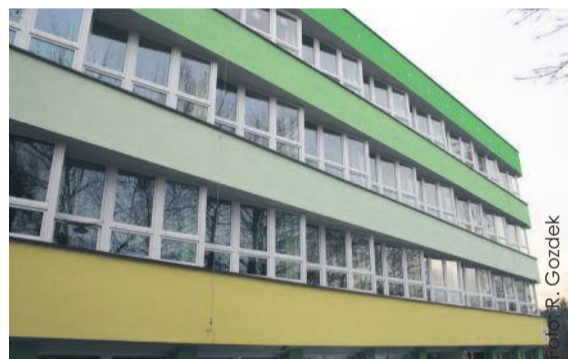
Pacjenci nie muszą się obawiać zmian – szpital w Pyskowicach nadal będzie ich przyjmować w ramach kontraktu z NFZ.

To przekształcenie ma doprowadzić do efektywniejszego zarządzania szpitalem, otwarcia przed nim nowych możliwości uzyskania przychodów i racjonalizowania gospodarowania. Warto tu przywołać przykład