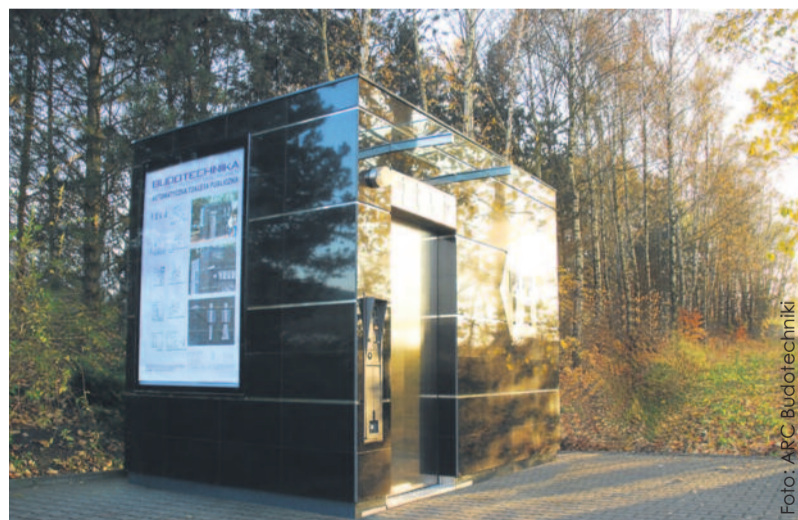
...który zyskał uznanie za doskonały projekt, walory designerskie i użytkowe.

diostacji jest samoobsługowa, bezdotykowa, obudowana czarnymi granitowymi płytami, z kolorowym oświetleniem. W środku ma automatyczny podajnik mydła, ciepłą wodę i suszarkę.