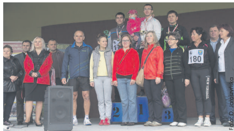
Grono zwycięzców i organizatorów biegu.