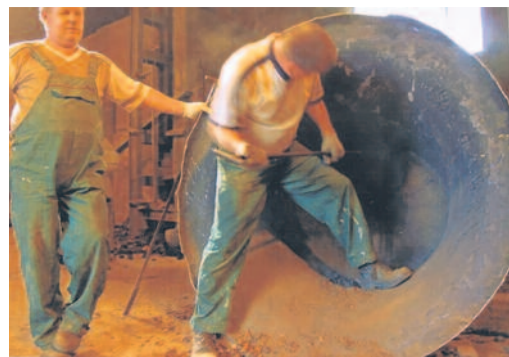
Ludwisarstwo to ciężka praca.

ja 2013 roku można ją było zobaczyć w programie telewizyjnym „Między ziemią, a niebem”. Kiedy Karol Wojtyła został wybrany na papieża, drużyna z ludwisarni razem z moim tatą wykonała piękny dzwon z wizerunkiem Jana Pawła II. Parę dni później w gazecie ukazał się reportaż na ten temat. Tę gazetę mamy w domu