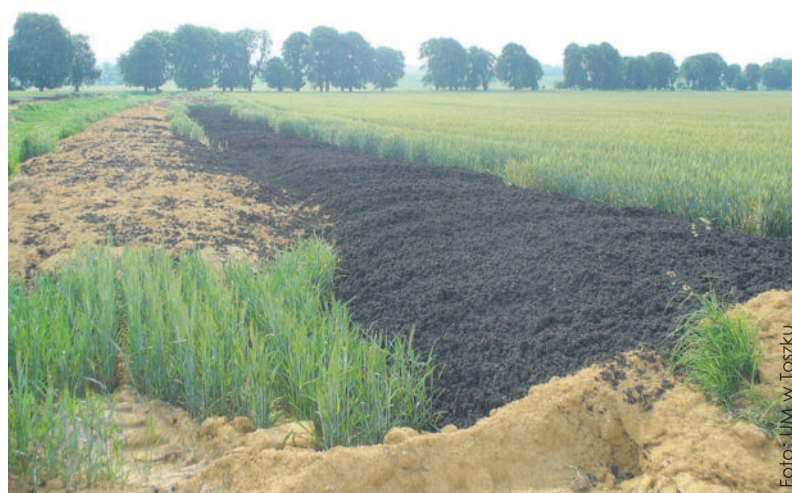
Pojawiające się na polach osady z oczyszczalni ścieków budzą lęk mieszkańców. (RG)

Ten temat powraca jak bumerang. Osady powstają w oczyszczalniach ścieków i wywożone są na pola położone na terenie naszego powiatu. Często skarżą się na nie mieszkańcy, potrafią być bowiem bardzo uciążliwe ze względu na wydzielany smród. Ludzie obawiają się, że szkodzą środowisku naturalnemu, uprawom rolniczym i naszemu zdrowiu. Nieraz otrzymywałem