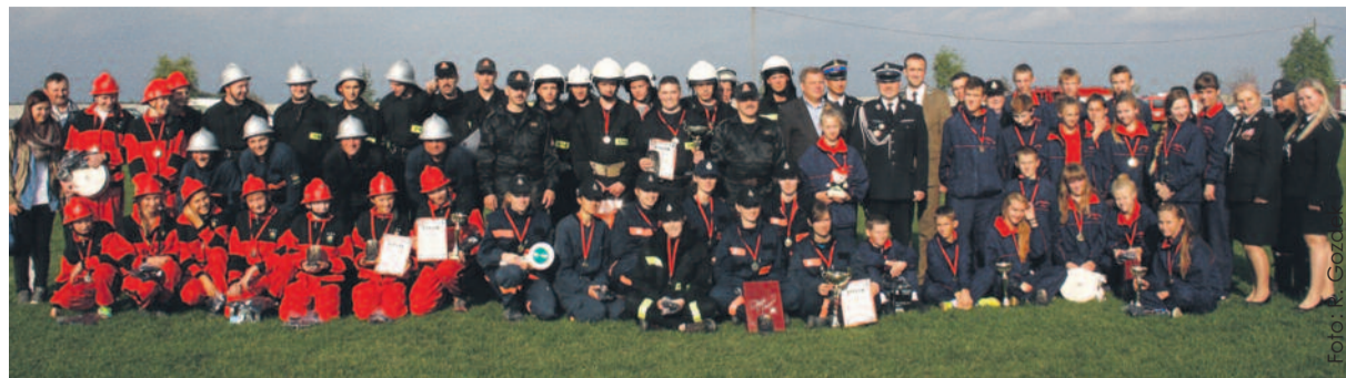
Zwycięskie drużyny wraz z organizatorami zawodów.

Aż w trzech – na wszystkie cztery grupy – najlepsze okazały się drużyny ze Świbia. Reprezentanci i reprezentantki tej miejscowości święcili triumfy na Powiatowych Zawodach Sportowo-Pożarniczych Ochotniczych Straży Pożarnych Powiatu Gliwickiego.