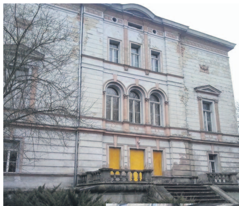
Może znajdzie się inwestor, który ocali ten niszczący obiekt?