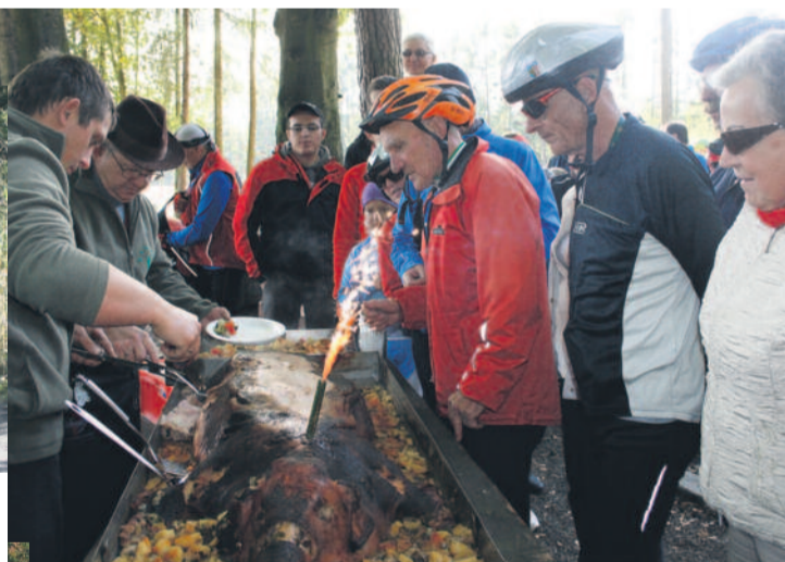
▲ Rowerzyści mogli się posilić, kosztując pysznej pieczonej świnki z Rancza w Proboszczowicach.