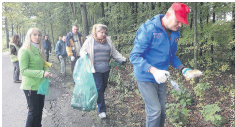
Tak wyglądało wielkie sprzątanie przy drodze w Kuźni Nieborowskiej.

Powiat Gliwicki, jako organizator akcji, zaopatrzył jej uczestników w worki na odpady, rękawice i zadbał o odbiór zebranych odpadów oraz ich zdeponowanie na składowisku. (SoG)