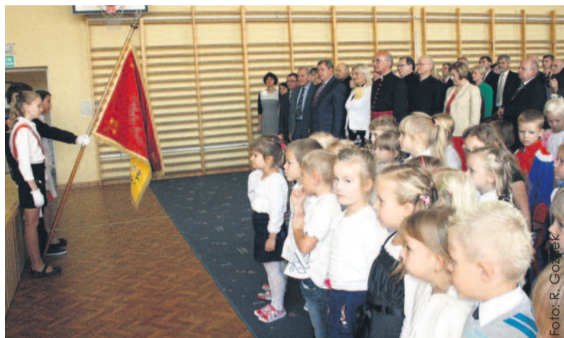
Ślubowanie na sztandar sprzed lat.