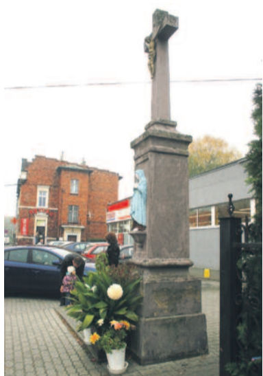
Krzyż przy pyskowskim Tesco czeka na przywrócenie dawnej świetności.

– Już dużo wcześniej, zanim zostałem członkiem stowarzyszenia Nepomuk, zajmowałem się restaurowaniem zabytków. Wszystko zaczęło się jakieś piętnaście lat temu, kiedy postanowiłem wyremontować kapliczkę przy ulicy Zamkowej w Łąbędach. Była już bardzo zniszczona i zaniedbana. Zacząłem się bawić w budowlańca. Okazało się jednak, że nie jest to takie proste – musiałem dużo się nauczyć. Zasięgałem rady