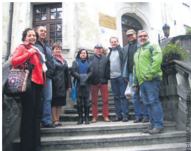
Czesi wraz z goszczącymi ich przedstawicielami naszego powiatu przed DPS-em „Ostoja”.

W ramach projektu odbyła się już pierwsza wizyta czeskich partnerów w naszym powiecie. 2 października w plenerze plastycznym w Bargłowie zorganizowanym przez partnera pro-