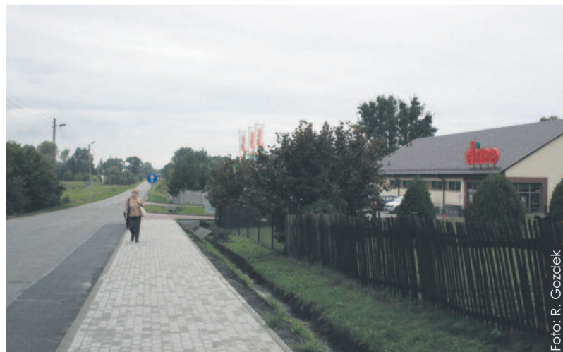
Teraz w drodze do pawilonu jest wygodniej i bezpieczniej.