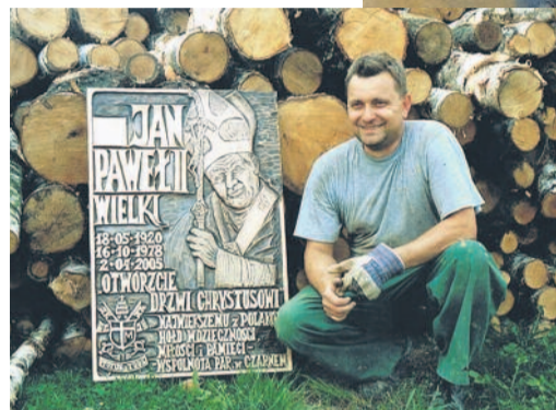
Mój tata przy tablicy pamiątkowej, poświęconej Janowi Pawłowi II.

po dziś dzień, bo jest naszą cenną pamiątką rodzinną. Kilka miesięcy temu w ludwisarni wykonano dzwon, który nazywano „Serce Łodzi”.