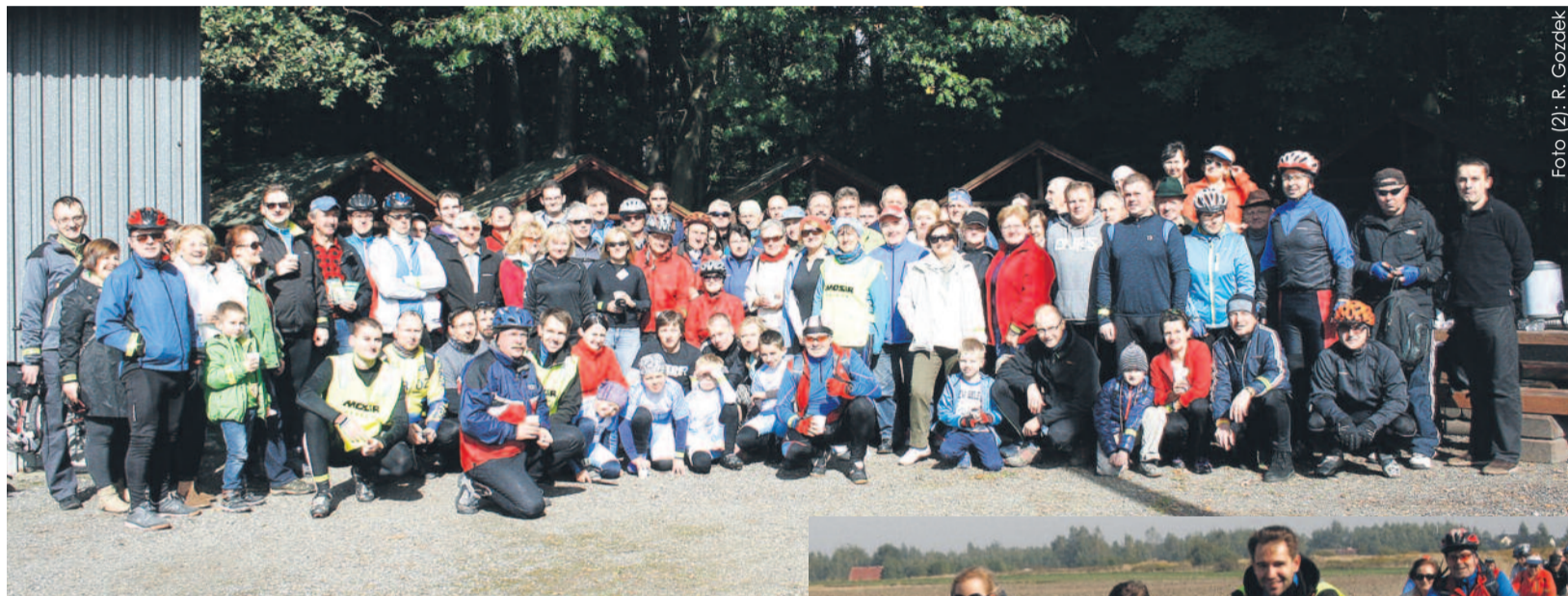
Pamiątkowa fotografia uczestników rajdu, którzy umawiali się już na następną edycję tej imprezy za rok.

Okazja była podwójna – nadchodząca rocznica 15-lecia Powiatu Gliwickiego i rok od oddania do użytku oznakowanych tras rowerowych na naszym terenie. Wszystko to uczciliśmy na sportowo.