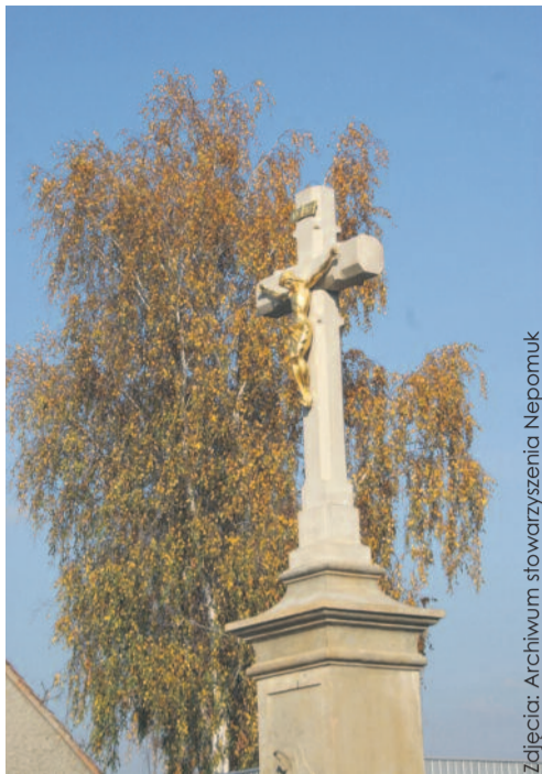
Odrastaurowany krzyż przy wjeździe do Pyskowic.

trzymuje modlitewna refleksja. Jednak czas i zawierucha ideologiczna mocno nadszarpnęły postument. Wymontowano tablicę z inskrypcją – bo pewnie była w języku niemieckim. Całość postumentu powoli „zapadała się” w stopniowo podnoszącym się poziomie ulicy i chodnika. Ilu dzisiejszych przechodniów się przy tym krzyżu zatrzymuje? Myślę, że niewielu, widząc jego coraz to bardziej opłakany stan, „ratowany” od czasu do czasu siermiężnym malowaniem olejną farbą. Jest jakiś taki dziwny zwyczaj na Śląsku malowania „na olejno” w różnych kolorach zabytkowych krzyży i figur świętych. Bardzo trudno później doprowadzić taki zabytek do wyglądu pierwotnego – dodaje nasz rozmówca.