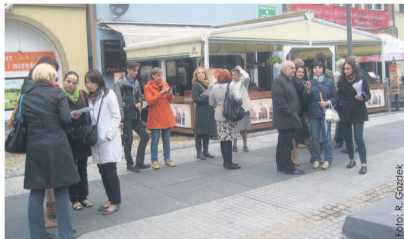
Uczestnicy konferencji podsumowującej projekt na gliwickim Rynku.

Na stronie stworzonej w ramach projektu znalazło się ponad 1400 zażytków i obiektów kultury z terenu województwa śląskiego, ponad 1500 obiektów noclegowych i gastronomicznych, e-przewodniki dla turystów kulturowych, możliwość skorzystania z e-usługi (rezerwacji, raportów, zamówień, akredytacji), a dodatkowo przyjazny i przydatny w podróży planer wycieczek. Dzięki jej integracji ze stro-