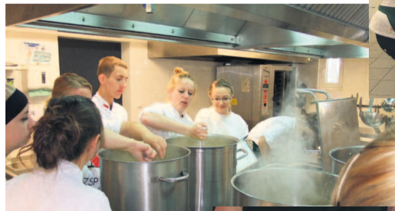
Uczniowie przygotowali kilkaset porcji zupy, którą częstowali na dożynkach w Pyskowicach.

gimnazjalnych zarówno wędzonych szprotok, opiekanych śledzi, jak i bardzo smacznej kłanińskiej zupy rybnej. Zupki było – bagatela! – 750 porcji... Uczniowie gotowali ją w niedzielny rano w „Energetyku” nad Dzierż-