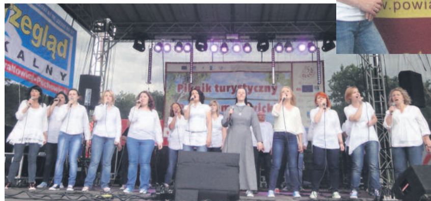
Na scenie zaprezentowała się także Chór Gospel z Pyskowic „Przebudzenie”.