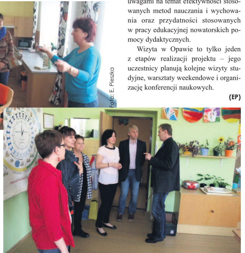
... oraz zwiedzali szkołę specjalną w Opawie.

Cennym doświadczeniem była również wizyta u drugiego czeskiego partnera projektu – w opawskiej szkole specjalnej. Dyskutowano m.in. na te-