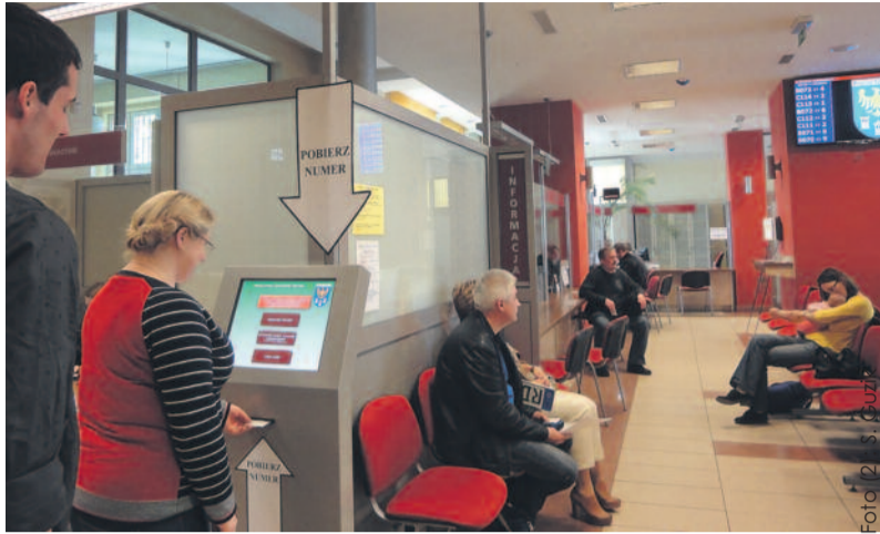
W Wydziale Komunikacji i Transportu działa elektroniczny system kolejkowy...

Udogodnienia czekają także na klientów, którzy do starostwa przyjeżdżają na rowerach. Od nie-