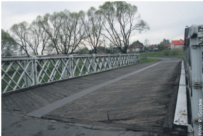
Most w Leboszowicach od dawna czekał na remont, podobnie jak most w Pławniowicach. Niebawem prace się rozpoczną, ale może się to wiązać z utrudnieniami dla kierowców.