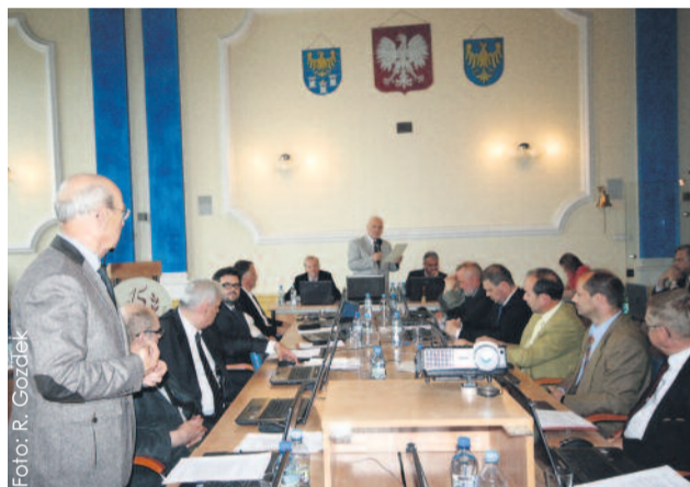
Podczas majowej sesji Rady Powiatu Gliwickiego.

Następnie sprawozdanie za lata 2012-2014 z prac Doraźnej Komisji Statutowej Rady Powiatu Gliwickiego przedstawiła jej przewodnicząca,