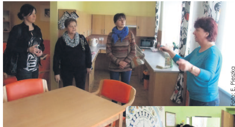
Goście z Polski z zainteresowaniem poznawali zasady funkcjonowania mieszkań chronionych...

dziennego, a także kilka przytulnych sypialni z łózkami, nad którymi wiszą zdjęcia danego mieszkańca i jego najbliższych. Gości z Polski zainteresowało również wykorzystanie w pracy z podopiecznymi tabletek, które nie