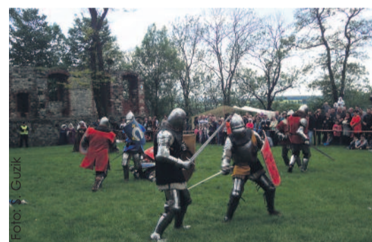
Rycerski szturm na Zamek wzbudził duże zainteresowanie publiczności.

Na zamkowym wzgórzu można było podziwiać pokazy walk rycerskich – konnych i pieszych, wysłuchać koncertu zespołu Percival, zobaczyć na specjalnej ekspozycji, jak wyglądało uzbrojenie husyckie i dowiedzieć się od członków Stowarzyszenia Artylerii Dawnej „Arsenał” ciekawych historii o husytach, m.in. o ich wyprawie w XV w. na Śląsk. Oddziały te dotarły aż do Toszka. Tematykę husycką widzom przybliżył również spektakl Teatru Gry i Ludzie – „Husycka zawierucha”, zaprezentowany w dwóch aktach. W II części przedstawienia wzięli udział członkowie „Arsenału” oraz Stowarzyszenia Chorągiew Ziemi Górnośląskiej, którzy efektownie zainscenizowali szturm na wozy husyckie. Na zakończenie imprezy odbył się koncert zespołu Brathanki.