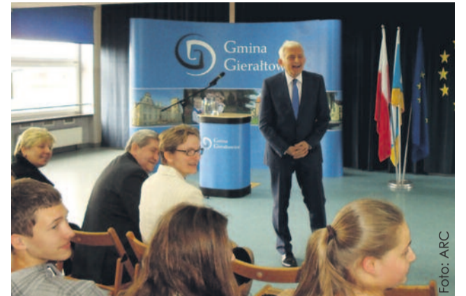
Eurodeputowany z uznaniem wyrażał się o proeuropejskich działaniach, podejmowanych w szkole.

Dzięki spotkaniu młodzież z gimnazjum zrozumiała, że to w ich rękach leży poniekąd klucz do naszego ekono-