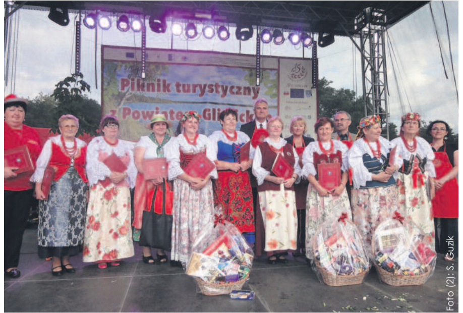
Przedstawicielki zwyciężskich kół gospodyń wiejskich tuż po odbiorze nagród.