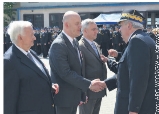
Przedstawiciele WFOŚiGW w Katowicach odebrali wysokie strażackie odznaczenia.

Medal „Za zasługi dla pożarnictwa” został ustanowiony przez Główny Związek Straży Pożarnych RP w 1926 r. i nadawany do 1939 r. Odnaczenie reaktywowano w 1959 r. Nadawane jest funkcjonariuszom straży pożarnej oraz osobom i instytucjom wspomagającym Ochotnicze Straże Pożarne i oddziały Związku w wykonywaniu zadań ratowniczych oraz realizacji celów Związku.