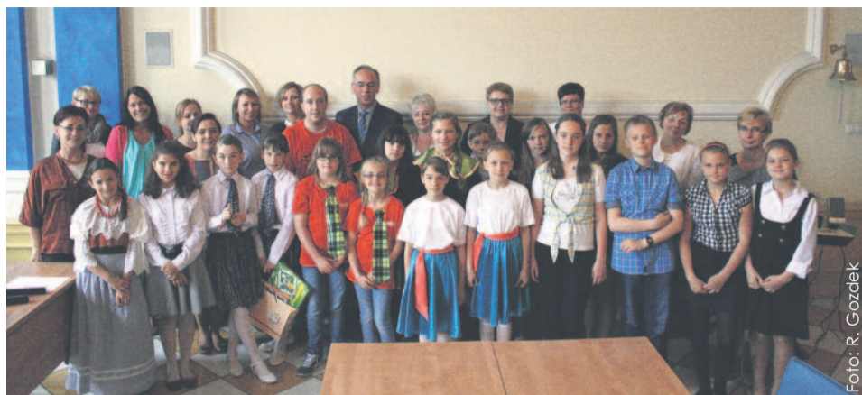
Uczestnicy konkursu i jego organizatorzy po zakończeniu artystycznych zmagani w sali sesyjnej starostwa.