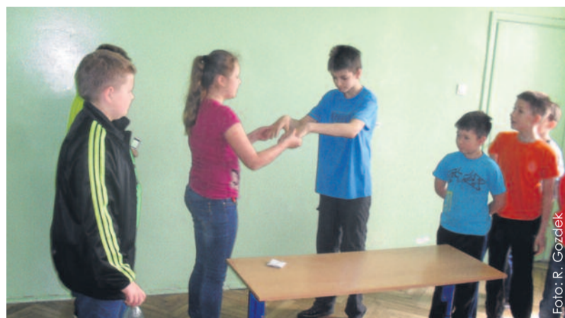
Uczniowie poniszowickiej szkoły sami planują i przeprowadzają podczas przerw eksperymenty.