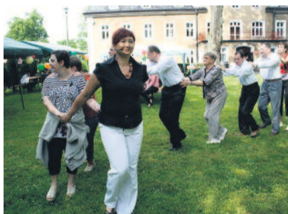
W parku wokół „Zameczku” było podczas Pikniku bardzo wesoło.