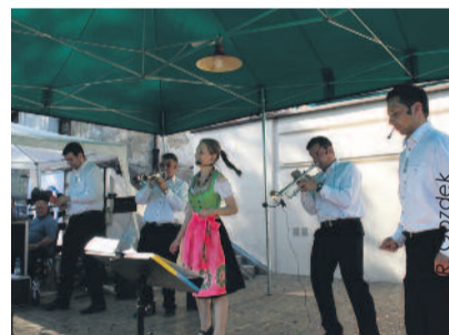
„Kafliki” na festynie grały, śpiewały i opowiadały przezabawne wice.

Pod hasłem „20 lat minęło” przebiegał tegoroczny festyn integracyjny w Domu Pomocy Społecznej „Ostoja” w Sońnicowicach.