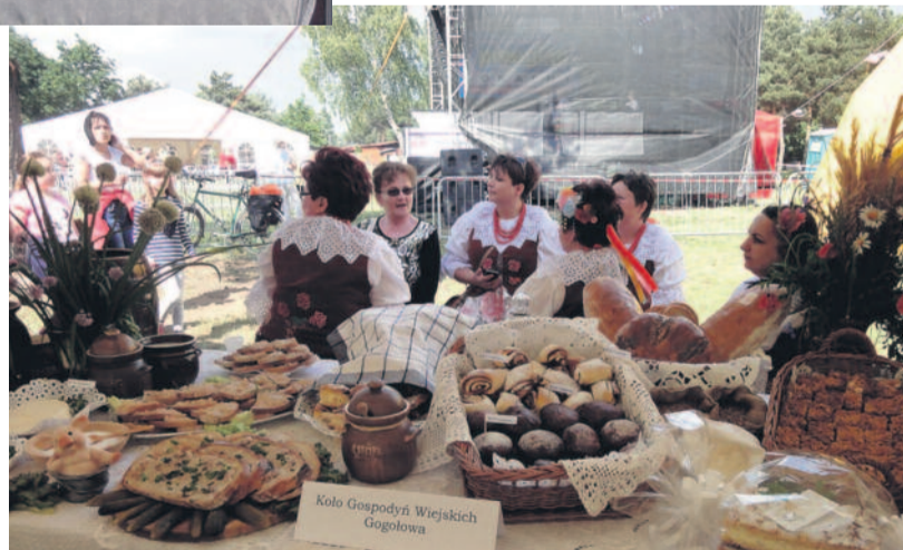
Atrakcją dla wielu był konkurs kulinarny. Panie z kół gospodyń wiejskich przygotowały na tę okazję różne smakołyki. Więcej o konkursie na str. 16, tam również znajdziecie przepis na pyszne zwyczajskie ciasto.