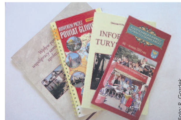
Te publikacje niedawno trafiły do czytelników.

z Powiatem Puckim i 5-letniego współdziałania z Powiatem Calw. Publikacja wydana została w limitowanym nakładzie, dostępna jest w Starostwie Powiatowym w Gliwicach. (MFR)