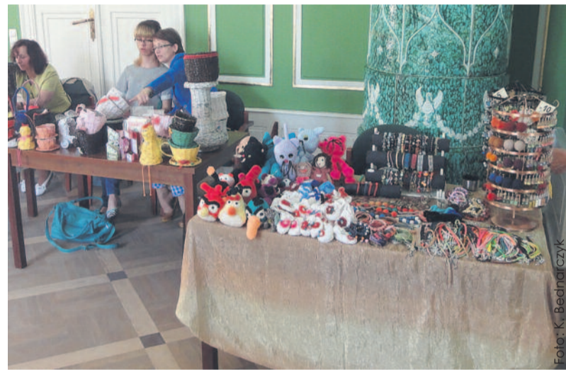
Podczas konferencji swoje stoiska wystawili rękodzielnicy i wytwórcy produktów lokalnych z terenu gmin Spichlerza.

W skład Spichlerza Górnego Śląska wchodzi pięć gmin z powiatu gliwickiego: Pilchowice, Rudziniec, Sośnicowice, Toszek, Wielowieś. (SoG)