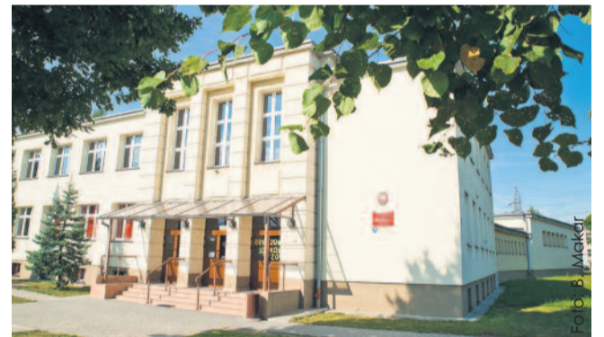
Z projektu skorzystają m.in. uczniowie Technikum Nr 1, wchodzącego w skład „Paderka”.