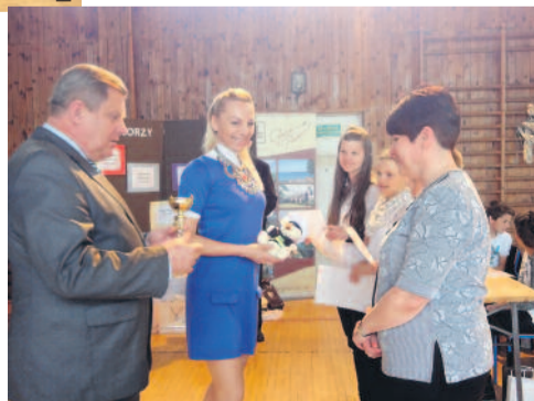
Zwycięzcy otrzymali puchary i pluszowe „Misie bezpieczeństwa”.