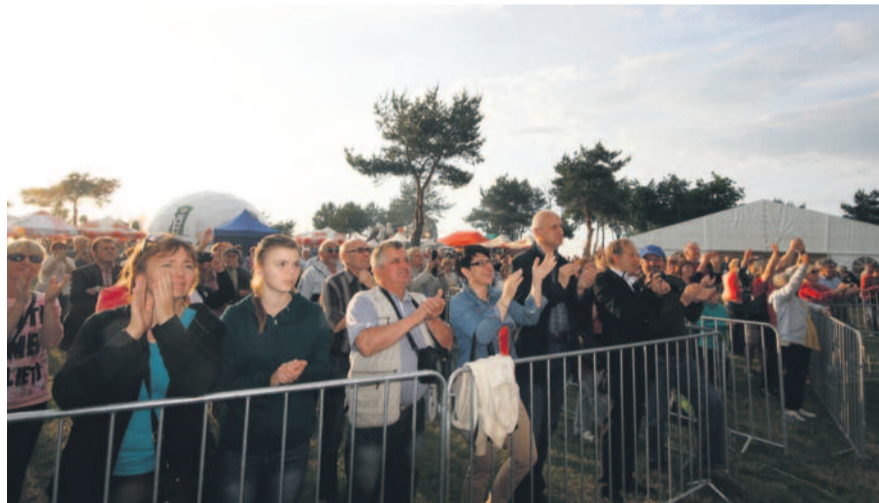
Na pikniku nad jeziorem bawili się z nami młodszy i starsi, oklaskując występujących na scenie artystów.