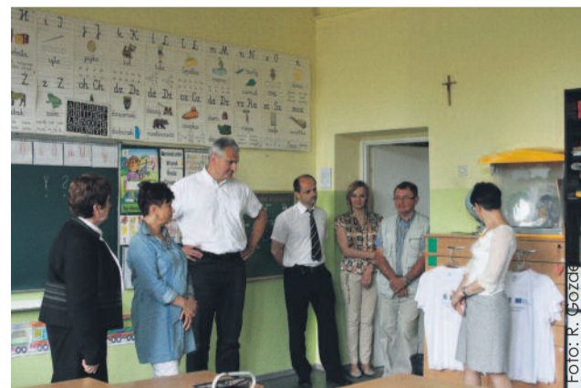
W jednej z klas Zespołu Szkół Specjalnych w Pyskowicach.