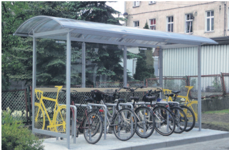
...a na rowery czekają przed starostwem eleganckie i bezpieczne wiaty.

dawna przed urzędem mają oni do dyspozycji specjalne dwie wiaty, gdzie mogą pozostawić swe jednoślady. Pierwsza z nich zamontowana została od frontu głównego budynku, przy małym parkingu od ulicy Zygmunta Starego, a druga na dużym parkingu znajdującym się od strony