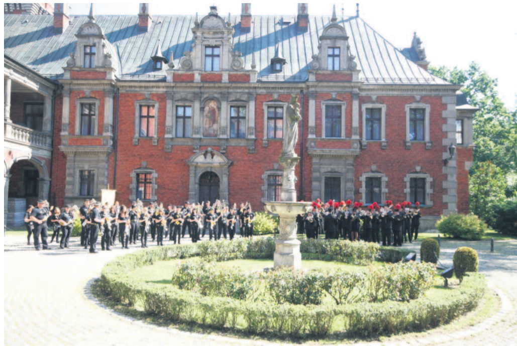
Na pięknym dziedzińcu Zespołu Pałacowo-Parkowego w Pławniowicach gości Konferencji międzynarodowej „Wpływ ponadnarodowej współpracy samorządów na jakość życia społeczności lokalnych” witały orkiestry KWK „Knurów” i „Milkauer” z powiatu Mittelsachsen.