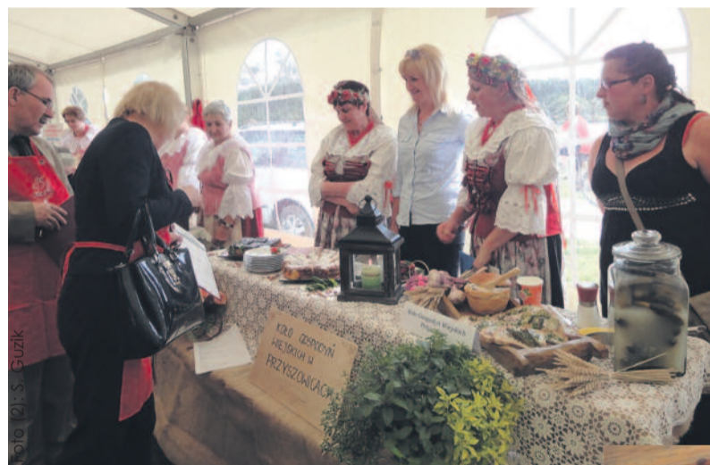
Stoisko zwyciężskiego KGW Przyszowice z wieloma pysznościami do posmakowania.