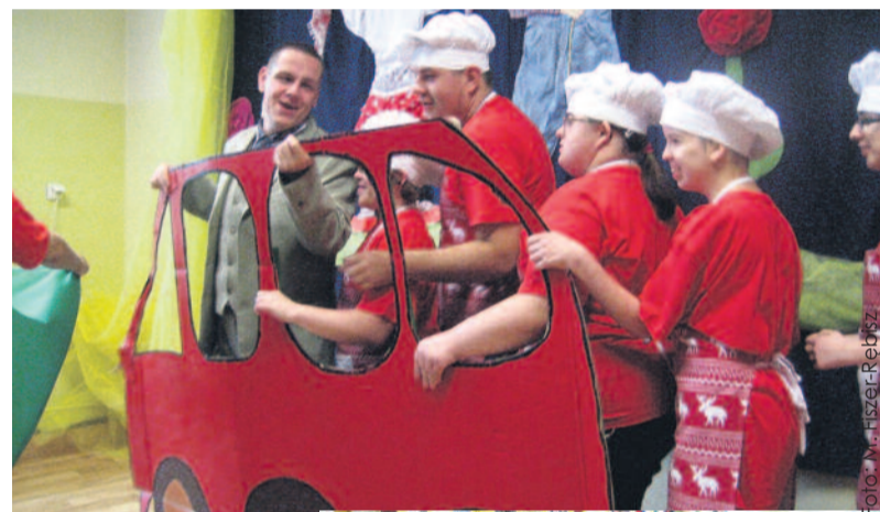
Uczniowie zabrali wszystkich w niezwykłą podróż po Europie.

Następnie nauczyciele – koordynatorzy szkolnych projektów programu Comenius Partnerskie Projekty Regio przedstawili multimedialne prezentacje, będące podsumowaniem czterech projektów realizowanych wspólnie z Niemcami, Wielką Brytanią i Czechami. Ogrom przeprowadzonych działań projektowych zadzi-