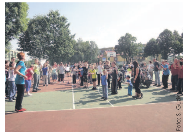
Dobra zabawa i integracja to główne cele pikniku.