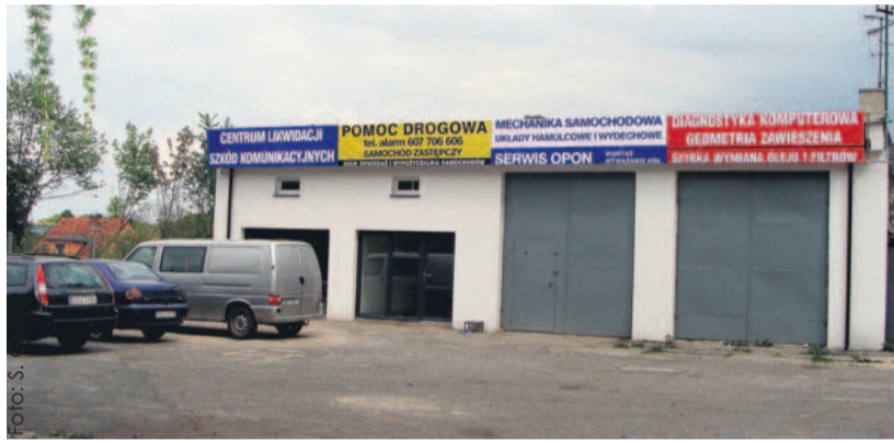
Niedawno uruchomione Centrum Likwidacji Szkód Komunikacyjnych.

Recepta na prosperowanie na rynku? Dobre wykonywanie swojej pracy, w mniejszych miejscowościach opinia o danej firmie jest bardzo ważna. To także pomaga w zdobywaniu klientów – zadowoleni z wykonanej usługi z pewnością polecają dany warsztat innym.