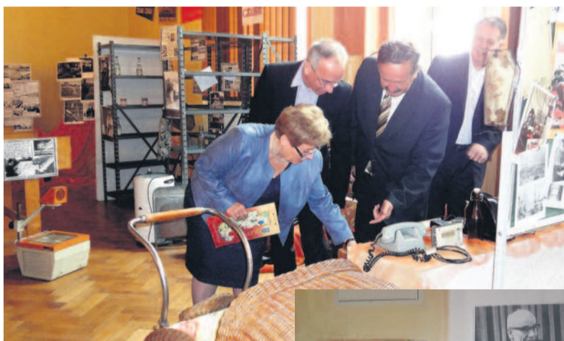
Wspomnienie czasów służnie minionych: puste półki, wiklinowy wózek dziecięcy, pralka Franja, stary rzutnik, Trybuna Robotnicza, zdjęcie Władysława Gomułki...