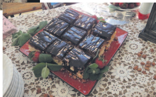
Zośka jest pracochłonna, ale warta grzechu...

Białka z cukrem ubić na pianę, dodać kokos, mąkę, proszek – wymieszać i wyłożyć na podpieczony sernik i piec ok. 15 min (na jasno, brązowo)