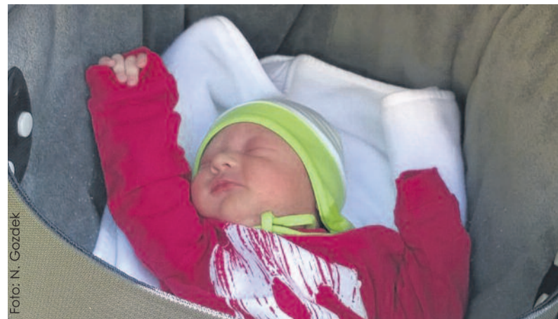
Od najmłodszych lat dziecko musi mieć zapewnione warunki do prawidłowego, radosnego rozwoju.

nie i wzmocnienie ich kompetencji oraz przeciwdziałanie zjawisku wypalenia zawodowego.