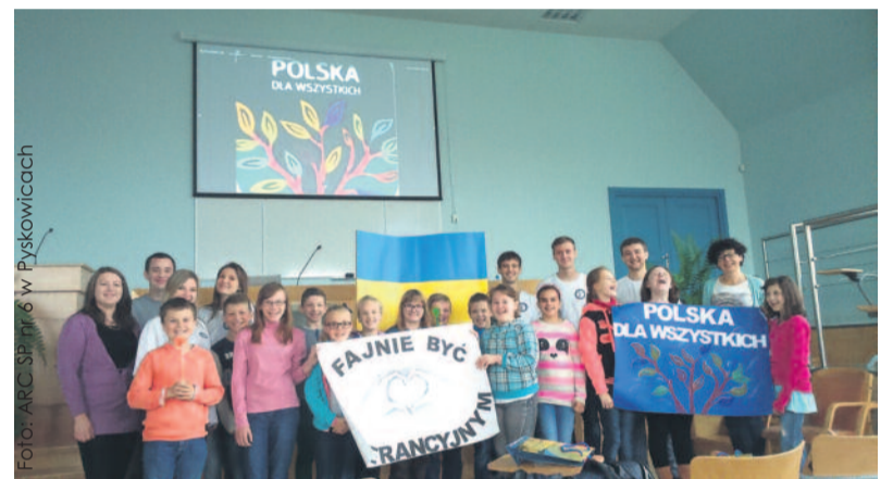
Uczniowie z Pyskowic wraz ze studentami na Uniwersytecie Opolskim.

Akcja odbyła się we współpracy z Przewozami Regionalnymi oraz Uniwersytetem Opolskim. Uczniowie z Pyskowic spotkali się ze studentami z Ukrainy. – Rozmawialiśmy o tym co łączy, a co dzieli Polskę i Ukrainę. Studenci ze wschodu zdradzali nam tajniki ich kuchni, opowiadali o specyfice prawosławia, a nawet zaśpiewali jedną z ukraińskich przyspiewek – kończy Błażej Kupski. (BK)