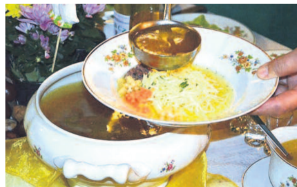
Pyszny rosół z domowym makaronem...

Odłoc z wierzchu rosółu na obiod i w nim uwarzyć nudle. Pokroć na drobno marchewka, pietruszka i żółtek i wciepnąć nazod do zupy.