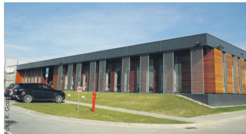
Marco ma teraz siedzibę, która umożliwia dalszy rozwój.

Wraz z ciągłym rozwojem przedsiębiorstwa rozwija się jego działalność społeczna. Marco od samego początku wspiera osoby, które tej pomocy potrzebują. Firma prowadzi kilkadziesiąt projektów charytatywnych i sponsorowanych, a zakładany budżet na tę dzia-