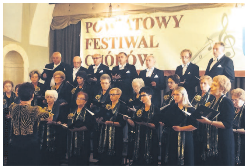
Występ Chóru „Skowronek”, który już od wieku krzewi tradycje śpiewacze.