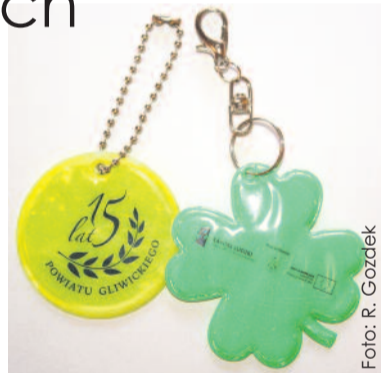
Odblaskowe breloczki wydał też Powiat Gliwicki, obdarowując nimi m.in. rowerzystów.

Drogowcy przypominają, że pieszy z odblaskiem jest widoczny z odległości 150 m. Natomiast bez niego – tylko z odległości 30-40 m. Warto zastanowić się nad zaopatrzeniem się w taki element, gdy stawką jest nasze życie –