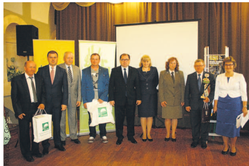
Zwycięzcy konkursu „Bezpieczna praca w gospodarstwie rolnym” wraz z jego organizatorami.