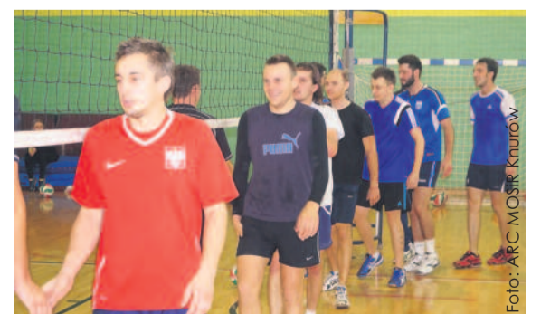
Podczas turnieju panowała świetna atmosfera, co widać na zdjęciu.