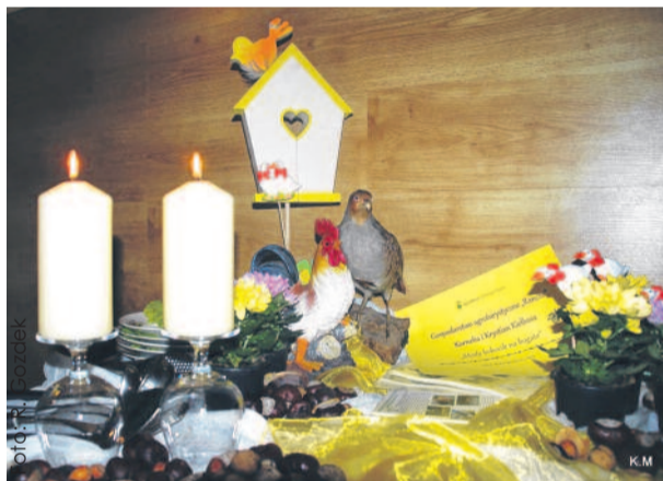
Jury doceniło nie tylko walory smakowe i tradycyjny charakter przygotowanej w Ranczu potrawy, ale też piękne nakrycie stołu.

Osobno naszykować wątróbki, nadzioc je na patyczki na przemian ze