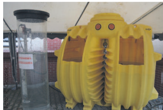
Takie oczyszczalnie montowane są przy domach, zapewniając spełnianie wszystkich norm ekologicznych.

Przyjęcie takiego rozwiązania ma na celu stopniowe, ale systemowe rozwiązanie problemu oczyszczania ścieków na terenie gminy. Obecnie na obszarze objętym czwartym etapem programu budowy przydomowych oczyszczalni ścieków, mieszkańcy korzystają z bezodpływowych zbiorników na nieczystości