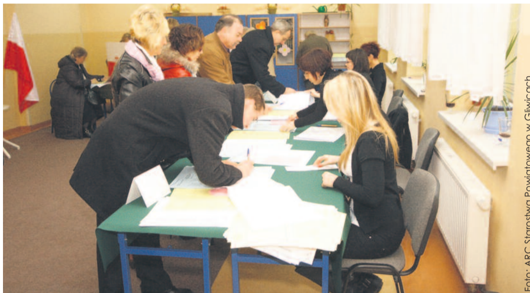
Tak głosowaliśmy w Knurowie przed czterema laty. Zachęcamy, by i w tych wyborach nie zabrakło Twojego głosu.

Natomiast wójtów, burmistrzów i prezydentów miast wybierzemy w wyborach bezpośrednich na zasadach analogicznych jak prezydenta RP. Zwycięzcą jest kandydat, który uzyska więcej niż połowę ważnie oddanych głosów. Jeżeli żaden kandydat nie uzyska poparcia więcej niż połowy wyborców, konieczne będzie przeprowadzenie drugiej tury głosowania, do której kwalifikuje się dwóch kandydatów z najlep-