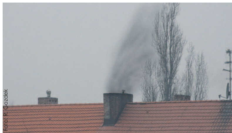
Kopzące ponad miarę kminy to niestety częsty widok na naszych osiedlach.