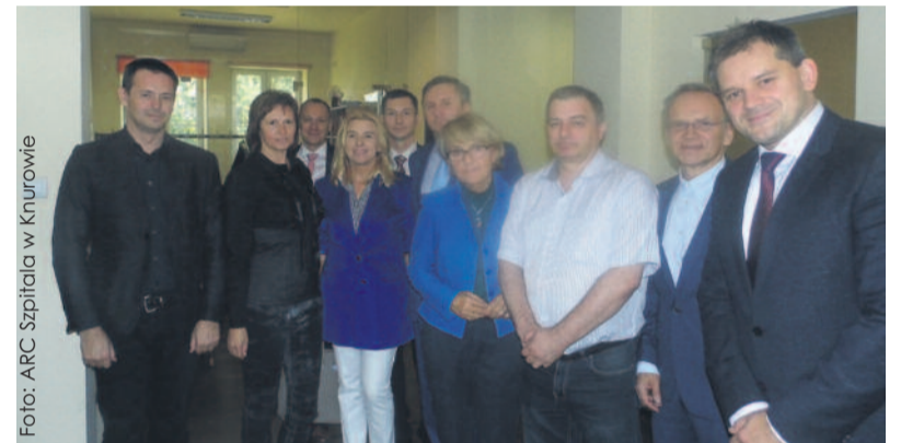
Przedstawiciele Śląskiego Klastra Medycznego podczas spotkania z prof. Danutą Hübner.

Ambitne plany klastra zostały przedstawione m.in. prof. Danucie Hübner, komisarzowi ds. polityki regionalnej w latach 2004-2009, a obecnie posłowi do Parlamentu Europejskiego, która spotkała się z członkami klastra podczas wizyty roboczej na Śląsku 10 października. W trakcie spotkania Danuta Hübner zapewniła o swoim poparciu dla inicjatyw podejmowanych przez Klaster oraz wskazała na możliwość kontaktu z przedstawicielami Komisji Europejskiej odpowiedzialnymi za politykę zdrowotną i ochronę zdrowia.