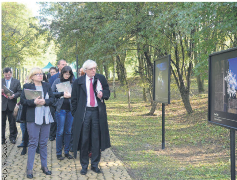
W trakcie wernisażu wystawy, którą oglądać można do kwietnia 2015 r.