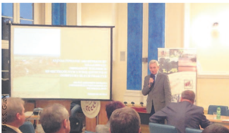
Uczestnicy spotkania mogli wysłuchać wykładu na temat kształtowania architektury obszarów wiejskich.