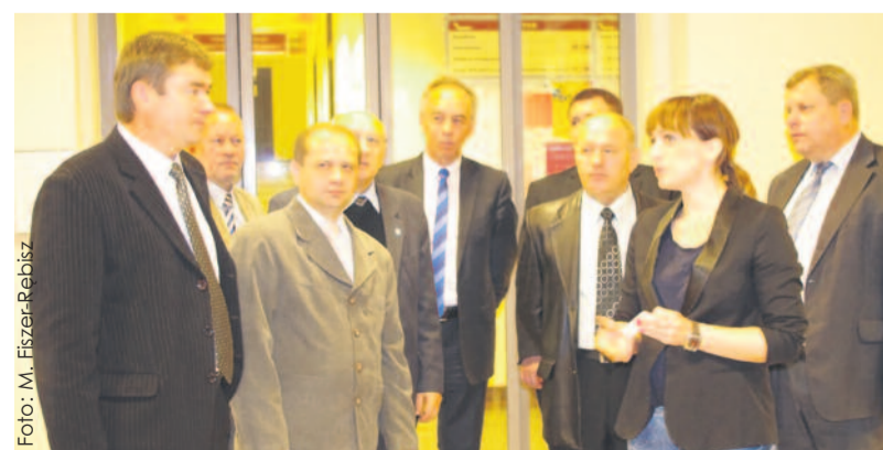
W Wydziale Komunikacji i Transportu, z którego pracą zapoznali się przedstawiciele Olewska i Obwodu Żytomierskiego. (MFR)

Medale za Długoletnią Służbę zostały ustanowione w II Rzeczypospolitej w 1938 r., a przywrócone w 2007 r. Są nadawane za wzorowe, wyjątkowo sumienne wykonywanie obowiązków wynikających z pracy zawodowej w służbie Państwa. (EG)