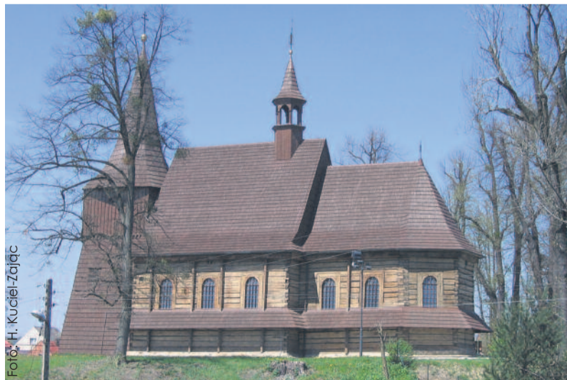
Jeden z malowniczych drewnianych kościołów w naszym powiecie mieści się w Żernicy.

Powstał, by łatwiej było wdrażać nowoczesne technologie i pozyskiwać unijne środki