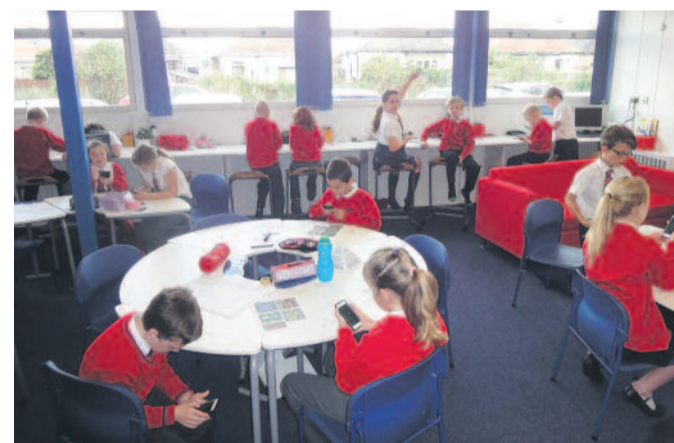
Przedstawiciele naszego powiatu zwiedzili m.in. szkołę podstawową w Rhyl, gdzie obserwowali np. zajęcia z wykorzystaniem Iphonów.