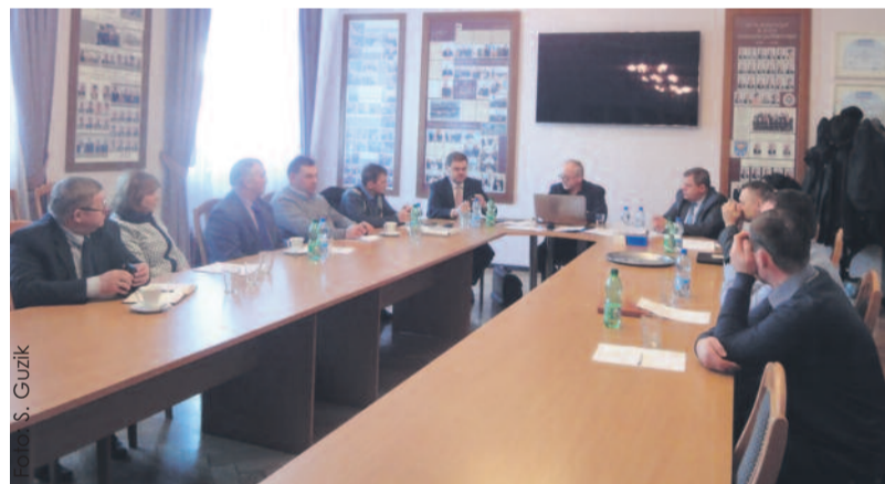
Na spotkaniu omówiono sprawy ważne dla rolników naszego powiatu.