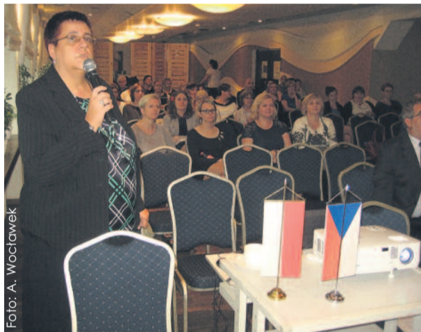
Podczas konferencji w Pyskowicach-Dzierżnie.