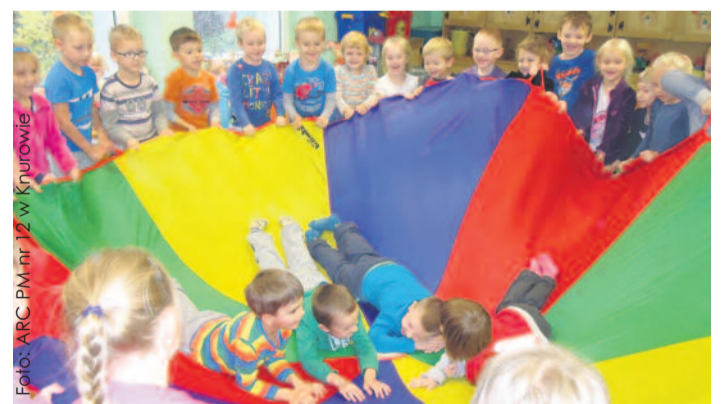
Dzieciom z Przedszkola Miejskiego nr 12 w Knurowie nie brakuje okazji do wesolej zabawy.

Efekt wszystkich tych działań jest bardzo wymierny: śmiało można stwierdzić, że każdy wy-