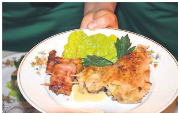
...i mięso w delikatnym sosie oraz roladki z wątróbki i boczku.