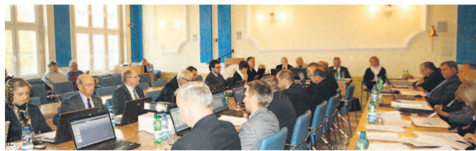
Podczas październikowej sesji Rady Powiatu Gliwickiego.

W klimacie podsumowań toczył się także następny punkt porządku sesji – przedstawienie sprawozdań z pracy komisji rady w 2014 r. Przybliżyli je radnym przewodniczący wszystkich sześciu stałych komisji.