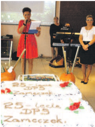
Urodzinowe torty z okazji czterdziu „Zameczku”.

2015 był rokiem okrągłych jubileuszy wielu powiatowych placówek. Jako pierwszy pod koniec maja świętował swoje 25-lecie Dom Pomocy Społecznej „Zameczek” w Kuźni Nieborowskiej. Wkrótce potem, bo w połowie czerwca, złote gody obchodził Dom Pomocy Społecznej „Ostoja” w Sośnicowicach. Obydwie placówki przeszły w ciągu swojego istnienia ogromną metamorfozę, stając się prawdziwymi domami dla swoich mieszkańców – przytulnymi, bezpiecznymi i pełnymi rodzinnej atmosfery. Na jubileuszowych obchodach były gratulacje i urodzinowe życzenia, a przede wszystkim wesoła zabawa