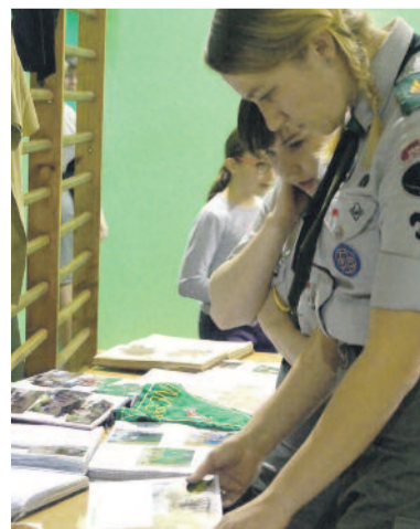
... i wystawy, przypominającej chwile spędzone w harcerskim gronie.