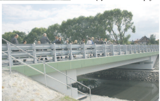
W Leboszowicach wreszcie jeździ się nad Bierawką bezpiecznie.

na odcinku łączącym węzeł dróg krajowych w okolicy Kleszczowa i Rzecyz z drogą wojewódzką w rejonie Rachowic. Zakończenie każdego z tych trzech projektów dro-