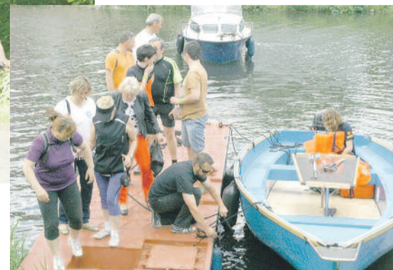
Na mecie na wszystkich czekały motorówki, by można było zobaczyć atrakcje Kanału Gliwickiego.

ści mogli zwiedzić Zespół Pałacowo-Parkowy oraz popływać skuterem wodnym lub motorówkami. Trasa była długa, ale warto ją było pokonać, bo na mecie zabawy było co niemiara!