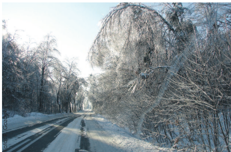
Zimowa droga w Pławniowicach.