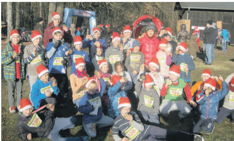
Uczestnikom Biegu Mikołajkowego w Lublińcu dopisywały humory.

Natomiast 17 grudnia uczniowie uczestniczyli w Zimowej Olimpiadzie Pomysłów z Klasą, która odbyła się w Hali na Skarpie w Bytomiu. Przyjechało na nią 30 zespołów z całej Polski. Uczniowie mieli za zadanie zaprezentować swoje sposoby na ciekawy wuef. Zrobili to w nietuzinkowy sposób, przedstawiając takie pomysły jak m.in. molokki, taniec belgijski, linorozgrzewka, rugby TAG, gry w ganianego itp.