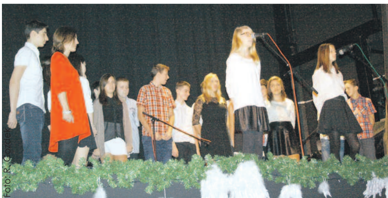
Młodzież bardzo solidnie przygotowała się do szkolnego koncertu.