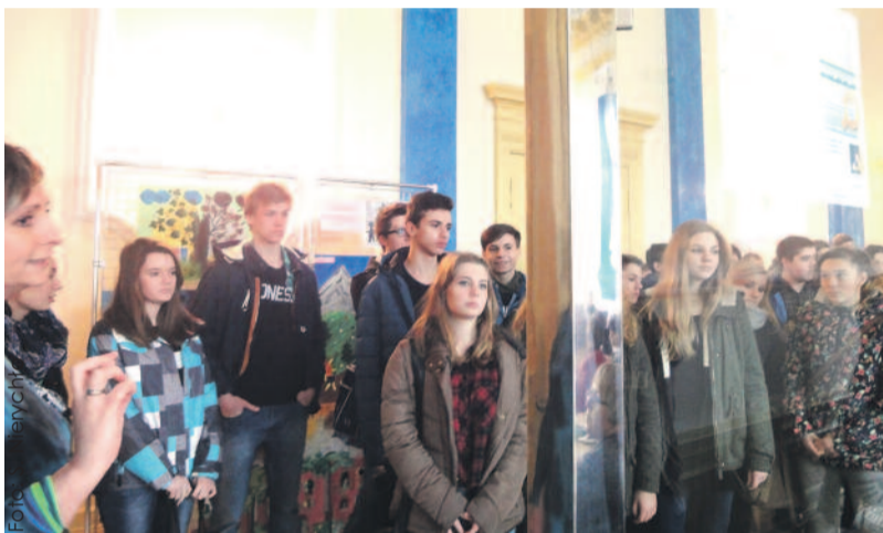
Gimnazjaliści odwiedzili m.in. salę sesyjną, gdzie co miesiąc zbiera się Rada Powiatu Gliwickiego.

Wizytę zakończyła wspólna fotografia przed budynkiem starostwa. Z pewnością znajdzie się w szkolnej kronice. (MFR)