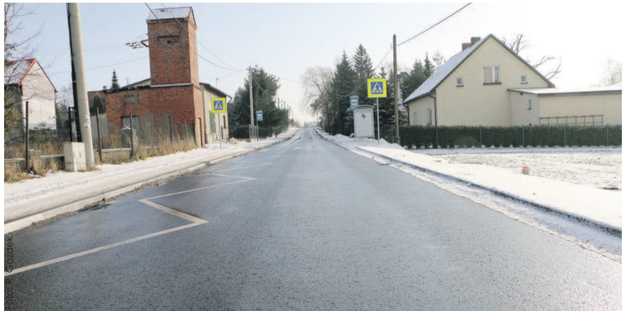
W tym roku powiat nadal duże środki przeznaczy na inwestycje drogowe. Kontynuowana będzie np. przebudowa ulicy Dolna Wieś w Pilchowicach (na zdjęciu), której I etap – przy współudziale państwa i gminy – wykonano w ub. r. Na drugiej pozycji powiatowych inwestycji znajdzie się modernizacja placówek ochrony zdrowia.

W ostatnich latach główne źródła dochodów powiatu ulegają stabilizacji. Dochody własne powiatu w 2016 roku wyniosą ponad 53 proc. dochodów ogółem, podobnie jak w roku poprzednim. Podstawowym źródłem dochodów własnych powiatu, stanowiącym ok. 34 proc. dochodów ogółem, jest udział powiatu w podatku dochodowym od osób fizycznych, który jest dochodem państwa, a powiat posiada 10,25 proc. udziału w tym podatku. Jak zawsze jest to główny punkt ryzyka stabilności finansów powiatu, gdyż wielkość podatku uzależniona jest zarówno od koniunktury gospodarczej w powiecie, jak i w całym