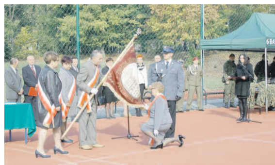
Nadanie sztandaru „Konopnickiej”...

tej placówki Złotą Odznaką „Za Zasługi dla Województwa Śląskiego”, a także z V Zjazdem Absolwentów Liceum. Listopadowy jubileusz knurowskiego ZSZ nr 2 miał również uroczysty charakter i – tak samo jak w Pyskowicach – połączony został z przekazaniem szkole nowo ufundowanego sztandaru.