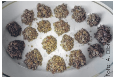
Ciasteczka z płatków owsianych są pyszne i zdrowe.

Składniki: 2 jabłka, ¼ szklanki płatków owsianych, 1 jajo, 1 łyżka miodu,