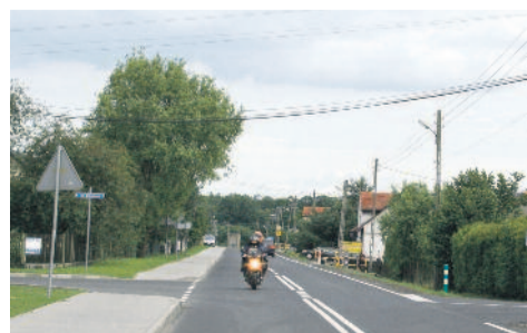
Szlak Europejski stanowi konieczną alternatywę dla autostrady A4.

gowych świętowano na pikniku z udziałem realizatorów inwestycji i okolicznych mieszkańców. To były największe inwestycje drogowe w historii powiatu. Ich łączna wartość wyniosła ponad 25,5 mln zł, z czego ok. 21,3 mln zł stanowiło unijne dofinansowanie.