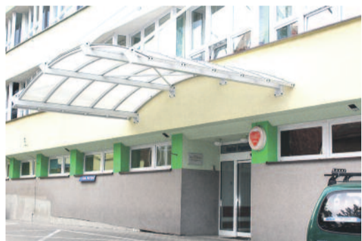
Swoj wygląd – zarówno na zewnątrz, jak i wewnątrz – zmienia Szpital w Pyskowicach.

zacja m.in. Oddziału Chorób Wewnętrznych i Bloku Operacyjnego. Pyskowicki Zespół Przychodni Specjalistycznych poszerzył swoją ofertę o trzy nowe – na razie działające komercyjnie – poradnie: ginekologiczną, kardiologiczną i ortopedyczną.