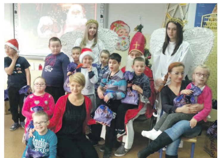
Święty Mikołaj sprawił dzieciom niezwykłą radość.