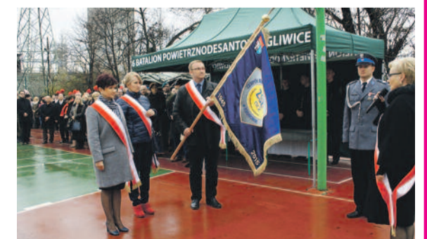
... i Zespołowi Szkół Zawodowych nr 2 w Knurówie.

Opł.: EWA PIESZKA