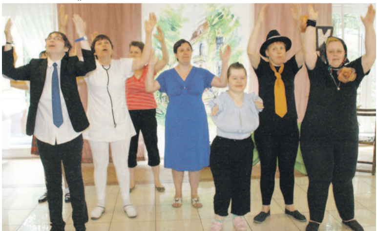
Mieszkancki „Ostoi” przygotowały na obchody jubileuszu wzruszające przedstawienie.

2015 był rokiem okrągłych jubileuszy wielu powiatowych placówek. Jako pierwszy pod koniec maja świętował swoje 25-lecie Dom Pomocy Społecznej „Zameczek” w Kuźni Nieborowskiej. Wkrótce potem, bo w połowie czerwca, złote gody obchodził Dom Pomocy Społecznej „Ostoja” w Sośnicowicach. Obydwie placówki przeszły w ciągu swojego istnienia ogromną metamorfozę, stając się prawdziwymi domami dla swoich mieszkańców – przytulnymi, bezpiecznymi i pełnymi rodzinnej atmosfery. Na jubileuszowych obchodach były gratulacje i urodzinowe życzenia, a przede wszystkim wesoła zabawa