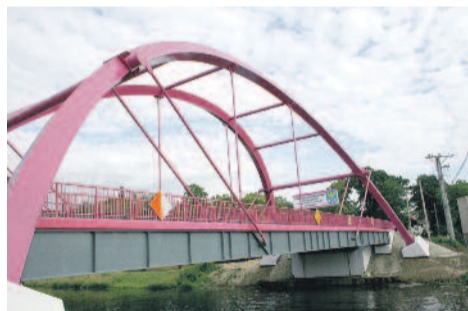
Most w Pławniowicach ma imponującą konstrukcję.

2015 to rok zakończenia trzech wielkich inwestycji drogowych, na których realizację Powiat Gliwicki pozyskał unijne dofinansowanie. Nad Kanałem Gliwickim w Pławniowicach wyrosła imponująca konstrukcja nowego mostu z dwoma pasami ruchu i kładkami dla pieszych. Również w Leboszowicach przebudowano most nad Bierawką – stary z drewnianą nawierzchnią zastąpiony został przez nowy, żelbetonowy. Wzrosło też bezpieczeństwo pieszych, bo na nowym moście pojawił się przeznaczony dla nich chodnik. Trzecią wielką inwestycją była modernizacja dróg tworzących Szlak Europejski