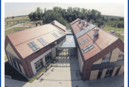
Zmienia się oblicze Sośnicowic.

Jesienią w Sośnicowicach otwarto nowoczesne Gminne Centrum Społeczno-Kulturalne i Bibliotekę, gdzie poza bogatym księgozbiorem i stanowiskami komputerowymi, mieszczą się OPS, Dom Diennej Opieki, NZOZ Caritas świadczący usługi pielęgnacyjne oraz sala koncertowa. W tym samym czasie w gminie uruchomiona została również licząca 14 ha Strefa Aktywności Gospodarczej przeznaczona dla małych i średnich przedsiębiorstw. To wszystko sprawiło, że w Sośnicowicach pojawiły się dobre warunki dla inwestorów, a mieszkańcy mają piękny, funkcjonalny obiekt do swego użytku. Nic dziwnego, że pod koniec roku gmina nominowana została do nagrody Lider Rozwoju Regionalnego, nadawanej przez Polską Agencję Przedsiębiorczości oraz redakcje Biznes Plus w Gazecie Wyborczej i Forum Przedsiębiorczości w Dzienniku Gazecie Prawnej.