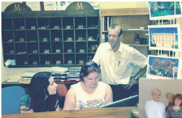
Uczennice Technikum nr 1 w Knurowie w czasie wakacji odbywały staż w Hiszpanii.

Projekty unijne umożliwiły też sfinansowanie edukacji poza granicami kraju. Nauczyciele Zespołu Szkół im. I. J. Paderewskiego w Knurowie uczestniczyli w językowych praktykach zagranicznych w Niemczech, Wielkiej Brytanii i na Malcie, a uczennice technikum obsługi turystycznej z tej samej szkoły odbyły miesięczny staż w Hiszpanii.