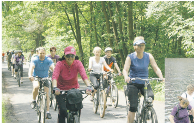
Uczestnicy rajdu poznali uroczne trasy rowerowe wiodące przez tereny leśne.

30 maja rano spod budynku starostwa wyruszył IV Rajd Rowerowy po Powiecie Gliwickim. Tym razem trasa prowadziła przez Kozłów i Rachowice do Pławniowic, gdzie rowerzy-