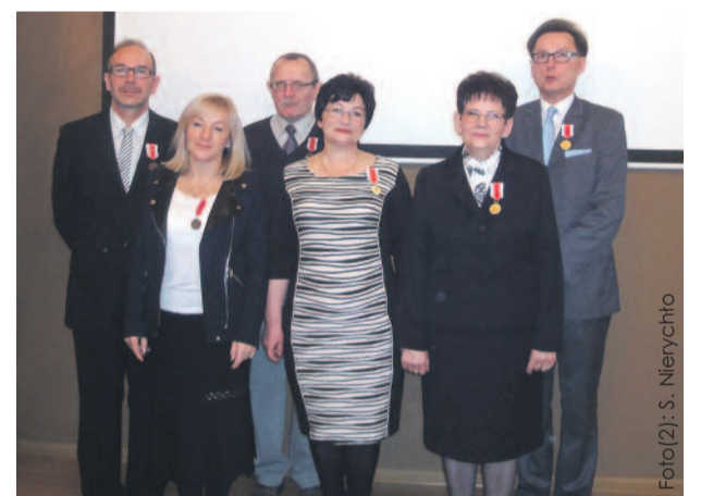
Grono odznaczonych samorządowców.

Podczas spotkania podsumowano kwalifikację wojskową, przeprowadzoną w powiecie gliwickim w 2015 roku. Kwalifikacja przeprowadzana była od 2 lutego do 3 marca w Wojskowej Komendzie Uzupelnień w Gliwicach. Do kwalifikacji w ub. roku stanęło 591 osób. Spośród ośmiu gmin powiatu gliwickiego aż z czterech przed komisją lekarską stawilo się 100 proc. osób podlegających kwalifikacji – były to gminy