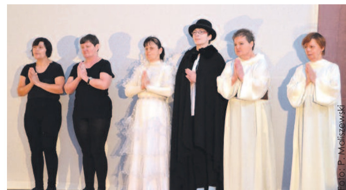
Mieszkanicy DPS „Ostoja” w Sośnicowicach na przeglądzie pokazały jasełkowy teatr cieni, za co otrzymały nagrodę.