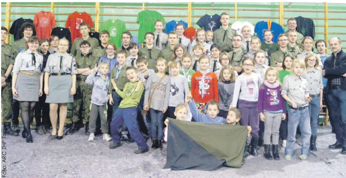
Druhny i druhowie z Toszka zapraszają w swe szeregi wszystkich, którzy lubią skautowski klimat.

Drugiego grudnia 2015 minęło 15 lat od powrotu harcerzy na ziemię toszecką.