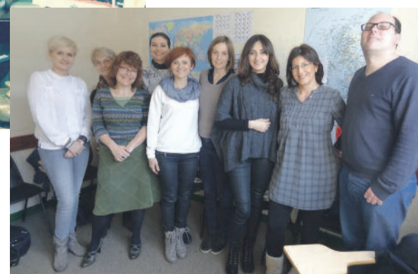
Tym razem to nauczyciele mieli okazję podnosić swe umiejętności językowe.

Z kolei nauczyciele Zespołu Szkół Specjalnych w Pyskowicach wymieniali się doświadczeniami ze swoimi kolegami z podobnej placówki w czeskiej Opawie, wspólnie wypracowując najlepsze metody pracy z uczniami o specjalnych potrzebach edukacyjnych.