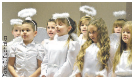
W podróży do nieba pomogły wszystkim wdzięczne Aniołki.

13 grudnia w Domu Kultury w Wilczy zorganizowany został kiermasz świąteczny, na którym można było nabyć ozdoby choinkowe wykonane przez uczniów Zespołu Szkolno-Przedszkolnego w tej miejscowości. Podczas odbywającego się kiermaszu młodzież miejscowej szkoły wystąpiła z piękną inscenizacją.