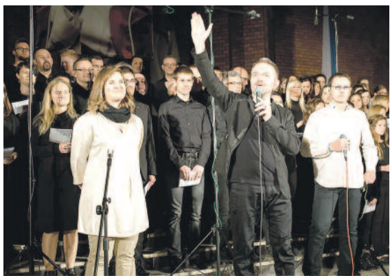
TGD zaśpiewał na cześć Jana Pawła II.

W październiku świętowaliśmy Dzień Papieski Ziemi Gliwickiej. Były m.in. spektakle teatralne, „Randki małżeńskie” i rajd śladami Jana Pawła II. Największy entuzjazm wzbudziły koncerty zespołu TGD (Trzecia Godzina Dnia), połączone z warsztatami dla miłośników gospel.