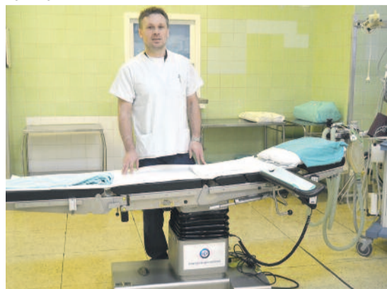
Nowy stół operacyjny w Szpitalu w Knurowie.

Sporo działa się w minionym roku w powiatowej opiece zdrowotnej. Szpital w Knurowie zawarł umowę z Narodowym Funduszem Zdrowia na leczenie wszystkich chorych z zakresu pakietu onkologicznego. W bloku operacyjnym tego szpitala pojawił się nowoczesny stół operacyjny oraz nowy aparat do znieczulania ogólnego i laparoskopowy. Gruntowną przebudowę przechodzi również Przychodnia Rejonowa nr 2 przy ul. Kazimierza Wielkiego w Knurowie prowadzona przez ZOZ Knurów – jednostkę organizacyjną Powiatu. Remont, obejmujący m.in. udogodnienia dla niepełnosprawnych, pozwoli poszerzyć oferowany zakres usług medycznych.