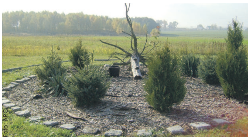
Efekt konkursu w Proboszczowicach...