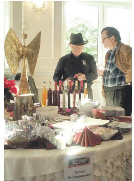
Tak prezentował się stół przygotowany przez proboszczowickie Ranczo.

II miejsce w kategorii profesjonalistów zajęła Pensjonat na Beskidku ze Zwardonia i ex aequo miejsca III – Bukowa Karczma z Buczkowic i Restauracja