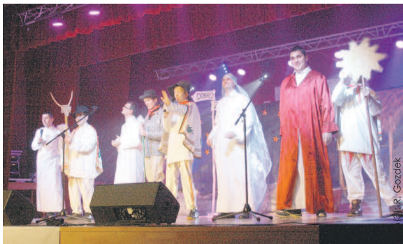
Mieszkańcy DPS-u w Pilchowicach zaprezentowali piękne jasełka.