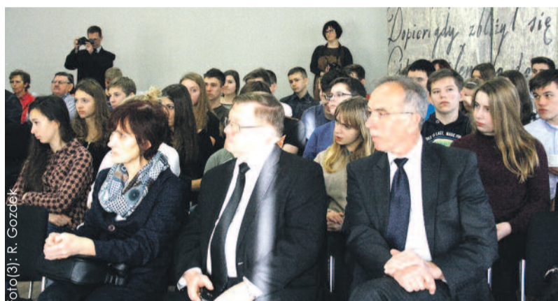
Wszyscy z przejęciem słuchali historii Górnoszlazaków.

Wystawę „Deportacje mieszkańców Górnego Śląska do ZSRR w 1945 r.” można oglądać w bibliotece w Sośnicowicach codziennie od pon. do pt. w godz. 10.00-18.00. Czynna jest do 15 stycznia. (RG)