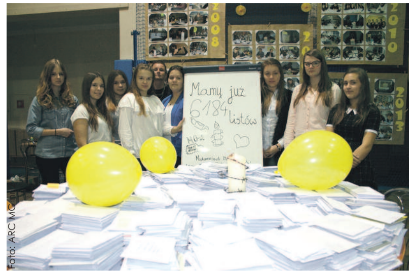
Uczniowie z dumą prezentują 6184 listy, które powstały, by wolność mógł uzyskać najdłużej więziony dziennikarz na świecie.

11 grudnia odbył się Wielki Finał akcji, podczas którego delegacje szkół, zaproszeni goście oraz ochotnicy zasie-