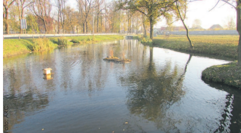
...i w Wielowsi, gdzie przy stawie powstał skwer rekreacyjny.