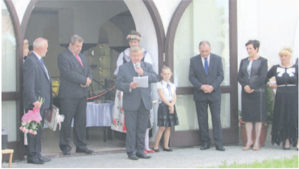
Ukłon w stronę naszych tradycji – w pałacu w Wielosiu otwarty został skansen.

Od czerwca oficjalnie działa w Wielosiu skansen sprzętu rolniczego i gospodarczego. Ekspozycja prezentowana jest w skrzydle XVIII-wiecznego kompleksu pałacowo-parkowego i składa się z dwóch części. W pierwszej zaprezentowano wyposażenie dawnego mieszkania, a w drugim pomieszczeniu zgromadzono narzędzia i sprzęty rolnicze.