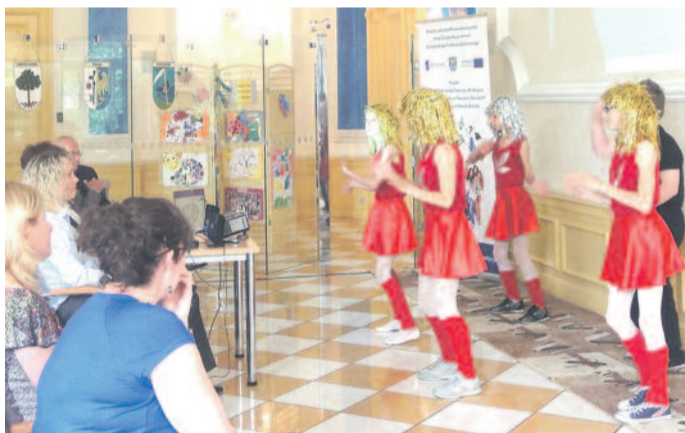
Podczas konferencji podsumowującej projekt START w starostwie.

Obydwa projekty pozwoliły doposażyć placówki w atrakcyjne pomoce dydaktyczne – począwszy od książek, po laptopy, sprzęt fotograficzny czy dygestorium.