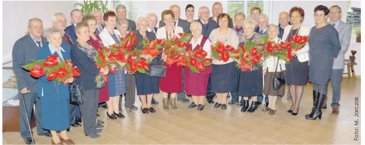
Jubilaci po odebraniu życzeń podczas uroczystości, która uczciła ich 50- i 60-lecie małżeństwa.

Po przywitaniu gości wójt wygłosił ciepłe przemówienie do zebranych Jubilatów i odznaczył pary medalami. Gości dopełniły życzenia, upominki oraz kwiaty. Oto pary, które obchodziły