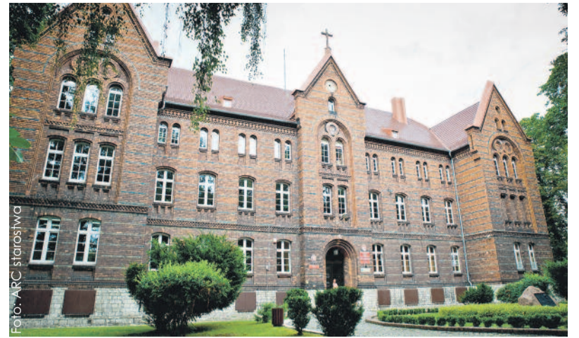
Budynek „Konopnickiej” – tutaj powstawały najlepsze filmy klubowe.

Filmy realizowano w formacie 8 mm, super 8 mm i 16 mm. Oznacza to, że produkcję nagrywano na taśmie o szerokości 8 lub 16 milimetrów. Potem pojawiły się kamery VHS i S-VHS. A ostatnie lata istnienia to już nagrania w systemie cyfrowym. Tematyka poruszana w filmach była róż-