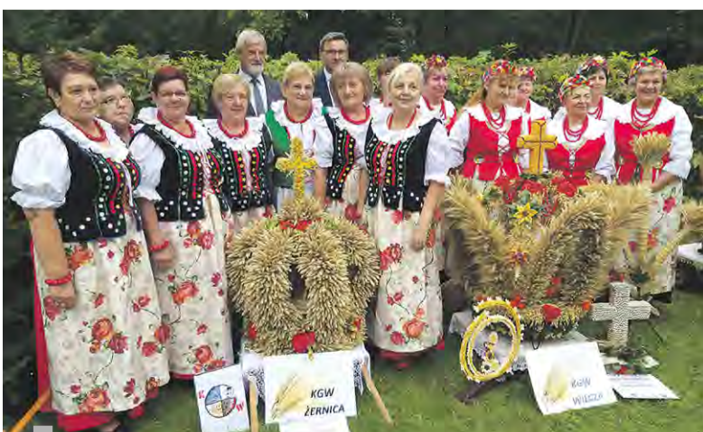
KGW Żernica i KGW Wilcza prezentują swoje piękne korony dożynkowe

września w Rudach odbyły się Dożynki Diecezjalne, które połączone zostały z Dożynkami Powiatu Gliwickiego. W uroczystościach uczestniczyli Samorząd Powiatu Gliwickiego, posłowie na Sejm RP, władze miast i gmin, mieszkańcy naszego powiatu oraz delegacje z różnych stron Diecezji Gliwickiej.