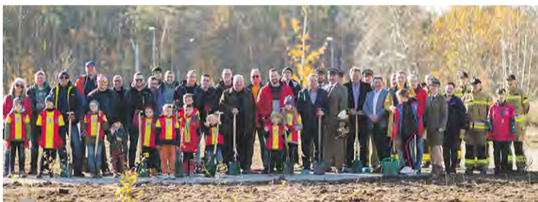
Sadzenie drzew w Rudzińcu z firmą KIRCHHOFF Polska