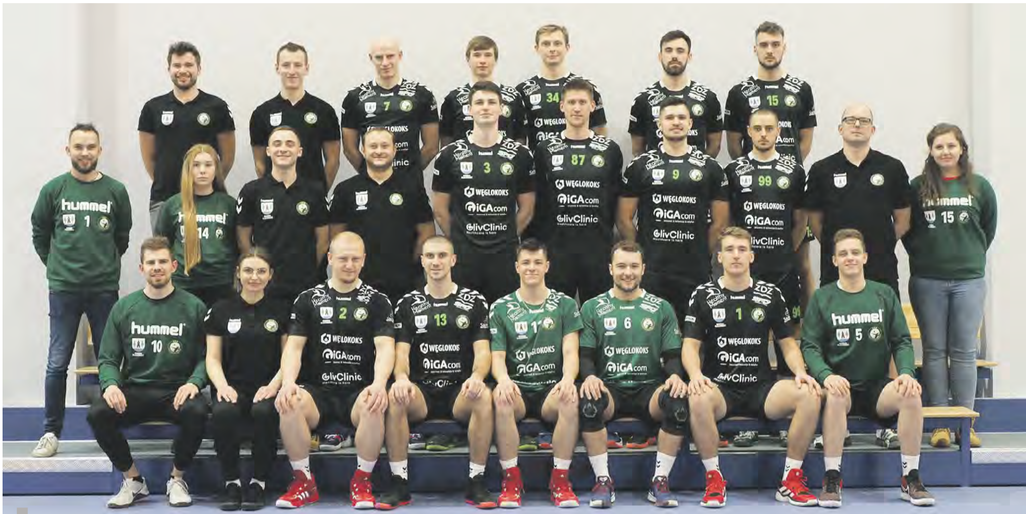
Drużyna KS Rudziniec na wspólnym zdjęciu

Zaczął się od pasji, dziś zdobywają sukcesy. Klub Sportowy Rudziniec to jedna z największych sportowych dum powiatu oraz bez wątpienia najszybciej rozwijająca się drużyna. Powstał w 2015 roku klub siatkarski w zaledwie kilka lat przebył drogę od amatorskich meczy w gronie znajomych, aż do rozgrywek w lidze śląskiej, zdobywając w ubiegłym sezonie tytuł Wicemistrza Śląska oraz awansując do turniejów finałowych o II ligę w mistrzostwach ogólnopolskich Polskiego Związku Piłki Siatkowej.