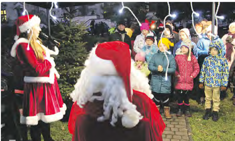
Dzieci (i dorośli) bardzo lubią św. Mikołaja