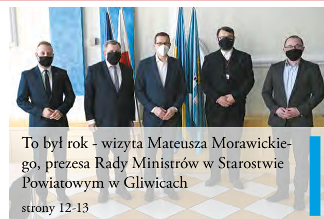
To był rok - wizyta Mateusza Morawickiego, prezesa Rady Ministrów w Starostwie Powiatowym w Gliwicach