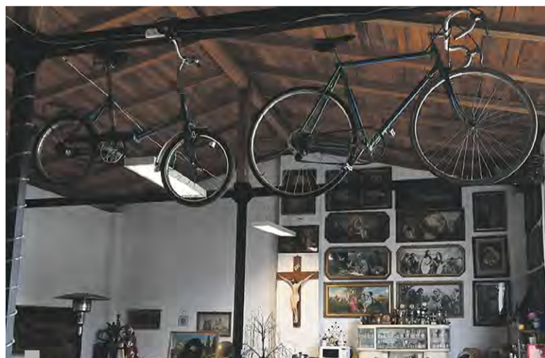
Imponująca kolekcja oleodruków w jednym z pomieszczeń muzeum