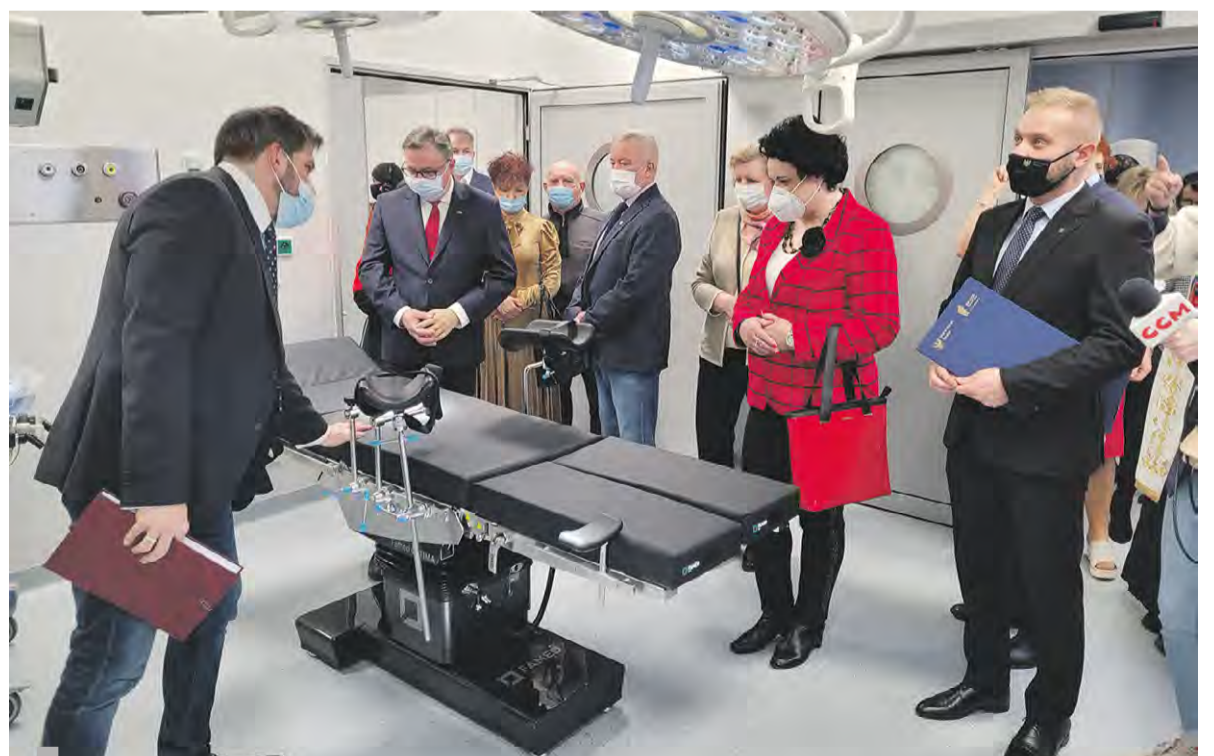
Zwiedzanie Oddziału Położniczego w knurowskim szpitalu