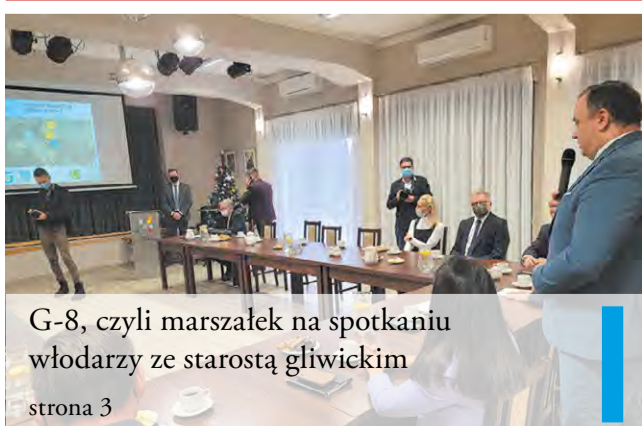
G-8, czyli marszałek na spotkaniu wóldarzy ze starostą gliwickim