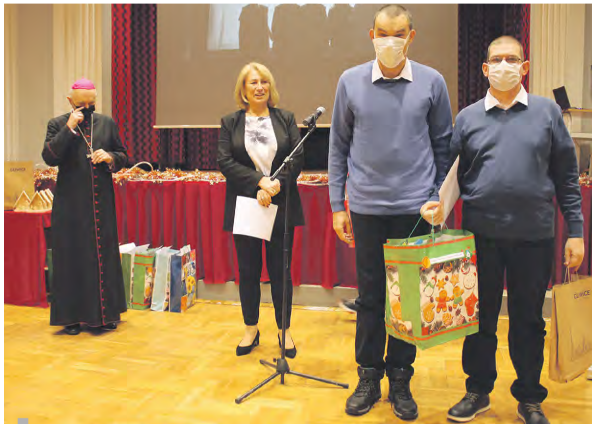
Mieszkańcy Domu Pomocy Społecznej Ojców Kamilianów w Pilchowicach zajęli II miejsce. Jury miało niełatwe zadanie oceny inscenizacji online