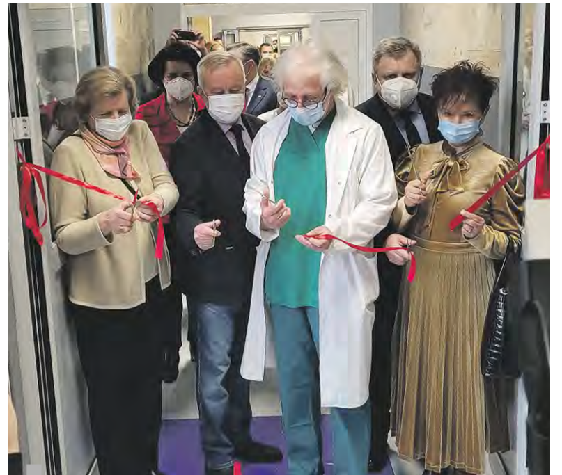
Przecięcie symbolicznej wstęgi podczas otwarcia Oddziału Chirurgii w Szpitalu w Knurowie