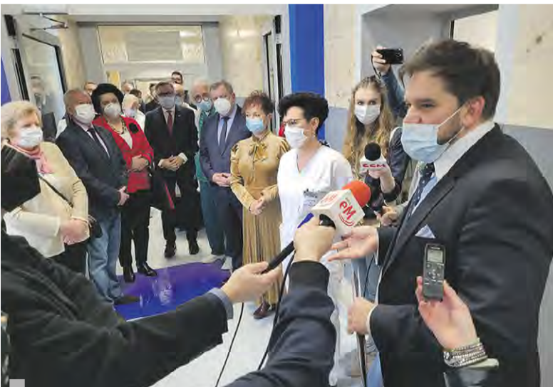
Otwarcie trzech szpitalnych oddziałów po modernizacji to było wydarzenie prawdziwie medialne

Tekst i zdjęcia: Magdalena Fiszer-Rębisz