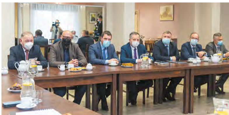
Tematów do rozmów nie brakowało