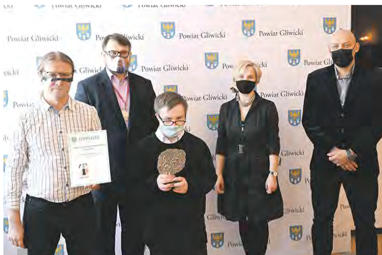
Nagroda już w rękach zespołu wokalnie-instrumentalnego „Mezzoforte”

Wraz z końcem miesiąca nastąpiło otwarcie zmodernizowanej Pracowni Endoskopii w Szpitalu w Knurowie. Całkowita wartość inwestycji to 1,4 mln złotych, z czego aż 960 tysięcy to dofinansowanie ze środków Rządowego Funduszu Inwestycji Lokalnych.