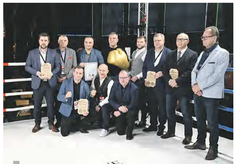
Pamiątkowe zdjęcie osób wspierających Gardę