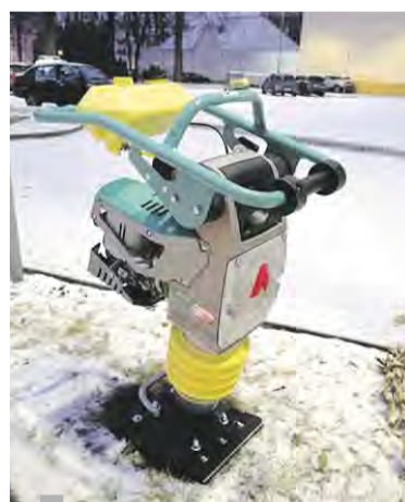
Powyżej: Ubijak drogowy już pracuje na powiatowych drogach.

Po prawej: Walec i przyczepka z pewnością usprawnią pracę naszych drogowców z ZDP.