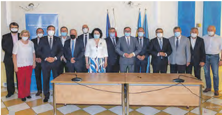
Wojewoda śląski po podpisaniu umów w Starostwie Powiatowym