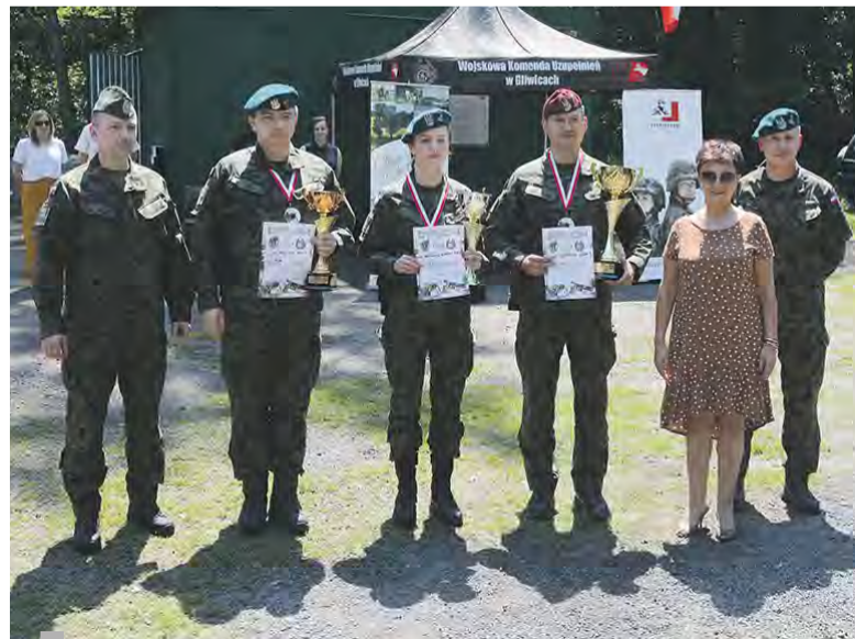
Zwycięcy Mistrzostw Wojewódzkiego Sztabu Wojskowego

Na strzelnicy Dzierżno koło Pyskowic odbyły się Mistrzostwa Wojewódzkiego Sztabu Wojskowego w Katowicach organizowane przez Wojskową Komendę Uzupełnień w Gliwicach oraz Powiat Gliwicki. W klasyfikacji indywidualnej zwyciężył oficer z WKU w Tychach zaś drużynowej – WKU w Rybniku.