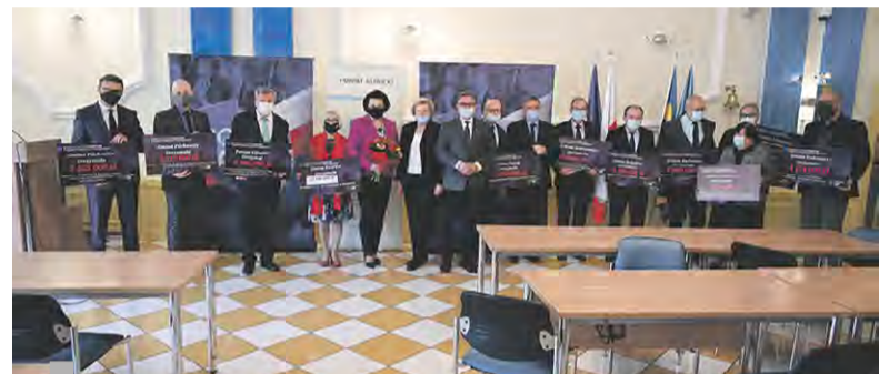
Włodarze gmin powiatu gliwickiego z czekami z „Polskiego Ładu”

27 listopada 2021 roku Klub Sportowy Garda z Gierałtowic obchodził Jubileusz X-lecia. Uroczystość jubileuszową zorganizowano wspólnie z VII Międzynarodowym Memoriałem Bokserskim im. Tadeusza Łady o Puchar Wójta Gminy Gierałtowice, gdzie pojawili się również goście honorowi: Dariusz Michalczewski – mistrz świata oraz Marian Kasprzyk – medalista olimpijski. W ciągu 10 lat zawodnicy Gardy wystąpili w 260 turniejach i zdobyli 573 medale (316 złotych, 172 srebrne, 85 brązowych).