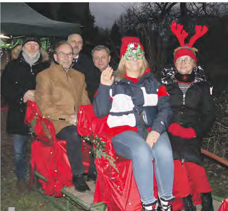
Miło było przejechać się saniami św. Mikołaja... nawet kiedy nie było śniegu