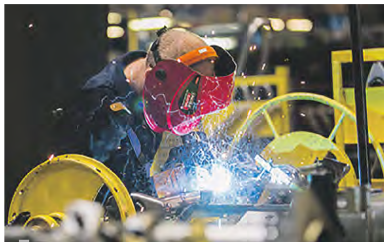
Praca w gliwickiej firmie może dać dużą satysfakcję