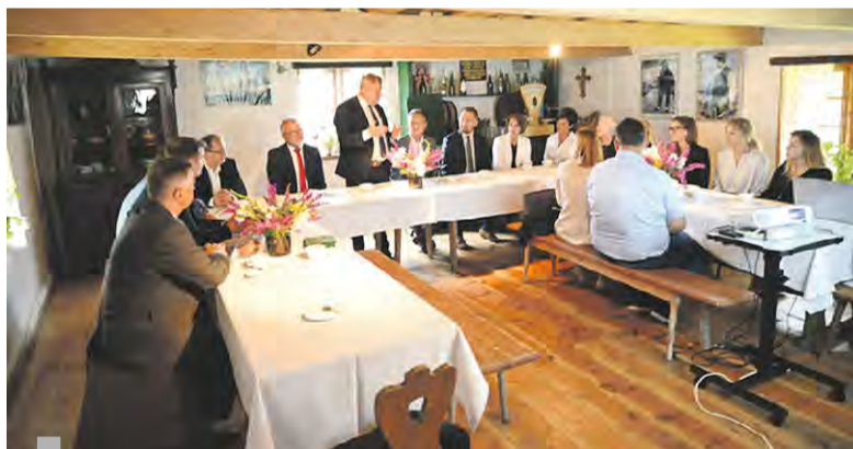
Delegacja powiatu gliwickiego podczas Konwentu Samorządów Ziemi Gliwickiej i Puckiej

jak pomoc społeczna, szpitalnictwo, budownictwo i architektura, ochrona środowiska oraz promocja w kontekście samorządów powiatowych, a także problematyka współdziałania samorządów powiatowych z samorządami gminnymi.