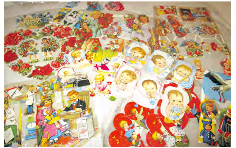
Tak wyglądały klejdy-bejdy. Kto je jeszcze pamięta?

– Pamiętasz jak starsze dziewczyny ze szkoły umawiały się z nami na wymianę? Zawsze zabierały nam najpiękniejsze i największe klejdy-bejdy, dając w zamian te brzydsze i mniejsze? Dziś im to wybaczymy. Albo jaki był dramat, kiedy przylepiona mocnym klejem naklejka nie chciała się oderwać z zeszytu i ulegała zniszczeniu? – śmiała się