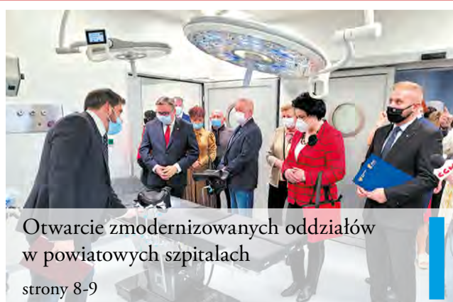
Otwarcie zmodernizowanych oddziałów w powiatowych szpitalach