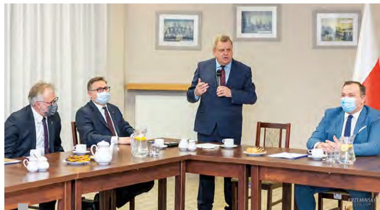
Marszałek województwa śląskiego podczas spotkania z starostą gliwickim i wóldarzami miast i gmin powiatu gliwickiego w Wilczy