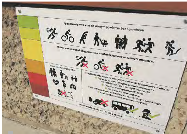
Tablica informacyjna przy Eko-słupku

W marcu na terenie Szkoły Podstawowej w Chechle zamontowany został EKO-SŁUPEK AIR-SENSOR - urządzenie, które za pomocą światła sygnalizuje jakość powietrza, gdzie zieleń oznacza bardzo dobrą jakość powietrza, zaś czerwień – złą. Dzięki technologii Wi-Fi lub Bluetooth każdy będzie mógł się połączyć z AirSensor i sprawdzać stężenie zanieczyszczeń w powietrzu pyłów zawieszonych PM 1, PM 2,5, PM 10 oraz wilgotność i temperaturę powietrza, a także ciśnienie atmosferyczne.