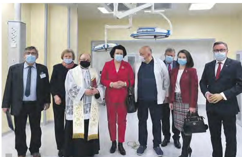
Sal operacyjne w Szpitalu w Pyskowicach już poświęcone!