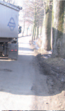
Jeśli szybko nie nastąpi modernizacja DW 907, wkrótce stanie się ona nieprzejezdna.

nie. Jest to tym bardziej niepokojące, że objazdem tym poruszają się pojazdy ciężarowe, do których drogi powiatowe nie są przystosowane. Ulegają one zniszczeniu, a ZDW nie poinformował nas ponadto, jaka instytucja pokryje koszt ich naprawy. Dopiero po naszych monitach i odwołaniu się aż do marszałka województwa otrzymaliśmy wyjaśnienie, że o bieżące utrzymanie (zapewnienie przejezdności) tych dróg dbać będzie Powiat Rybnicki, który ma te zadania w odniesieniu do zamkniętego odcinka drogi wojewódzkiej 919. Mamy również