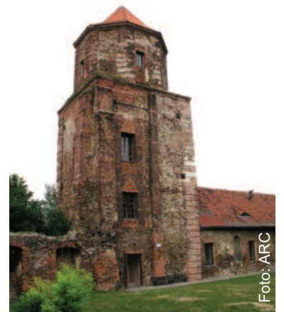
Tę legendę można usłyszeć przy okazji zwiedzania baszty zamkowej w Toszku.

Jak mówią stare przekazy, złotą kaczkę może odnaleźć śmieciek urodzony w niedzielę, jeśli w pierwszy dzień Wielkanocy zejdzie do podziemi