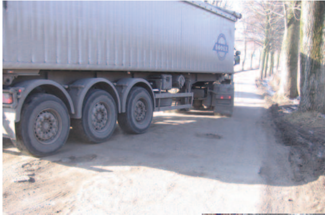
Objazd drogi wojewódzkiej nr 919 w Sośnicowicach wiedzie przez niedostosowane do tego drogi powiatowe.

Kierowcy klną, zbliżając się do DW 919 w Sośnicowicach. W grudniu ub. roku została ona zamknięta w trybie awaryjnym, bo uszkodzenia