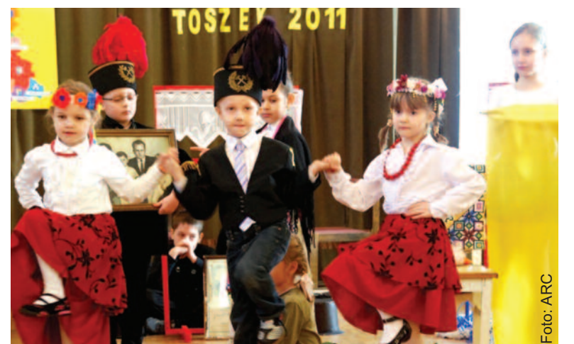
Najmłodszy świetnie się prezentowali w strojach regionalnych.

prezentowały plakat „Chciałbym Cię zaprosić do mojej miejscowości”. Trzecim etapem konkursu była prezentacja legend swojej miejscowości. W przerwach uczestnicy mogli zobaczyć występy m.in. zespołu „Tibiarum Scholares” z Centrum Kultury „Zamek w Toszku” oraz „Silesia-Folk” z Katowic.