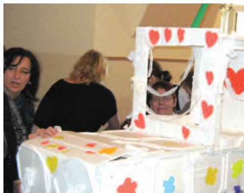
Papa-mobile, zbudowany w „Ostoi”, był pokryty serduszkami i kwiatkami.

społu muzycznego pod jego kierownictwem. Imprezę zorganizowali DPS „Ostoja” oraz ZSS w Pyskowicach, przy finansowym wsparciu Stowarzyszenia na Rzecz Osób z Upośledzeniem Umysłowym „Nadzieja” oraz Zespołu Charytatywnego przy parafii św. Jakuba. Wzięli w niej udział także uczniowie szkół w Barłgówce i Sośnicowicach oraz miesz-