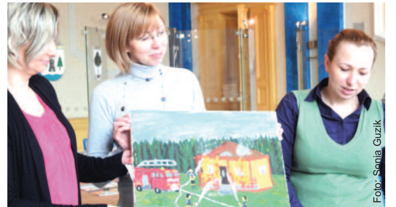
Jedna z licznych prac, nadesłanych na konkurs podczas oceniania przez jury.

Organizatorem konkursu jest komendant główny Państwowej Straży Pożarnej we współpracy z wydziałami bezpieczeństwa i zarządzania kryzysowego urzędów wojewódzkich. (SoG)