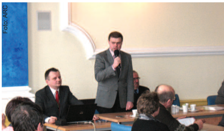
Na spotkaniu w starostwie rolnicy mogli wyjaśnić wszystkie wątpliwości, związane ze składaniem wniosków.

Podobnie jak w roku ubiegłym, rolnicy mogą na jednym formularzu wniosku ubiegać się o przyznanie płatności w ramach systemów wsparcia bezpośredniego, pomocy finansowej z tytułu wspierania gospodarowania na obszarach górskich i innych obszarach o niekorzystnych warunkach gospodarowania (płatność ONW), a także płatności z tytułu realizacji przedsięwzięć rolnośrodowiskowych i poprawy dobrostanu zwierząt (PROW 2004-2006) oraz płatności rolnośrodowiskowej (PROW 2007-2013).