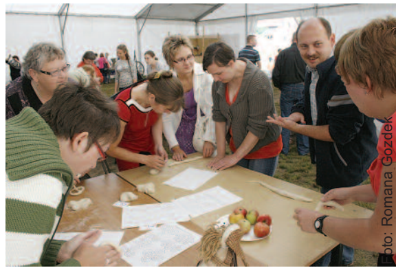
Dużą popularnością cieszyły się warsztaty lepienia z masy plastycznej.

Pod znakiem integracji przebiegała impreza, zorganizowana dla uczestników projektu „Dobry start w samodzielność”, prowadzonego przez Powiatowe Centrum Pomocy Rodzinie w Gliwicach.