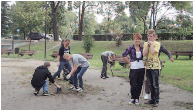
Blisko 6 ton śmieci zebrali uczestnicy akcji „Sprzątamy Powiat Gliwicki”, którzy

w rękawice i worki, zakupione przez Starostwo Powiatowe w Gliwicach.