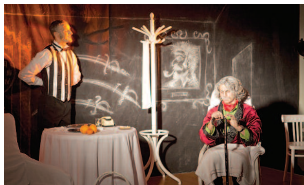
W spółdzielczym klubie Gama w Knurowie 17 września imprezę charytatywną zorganizowała Fundacja „Promyczek”, wspierająca osoby niepełno-

otwartego, działającego przy Gimnazjum nr 15 w Bytomiu.