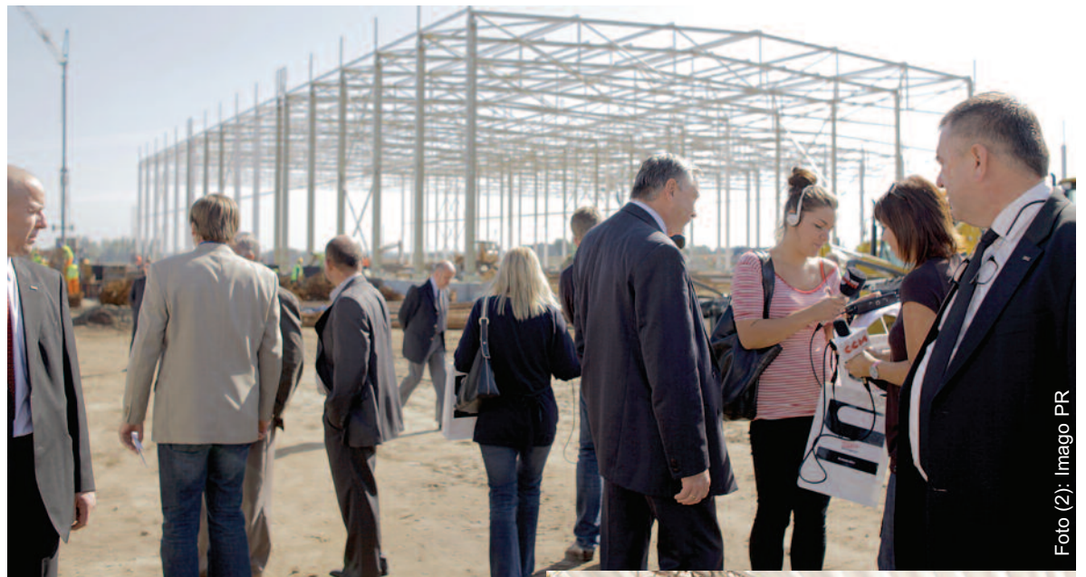
W Synergy Park wyrastają już hale pierwszych firm.

Pierwsze cztery poczynione inwestycje mają wartość 60 mln zł, ale kolejne 7 firm już zapowiedziało chęć inwestowania w tej strefie przemysłowej. Pierwsze kamienie węgielne wmurowały tu następujące przedsię-