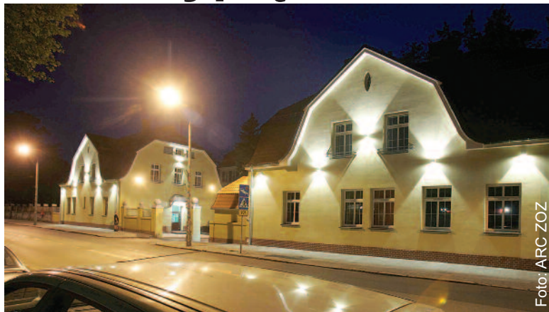
Kompleks zabytkowych budynków szczególnie efektownie prezentuje się w nocnym oświetleniu.

Są to budynki dyrekcji i krwiodawstwa SP ZOZ-u w Knurowie oraz tamtejszego szpitala. Są zabytkowe – pochodzą sprzed stu lat i należał się im już solidny remont. Prace wykonane zostały w ramach zadania pn. „Remont elewacji i zabezpieczenia przeciwwilgociowego ścian budynku dyrekcji i budynku krwiodawstwa oraz remont ogrodenia pomiędzy tymi budynkami”. Obiekty poddane zostały termomodernizacji, wykonano w nich niezbędną izolację przeciwwilgociową, a ostateczny efekt wieńczy iluminacja świetlna, która po zapadnięciu zmroku ukazuje całe piękno tego kompleksu służby zdrowia. Prace objęły także mały budynek portierni, znajdujący się przy tzw. krwio-