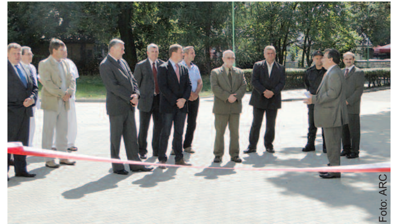
Na chwilę przed otwarciem nowej drogi.

Odbiór inwestycji nastąpił 6 września. W ramach budowy drogi pożarowej zlikwidowano również stare pomieszczenia gospodarcze i wygospodarowano teren na dodatkowy parking.