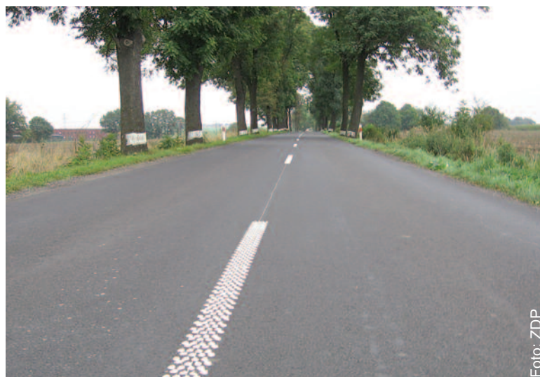
Wyremontowana ulica Gliwicka w Żernicy.

W ostatnim czasie zakończyły się prace remontowe przy ulicach Szpitalnej i 1 Maja w Knurowie, co z pewnością ucieszyło kierowców, którzy korzystają z tych dróg. ZDP realizował tę inwestycję w ramach Programu Inicjatywa Samorządowa, prowadzonego przez Starostwo Powiatowe w Gliwicach, a mającego na celu wspólne finansowanie przez powiat i gminy wykonywanych prac. W tym przypadku połowę kosztów pokrył Powiat Gliwicki, a połowę – Miasto Knurów.