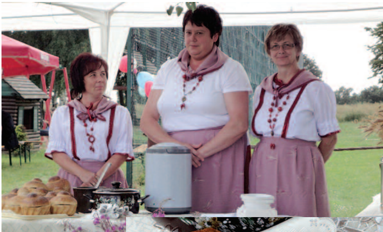
Zwycięska drużyna z Łączy.

Gotujemy wywar na kościach wędzonych wraz z przyprawami. Następnie precedzamy wywar i zalewamy zakwasem. Dodajemy przesmażony boczek z kiełbasą i cebulką oraz ugo-