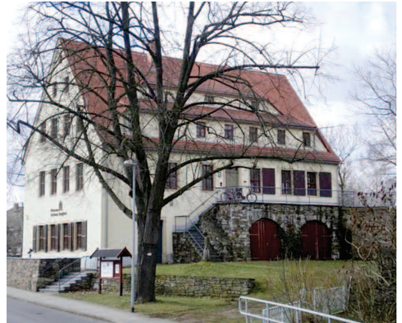
Budynek Muzeum w Brand-Erbisdorf.