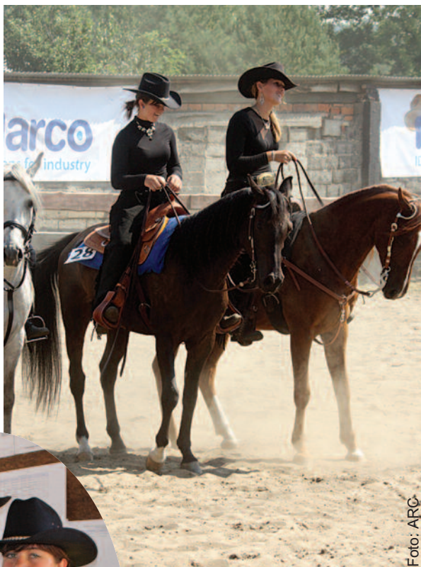
Młode zawodniczki z Bargłówny wyglądają niczym dziewczęta z Dzikiego Zachodu.