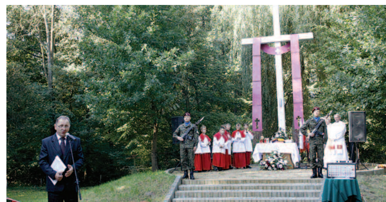
Krzyż na leśnej polanie przypomina o zbrodni, która zyskała miano Śląskiego Katynia.