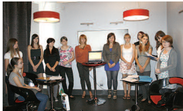
Stowarzyszenie Cztery Pory Roku z Knurowa podsumowało projekt „z NGO na TY”, współfinansowany przez Powiat Gliwicki. Wolontariusz-

cy są podręcznik na ten temat oraz baza danych organizacji, które znaleźć można m.in. na stronie www.powiatgliwicki.pl w zakładce PCOP.