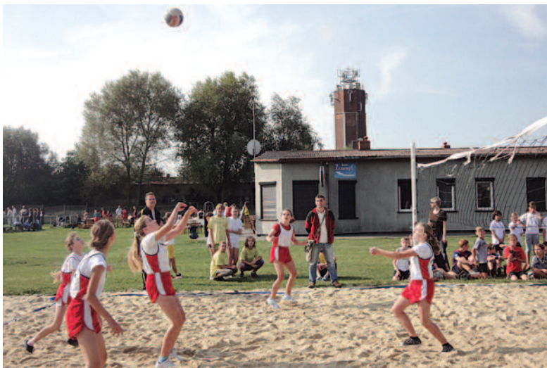
Podczas meczu piłki siatkowej.

- Jestem szczęśliwa, że co roku jest coraz więcej uczestników, współorganizatorów i wolontariuszy naszej im-