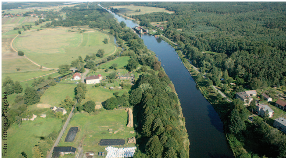
Kanał Gliwicki jest niedocenianą drogą wodną.