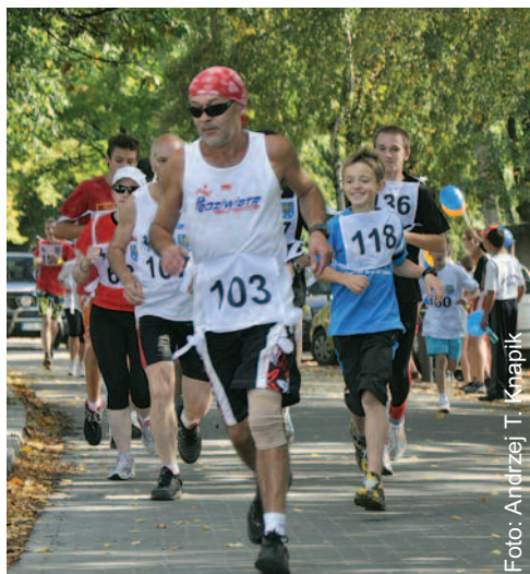
Bieg prowadził ulicami wokół stadionu LKS Victoria Pilchowice.