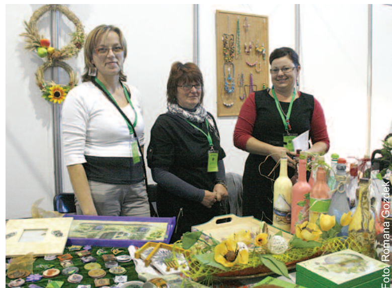
Na stoisku rękodziela artystycznego swe prace sprzedawały mieszkanki Rudzińca.

Warto było odwiedzić XVI Kiermasz Żywności Ekologicznej i Tradycyjnej „Natura, zdrowie, kultura”, zorganizowany w Gliwicach w hali Ośrodka Sportu Politechniki Śląskiej 24 września.