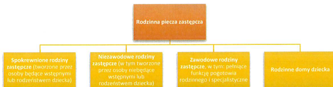
Rysunek 1. Model rodzinnej pieczy zastępczej oparty na ustawie z dnia 9 czerwca 2011 r. o wspieraniu rodziny i systemie pieczy zastępczej.